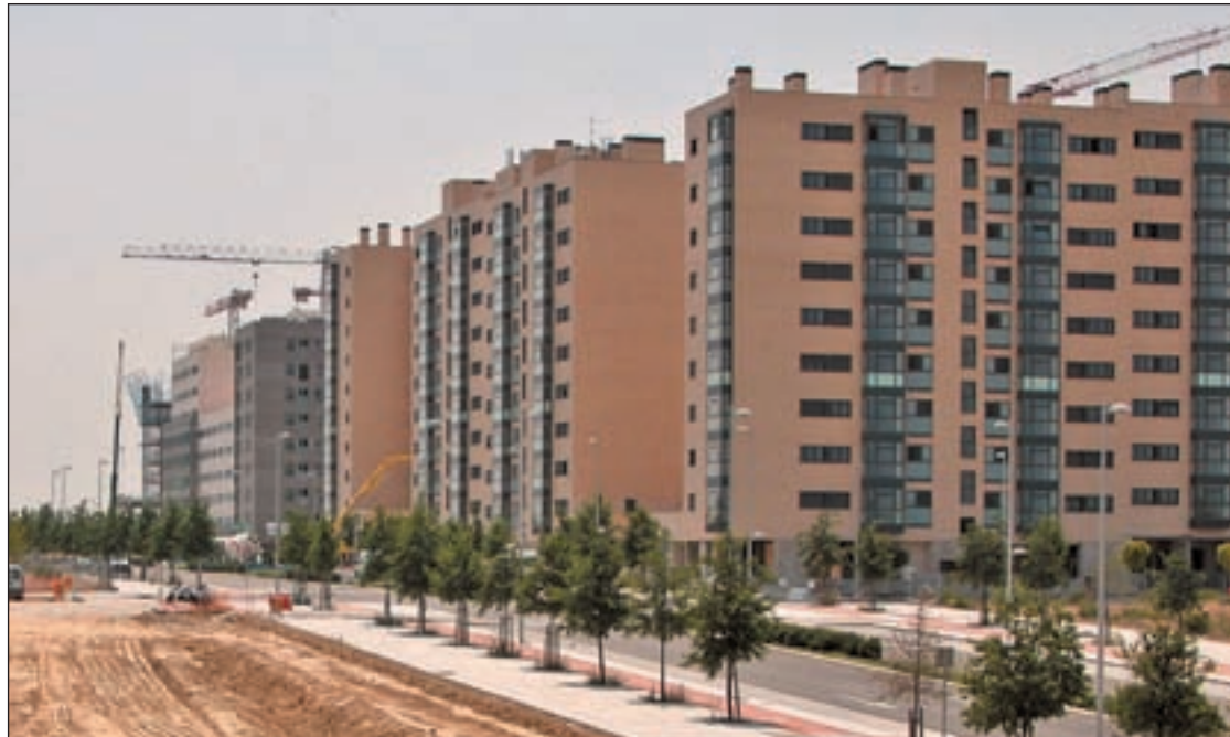
La guía soluciona los interrogantes de cómo acceder a un préstamo hipotecario

“Un préstamo es un producto bancario que permite al cliente (que en términos mercantiles se denomina «prestatario») recibir una determinada cantidad de dinero (el denominado «capital» o «principal del préstamo») de una entidad (el prestamista), con el compromiso de devolver dicha cantidad y los intereses corres-