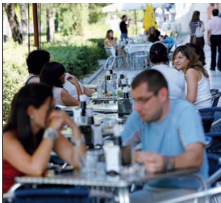
Habrán facilidades para instalar terrazas de más de 100 metros

La nueva normativa excluye a las terrazas en suelo privado de uso privado, situadas en el interior de centros comerciales, azoteas u otros espacios, que se regularán por la normativa urbanística. Este nuevo marco legal amplía el tipo de establecimientos que podrán instalar terrazas recogiendo, entre otros, los hoteles y aquellos con una actividad de hostelería como uso asociado, como teatros, academias, tiendas, museos o gimnasios. Otra novedad con