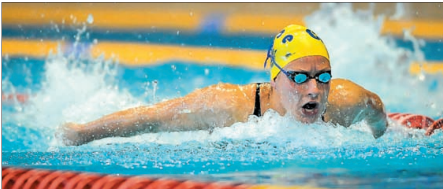
La madrileña ya logró meterse en la final del último campeonato de Europa JULIÁN BLÁZQUEZ