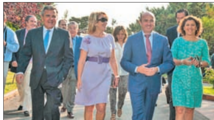
De Foxá, Aguirre y De Guindos a su llegada al Foro de Madrid

En concreto, en el 42 por ciento de los casos la primera asistencia la realizan los servicios de urgencia; en el 30 por ciento, un hospital con angioplastia primaria; un 16 por ciento van a otros centros hospitalarios y el otro 12 por ciento se dirigen a Atención Primaria. Y, aunque todos los centros pueden atender a estos pacientes de manera inicial, se recomienda que se llame al 112.