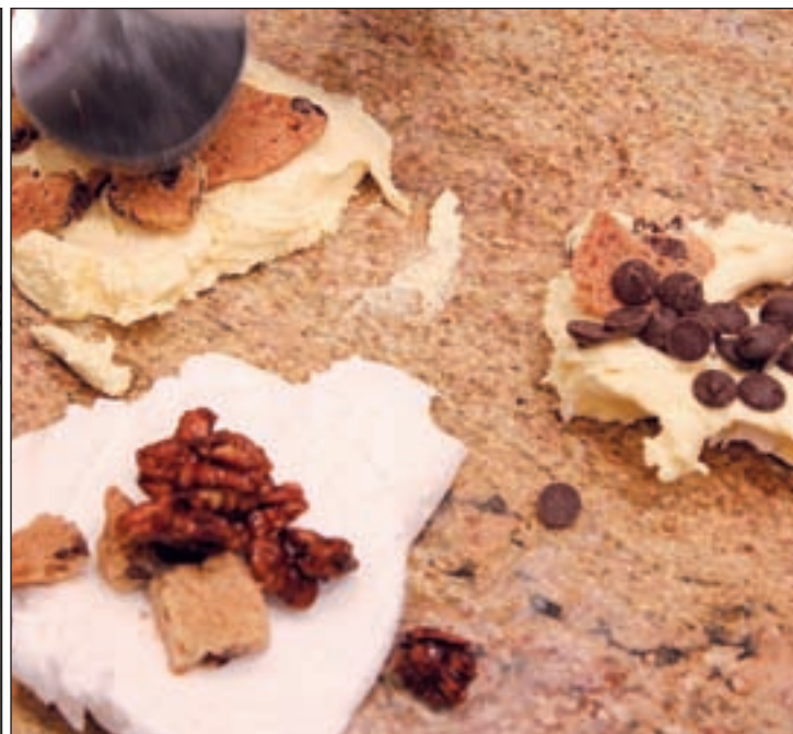
Los helados de crema se realizan con leche fresca del día