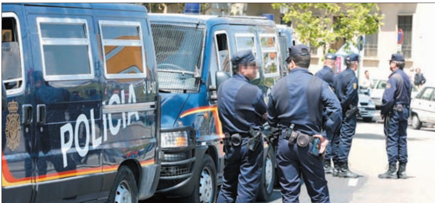
Los diferentes dispositivos policiales actuarán contra la delincuencia en las zonas más turísticas