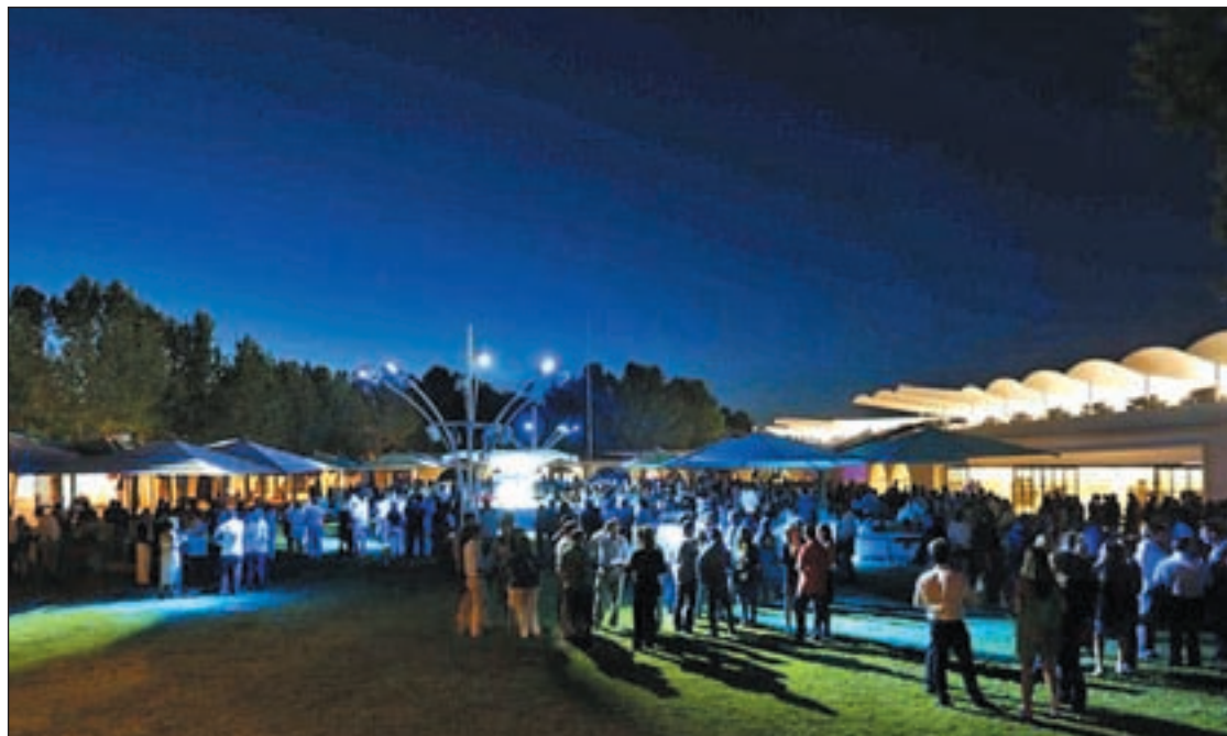
Terraza del Hipódromo de la Zarzuela