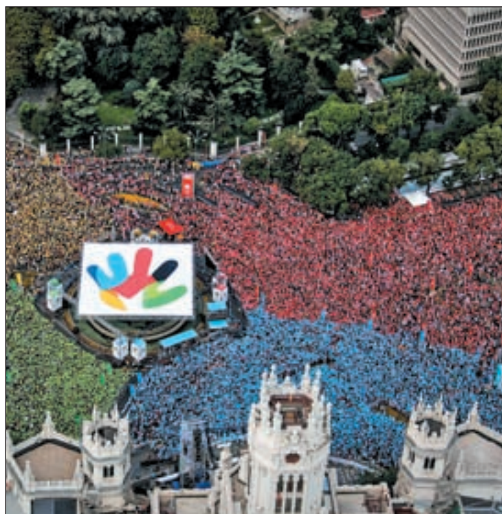
Mosaico humano organizado en 2009 en Cibeles con Madrid 2016

Al menos esto es lo que se extrae de las sensaciones transmitidas en la última gran cita de Madrid 2020 en Lausana, la presentación de la candidatura que contó con la presencia del Príncipe de Asturias y que tuvo lugar la primera semana de julio.