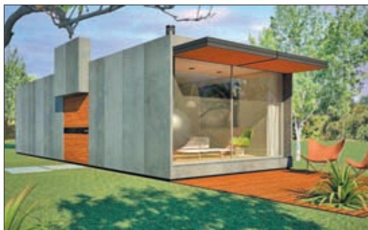
Eurocasa, nuevo concepto de construcción con calidad y moderno

Eurocasa aplica a la construcción los mismos procedimientos de estandarización, modulación, tecnología, verificación y control de calidad que se emplean en los procesos industriales, garantizando un óptimo acabado gracias a mano de obra cualificada y alta carga de diseño, consiguiendo excelente relación calidad-precio.