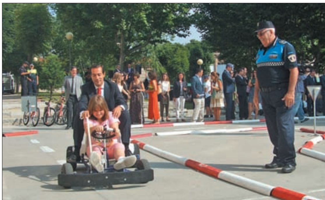
Victoria con una niña que aprende a conducir

Además de conocer la labor de la policía, aquí aprenden a respetar las señales viarias, así como a saber cuándo se puede cruzar o