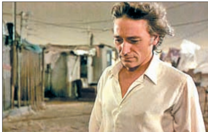
El bailar de flamenco, Antonio Gades

La Fundación Antonio Gades es una institución privada, sin áni-