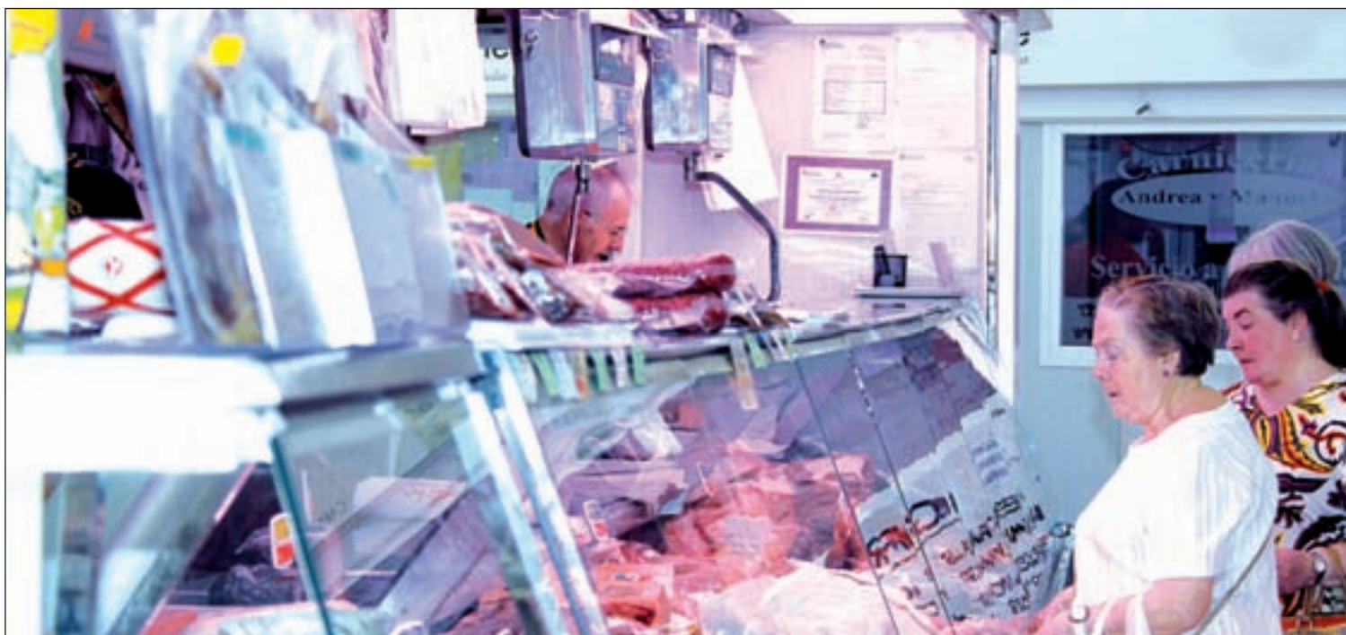
RAFA HERRERO / GENTE

Núñez avanza que éste podría ser "el talismán" los próximos 6 y 7 de septiembre para demostrar que "a la tercera va la vencida".