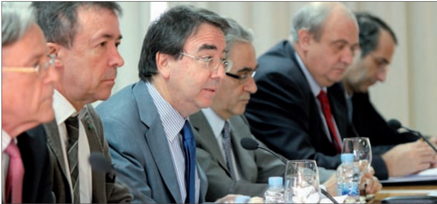
Los rectores de las seis universidades madrileñas