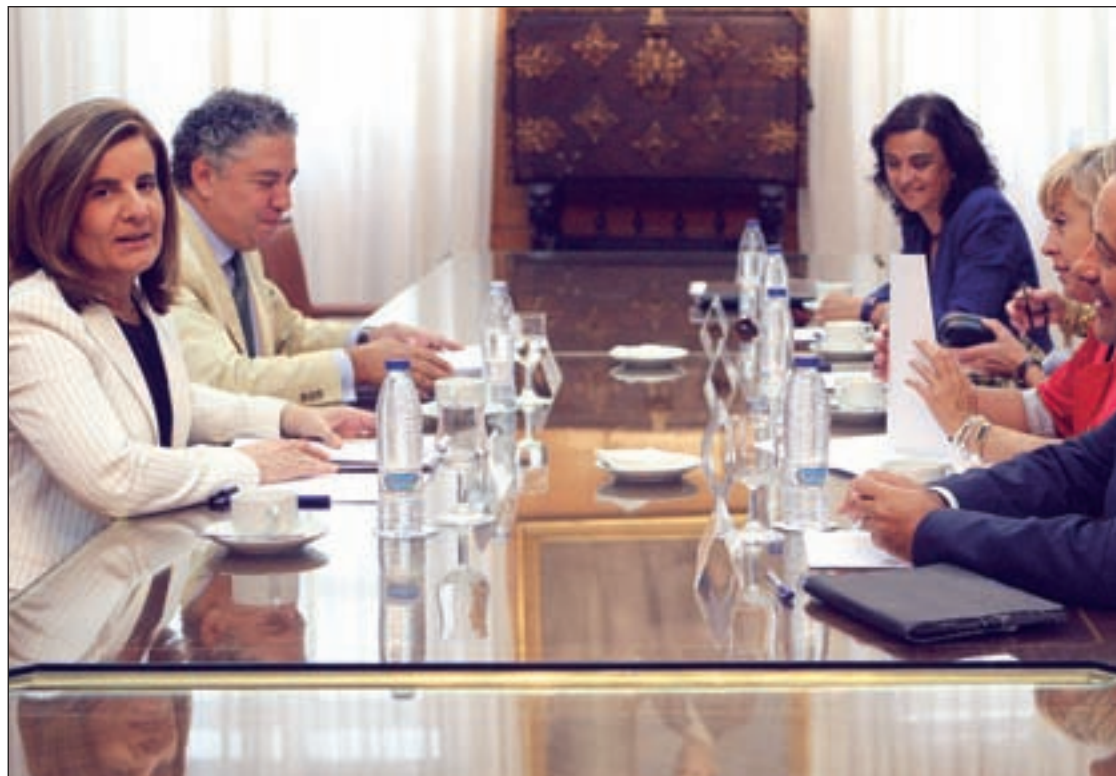
La ministra de Empleo, Fátima Báñez, durante su reunión con los sindicatos

En cuanto al factor de sostenibilidad, el que vincula el cómputo