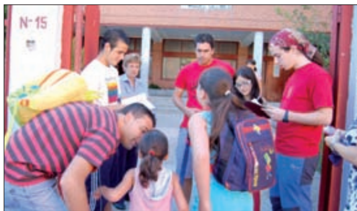
Niños entran en un centro educativo

El material escolar supondrá 50 euros en los colegios públicos, 100 en los concertados y 130 en los privados. Por su parte, la comida no experimentará incrementos situándose el coste en 150 euros en un centro privado, mien-