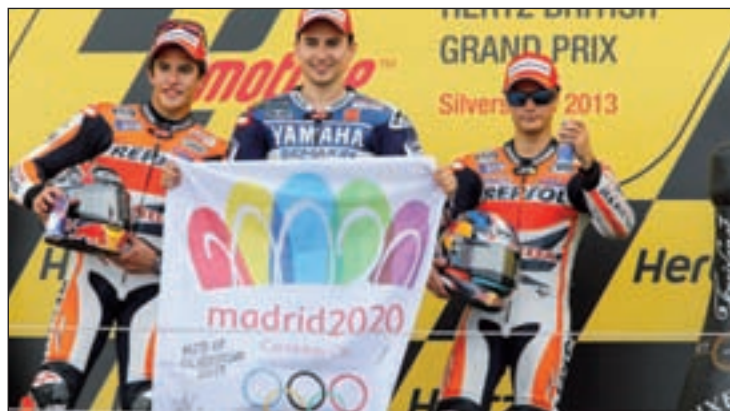
GRAN APOYO Deportistas como Iker Casillas, Lorenzo, Márquez y Pedrosa y personajes conocidos de nuestro país como Julio Iglesias o Alejandro Sanz han mostrado públicamente su apoyo a la candidatura de Madrid 2020.