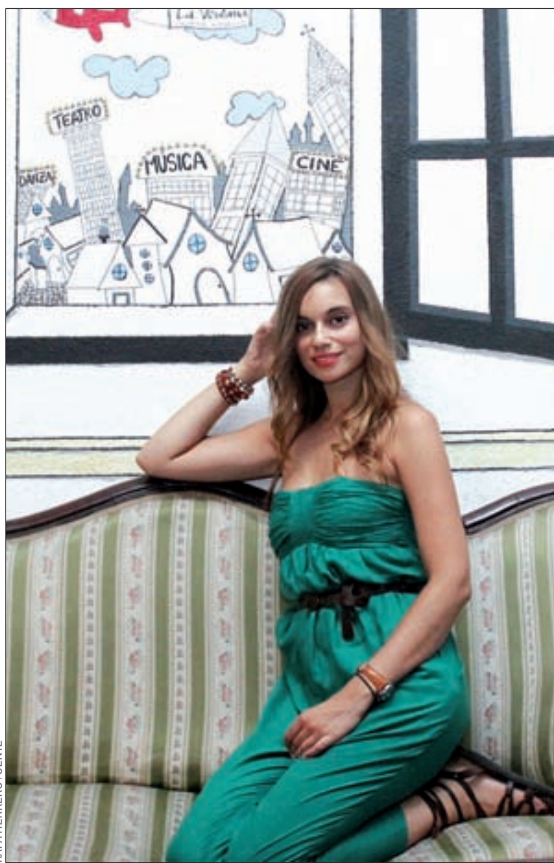
RAFA HERRERO / GENTE

Llevo bailando y cantando toda mi vida y la verdad es que me siento muy cómoda. Lo difícil es conseguir bailar y cantar como el personaje.