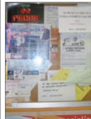
Carteles en una universidad

Las provincias de Madrid, Barcelona y Sevilla acumulan el 52,26% de todos los pisos compartidos del país. Además, el informe subraya que el equipamiento de los pisos compartidos es bastante completo, ya que la mayoría incluyen lavadora, televisión e internet.