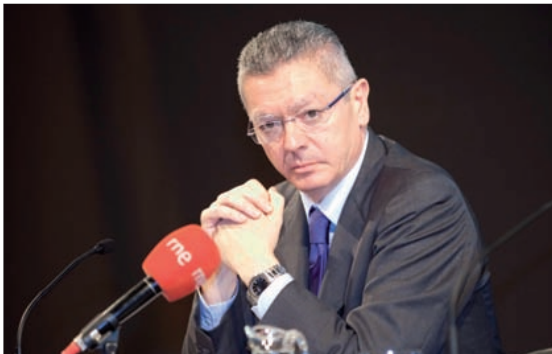
Alberto Ruiz Gallardón, ministro de Justicia

También se espera que se impida la interrupción del embarazo a jóvenes de 16 años sin conocimiento paterno, ya que fue uno