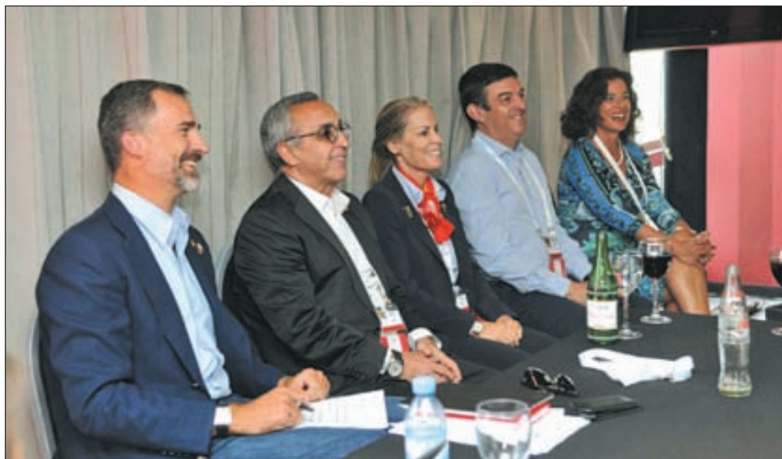
El Príncipe Felipe llegó el lunes a Buenos Aires "entusiasmado" por formar parte de la candidatura

Otros 17 deportistas han viajado con la comitiva olímpica a Buenos Aires para mostrar su to-