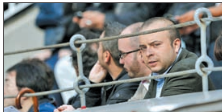
Ángel Carromero, vicesecretario general de Nuevas Generaciones

están penados en el ordenamiento español "con análoga entidad" y se refiere también "a los propios antecedentes administrativos relativos a la comisión de infracciones relacionadas con la seguridad vial, y que han conllevado la pérdida de la autorización administrativa para conducir".