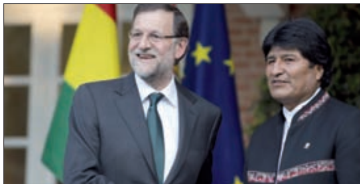
El presidente del Gobierno recibió a Evo Morales este martes

El presidente boliviano, Evo Morales, aseguró que da por finalizada la crisis diplomática con España y subrayó que no guarda “rencor ni resentimiento” hacia este país. Morales se reunió este martes con el rey y con el presidente del Gobierno, Mariano Rajoy.