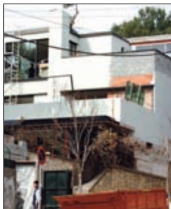
Palacete de Pedralbes

En concreto, según un informe de la Agencia Tributaria, sendos ingresos se produjeron el 30 de julio y el 29 de septiembre de ese año, en forma de transferencias “urgentes” ordenadas por “S