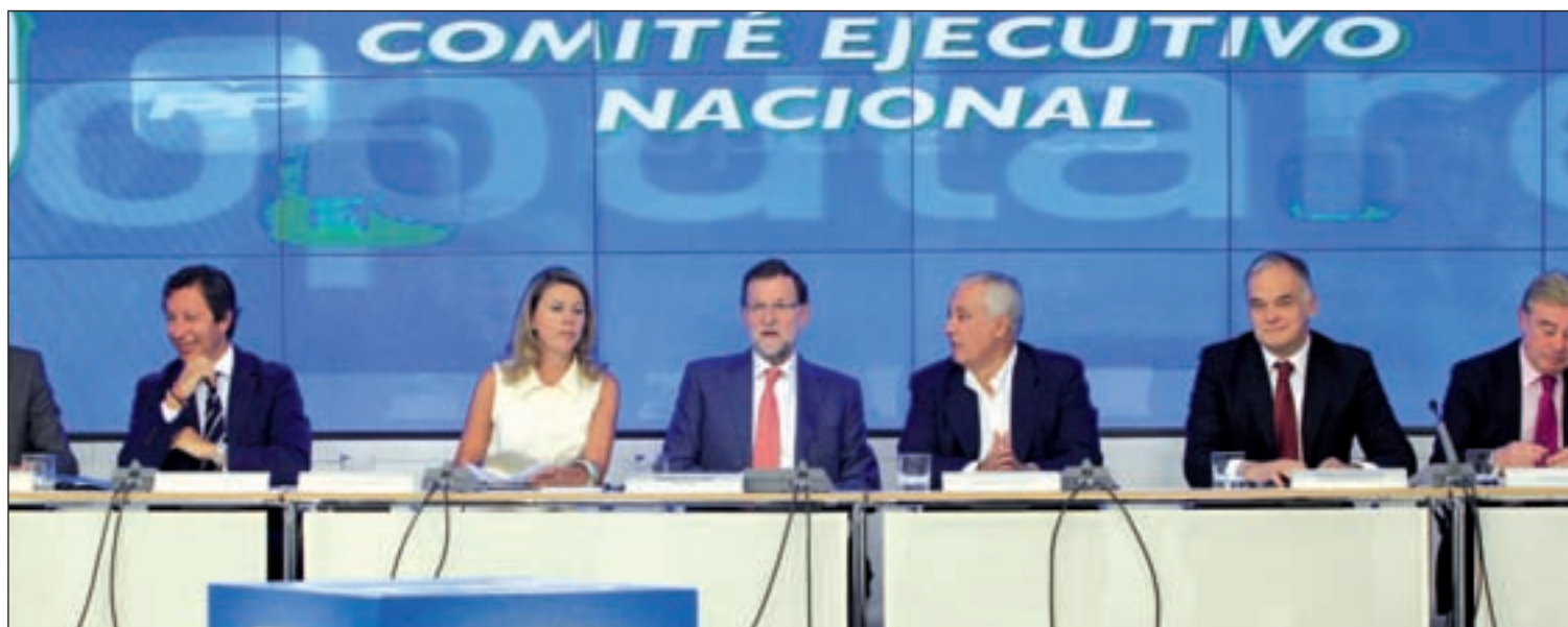
El presidente del Gobierno, Mariano Rajoy, en el Comité Ejecutivo Nacional del Partido Popular el lunes