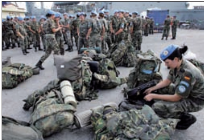
Tropas españolas embarcando hacia Líbano

CONFLICTO REPRESALIAS POR EL ATAQUE QUÍMICO