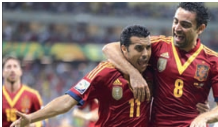
Partido clave para los hombres de Del Bosque

Un buen ejemplo es el del combinado español. El triunfo obtenido el pasado mes de marzo en Saint-Denis ha aliviado la situación del equipo de Vicente Del