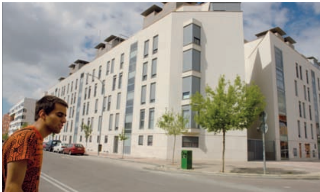
El importe medio de las hipotecas baja un 1%

Además, el BBVA recalca que “el buen tono” de la compra de viviendas por parte de extranjeros y el atractivo que comienza a tener algún segmento del mercado para los inversores, junto con la debilidad interna, “podrían explicar el aumento de la brecha entre hipotecas y transacciones”. Aún así, el estudio destaca que “la