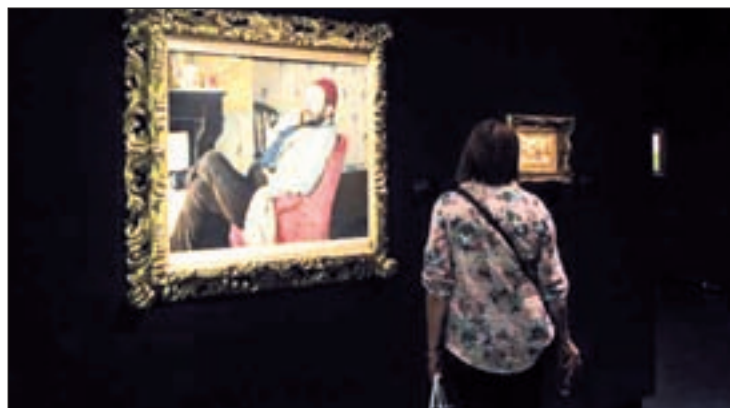
Una de las obras de la exposición

Se trata de una selección del realismo impresionista italiano compuesta por obras de Giovanni Fattori, Silvestro Lega, Telemaco Signori o Giovanni Boldini.