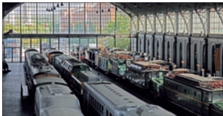
Museo del Ferrocarril, en el Paseo de las Delicias