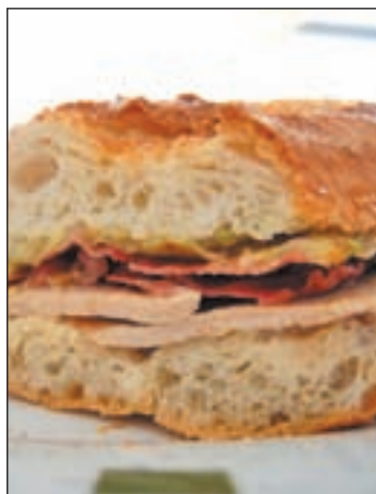
El bocadillo, una solución

En ese sentido, Uriol recomienda también eliminar todos los fritos, empanados y helados; y sustituirlos por alimentos más saludables y libres de grasas, co-