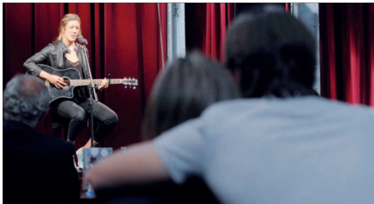
El FESTeen se celebrará en el Matadero de Madrid del 13 al 15 de septiembre

La banda británica llega a la capital para presentar 'Cave Rave', su segundo LP, que ya ha sonado en directo en nuestro país.