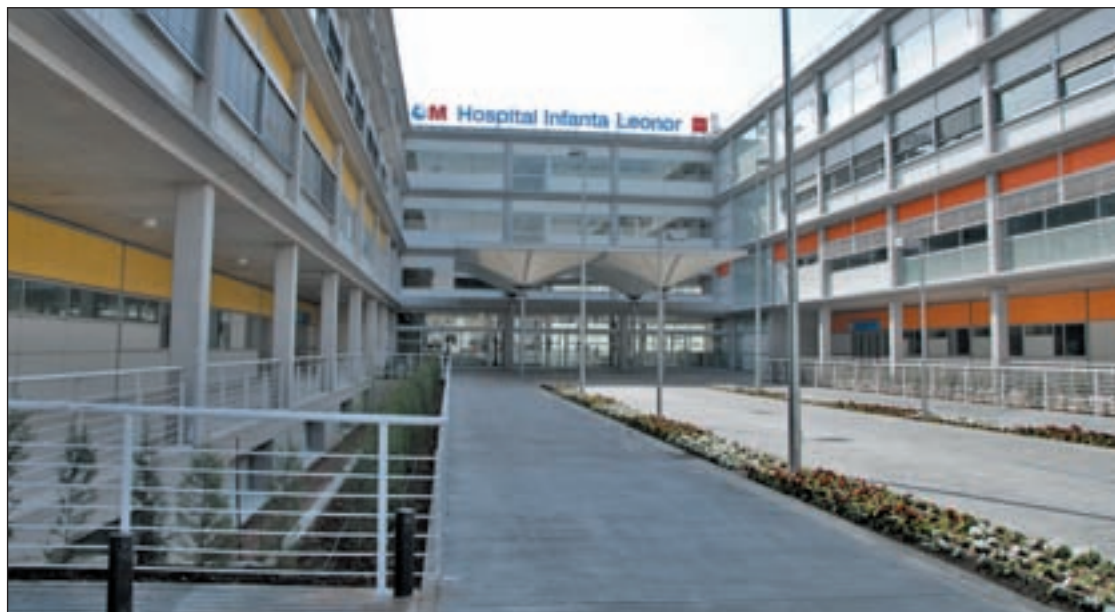
El Hospital Infanta Leonor es uno de los seis que pasarían a tener gestión privada