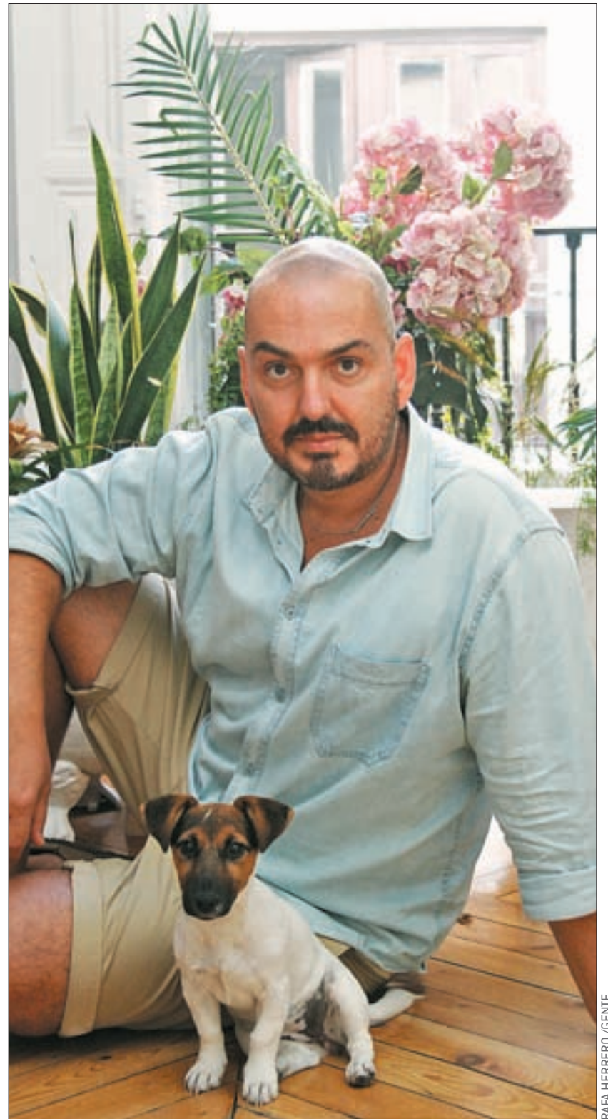
RAFA HERRERO / GENTE

Cuando acabe el viernes el desfile, ¿qué harás?, ¿qué planes tienes?