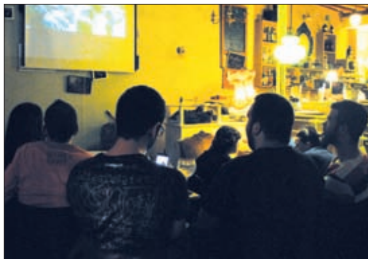
PELÍCULAS COMO 'EN LA CUERDA FLOJA' (2005), 'biopic' del cantante de country Johnny Cash, y otras vinculadas a la música, suelen formar parte de la pseudo cartelera elaborada por La Paca Café Bar.