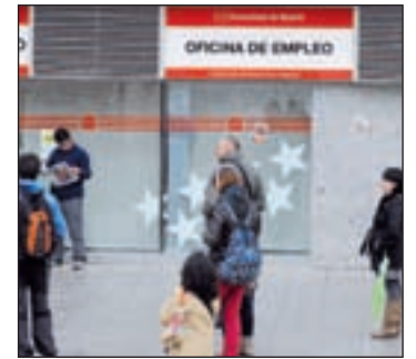
Oficina del INEM

resto de distritos, Puente de Vallecas (25.765) y Carabanchel (23.052) son los que cuentan con más parados. En el lado contrario se encuentra Barajas (2.861).