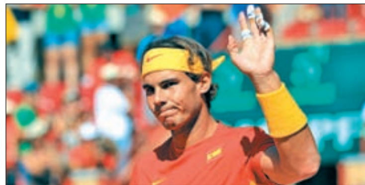
Nadal, la gran atracción de esta eliminatoria

acumulado por tantos partidos y el viaje consiguiente hacen que su concurso quede entre interrogantes. Al margen de Nadal, Corretja también ha citado a Fernando Verdasco, Tommy Robredo y Marc López. El primer choque de la eliminatoria arranca este viernes a las 14 horas.