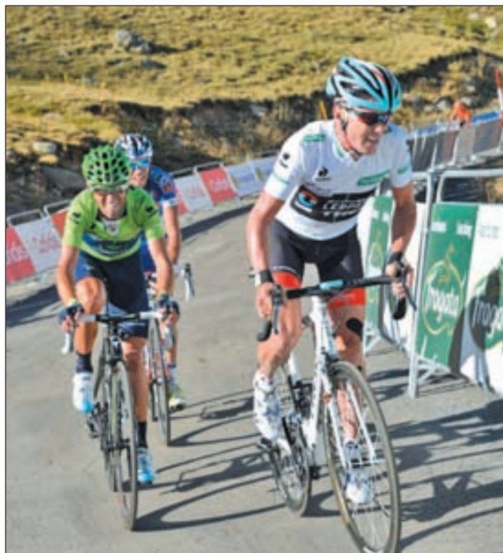
Horner y Valverde, dos de los grandes animadores de esta edición

atravesar diversas calles de Leganés, el pelotón se dirigirá hacia Fuenlabrada, donde se espera que lleguen en torno a las 14:41. Pinto será la próxima parada para unos ciclistas que recorrerán el Paseo de las Artes, y las calles Cataluña y Cigüeñas, antes de dirigirse a San Martín de la Vega. Desde allí pondrán rumbo hacia Madrid por la carretera A-3, una vía que les introducirá en la capital de España, donde abordarán el clásico circuito urbano. En él están incluidas la Plaza de Colón, la calle Alcalá, Gran Vía, Plaza Callao, Paseo Cánovas, Glorieta del Emperador Carlos V, Paseo del