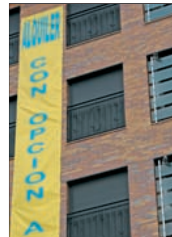
Viviendas en alquiler

El Consejo de Gobierno destinará más de un millón para los años 2013 y 2014 para garantizar el seguro por impago de rentas y otro millón de euros para la gestión de la iniciativa.