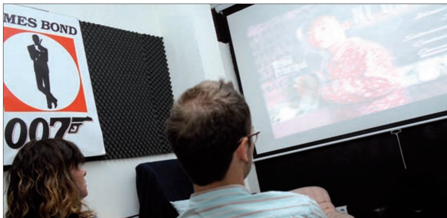
En este acogedor habitáculo decorado con carteles cinematográficos se desarrollan todas las sesiones de Café Kino