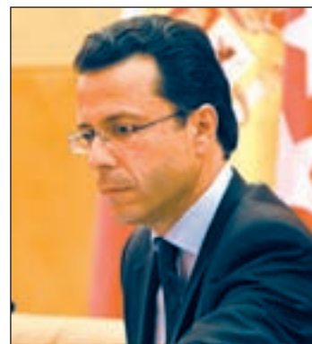
Fernández-Lasquetty R. H./GENTE

Comunidad es introducir progresivamente este cambio de modelo de gestión en cuatro centros hasta llegar a un total de 27, siendo esta la respuesta a una reivindicación histórica de los profesionales de los centros, que pedían ser partícipes de la gestión de los mismos.