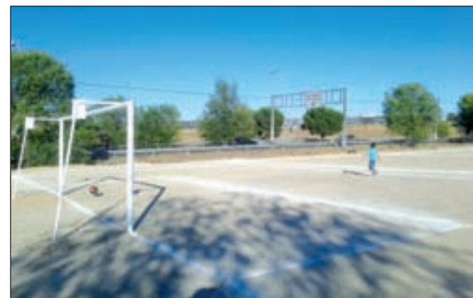
Parcela municipal que albergará la instalación en Villaverde

Por último, los mayores tendrán su espacio en una baile especial programado para el día 18 en el Centro Dotacional.