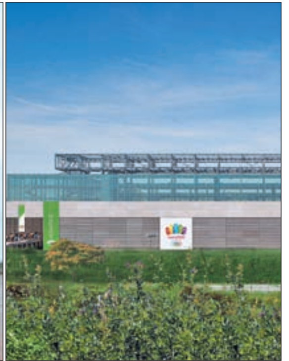
DOS OBRAS QUE SEGUIRÁN ADELANTE EN MADRID A pesar de que no se han conseguido los Juegos Olímpicos del 2020, la capital se beneficiará de ellos ya que contará con dos equipamientos deportivos más que se estaban construyendo para ese evento como el estadio de 'La Peineta' y el Complejo Acuático, ambos en San Blas