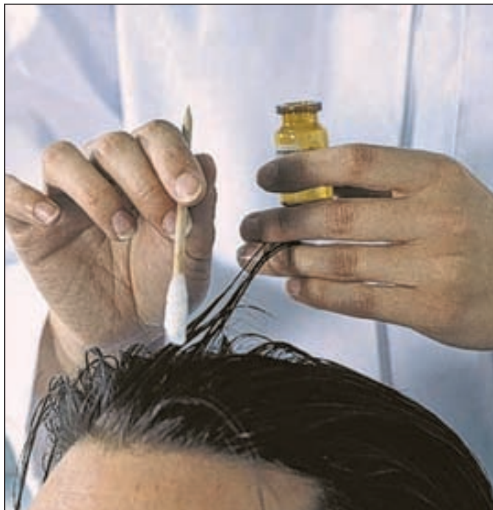
Un examen capilar permite conocer mejor el cabello

El primero se trata de un buen cepillado a contrapelo. Esto permite activar el riego sanguíneo. Después, se aplica la 'Crema Regeneradora', que según señala esta experta con más de 28 años en el ámbito capilar, "aportará humedad y brillo al cabello".