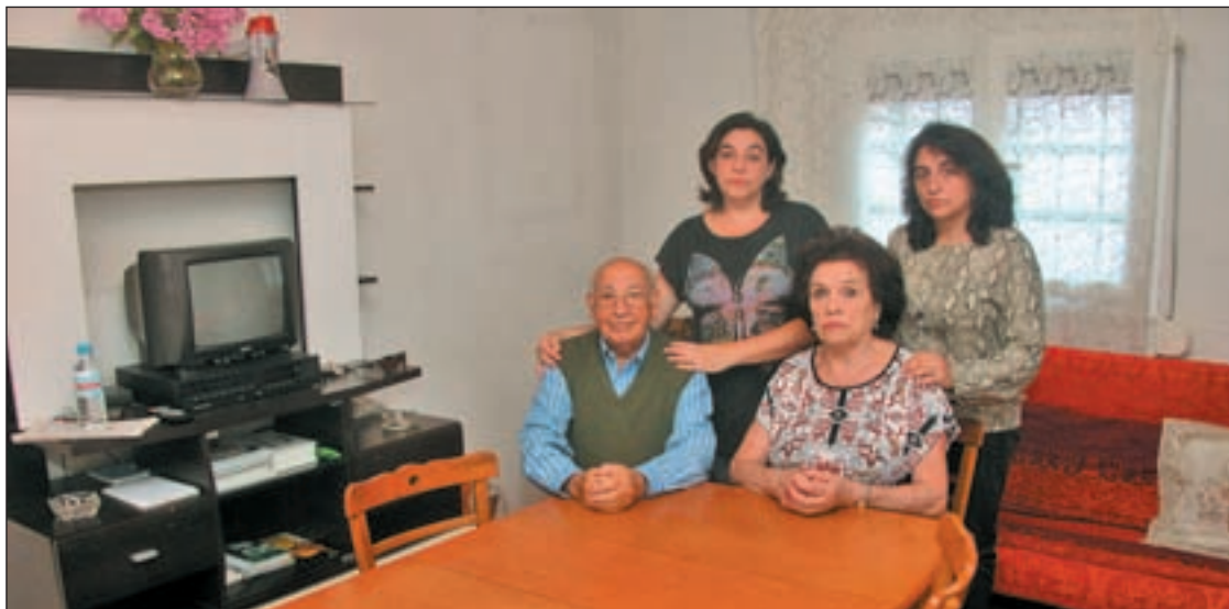
CHEMA MARTINEZ / GENTE

Sólo se terminarán las instalaciones iniciadas, como 'La Peineta' PÁGS. 2-3