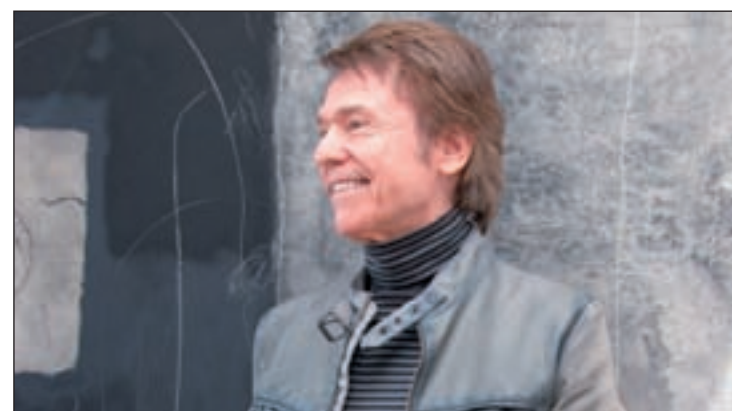
El cantante Raphael, en la entrevista a GENTE

aquel', 'Digan lo que digan' o 'Balada de trompeta'. "Tengo pasión con mi profesión y entonces para mí todo esto es muy bonito", confesaba el cantante madrileño al periódico. Durante el concierto sonarán algunas de las canciones que ha incluido en su último disco 'Mi gran noche'. "He regrabado muchas cosas de las que yo estoy muy orgulloso pero que están en la sombra", contaba entonces de lo que era su último disco en el mercado musical.