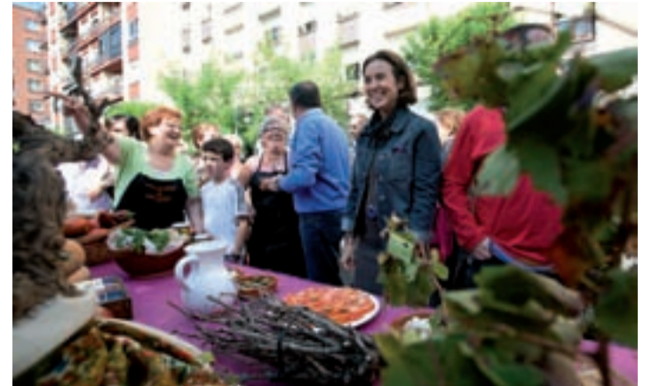
Éxito de participación en las Calderetas, con ochenta grupos.