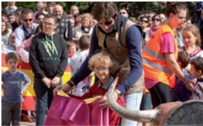
Juan José Padilla dio una clase magistral de toreo.