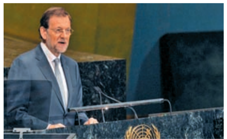
El presidente del Gobierno, Mariano Rajoy, intervino en la ONU

La intervención de Rajoy ante la ONU coincide con una visita de los inspectores de la Comisión Europea a la zona, donde analizaron, además de los