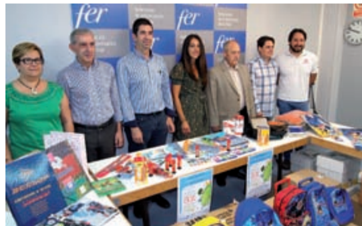
Entrega de material escolar al presidente de Cáritas.