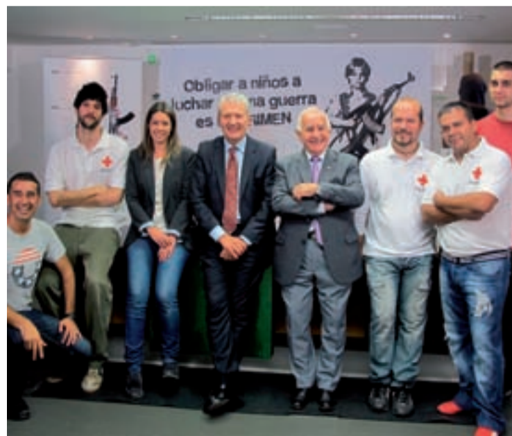
Presentación de la iniciativa en el Instituto Riojano de la Juventud.

Es muy importante sensibilizar a los jóvenes para la defensa de los derechos de estos niños y niñas