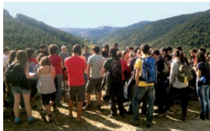
Visita de los alumnos de la Escuela de Ingenieros de Montes.