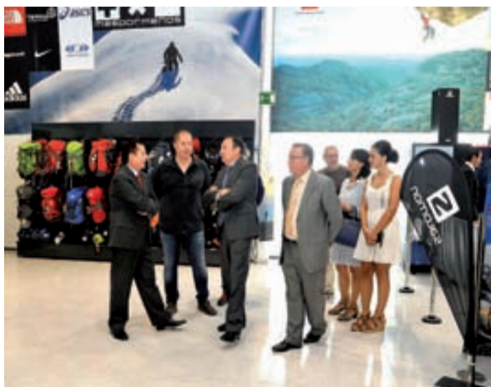
Inauguración del establecimiento.

La empresa 'Más por Menos' cuenta con otros tres establecimientos en Arnedo especializados en ropa de deporte y montaña, en moda joven y de calzado, que