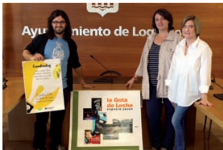
Presentación de la programación en rueda de prensa.

El apartado informático incluye novedades. Se organizarán talleres