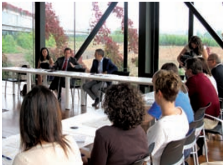
Reunión de los orientadores laborales.

Estas entidades son organizaciones y asociaciones sin ánimo de lucro que forman parte de la Red de Empleo en la prestación