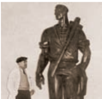
Monumento al Labrador.