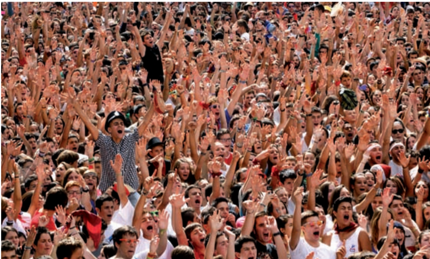
La Plaza del Ayuntamiento albergó uno de los disparos de cohete más largo y animado que se recuerda.

Los fuegos artificiales, de calidad extraordinaria, concentran a más de 100.000 espectadores