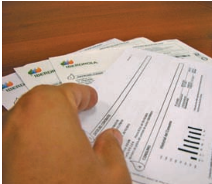
La factura de la luz se ha encarecido un 11% desde enero de 2012