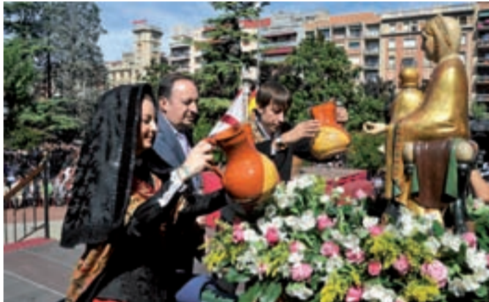
Ofrenda del Primer Mosto a la Virgen de Valvanera.

El día de San Mateo, en el acto Institucional del Pisado de la Uva y Ofrenda del Primer Mosto a la Virgen de Valvanera en el Paseo del Espolón, Pedro Sanz, presidente de La Rioja, animó a los riojanos a redoblar esfuerzos para "afrentar con decisión la senda de la recuperación que ya hemos iniciado" ante una gran afluencia de público.