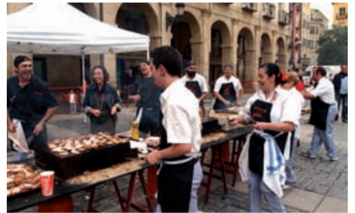
La Semana Gastronómica tuvo mucha participación ciudadana.