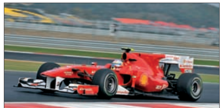
El español busca su cuarto podio consecutivo

cudería italiana creen que es muy complicado mejorar el monoplaza actual, por lo que Alonso deberá recurrir a sus mejores prestaciones para intentar acabar con el reinado de Vettel en Yeongam (ha ganado allí las dos últimas carreras), en una carrera que se celebrará a las 8 de la mañana.