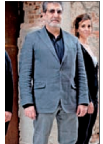
Elenco de ‘Las palabras’