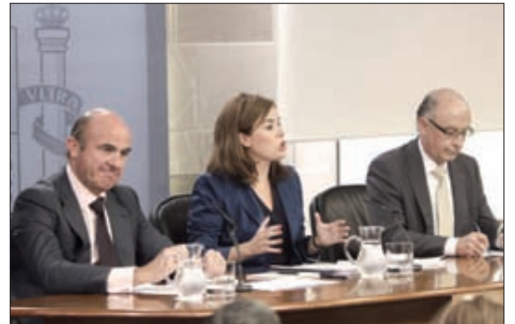
Rueda de prensa tras el Consejo en el que se aprobó la ley

Las entidades locales recibirán un total de 16.124,24 millones, un 0,1% menos que en 2013.