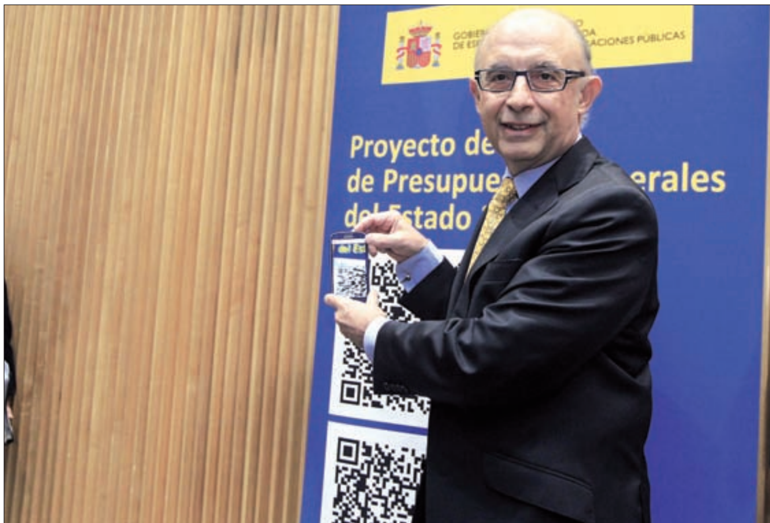
El ministro de Hacienda, Cristóbal Montoro, entregó los presupuestos en el Congreso

nes). Las becas generales y la inversión en I+D+i se incrementan, aunque descienden la inversión pública en infraestructuras y la aportación a la Casa del Rey. PÁGS. 2 Y 3