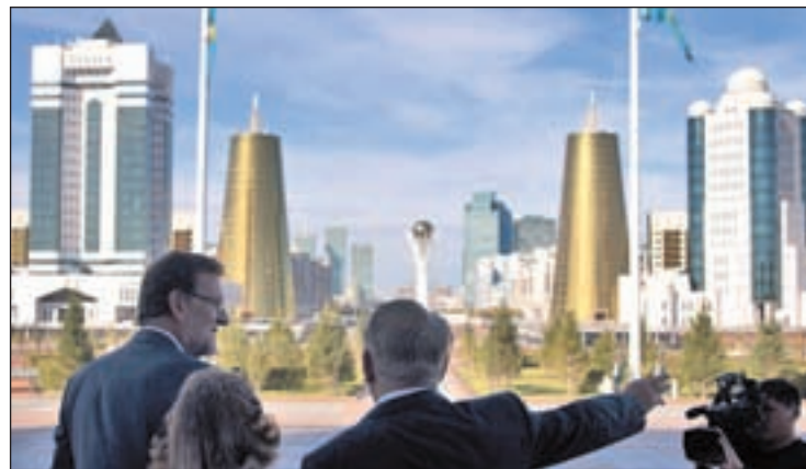
El presidente del Gobierno durante su visita a Kazajistán

Kazajistán es uno de los cinco mayores productores de gas del mundo y posee en torno al tres por ciento de las reservas mundiales de petróleo. En la última década ha tenido un crecimiento anual de en torno a un 8 por ciento, lo que ha provocado que las