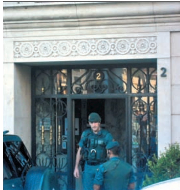
Sede de Herrera en Bilbao

La propia Herrera denunció que la intención del Estado es