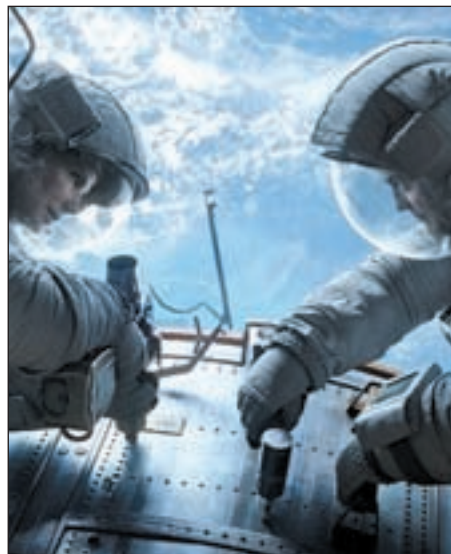
Clooney y Bullock en 'Gravity'

“Es la mejor película que se ha hecho sobre el espacio”. Son las palabras del director James Cameron sobre lo último de Alfonso Cuarón, 'Gravity'. Este viernes llega a las carteleras españolas precedida por su gran éxito en el Festival de San Sebastián. Toda una sala de cine se quedó en silencio durante unos segundos después de que el último fotograma desapareciera de la pantalla. Acto seguido: una gran ovación inundaba el espacio. Pero no era el de San Sebastián el único festival donde 'Gravity' recibía tal acogida. El pasado agosto, la película abrió entre aplausos la 70 edición de la Mostra Venecia. La razón de este recibimiento es la magia con la que Cuarón muestra imágenes del espacio durante más de 90 minutos. Para este proyecto, que ha tardado cuatro años y medio en