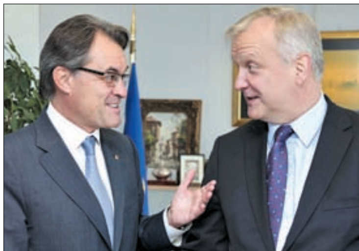
Artur Mas se reunió con Olli Rehn en Bruselas

Mas descartó volver a intentar reunirse con el presidente de la Comisión, José Manuel Durao Ba-