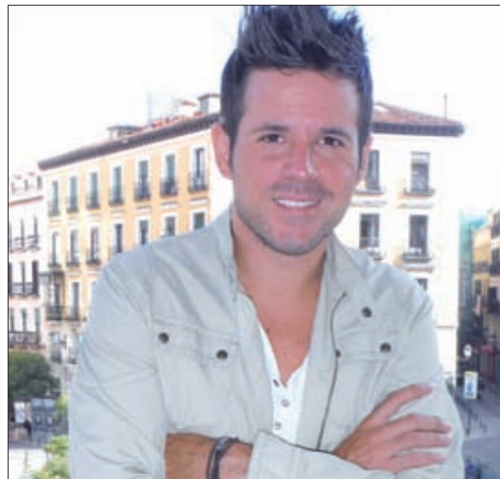
El cantante se pondrá a prueba en la Sala Caracol

A pesar de que yo tenía claro, desde que tenía uso de razón que me quería dedicar a esto, no sabía ni cómo hacerlo ni cómo funcionaba la profesión de música. La gente siempre dice que vivir de la música es imposible, pero yo lo vi claro cuando me llegó mi primer trabajo como pianista contratado. De ahí comenzaron a llegar más