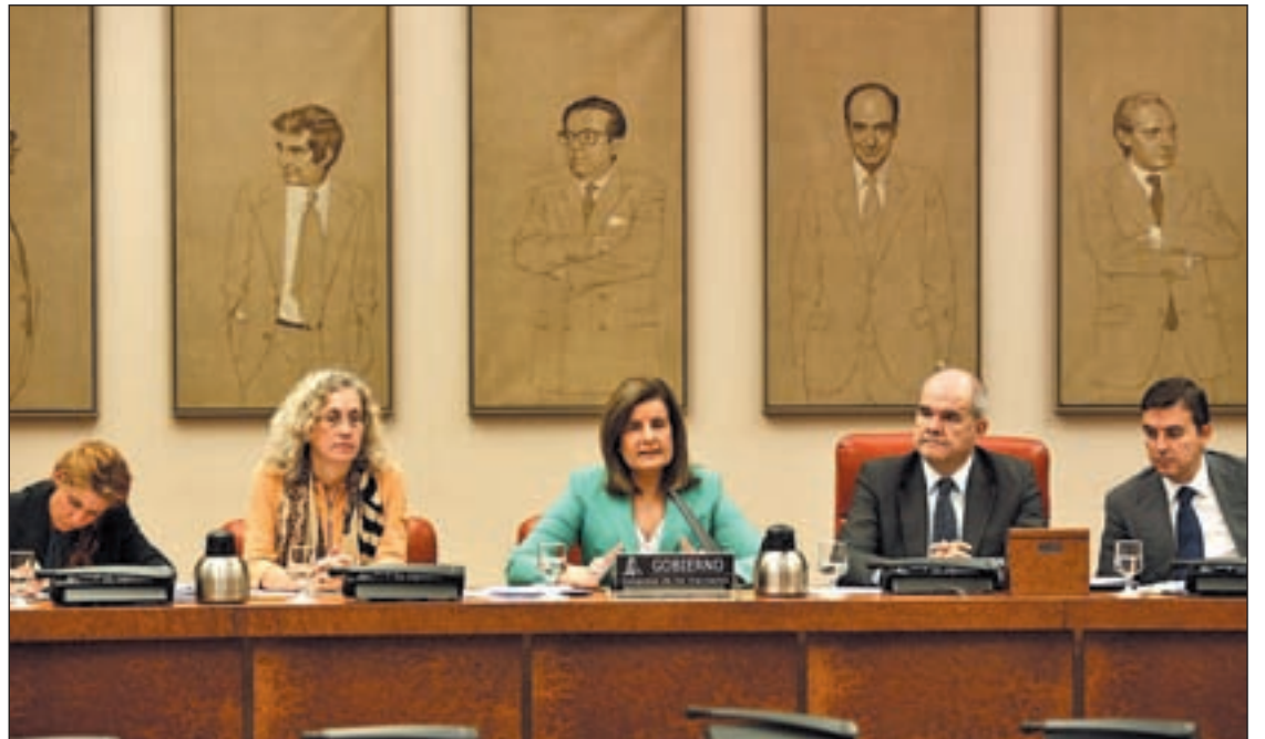
La ministra de Empleo, Fátima Báñez, en la Comisión de Seguimiento del Pacto de Toledo

Canarias, Andalucía, Aragón, País Vasco, Cataluña, Comunidad Valenciana, Extremadura, Castilla y León y Baleares no aplicarán, ya sea por rechazo o por problemas para su implantación, el copago a medicamentos de dispensación ambulatoria en el hospital, es decir, aquellos que "sin tener la calificación de uso hospitalario" sólo se dispensan a pacientes no hospitalizados en las farmacias de los centros sanitarios. Esta medida ha sido rechazada por su fondo por Andalucía, Baleares, Canarias y País Vasco.