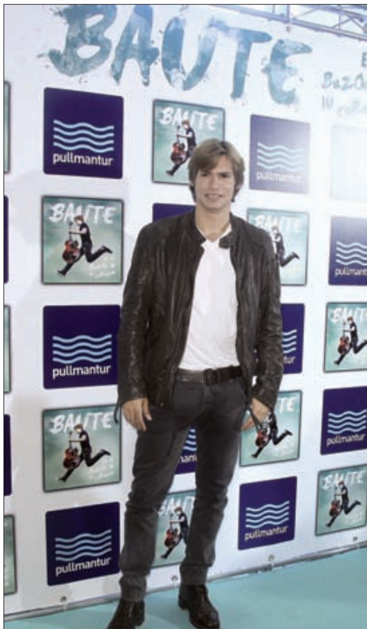
Carlos Baute presenta su nuevo disco en Madrid

Los dos últimos años han sido vitales en la nueva vida de Carlos Baute. Su anterior trabajo, ‘Amar te bien’, le situó en los primeros puestos de las listas de ventas de la mayor parte de los países lati-