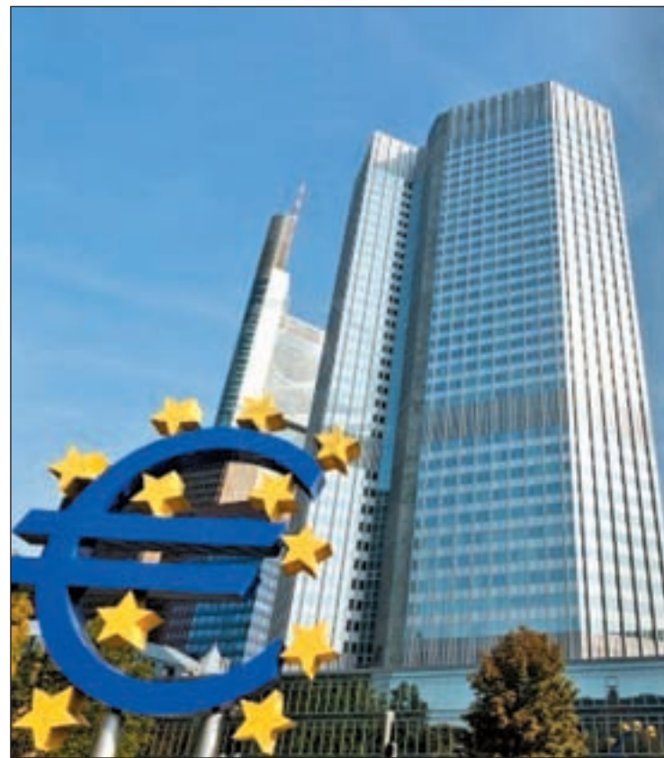
Los inspectores de la troika publican su informe preliminar

Por ello, los inspectores piden al Gobierno una "supervisión y vigilancia reforzada" de los bancos "con el fin de identificar los riesgos en una etapa temprana y abordarlos con medidas de supervisión rápidas cuando sea necesario". "Los supervisores y los políticos deben continuar vigilando de forma decisiva el proceso de estabilización del sector bancario. El diagnóstico adecuado y sostenido de la resistencia a los choques y de la solvencia del sector bancario español sigue siendo vital", insiste la troika.