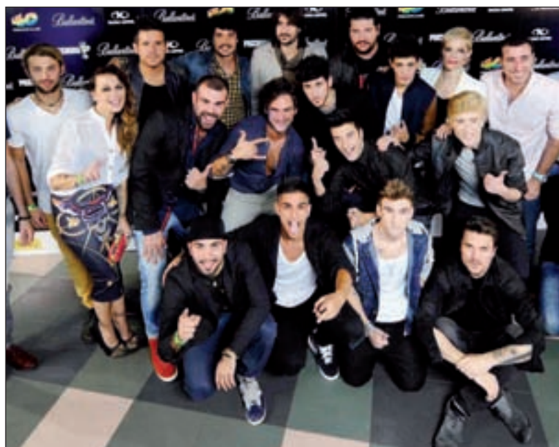
FOTO DE FAMILIA de los nominados a los premios 40 Principales. Los galardones se otorgarán en la gala que se celebrará el próximo 12 de diciembre de 2013 en el Palacio de Deportes de la Comunidad de Madrid. El periodo de votaciones se iniciará a las 10 horas del día 12 de octubre de 2013 y finalizará a las 23:59 horas del 29 de noviembre de 2013 en www.los40.com .

No sólo los músicos, cantantes y artistas estuvieron en la gala de los nominados de los 40 Principales. Actores, actrices, periodistas, colaboradores de televisión y otros personajes públicos no quisieron perderse esta ocasión para bailar y disfrutar como aseguró una guapísima Tamara Gorro, que llegó acompañada por Lidia Lozano, quien no quiso pasar por el photocall. Cristina Pedroche,