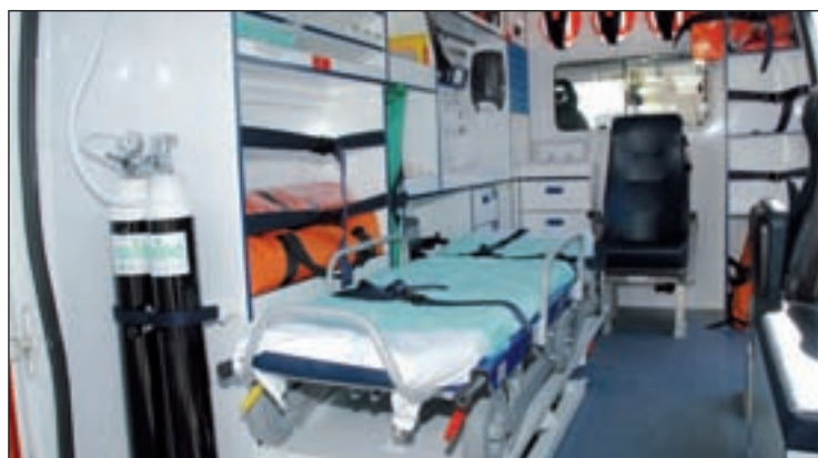
El nuevo vehículo

COSTE 57.717 EUROS PRESTAN AYUDA A LA POLICÍA LOCAL