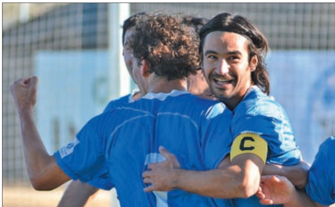
El Fuenlabrada es cuarto en la clasificación GENTE

El conjunto fuenlabreño supo recuperarse haciéndose con el partido tras el descanso. El capi-