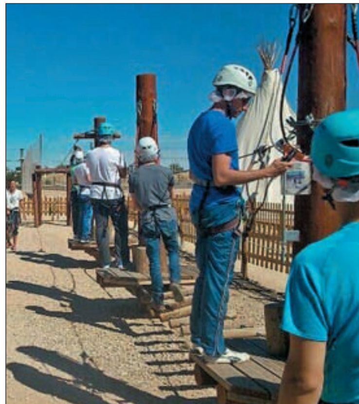
Miembros del Consejo de Juventud disfrutando en una tiroliana

El uso de las redes sociales y la difusión de las actividades de las asociaciones a través de la Red es