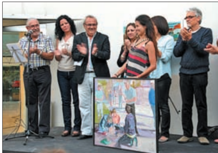
Cuadro ganador ASOCIACIÓN MAGENTA