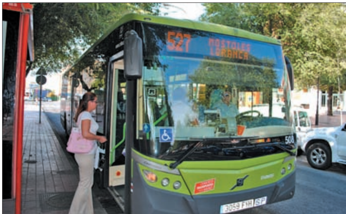
La línea tiene una frecuencia de una hora para cada sentido

La realidad es que una media de diez personas se suben cada hora a la línea 527 de autobús que une los municipios madrileños de Fuenlabrada con Móstoles, pa-