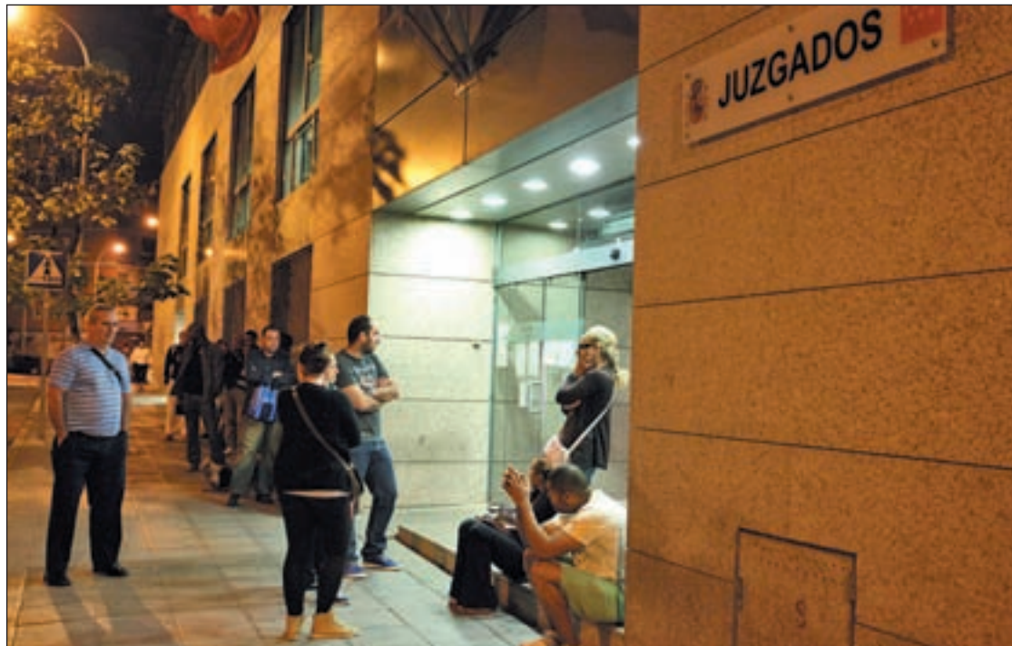
Registro Civil de Fuenlabrada

Entre los principales problemas que se encuentran está la saturación del organismo por el incremento de la población de la localidad, principalmente por el aumento del número de las nacionalidades, que ha generado "un fuerte incremento en la tramitación de expedientes", según el TSJM. Los cambios sociales que se han producido como la bajada de los matrimonios eclesiales a favor de los casamientos civiles son otro de los motivos de esta saturación. El número de nacimien-