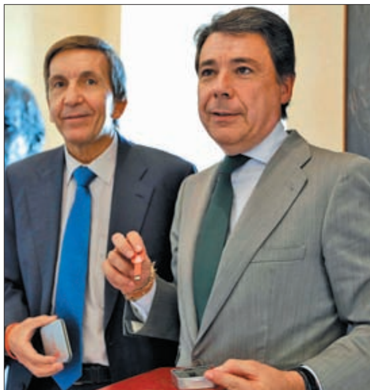
González recibe la Memoria de manos del fiscal superior de Madrid

La Memoria detalla que el robo con fuerza en las casas creció un 4% al registrarse 55.508 en