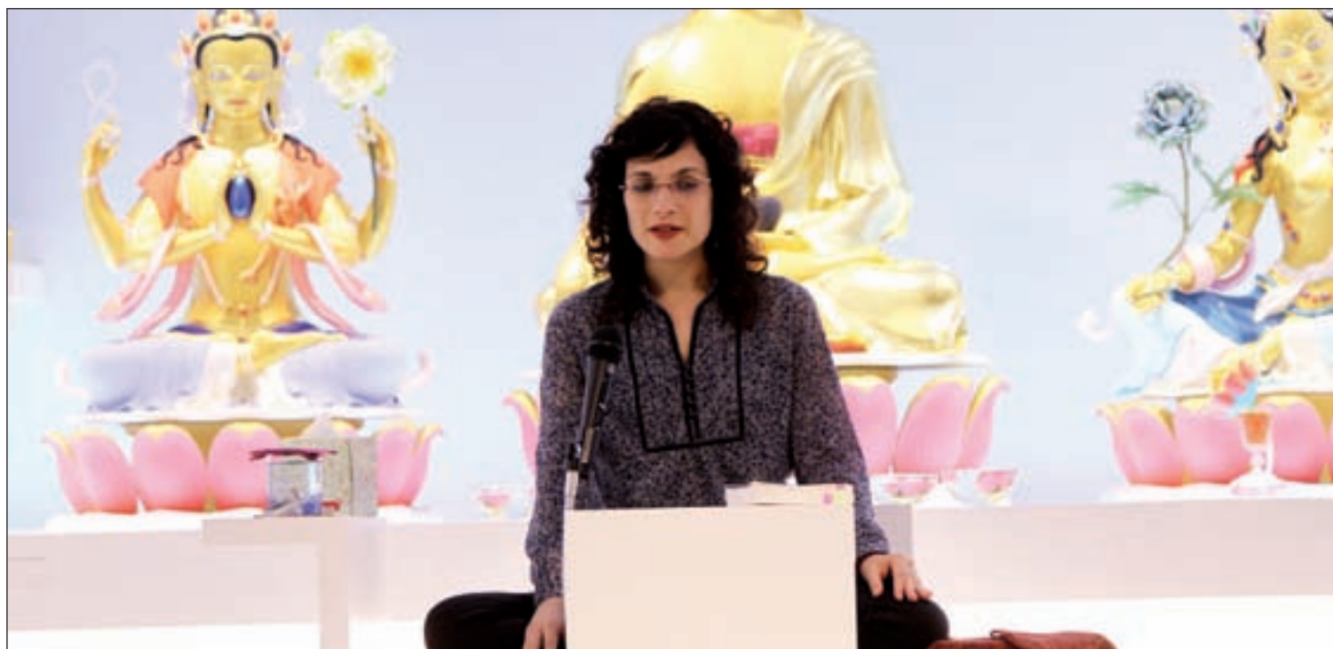
Clase de meditación, con el altar de fondo, presidido por Buda y otras deidades