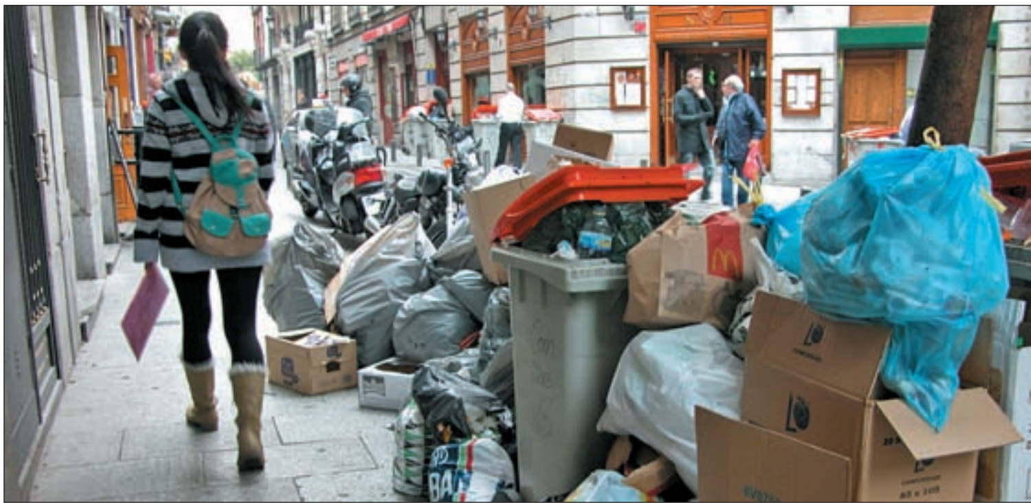
La última huelga de basuras duró 4 días, pero UGT recuerda la convocada en 1993, que duró 32 jornadas