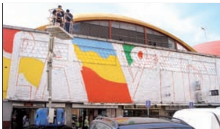
Una marca de bebidas alcohólicas patrocina la acción

Así, han teñido cada una de las cúpulas de un color: rojo, verde, azul, amarillo, naranja y morado, que recuerdan a los tonos de los productos y alimentos que se encuentran habitualmente en el interior del mercado, y sirven de soporte para la palabra 'COLOR', escrita en blanco mediante 'anamorfosis', una técnica en perspectiva utilizada para forzar