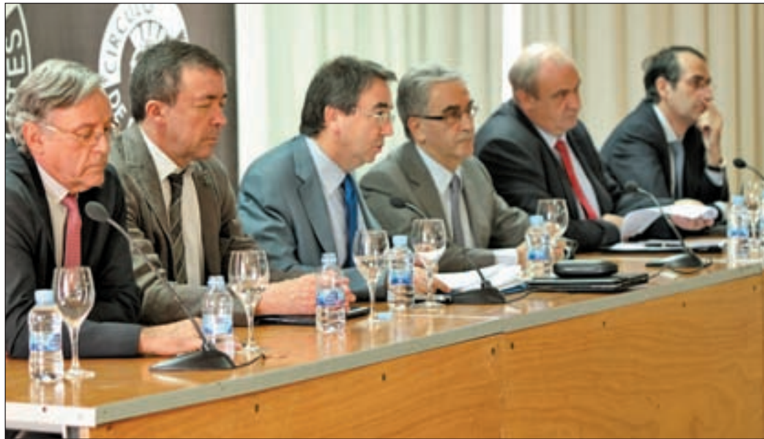
Los rectores de las seis universidades públicas madrileñas