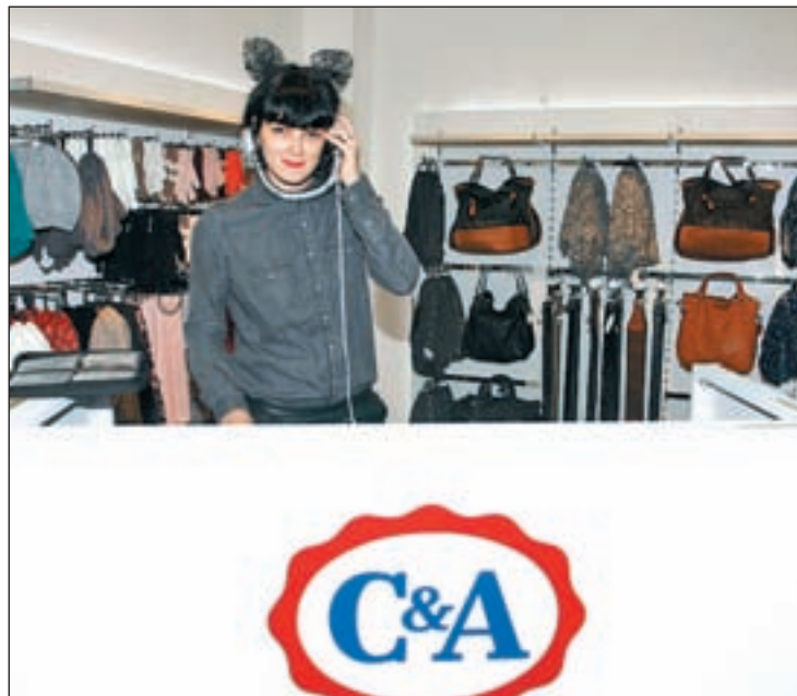
Bimba Bosé en la inauguración de C&A en Gran Vía

Además, durante la inauguración de esta nueva tienda, tuvo lugar un desfile encabezado por Alba Galocha, modelo que repre-