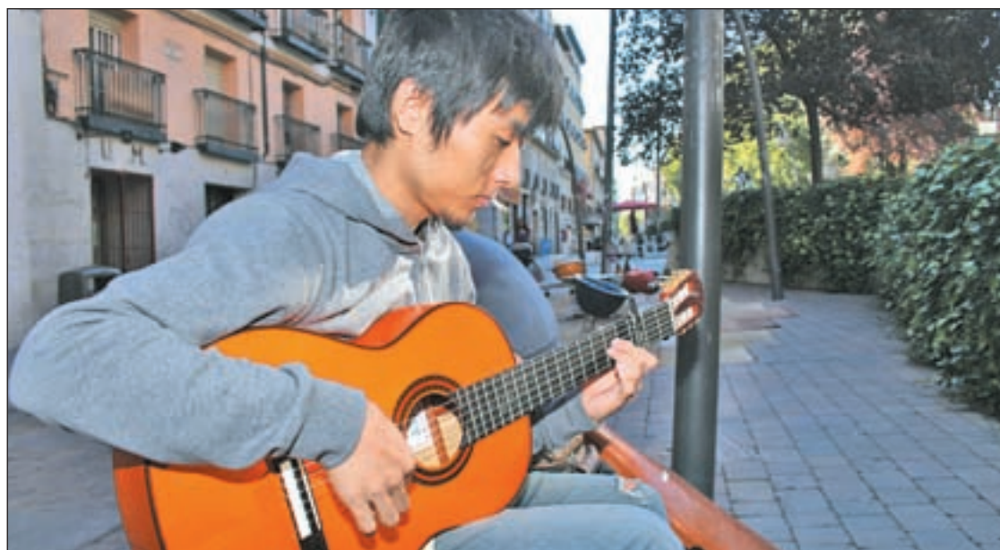
Los artistas no podrán tocar cerca de residencias de mayores, hospitales o colegios