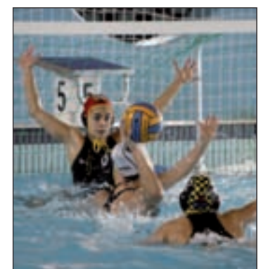
La Liga, cerca del comienzo

En la élite masculina la competición también tiene acento catalán, aunque el Real Canoe Isostar y el AR Concepción-Ciudad Lineal intentarán colarse entre los puestos de honor. La segunda categoría parece mucho más igualada con el CN Tres Cantos, el CN Madrid Moscardó y el CN La Latina como aspirantes a ser grandes animadores de la competición.