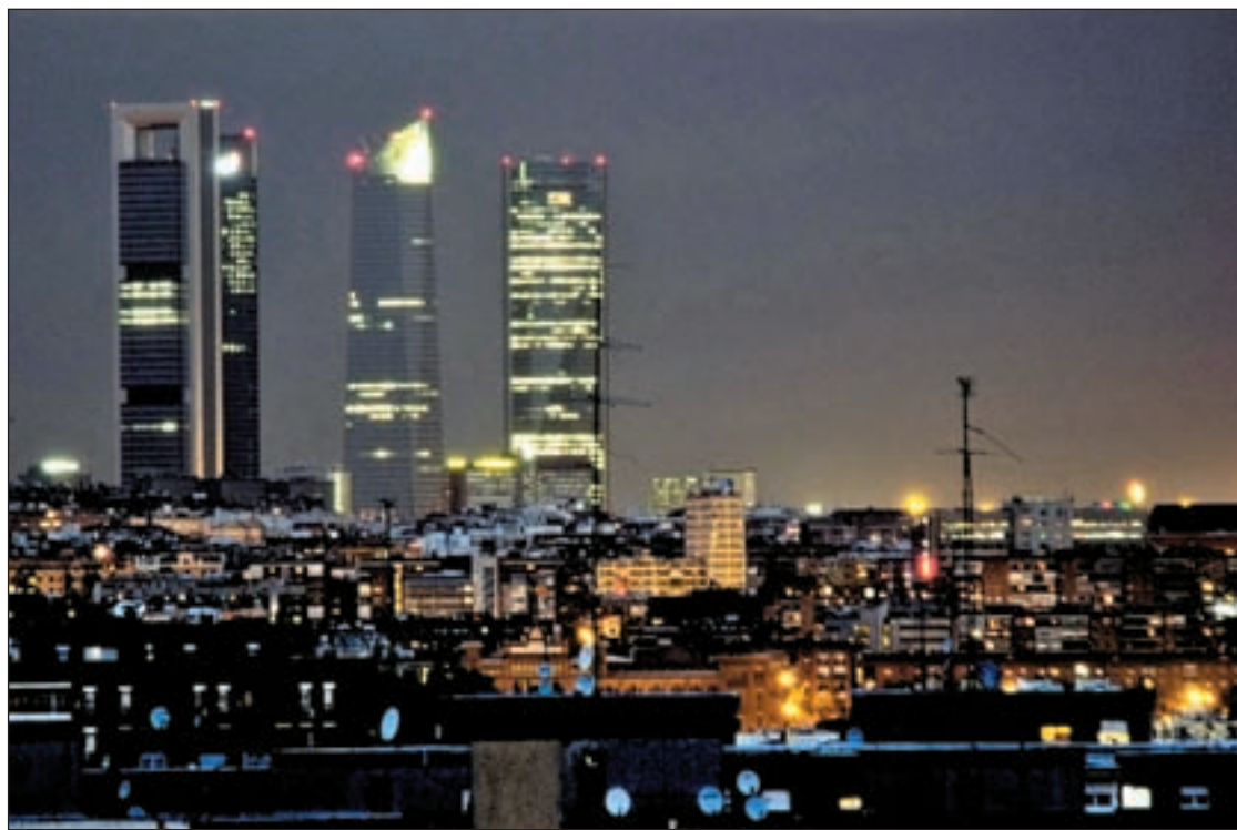
En la capital es habitual ver oficinas de noche con las luces encendidas

Buqueras analiza todos los aspectos que recoge este informe, que parece no va a quedarse en nada. El ministro de Economía, Luis de Guindos, ha manifestado que “no