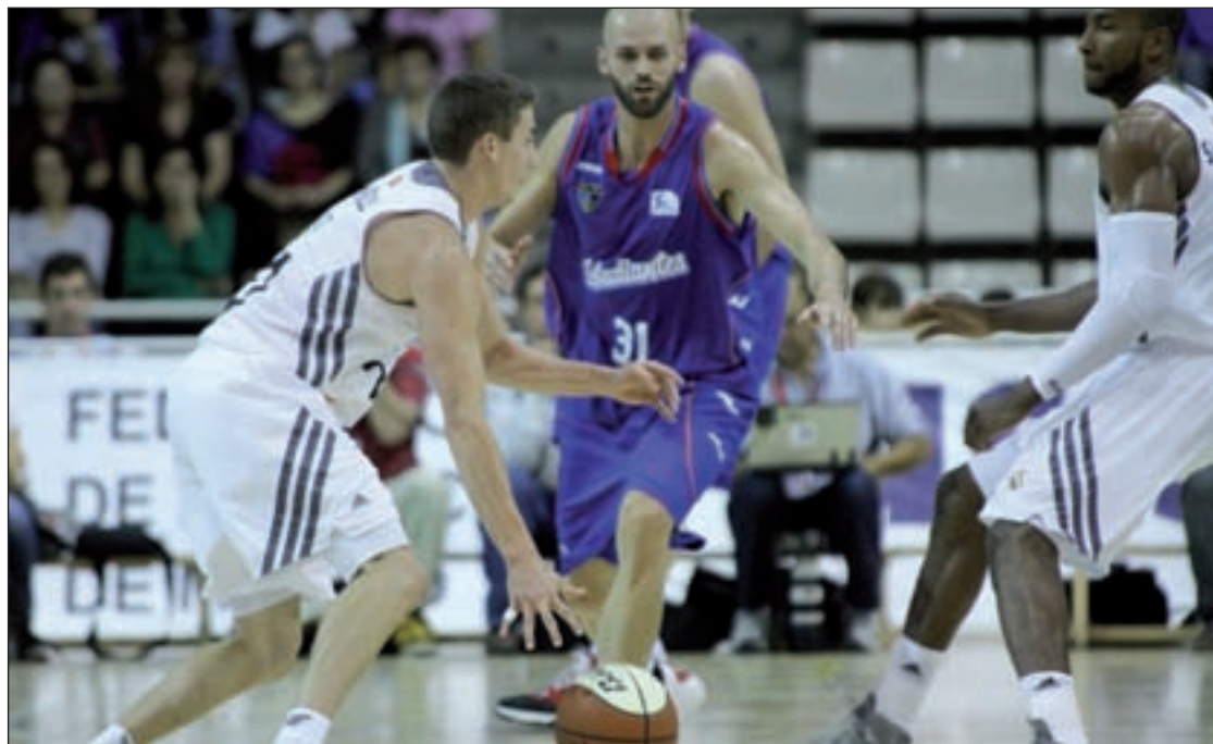
Los blancos se impusieron en el Trofeo de la Comunidad

Un poco más habrá que esperar para ver en acción al vigente campeón. El Real Madrid ha retrasado su primer partido de Liga hasta el