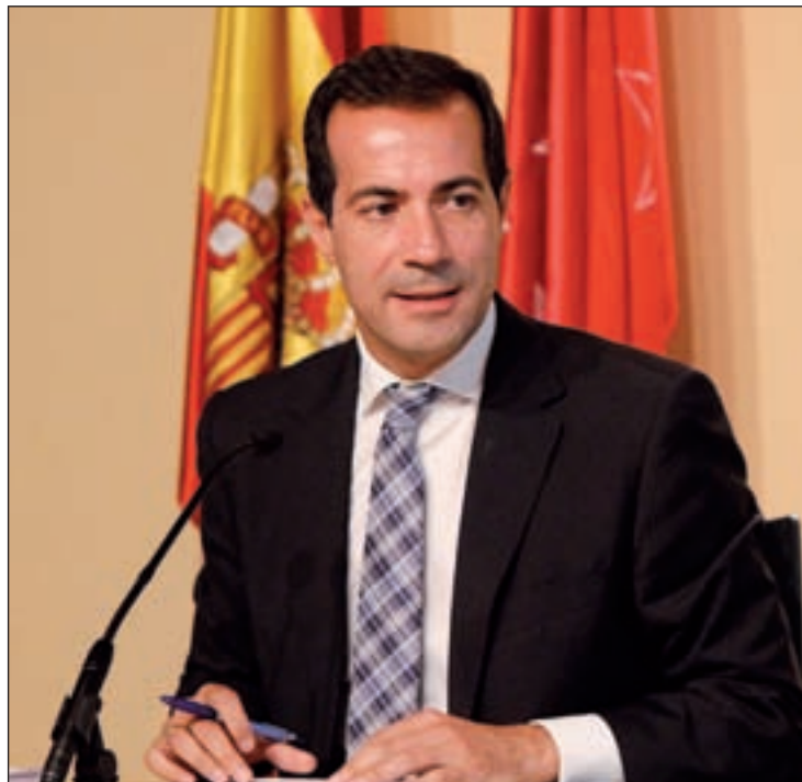
Rueda de prensa tras el Consejo de este jueves

El Ejecutivo regional ha realizado un estudio de las necesidades del mercado, al que han respondido 1.800 empresas, con el fin de conocer el perfil de trabajador que requieren las compañías madrileñas. Además, hizo una convocatoria pública, publicada en el Boletín Oficial de la Comunidad de Madrid (BOCAM), para los centros interesados en impartir la formación. "Se han cogido centros que imparten cursos