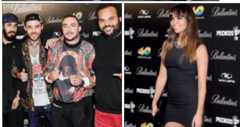
FOTO DE FAMILIA de los nominados a los premios 40 Principales. Los galardones se otorgarán en la gala que se celebrará el próximo 12 de diciembre de 2013 en el Palacio de Deportes de la Comunidad de Madrid. El periodo de votaciones se iniciará a las 10 horas del día 12 de octubre en www.los40.com .

ñada por Lidia Lozano, quien no quiso pasar por el photocall. Cristina Pedroche, una de las encargadas en conducir la gala, fue la 'Top One' de las más guapas y atractivas del evento. Deslumbró con un sencillo vestido ajustado negro con corte pingüino y altísimos zapatos de tacón de punta.