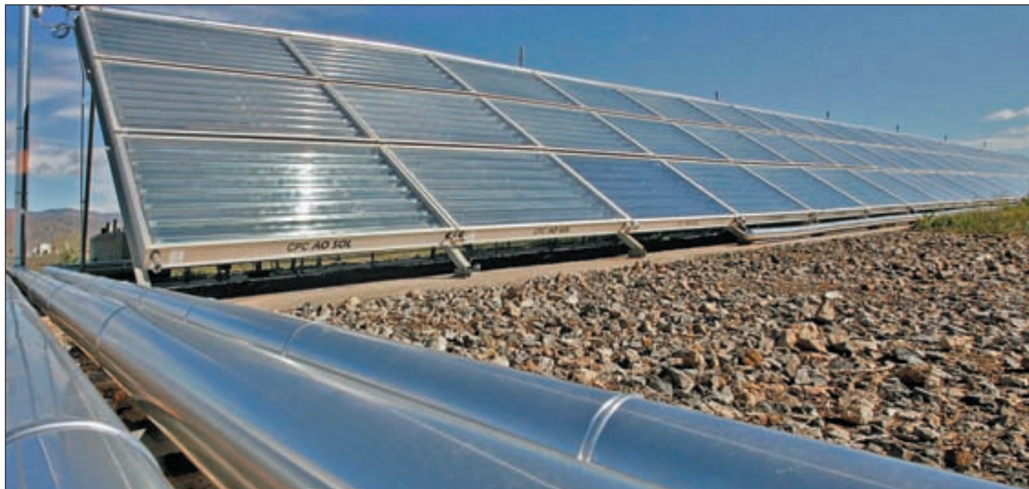
El plazo de amortización de un 'kit' de autoconsumo de 6.600 euros pasará de 20 a 33 años

Por su parte, el mercado del alquiler de viviendas ha experimentado un importante crecimiento en el último año, lo que ha llevado a propietarios, profesionales y empresas a aumentar sus consultas al Fichero de Inquilinos Morosos (FIM) en un 150%.