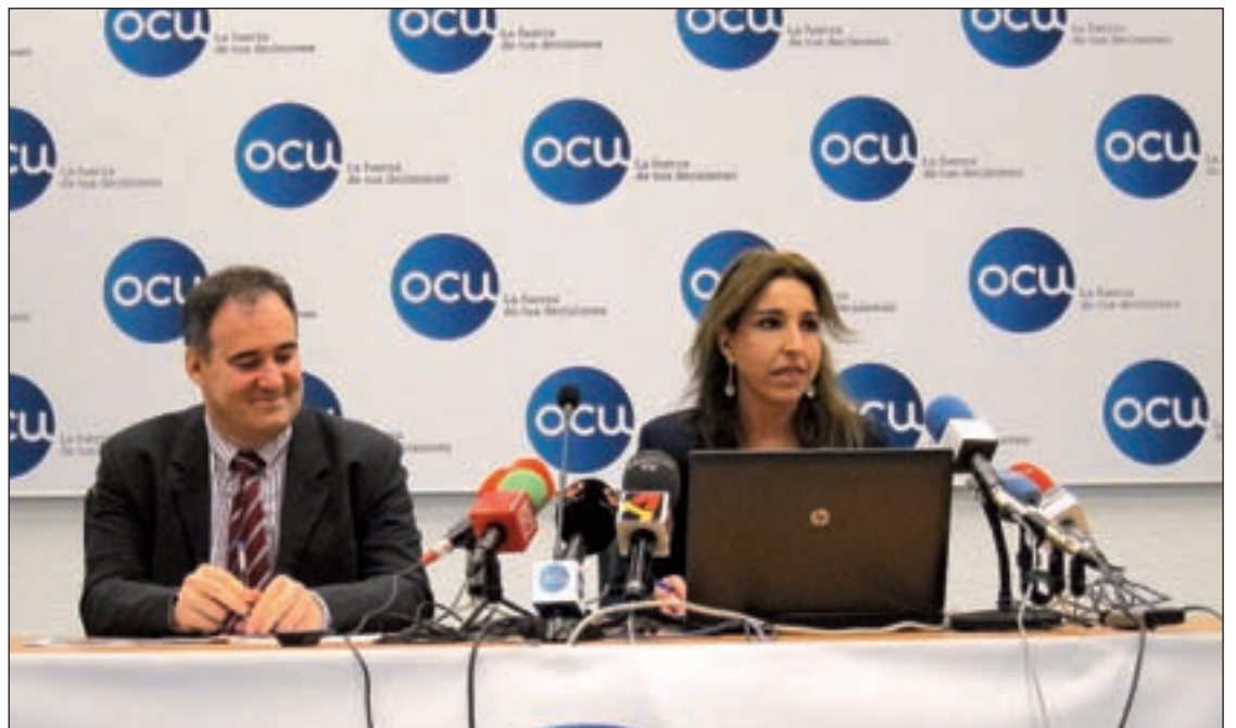
La OCU presentó los resultados de la subasta en rueda de prensa

La Guardia Civil ha destruido durante este año 440 artefactos explosivos procedentes en su mayoría de la Guerra Civil. Según el Ministerio del Interior, las provincias en las que se han destruido más han sido Zaragoza (37), Ciudad Real (35) y Valencia (32).