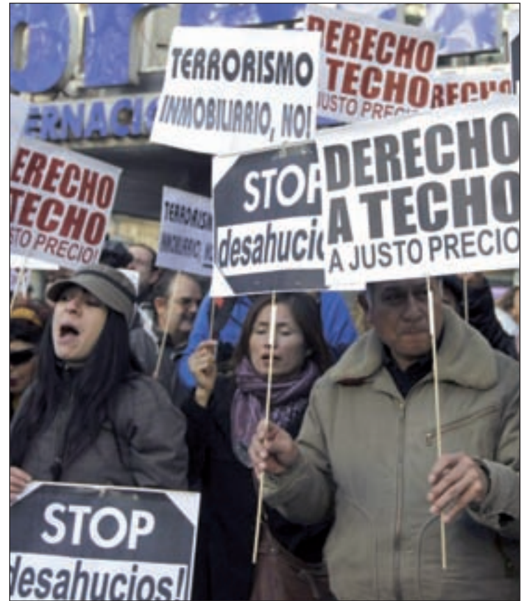
Una protesta contra los desahucios

Por comunidades autónomas, las ejecuciones hipotecarias iniciadas en Andalucía representan