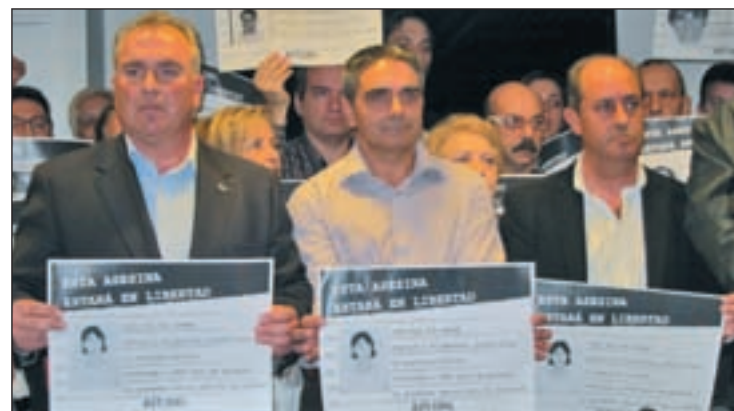
Víctimas de Inés del Río en la rueda de prensa de la AVT

El Ejecutivo intentó explicar su postura a las víctimas con rapidez. El mismo lunes los ministros de Justicia y de Interior se reunieron con la AVT y la Fundación de Víctimas del Terrorismo, y el miércoles lo hizo el presidente del Gobierno.