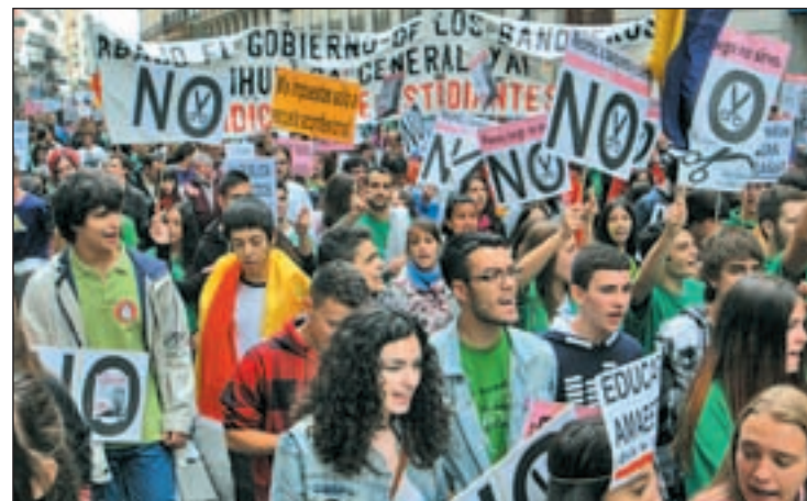
Protesta por la Educación el pasado miércoles en Madrid