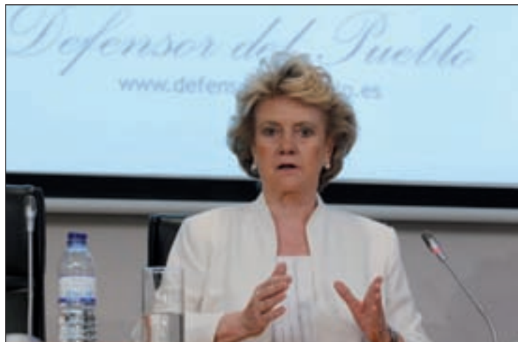
Soledad Becerril, Defensora del Pueblo, compareció en la Comisión

En su comparecencia, recordó también que el Presupuesto de la Defensoría para 2014 se reduce por debajo de los 14 millones, un 0,5% menos que en 2013. A pesar de estos ajustes, se pondrá en marcha un procedimiento para que cualquier persona pueda acceder a internet y saber en qué punto procedimental se encuentra su queja.