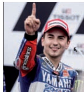
Lorenzo se acerca a Márquez

ción para ganar su cuarto entorchado. Además, el piloto de Red Bull competirá en un circuito que en los dos últimos años ha sido testigo de sendas victorias del alemán. En resumen, las probabilidades de que el Mundial de Fórmula 1 quede sentenciado este fin de semana parecen bastante al-