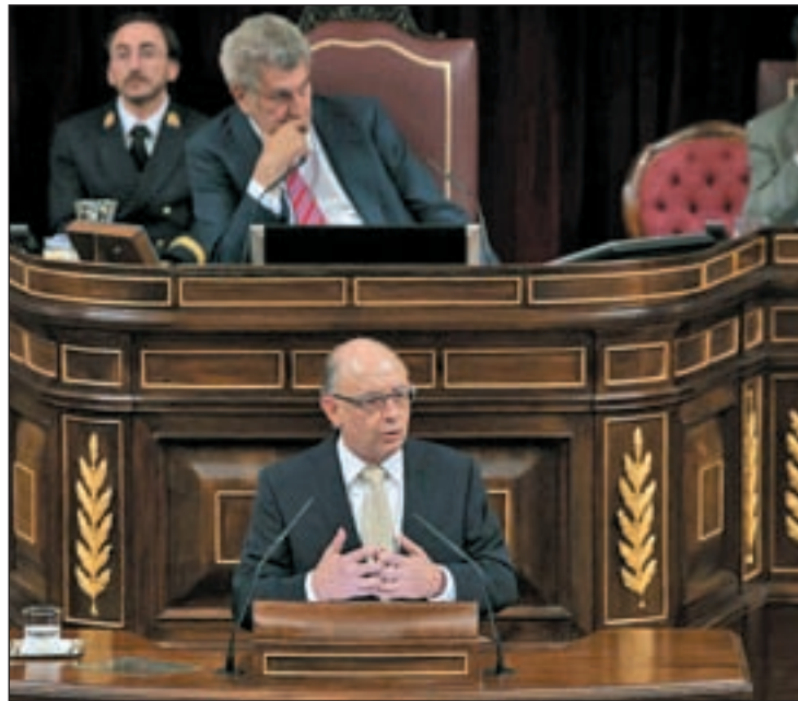
El ministro, Cristóbal Montoro, en el debate de los PGE

La autoridad monetaria estima también un "pequeño avance" del consumo de los hogares en el tercer trimestre (+0,1%), en un entorno en el que la ocupación tuvo un comportamiento "algo menos contractivo", que podría haber contribuido a aminorar el ritmo de descenso de la renta disponible, a lo que también habría contribuido la "notable desacele-