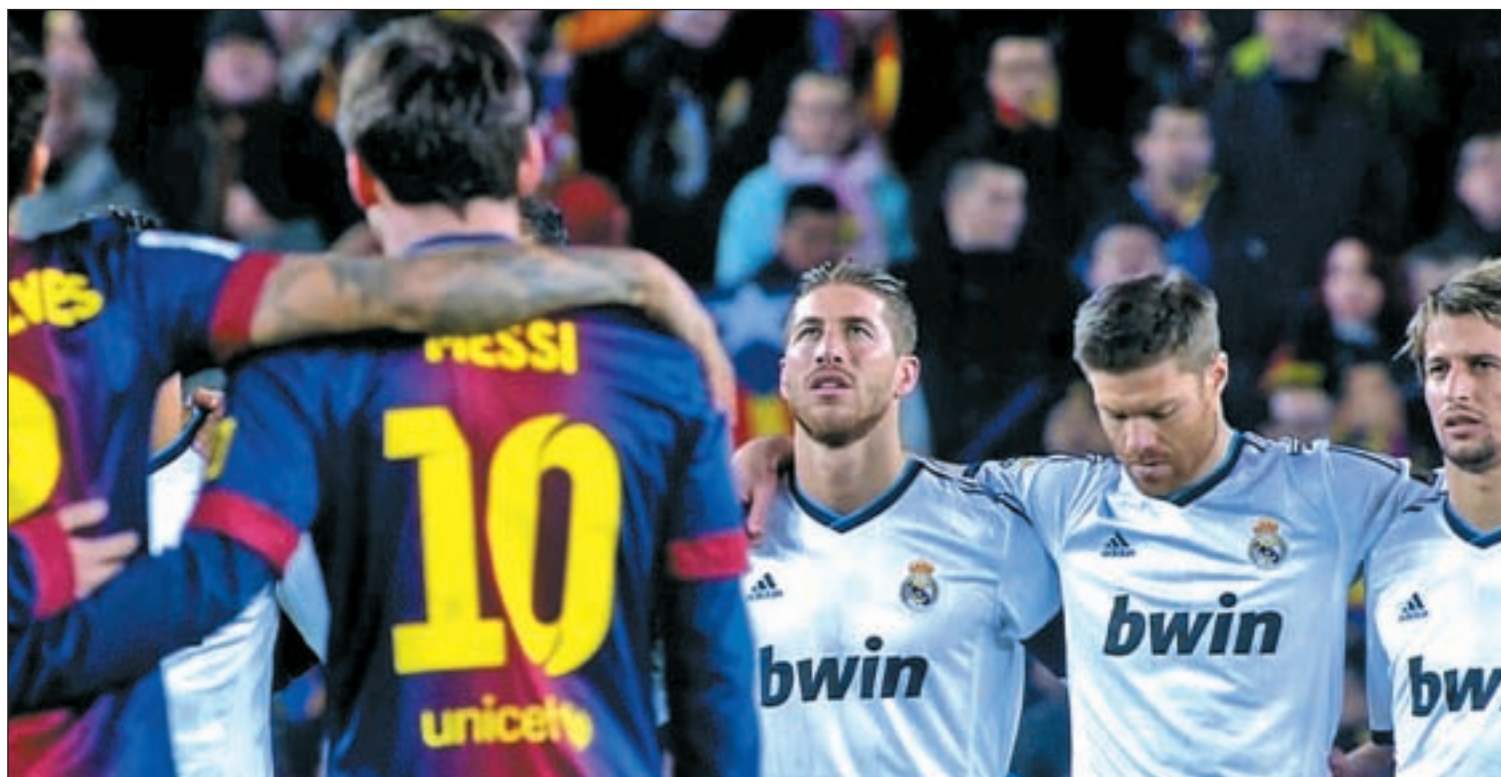
Los blancos se llevaron la victoria (1-3) en su última visita al Camp Nou, en una eliminatoria de Copa