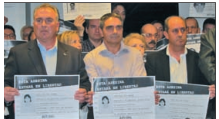
Víctimas de Inés del Río en la rueda de prensa de la AVT

El Ejecutivo intentó explicar su postura a las víctimas con rapidez. El mismo lunes los ministros de Justicia y de Interior se reunieron con la AVT y la Fundación de Víctimas del Terrorismo, y el miércoles lo hizo el presidente del Gobierno.