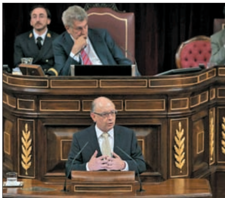
El ministro, Cristóbal Montoro, en el debate de los PGE

La autoridad monetaria estima también un "pequeño avance" del consumo de los hogares en el tercer trimestre (+0,1%), en un entorno en el que la ocupación tuvo un comportamiento "algo menos contractivo", que podría haber contribuido a aminorar el ritmo de descenso de la renta disponible, a lo que también habría contribuido la "notable desacele-