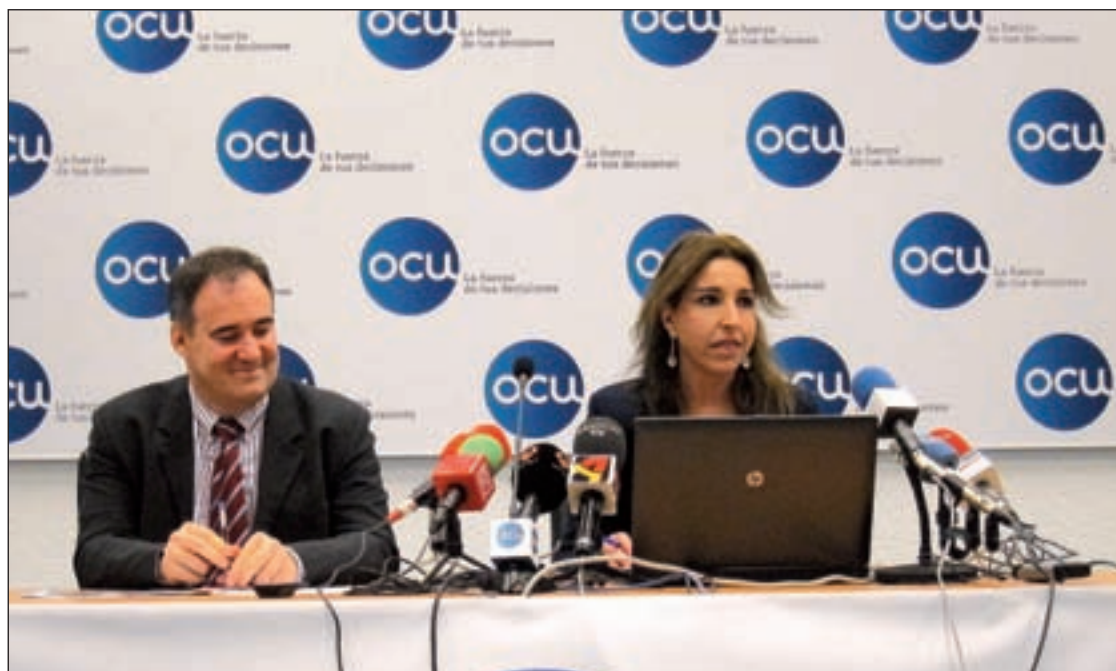
La OCU presentó los resultados de la subasta en rueda de prensa

La Guardia Civil ha destruido durante este año 440 artefactos explosivos procedentes en su mayoría de la Guerra Civil. Según el Ministerio del Interior, las provincias en las que se han destruido más han sido Zaragoza (37), Ciudad Real (35) y Valencia (32).