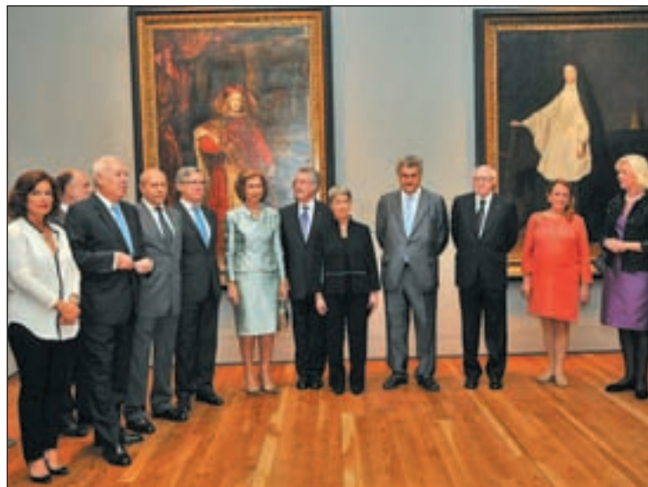
Inauguración de la exposición de Velázquez del Museo del Prado

En otro de los grandes museos de la capital y mostrando un arte totalmente diferente, los amantes del arte podrán ver la muestra 'El surrealismo y el sueño'. Así es como el museo Thyssen de Madrid se detiene en el universo de los grandes maestros de la primera parte del siglo XX con una exposición que reunirá hasta el 14 de enero de 2014 un total de 163 obras. Entre las obras se incluyen diversos soportes como pintura,