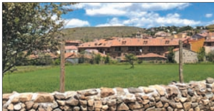
Alojamiento rural en la Comunidad de Madrid GENTE