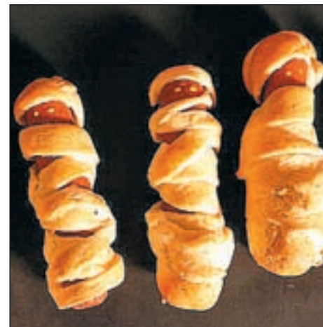
INGREDIENTES Masa de hojaldre, salchichas tipo frankfurt, una pizca de mostaza o ketchup y gominolas de gusanos de colores.

Para acompañar y que sea aún más terrorífico, pueden utilizarse gominolas de gusanos.