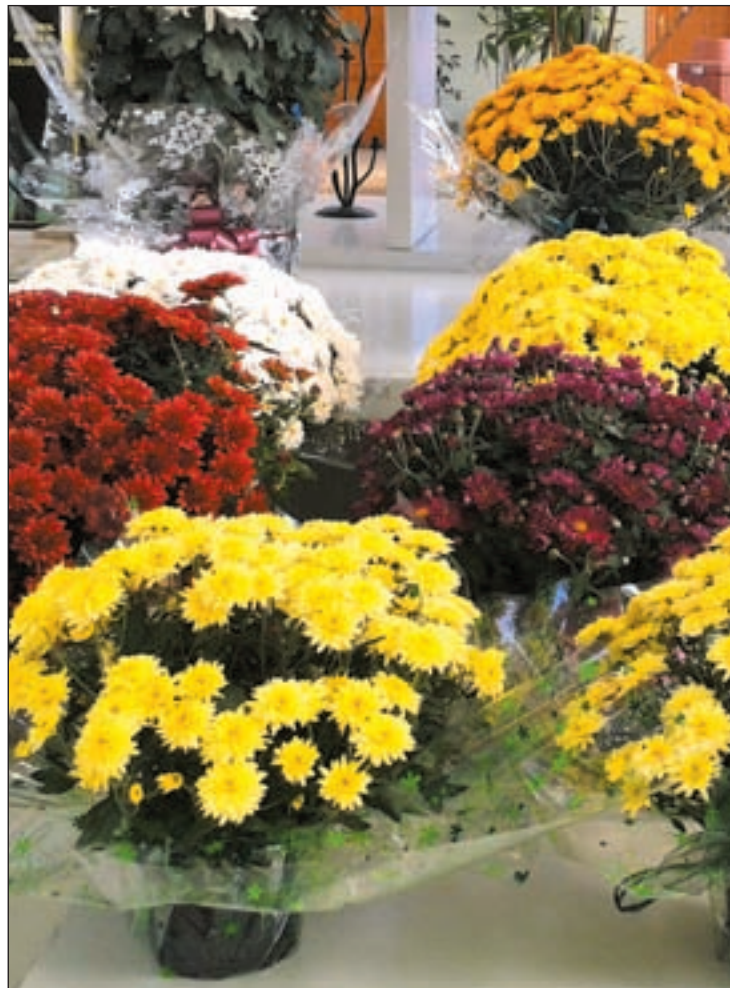
El sector se nutre del producto holandés

Para ella, “en Santos no hay crisis. Es una vez al año, y hablas de algo tan importante como es el dolor de las familias que la gente no escatima”, asegura. “Hay que tener en cuenta que vas a un sitio donde no puedes llevar otra cosa, y la gente gasta desde los tres o cuatro euros que cuesta una ramo normal a los 500 de una corona”. Sin embargo, si hay algo que no cambia es la demanda, y los cristantemos y los claveles siguen siendo los reyes de esta fiesta.