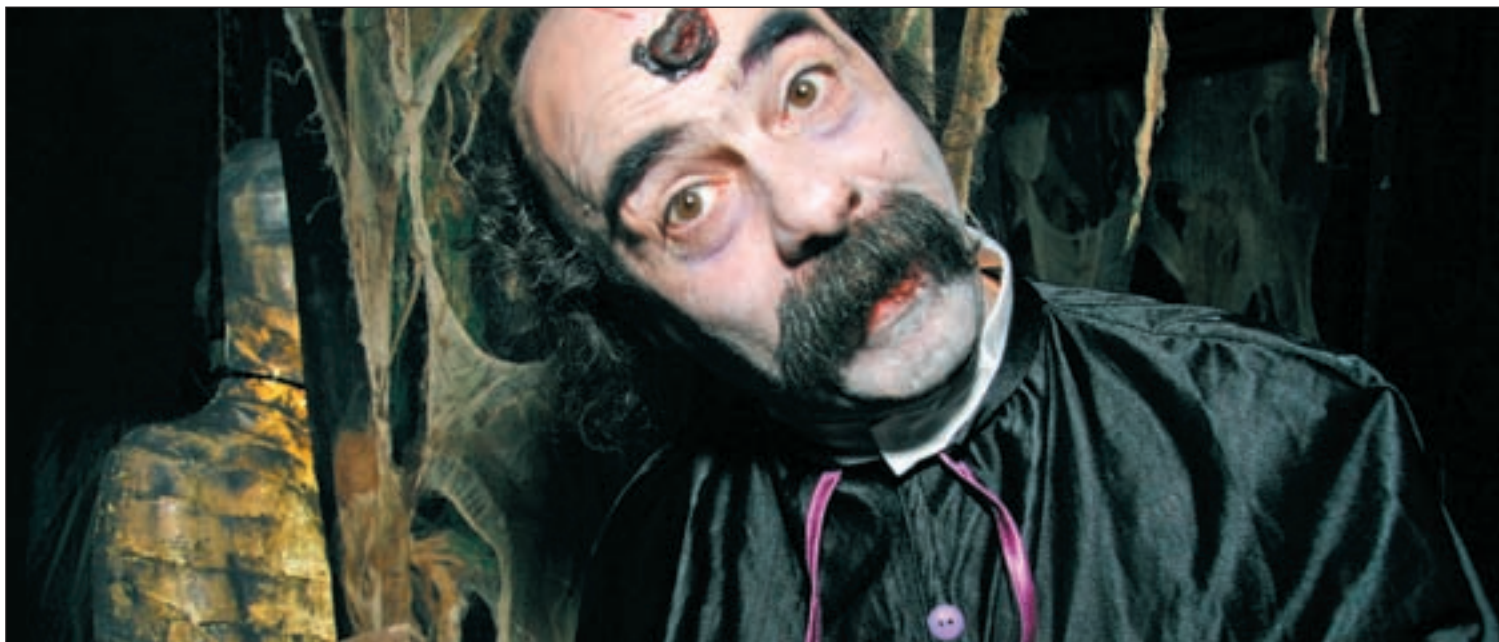
La noche de 'Halloween' se celebra el 31 de octubre