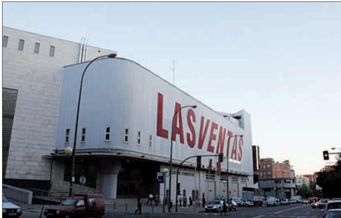
El mercado está situado en pleno barrio de La Concepción, en la calle de Virgen de la Alegría

“Entre esas medidas se incluyó la modificación del contrato para facilitar esos usos y la asistencia al acto de inauguración de