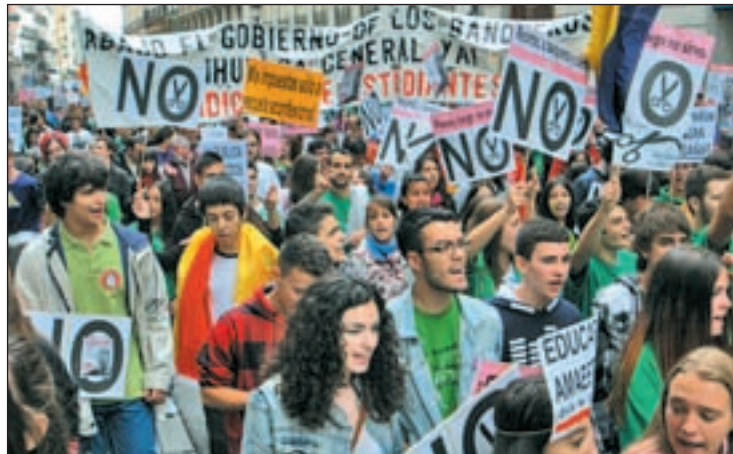
La manifestación recorrió el centro de Madrid

“Pedimos al Gobierno que cese al ministro, que pare la LOMCE”, explicaba uno de los estudiantes. Entre las camisetas verdes, ondeaban banderas republicanas. “No a la enseñanza franquista”, se escuchaba. Entre las pancartas, destacaban aquellas que pedían acabar con los recor-