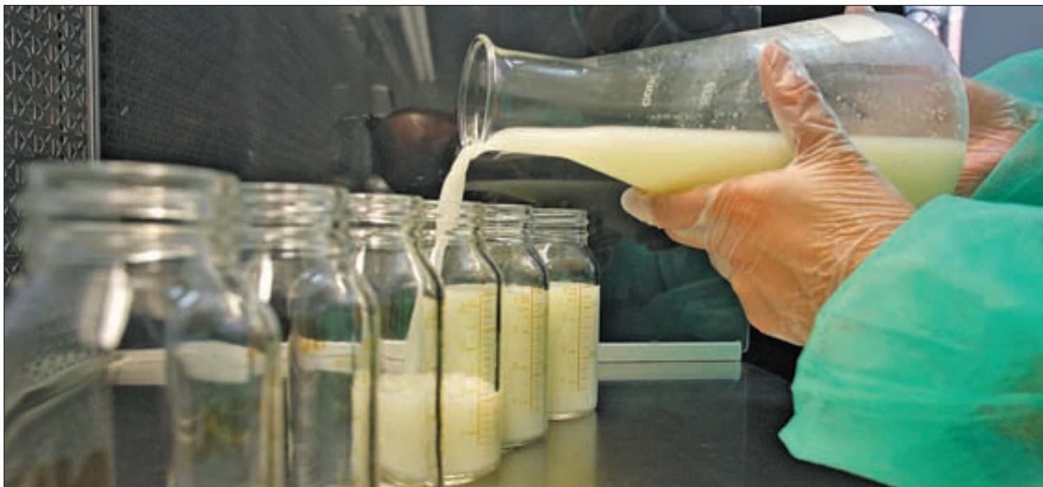
Cuando llega la leche donada, un técnico comprueba si está congelada, recogiendo muestras que pasan un control exhaustivo