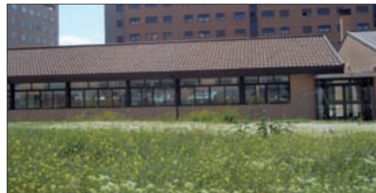
El centro educativo situado en el barrio de Valderribas

zando un total de cuatro aulas, habilitadas "para dar respuesta a la necesidad de aulas del centro, garantizando en todo caso, la seguridad de los alumnos y de los trabajadores del centro". Torralba aseguró que, una vez terminadas, las pistas deportivas se están utilizando con normalidad.