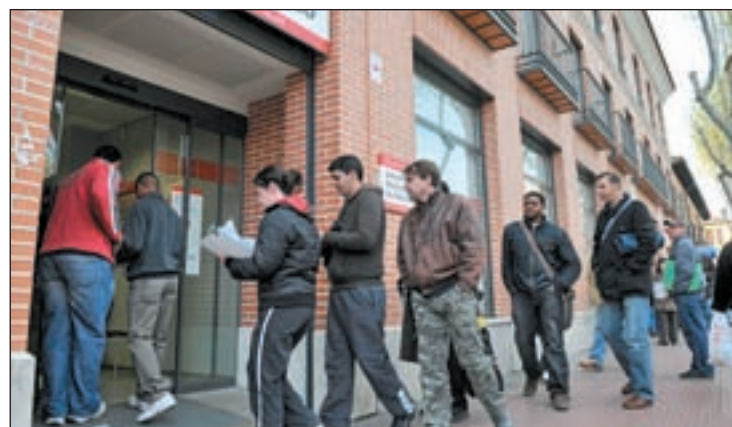
El paro bajó por primera vez en octubre en términos interanuales

Octubre es un mes en el que habitualmente sube el desempleo y dentro de la serie histórica, que arranca en 1996, no hay ningún descenso. En igual mes de 2012, el paro subió en 128.242 personas,