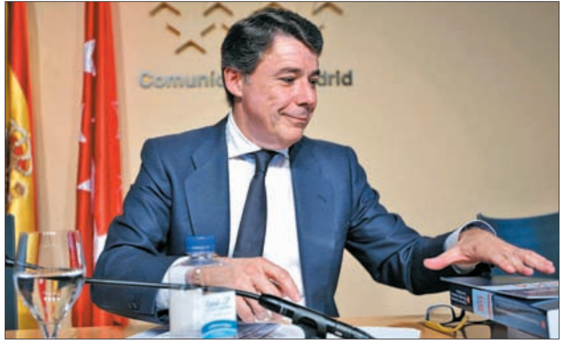
Ignacio González, presidente de la Comunidad de Madrid, en la presentación de sus presupuestos

Desde el Partido Socialista se alerta del electoralismo de esta medida a un año de los comicios y el Partido Popular asegura que está en línea con las intenciones de Mariano Rajoy y alerta de que las comunidades autónomas no deben perder de vista que, a pesar del descenso de ingresos que supondrá la rebaja fiscal, deben