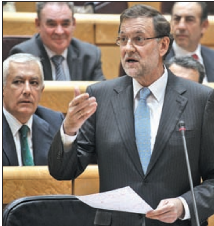
Mariano Rajoy intervino en el Pleno del Senado

El senador socialista, que defendió una reforma de la Carta Magna, afirmó que el Gobierno del Partido Popular está “obligado” a evitar “una crisis”. Por eso, le preguntó qué “iniciativas políticas” está dispuesto a llevar a cabo para buscar un “mejor encaje de Cataluña”.