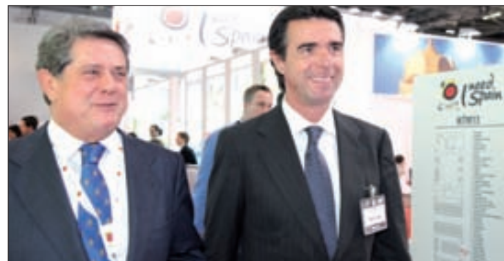
Soria y Trillo visitaron la World Travel Market

Para la temporada de invierno, continuará esta tendencia positiva, ya que se observa un incremento de la capacidad aérea del 11,65% entre Reino Unido y España, con 720.000 nuevos asientos, informó Industria.