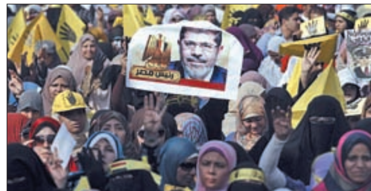
Protesta al inicio del juicio al expresidente egipcio

La primera jornada del juicio estuvo marcada por las protestas de partidarios de Mursi, en las que al menos tres manifestantes fueron detenidos. Los seguidores del expresidente denuncian que se pretende dismantelar los Hermanos Musulmanes y restaurar el Estado policial.