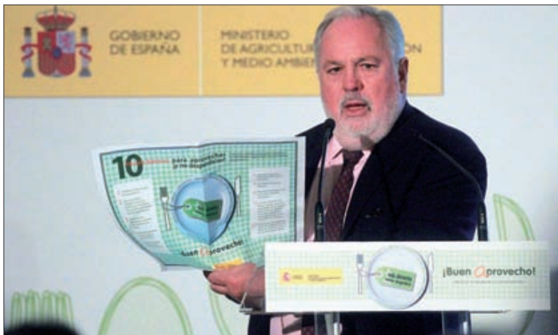
Miguel Arias Cañete, en la presentación de la Semana de la Reducción de Desperdicios Alimentarios

Las mismas fuentes aseguraron que "no ha habido heridos ni entre los guardias civiles ni entre los inmigrantes".