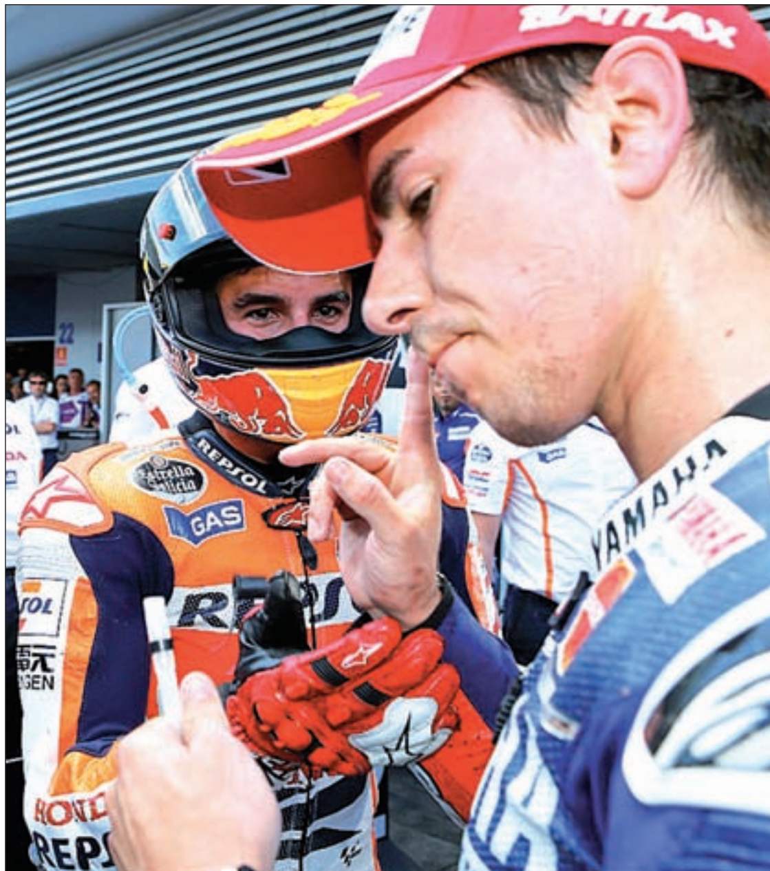
Marc Márquez y Jorge Lorenzo, uno de los dos será el campeón en Moto GP