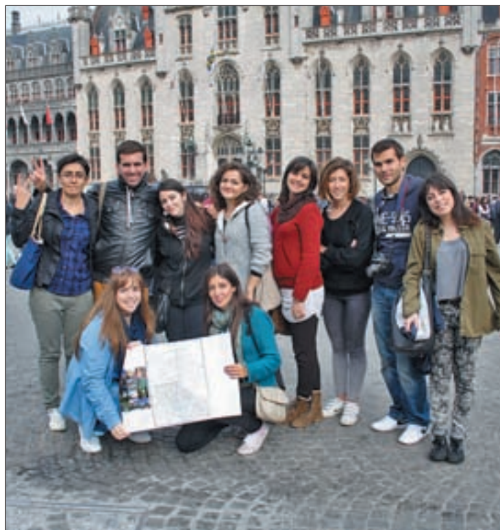
Alumnos del Programa Erasmus en Bruselas