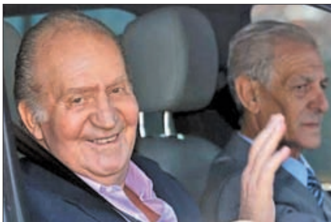
El monarca, abandonando el hospital tras su última operación