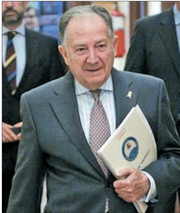
Félix Sanz Roldán compareció en la Comisión de Gastos Reservados

La portavoz del Grupo Socialista, Soraya Rodríguez, aseguró