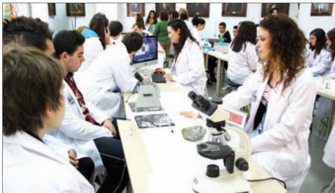
Semana de la Ciencia de 2012

los niños y profesores toda la información necesaria sobre cursos, programas o recursos municipales relacionados con este. La guía contiene setenta actividades diferentes que se remitirán al conjunto de los centros docentes, tanto de primaria como secundaria, que hay en la ciudad.