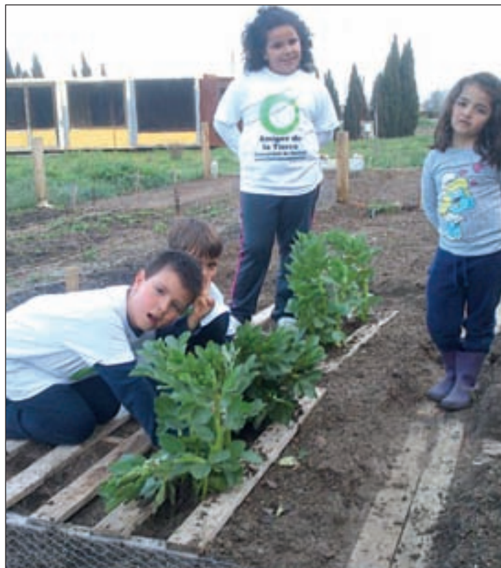
Un evento de la Asociación 'Amigos de la Tierra'

El objetivo que persiguen es mostrar los beneficios, tanto para el medio ambiente como para el bolsillo, del uso de estas energías verdes. "Hay tres acciones básicas que los ciudadanos deberían hacer y que, con este evento, queremos que la gente conozca. Hay que revisar la factura eléctrica. Una vez hecho, deberías plantearte un cambio de compañía a otra socialmente más responsable. Y buscar alternativas para el