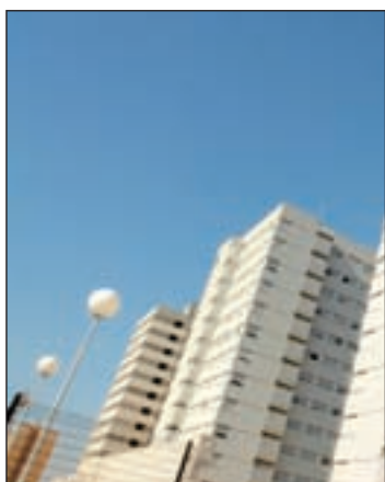
Imagen de archivo de un piso