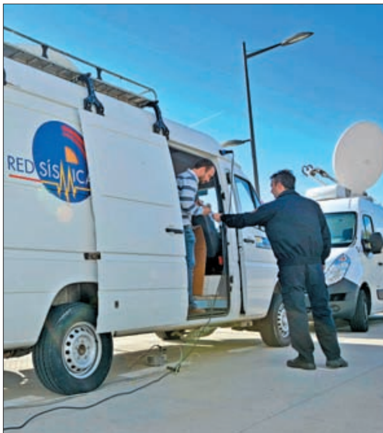
Sismógrafo situado en la zona

El producido en la mañana del pasado martes tan sólo tuvo una