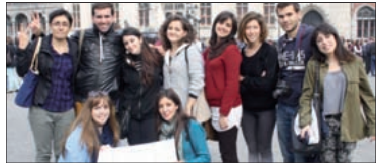
Alumnos del Programa Erasmus en Bruselas GENTE

afectados. A pesar del cambio, piden que se mantenga este complemento en próximos cursos. Ya han recogido 200.000 firmas.