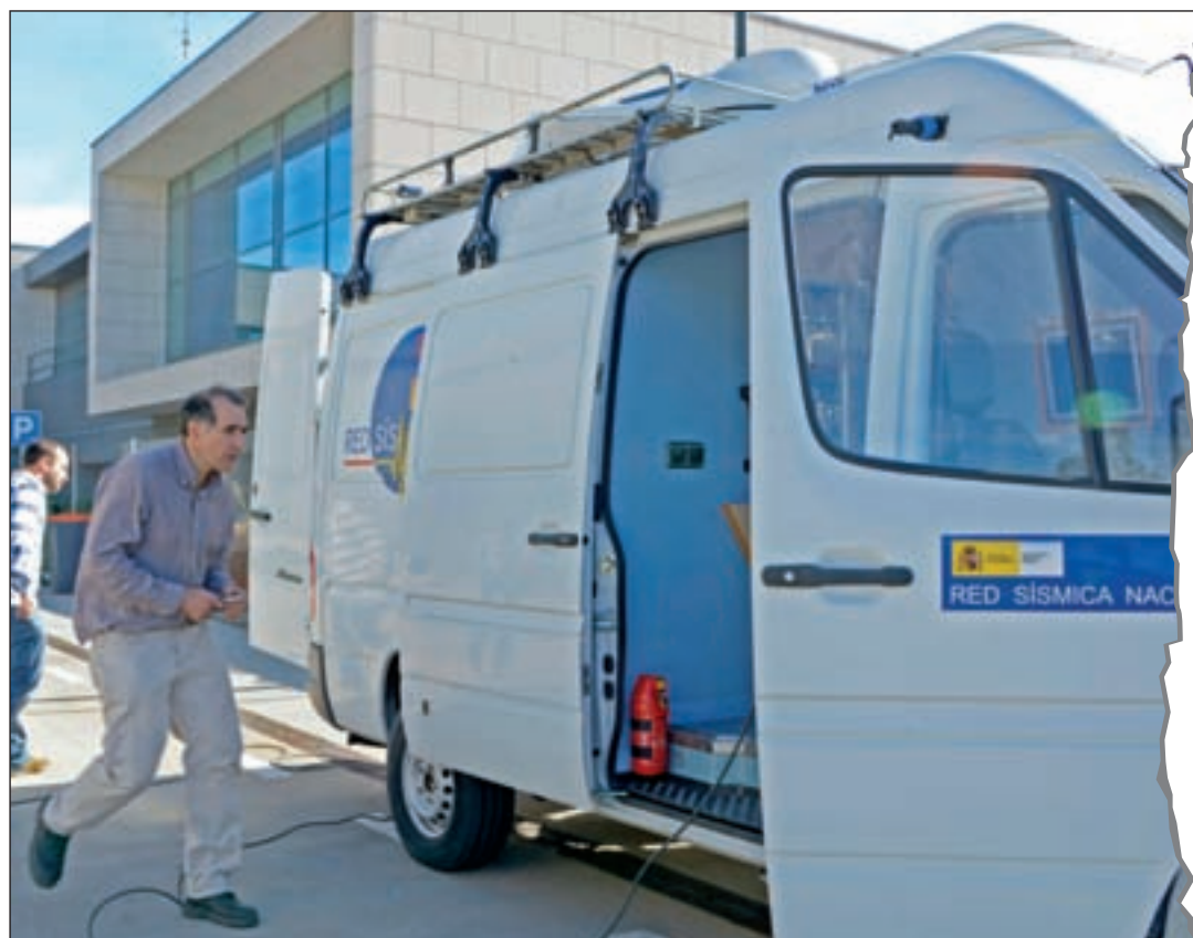
Sismógrafo situado en la zona

Los efectos del seísmo se pudieron sentir en Fuenlabrada • El Instituto Geográfico Nacional realizará mediciones las próximas semanas PÁG. 8