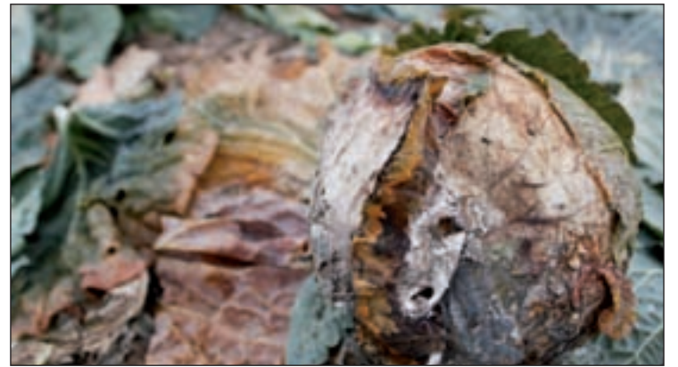
Imagen de archivo de verdura estropeada GENTE

Los datos publicados por el Sistema Nacional de Dependencia, Servicios Sociales e Igualdad, que facilita el Ministerio de Sanidad, revelan que "Madrid es la primera comunidad autónoma en atención en Centro de Día, siendo la región con mayor esperanza de vida de España con 83,7 años de media. Estando por encima de países como Japón o Suiza", señaló el consejero Salvador Victoria.