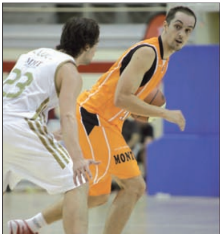
Imagen de archivo de Baloncesto

Así las cosas, este sábado a las 19 horas y en San Pablo será el turno para demostrar la valía del Fuenlabrada, aunque se enfrente a un rival que llega con energía renovada. Y es que, al contrario de lo que le pasó al equipo de Chus Mateo, los sevillanos sí destacaron por su juego y su buen resultado contra el Laboral Kutxa, consiguiendo su primer triunfo