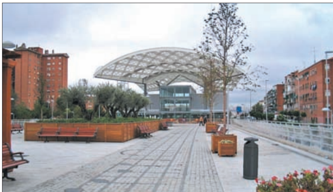
La zona estancial existente sobre las vías junto a la estación de Asamblea de Madrid

Según sus responsables, la iniciativa busca la colaboración de los vecinos, que pueden participar a través de las redes sociales por medio de fotografías que evidencien el derroche en el riego de jardines. La idea es elevar una propuesta a la Junta del distrito.