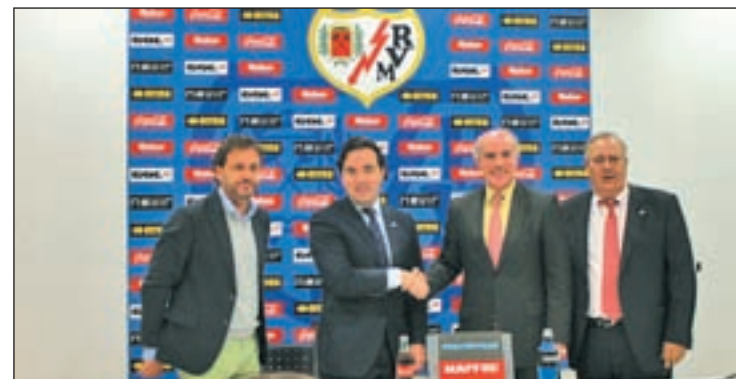
Un momento de la presentación de la actividad

Tendrá una frecuencia de dos sesiones semanales, lunes y miércoles no festivos, en horario de 19.00 a 20.30 horas para los nacidos entre 2004 y 2006. Y martes y jueves no festivos, en horario de 20.30 a 22.00 horas, para los nacidos entre 2000 y 2003.