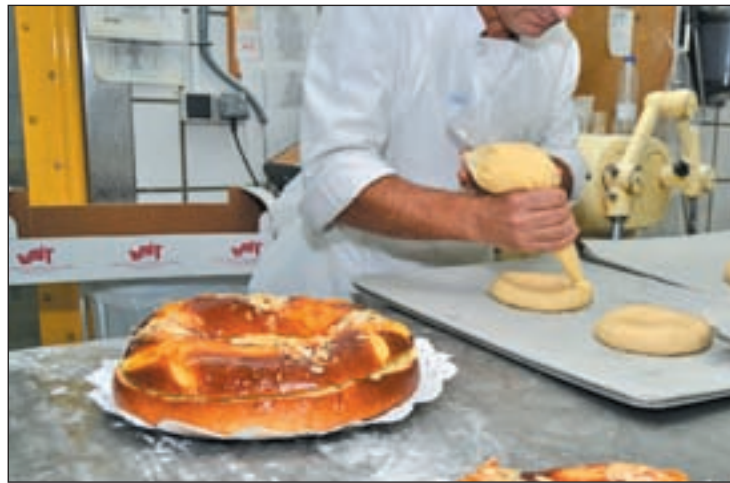
La Corona, durante su elaboración

A pesar de la cercanía con la temporada de buñuelos y huesos de santo, Ricardo asegura que el ritmo de producción de la Corona es bueno, especialmente en pastelerías del casco histórico. Lo que tampoco cambia es el relleno de este producto. Trufa, nata o cre-