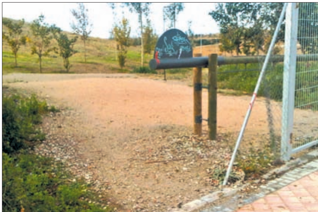
Un gran agujero en la alambrada es la entrada a la zona verde del Ensanche

En cualquier caso adelantan que, en la actualidad, la jardinería se está conservando, "como cualquier otro parque del distri-