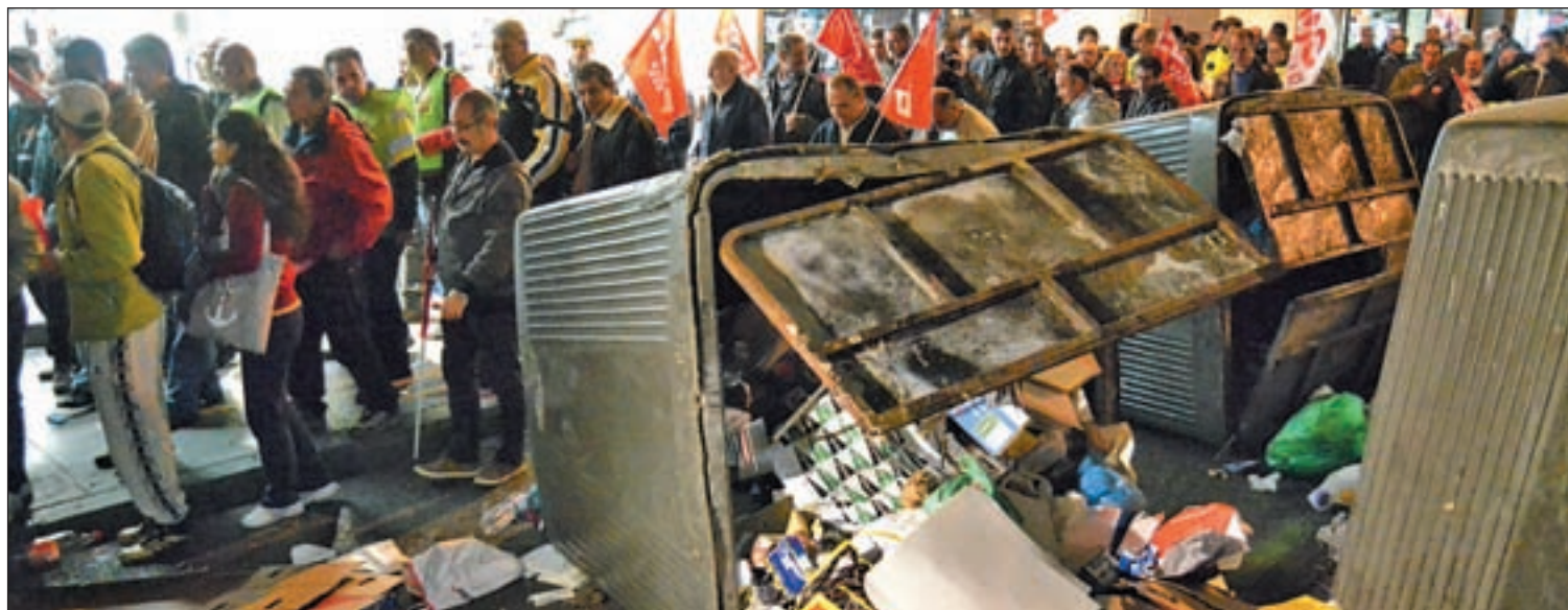
Los disturbios ocasionados en la manifestación que tuvo lugar en Sol el pasado 4 de noviembre

Pese a indicar que serán "las terceras Navidades sin el luminoso de Tío Pepe", ahora comienza "la cuenta atrás" para que vuelva a lucir en la Puerta del Sol de Madrid y continúe formando "parte de la imagen de la ciudad", especialmente en periodo navideño.