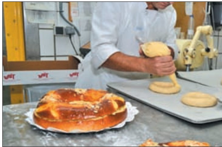
La Corona, durante su elaboración

A pesar de la cercanía con la temporada de buñuelos y huesos de santo, Ricardo asegura que el ritmo de producción de la Corona es bueno, especialmente en pastelerías del casco histórico. Lo que tampoco cambia es el relleno de este producto. Trufa, nata o cre-