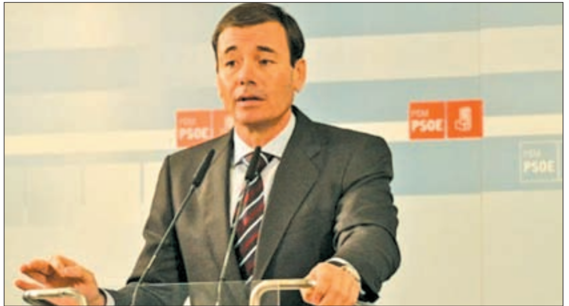
El secretario general del PSOE madrileño, Tomás Gómez

En este sentido, plantean una nueva ley de sanidad que “impida experimentos de negocio y privatización”. Además, Gómez aseguró que van a defender el sistema público y de reparto de pensiones porque están en contra de medidas que obliguen a las personas a abrir planes de pensiones privados. El líder del PSM insistió también en la importancia de una reforma fiscal “que haga de España un país más justo”, donde se impidan las bonificaciones a los que más tienen y se implante un im-