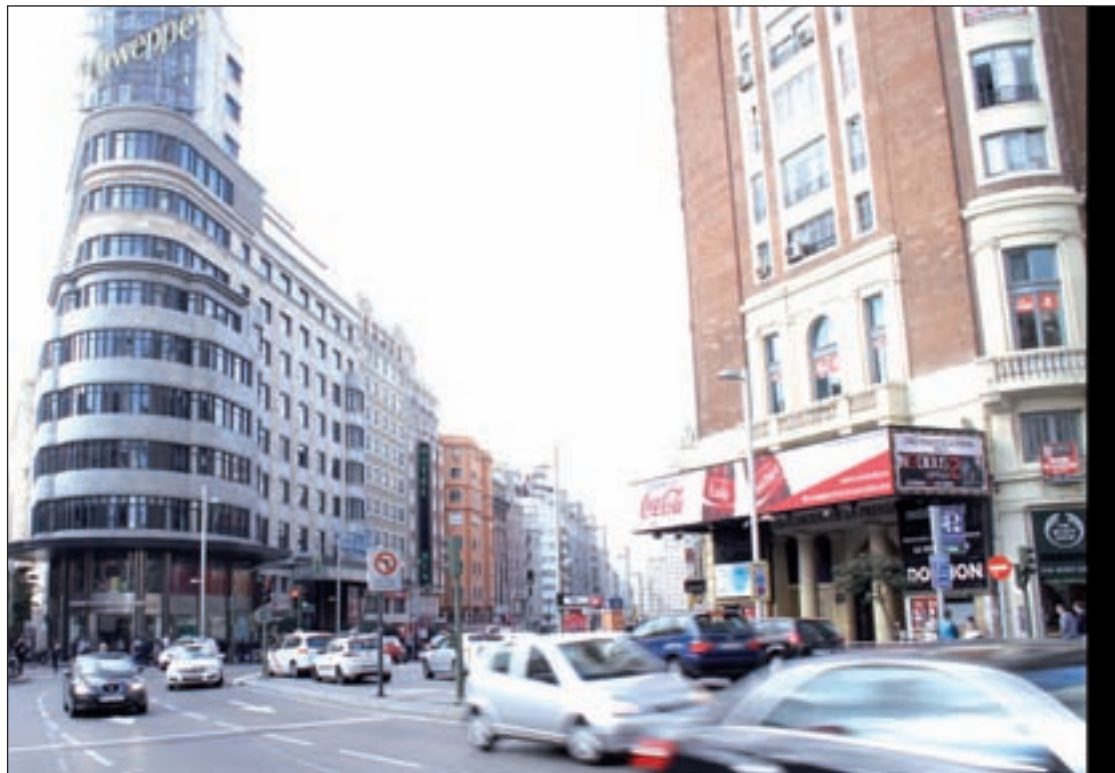
El famoso rótulo de Schweppes recupera su protagonismo

Sin embargo, todo este repertorio visual no irá única y exclusivamente en favor de la imagen de los propios establecimientos. La Junta de Gobierno ha acordado también que las pantallas comerciales dediquen el 75% del tiempo de emisión a sus propias campañas y el 25% restante a la promoción de la ciudad, su agenda cul-