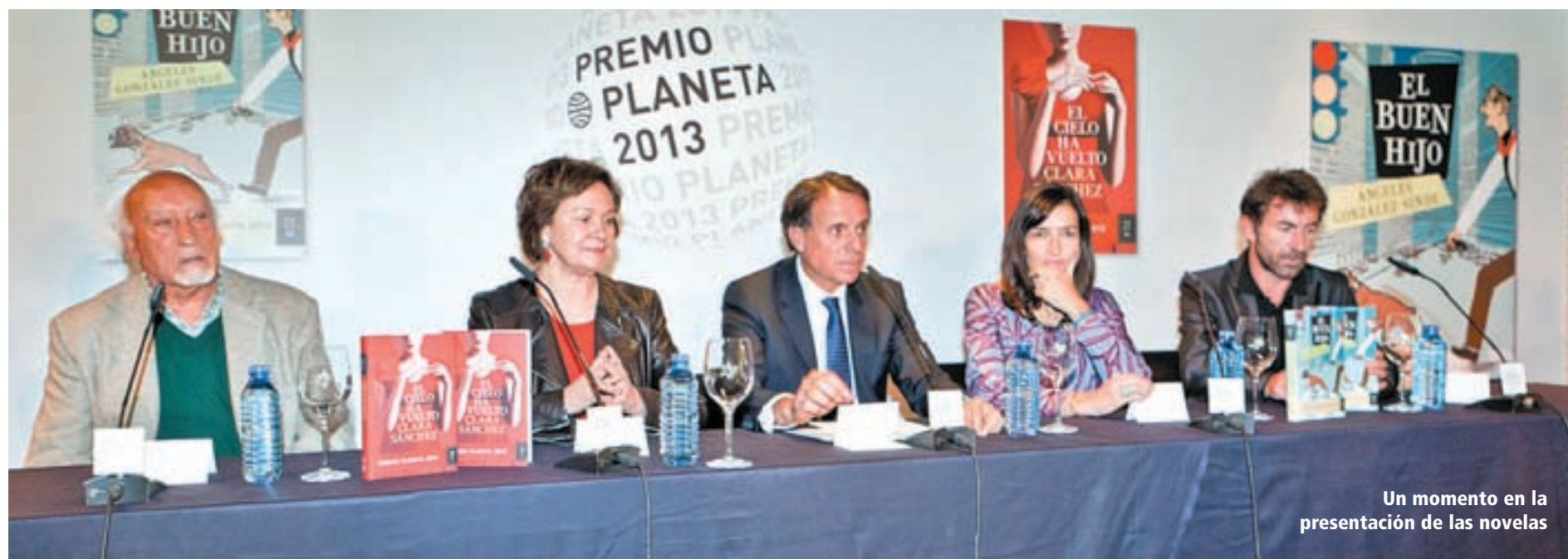
Un momento en la presentación de las novelas