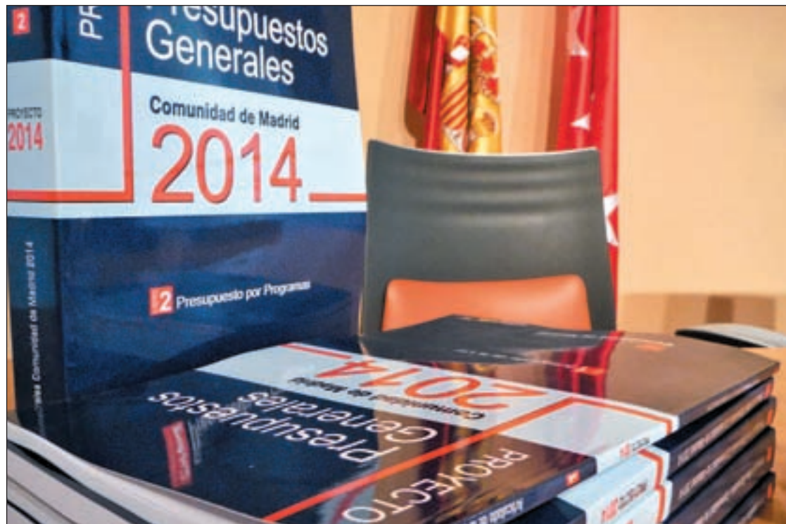
Los Presupuestos se presentaron el pasado martes 29 de octubre