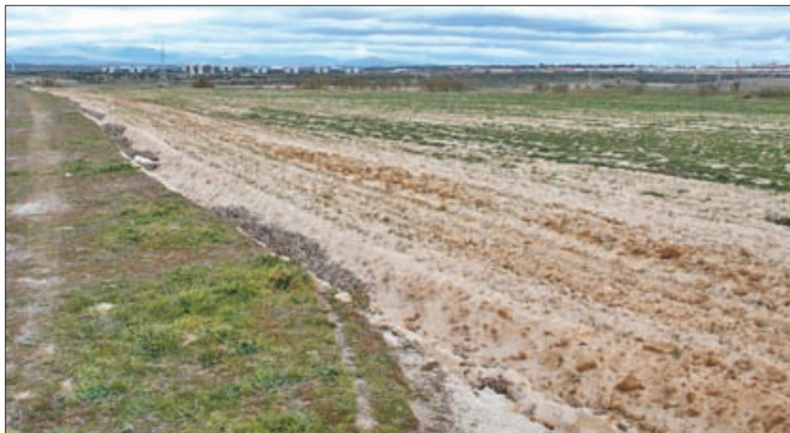
Los terrenos de Alcorcón están preparados para empezar a construir

Metro de Madrid y los sindicatos alcanzaron el pasado viernes un "preacuerdo" para cerrar el convenio colectivo hasta finales de 2015, que deberá ser ratificado en asamblea de trabajadores. En este preacuerdo se establece la congelación salarial para los trabajadores de Metro durante 2013 y 2014, así como una "posible subida salarial" en el año 2015 de un 0,6%, ligada a medidas de productividad, siempre y cuando, en ese año, la compañía obtenga beneficios y la Ley de Presupuestos de la Comunidad de Madrid lo permita. Además, no se contratarán nuevas incorporaciones mientras esté vigente el convenio.