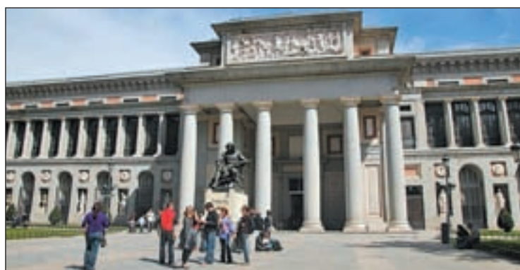
Una de las entradas del museo