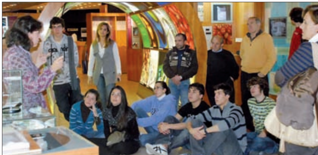
La Semana de la Ciencia está dirigida principalmente a los más jóvenes

En esta edición contará con seis grandes áreas temáticas: 'Calidad de vida, salud y alimentación', 'Energía, medio ambiente y desarrollo sostenible', 'El espacio, territorio y transportes', 'Sociedad de la información y las comuni-