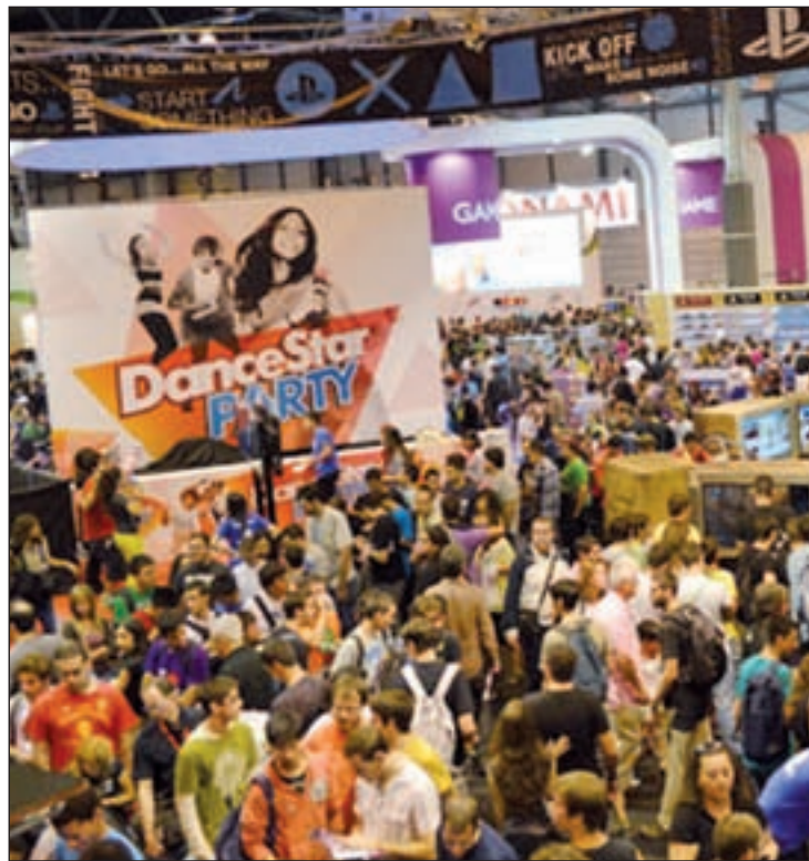
Miles de jóvenes podrán probar los nuevos juegos

Madrid Games Week contará con la presencia de grandes firmas como Activision-Blizzard, Electronic-Arts, GAME, Microsoft, Namco bandai, Nintendo y Sony Computer Interteiment. Además, los asistentes podrán conocer las últimas novedades puestas en marcha en nuestro país, gracias a la presencia de MadeInSpain Games, una selección de desarrolladores independientes españoles. La firma, que ha sido parte del jurado en la Global Game Jam de