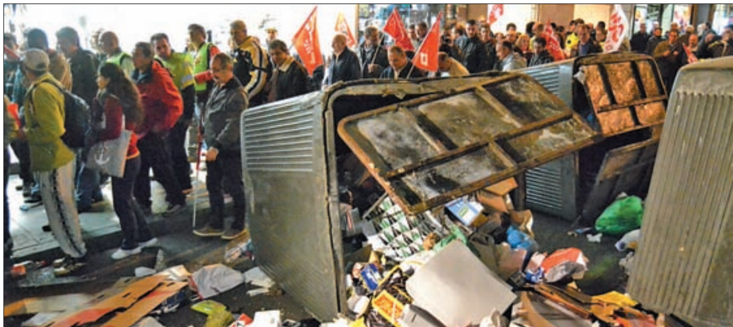
Los disturbios ocasionados en la manifestación que tuvo lugar en Sol el pasado 4 de noviembre

Pese a indicar que serán "las terceras Navidades sin el luminoso de Tío Pepe", ahora comienza "la cuenta atrás" para que vuelva a lucir en la Puerta del Sol de Madrid y continúe formando "parte de la imagen de la ciudad", especialmente en periodo navideño.