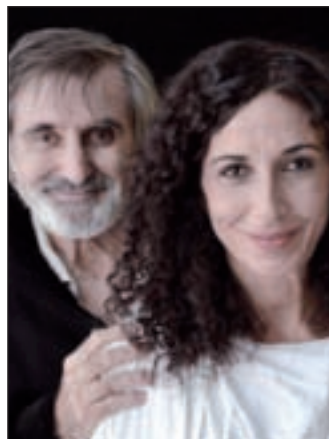
Protagonistas de la obra