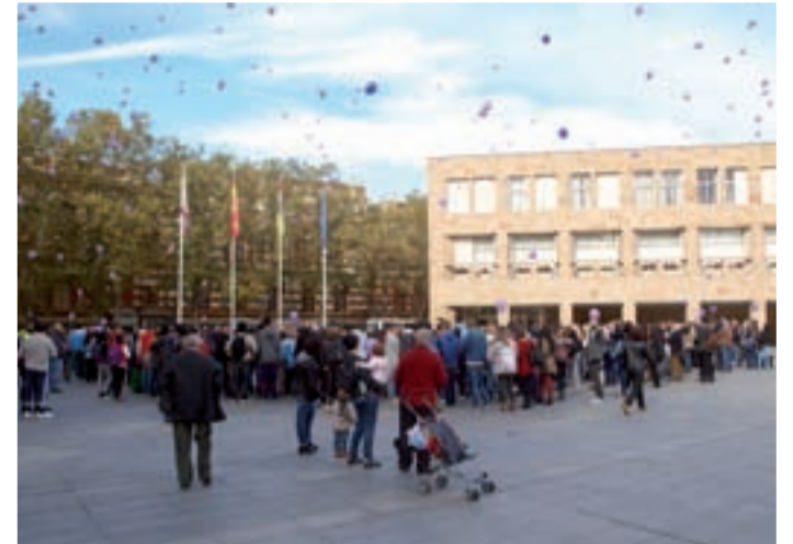
Suelta de globos en la concentración mensual.