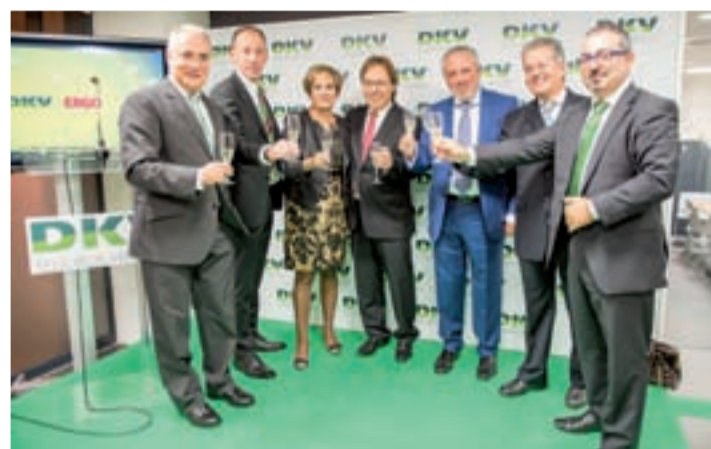
Inauguración de la sucursal en Logroño.