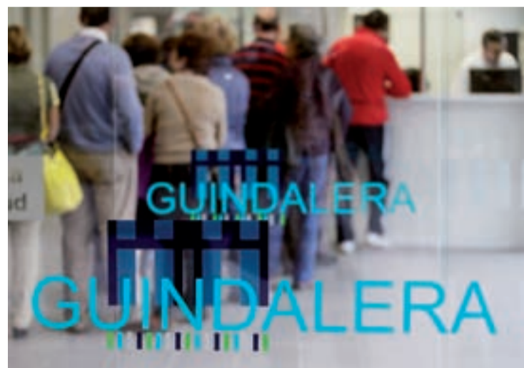
Centro de Salud La Guindalera de Logroño.

Según un comunicado de la Consejería de Salud, los pacientes que se acercaron el primer día de apertura recibieron las informaciones administrativas, o la atención sanitaria por parte de los profesionales, si bien las cuestiones burocrá-