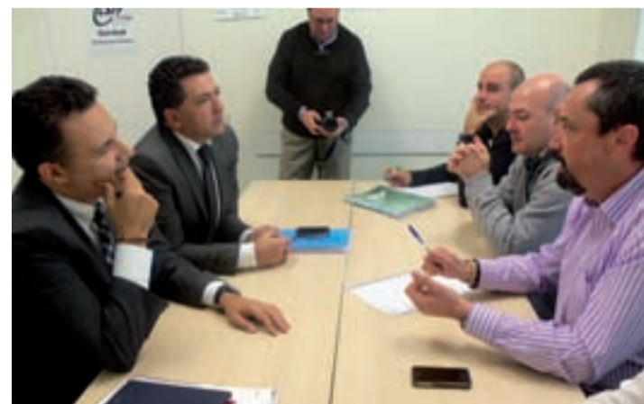
Reunión en la sede del CSIF con dirigentes del PP.