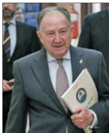
Felix Sanz Roldán

de Seguridad Nacional (NSA) de Estados Unidos ni a ningún otro servicio de inteligencia extranjero datos relevantes que no estén en los asuntos que ya tienen acordados, como son la lucha contra el terrorismo, el crimen organizado o el cibercrimen.