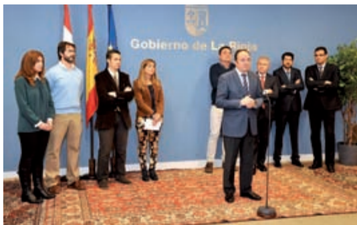
Nuevas empresas que se unen a la iniciativa.