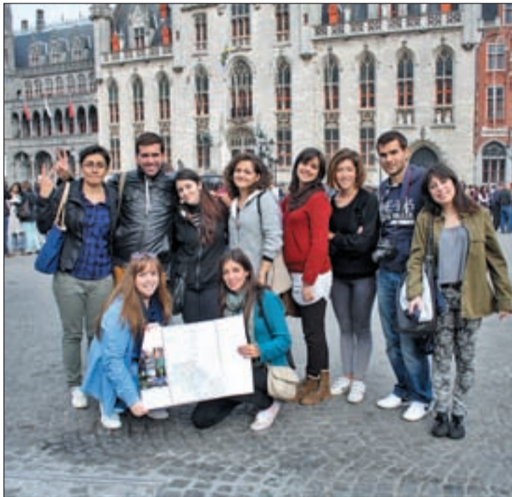
Alumnos del programa Erasmus en Bruselas

Sin embargo, el martes, el Gobierno daba marcha atrás después de las denuncias de la comunidad educativa y la advertencia de la Comisión Europea. “Hemos entendido que el resto de los becarios, los que no