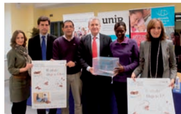
Presentación de la Olimpiada Solidaria.