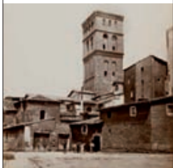
Plaza de San Bartolomé, siglo XIX.