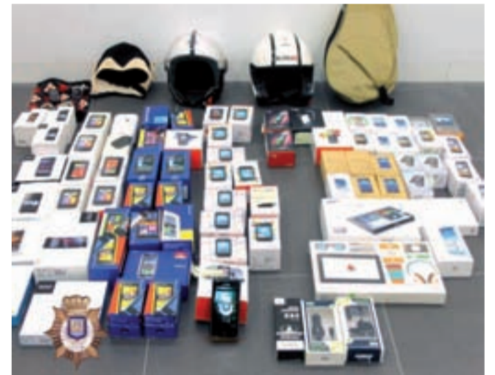
Material incautado en la operación.