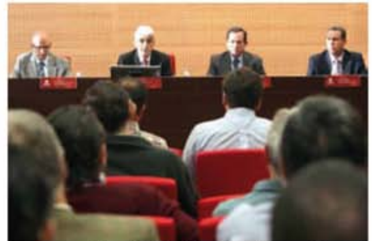
Encuentro entre Universidad de La Rioja y Clúster de Automoción.