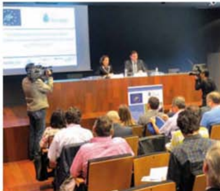
Inauguración de la Conferencia Internacional.

El Gobierno de La Rioja "está empeñado en lograr la máxima eficiencia en el uso del agua que se emplea en las cerca de 50.000 hectáreas de regadío con las que