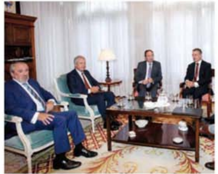
Primera reunión entre los presidentes de las comunidades.

control de lo acordado se constituirá una Comisión de seguimiento que estará compuesta por cuatro personas, dos de la Comunidad Autónoma de La Rioja y las otras dos de la Comunidad Autónoma del País Vasco.