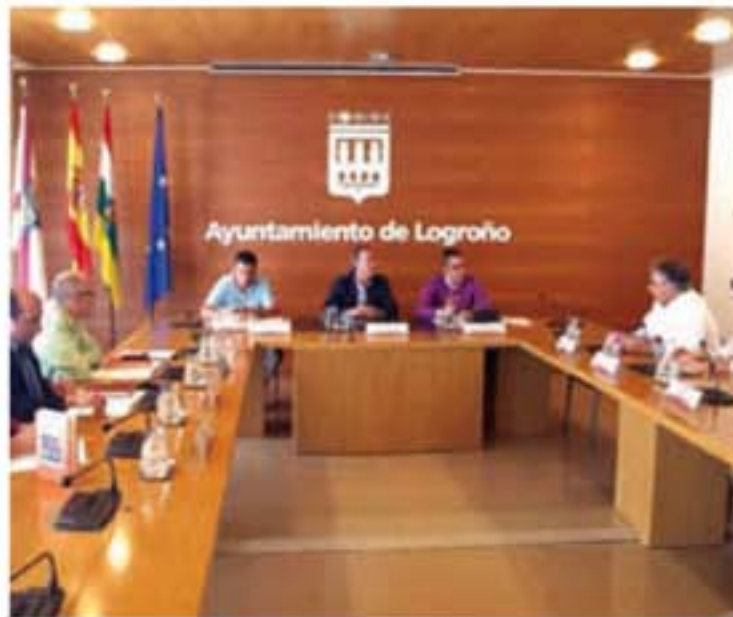
Reunión del Consejo Social de la Ciudad.

Respecto a las ayudas directas al alquiler, para paliar las dificultades para encontrar un nuevo hogar de aquellas personas que lo han perdido a causa de un desahucio, en la convocatoria de este año se han concedido ya 20,