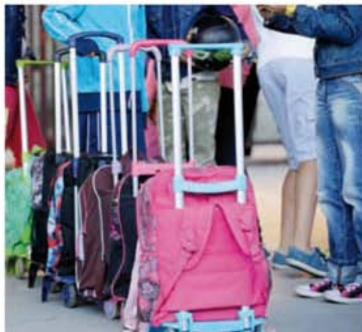
Primer día de clase para los escolares riojanos.

que el nuevo curso comienza en La Rioja con un incremento de escolarizaciones del 0,88%. Por niveles, el aumento de matrículas es especialmente destacable en la Formación Profesional (un 6,88% en los ciclos de Grado Medio y un 4,33% en los ciclos de Grado Superior). "El Gobierno de La Rioja ha respondido inmediatamente a esta demanda y ha dotado a la Formación Profesional de los recursos necesarios para conseguir un aumento de plazas significativo; en concreto, de 282 plazas". Asimismo, indicó que con el mismo objetivo de