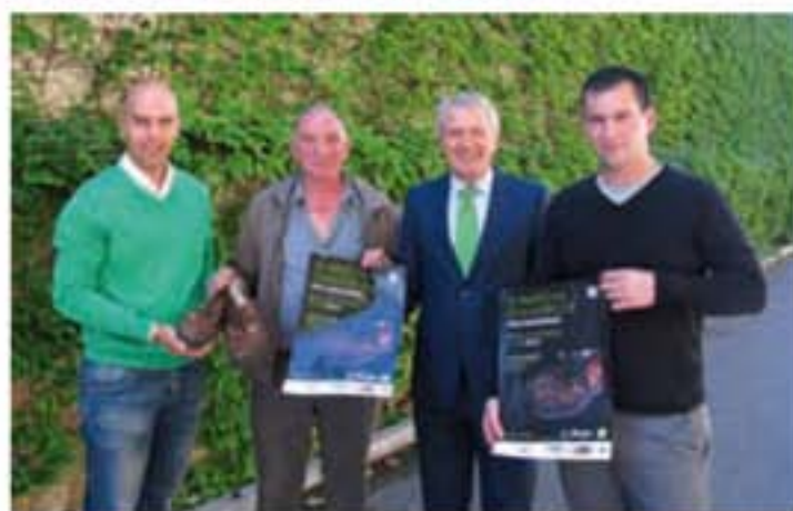
Presentación de la III marcha.