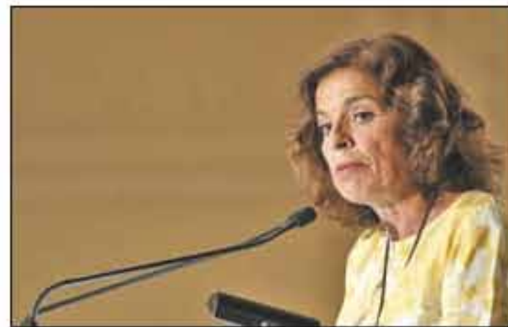
La alcaldesa de Madrid, Ana Botella

Pero Botella sí lo ha dejado claro este jueves. Piensa que Madrid no deba buscar la celebración de los Juegos Olímpicos