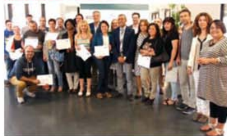
Entrega de diplomas acreditativos.