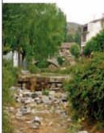
Vista de su pueblo natal.

Ha costado un poco, pero por fin se ha reconocido la labor del camerano Manuel García Herreros Sáenz de Tejada. Digo que ha costado un poco, porque por fin le han dedicado, en nuestra capital, una plaza a este ilustre político riojano que tuvo una destacada participación en la redacción de la Constitución de Cádiz, en 1812. Al abolirse dicha Constitución y dado su carácter liberal, tuvo que exiliarse en Francia por reformista y liberal. Don Manuel nació en San Román de Cameros en 1767 y fue todo un personaje de la época. Además de diputado fue ministro de Gracia y Justicia en el primer tercio del siglo XIX, poco antes de su fallecimiento. Es de destacar su implicación en la abolición de los señoríos territoriales y sobre todo, del Tribunal de la Inquisición, estamento que como bien demostró en una sesión de Cortes en 1913 no tenía ya ningún sentido dentro de los estados modernos que se empezaban a construir en Europa. La plaza está entre el paseo de la Constitución y las calles Senado y Congreso. No es muy grande, pero creo que es el sitio ideal dado la nomenclatura de dichas calles. La iniciativa de este homenaje surgió de la Asociación de Amigos de San Román de Cameros, asociación que está realizando numerosas actividades a lo largo de estos últimos años, como ediciones de libros o concursos de pintura, todos ellos relacionados con uno de los pueblos más bellos y mejor cuidados de la sierra camerana.