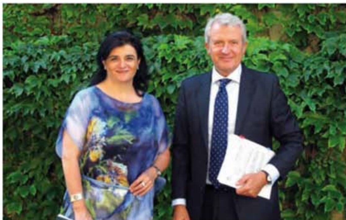
Concepción Arruga, consejera de Administración Pública y Hacienda y Emilio del Río, consejero de Presidencia y Justicia.

Entre otras muchas cuestiones que responden a la gestión interna, se incrementa el control financiero de la Intervención General; se obliga a utilizar medios electrónicos en la tramitación interna de elaboración de los presupuestos; se prevé la colaboración tributaria con las entidades locales, y se asienta la constitución del Tribunal Económico-Administrativo de la Rioja dejando la regulación relativa a su organización y funcionamiento a un futuro desarrollo reglamentario. El proyecto de Ley regula también cuestiones relativas a las subvenciones públicas, como las obligaciones de beneficiarios y entidades colaboradoras, efectos del silencio administrativo y el régimen sancionador por faltas cometidas por los beneficiarios de las mismas.