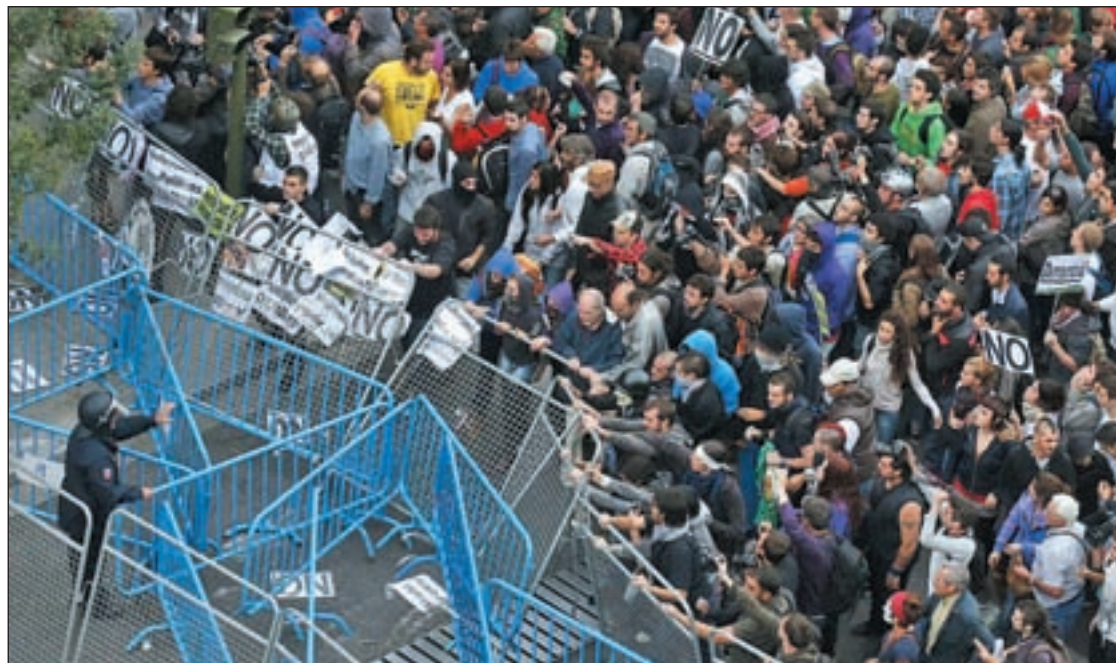
Una concentración como Rodea el Congreso podría tener sanciones de hasta 600.000 euros

"Es una vuelta de tuerca. Intentan amedrentarnos e imponer la ley del miedo. Es una salida autoritaria. El PP tiene un problema con la democracia y los Derechos Humanos y lo están acreditando en la legislación. Es una ley mordaza para callarnos la boca", aseguró el asesor jurídico de la Pla-