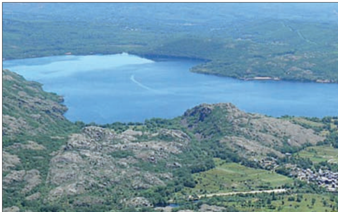
Dos informes avalan el buen estado del lago