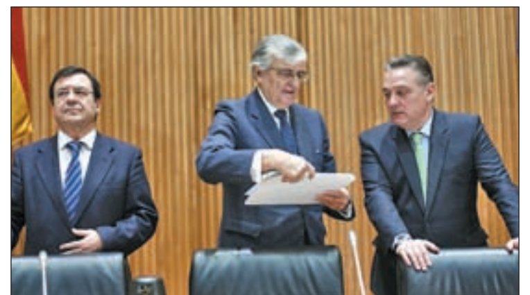
El fiscal general del Estado, Eduardo Torres-Dulce, en el Congreso

Además, el fiscal general destacó que únicamente el 7% del presupuesto tecnológico del Ministerio se destina a los órganos fiscales.