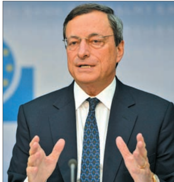
Mario Draghi, presidente del Banco Central Europeo

Sin embargo, el BCE y la Comisión alertan de que, a pesar de la evolución positiva, "el entorno económico sigue pesando en el