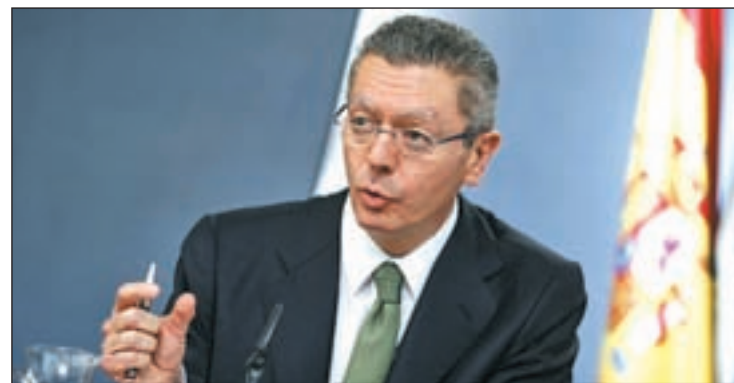
Alberto Ruiz Gallardón, ministro de Justicia

De hecho, Ruiz Gallardón subrayó que pocas veces ha habido un órgano de gobierno de los jueces que cuenten con tanto consenso y aseguró que el nuevo Consejo marcará "un antes y un después" en el Poder Judicial.