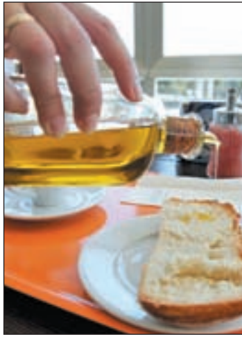
La norma será efectiva en 2014

La medida establece que los aceites puestos a disposición de los clientes deben estar etiquetados, contar con un sistema de apertura que pierda su integridad tras su primera utilización y disponer de protección que impida su rellenado una vez agotado su contenido original. Sin embargo, contempla también la posibilidad de utilización de las existencias de productos adquiridos antes de su entrada en vigor.