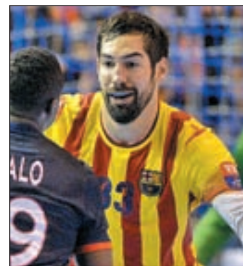
Karabatic, estrella del Barça

Más delicada es la situación del Naturhouse La Rioja. A pesar de ocupar la segunda plaza en la