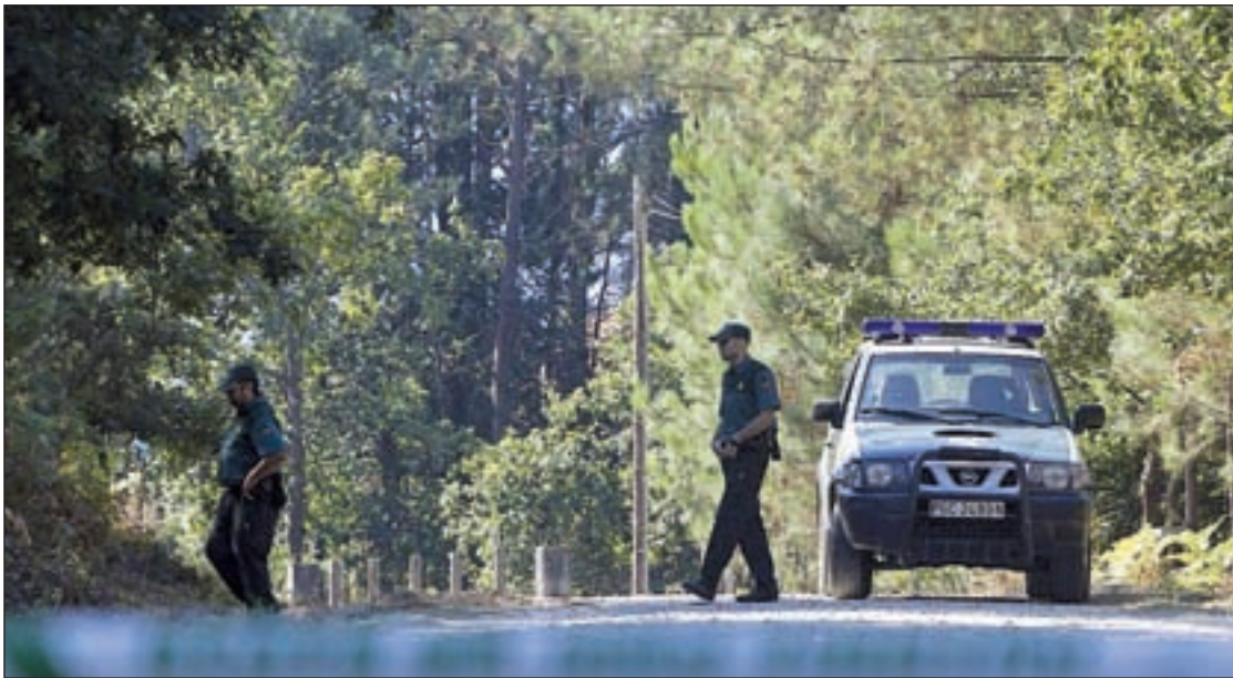
Asunta Basterra apareció en una pista forestal de la localidad coruñesa de Teo