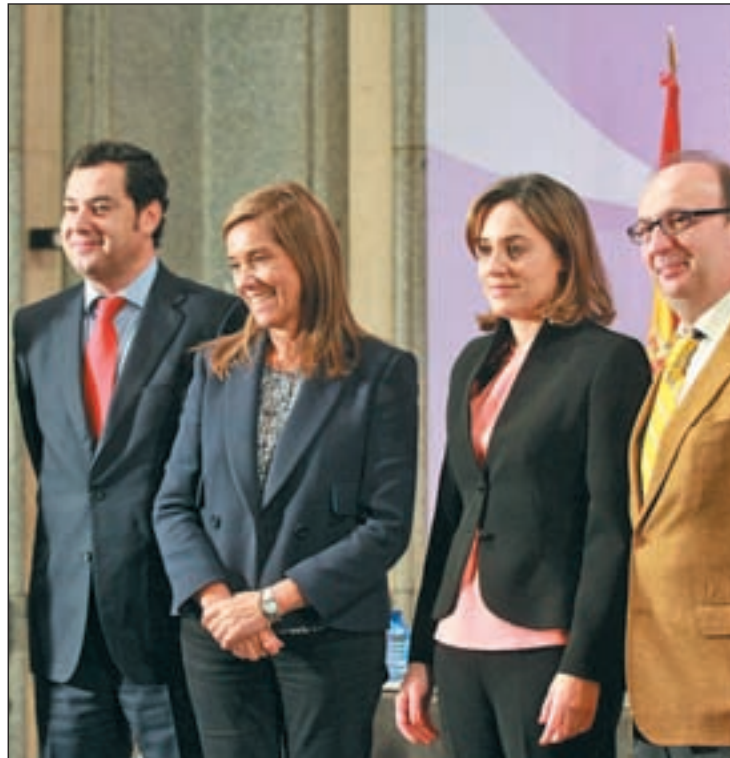
La ministra, Ana Mato, en la presentación de los dos estudios

Los estudios señalan que las nuevas tecnologías facilitan que los agresores alcancen a sus víctimas sin tener contacto directo con ellas y que suponen también una dificultad para terminar una relación de pareja. Además, aseguran que los estereotipos tradicionales en las relaciones entre hombres y mujeres se proyectan en Internet y las redes sociales.