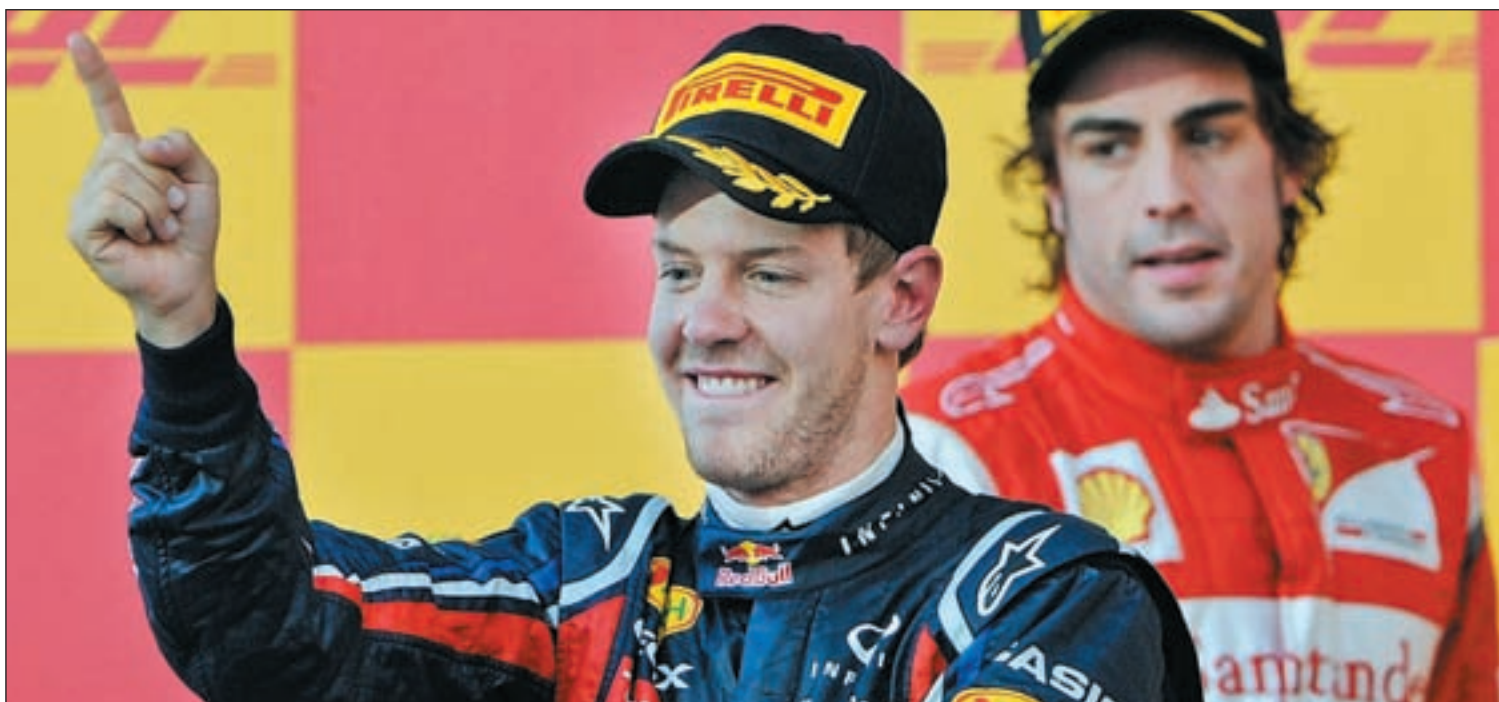
Sebastian Vettel hizo historia en Austin al sumar su octava victoria consecutiva