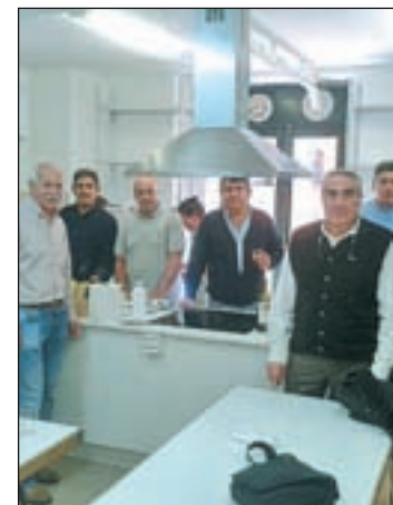
El centro Gloria Fuertes