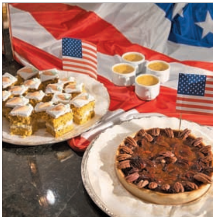
Una selección de los platos que ofrecerá el hotel InterContinental

Esta fiesta se celebra el cuarto jueves de noviembre en Estados Unidos y tenía como origen agradecer la buena cosecha en los campos. Hoy, se festeja con un