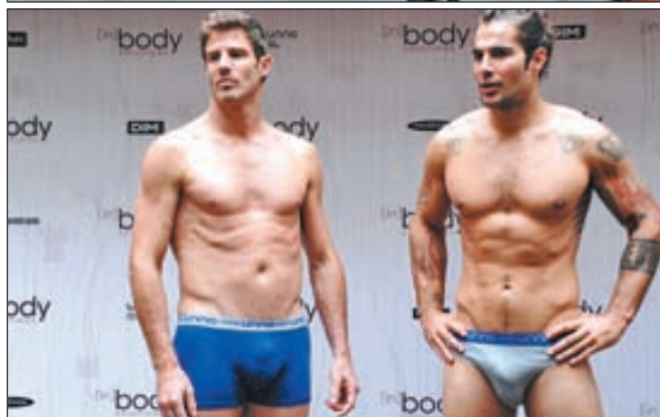
PRENDAS MASCULINAS Y FEMENINAS Las medias de DIM que lucen las modelos en la imagen de arriba son perfectas para este invierno. Los chicos visten prendas de la nueva línea 'low cost' Unno Smart Comfort.

para esculpir la figura con total invisibilidad, es decir, prendas con efecto modelador, adelgazante, reductor y anticelulítico. Los chicos también encontrarán la opción que mejor se adapta a la actividad que quieran realizar con una amplia selección de camisetas, boxers, slips y shortys para un resultado, sobre todo, cómodo.