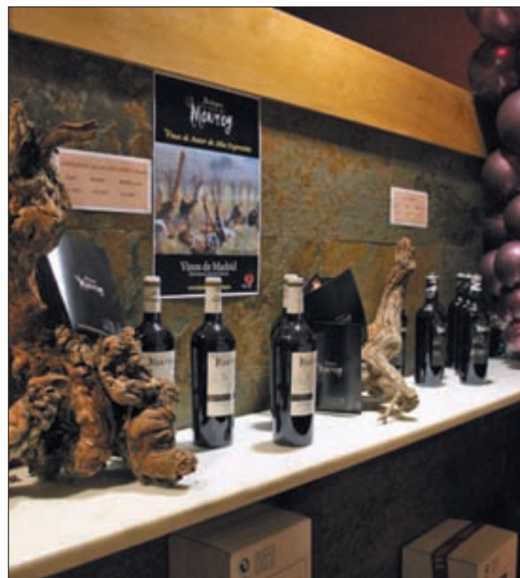
Ruta de vinos en Conde Duque

Además, muchas de las bodegas han preparado presentaciones para dar a conocer de primera mano las características de los vinos y su proceso de elaboración. Todas las actividades están abiertas al público con la única limitación del aforo y, en el caso de las presentaciones y maridajes, la necesidad de realizar reserva previa. Más información en las páginas