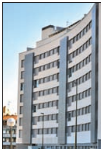
Comienzan los realojos GENTE

Inicialmente, el proceso se cifró en 176.500 euros, cantidad que incluía la demolición, urbanización y ejecución de dos edificios para el realojo de los vecinos. Unos 76.000 metros cuadrados se destinarían a suelo de vivienda li-