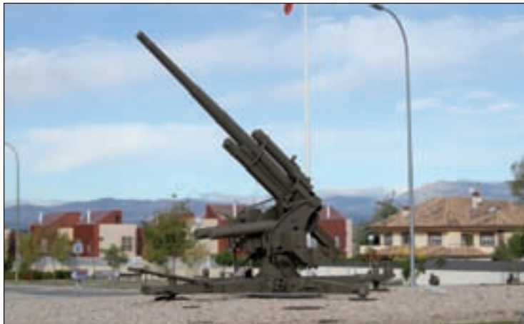
La estatua, en la glorieta de la artillería antiaérea

El propio González argumenta que el cañón “es un elemento característico de la artillería”, cuya finalidad era “proteger de los ata-