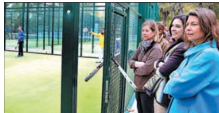
Figar visitó el parque deportivo Puerta de Hierro

ofrece a los padres de los niños participantes una oferta deportiva paralela para propiciar la conciliación del deporte en familia, que ha cosechado una gran aceptación. Para el desarrollo correcto de estas actividades, el Gobierno regional ha invertido 16 millones en estas instalaciones.