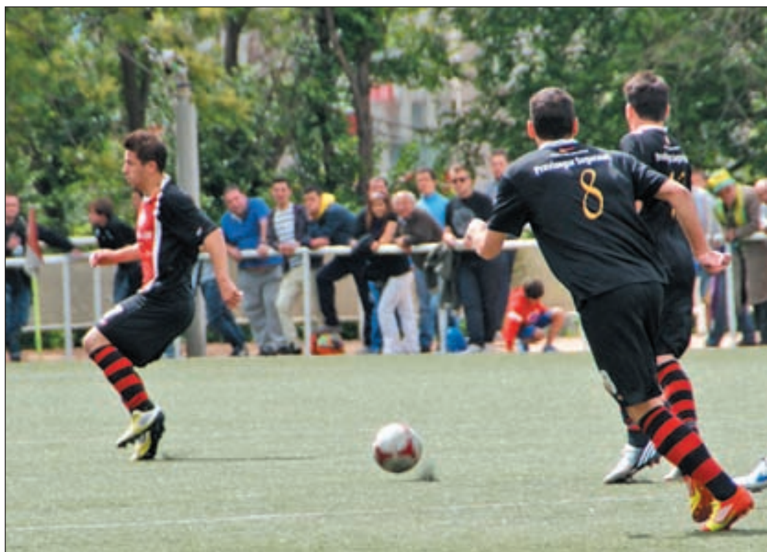
El Unión Adarve no quiere dejarse más puntos en su campo GENTE

Con estos resultados, el Unión Adarve tiene una ventaja de tres puntos respecto a su próximo ri-