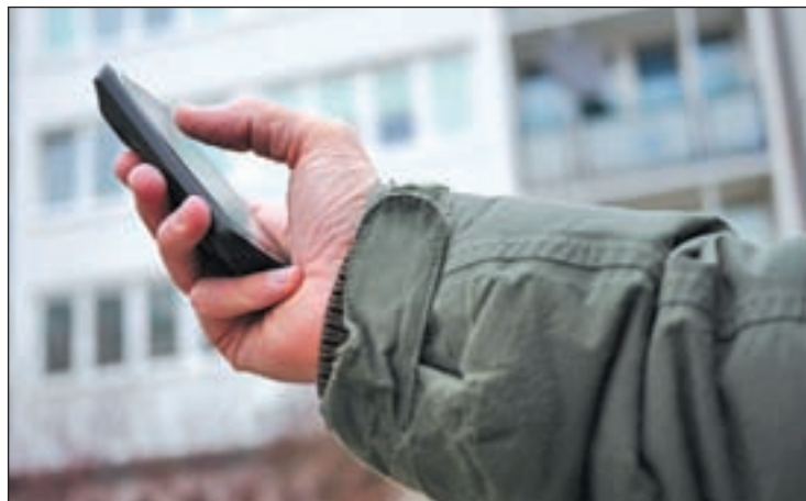
Son frecuentes las quejas a las compañías GENTE

Lara explica que, en su caso, “desde hace un año finalizó mi contrato de permanencia con Oran-