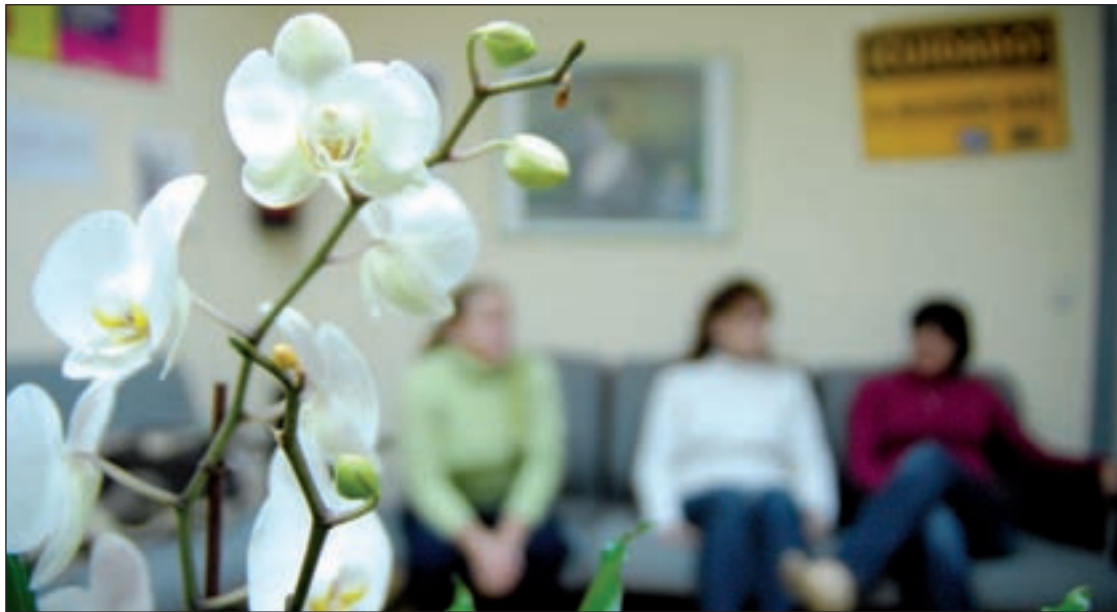
El proyecto está pensado para mujeres que llevan tiempo fuera del mercado laboral GENTE