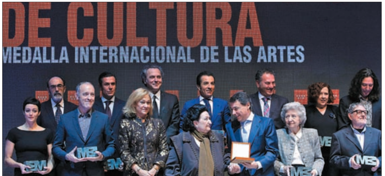
Los premiados junto al presidente de la Comunidad de Madrid, Ignacio González

El Consejo de Gobierno ha aprobado el proyecto de Ley de Medidas Fiscales y Administrativas para 2014. La norma contempla actuaciones contra los 'taxis piratas', rebaja a 18 años y eleva a 40 el límite de edad para acceder al Cuerpo de Policías Locales, contempla una gran rebaja fiscal que ahorrará a los madrileños 1.110 euros de media, mantiene las deducciones a familias numerosas, gastos escolares, emprendedores o alquiler de jóvenes; profundiza en la disminución del sector público; y aumenta la protección de los consumidores, incluyendo como infracción el 'acoso telefónico' y las falsas revisiones de gas.