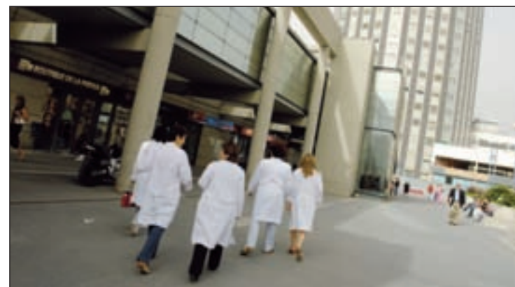
Madrid tiene una ratio de 602 enfermeros por cien mil habitantes

100.000 habitantes), Castilla y León (645,01), Melilla (633,94), La Rioja (617,54), Aragón (614,87), Madrid (602,84), Cantabria (590,01) y Cataluña (574,97). Por debajo de la media nacional se situarían Galicia (506,28), Baleares (481,99), Valencia (481,21), Canarias (446,80), Murcia (378,78) y Andalucía (375,78).