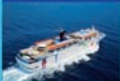
Buque Grand Holiday

TARJETA REGALO del 10% (5) Barcelona - Marsella - Villefranche, Mónaco - Savona - La Spezia, Florencia / Pisa - Civitavecchia, Roma - Barcelona desde 259€