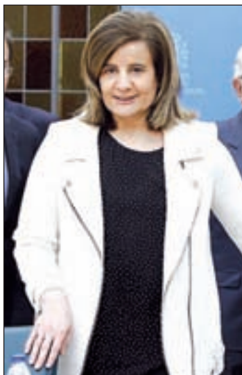
La ministra Fátima Báñez

"Lo que vamos a hacer, y lo hemos anunciado en el Plan Nacional de Reformas, es realizar ajustes para mejorar la contratación. Ya hemos anunciado que simplificaremos los modelos de 42 formularios a tres o cuatro para favorecer el empleo. Y haremos algunos cambios anunciados tam-