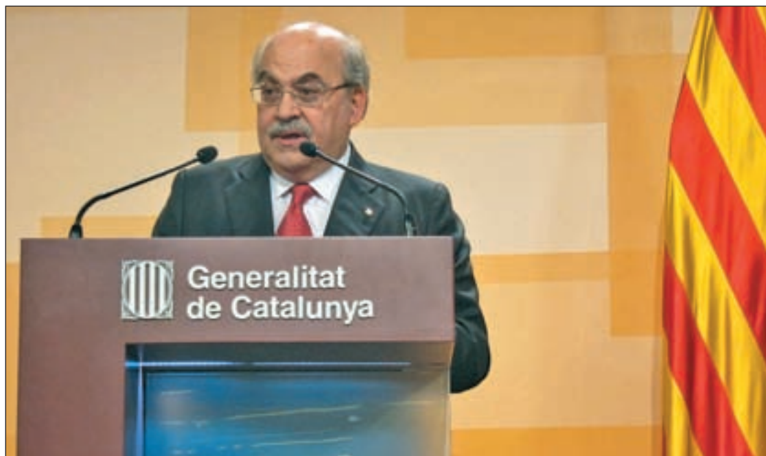
El consejero de Economía catalán, Andreu Mas-Colell, amenazó con un conflicto institucional

El resto de las comunidades rechazaron de plano la ley porque, a su juicio, no respeta el reparto competencial que la Constitución señala entre el Estado y las Comunidades, por lo que varios de ellos han anunciado un recurso de inconstitucionalidad.