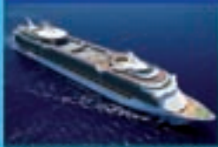
Buque Liberty of the Seas

TARJETA REGALO del 5% (9) Hasta 200€ de DESCUENTO por camarote Barcelona - Marsella - Villefranche, Niza / Mónaco - La Spezia, Florencia / Pisa - Civitavecchia, Roma - Nápoles - Barcelona desde 899€