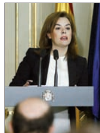
Soraya Sáenz de Santamaría

Por ello, Cospedal anunció que su partido pedirá a la Fiscalía que "revise la contabilidad", que se encuentra ya en el juzgado, para que pueda ver con "claridad" todos los pagos efectuados.