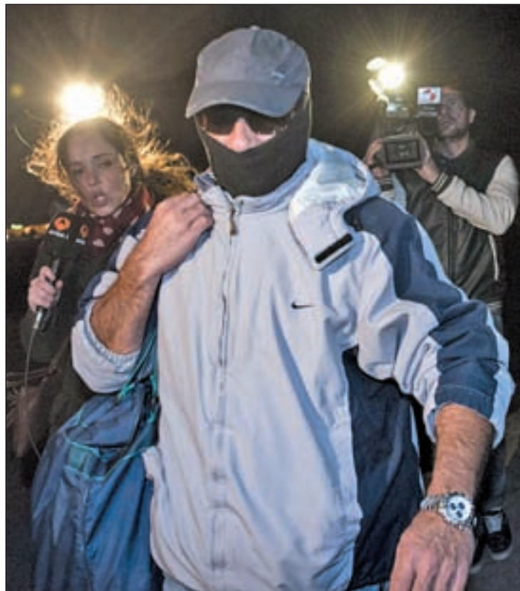
El violador del ascensor, uno de los excarcelados

Por el momento, la Audiencia de Valencia no ha tomado ninguna decisión, aunque solicitó escritos de todas las partes del pro-