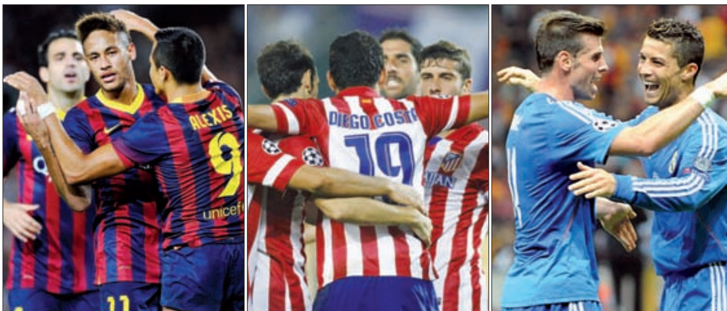
Neymar, Alexis Sánchez, Diego Costa y Cristiano Ronaldo, los representantes ofensivos de los aspirantes