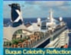
Buque Celebrity Reflection

TARJETA REGALO del 5% (8) Civitavecchia, Roma - Santorini - Estambul (2 días) - Ruzdías, Ébese - Mykonos - El Pireo, Atenas - Nápoles - Civitavecchia, Roma desde 1.599€