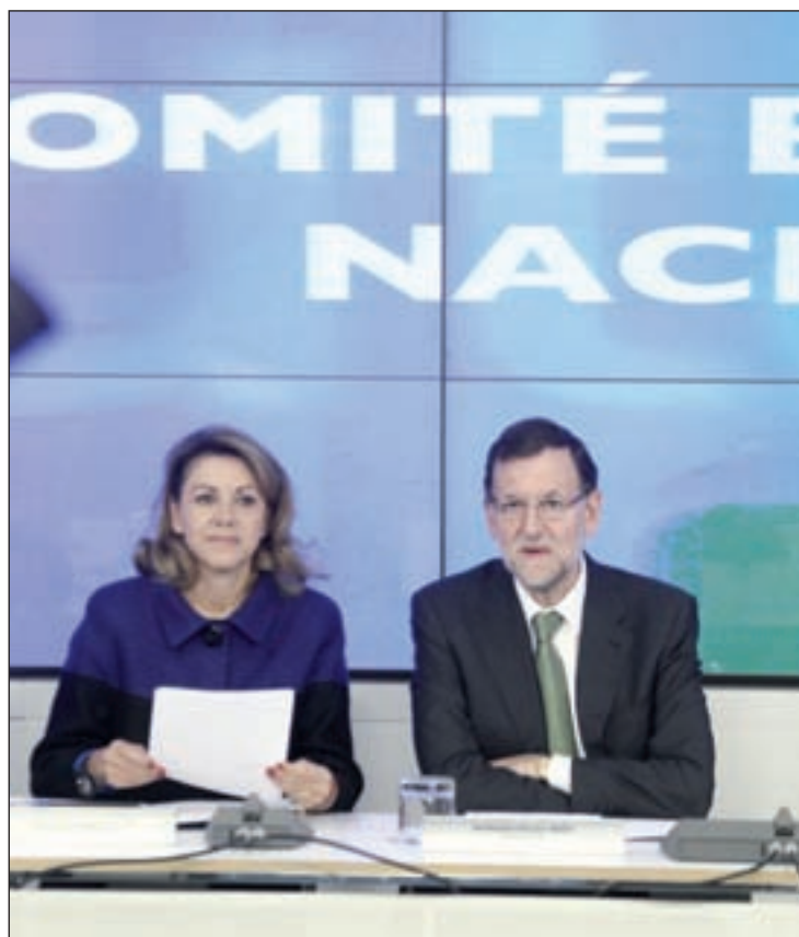
Rajoy y Cospedal, en el Comité Ejecutivo Nacional del PP