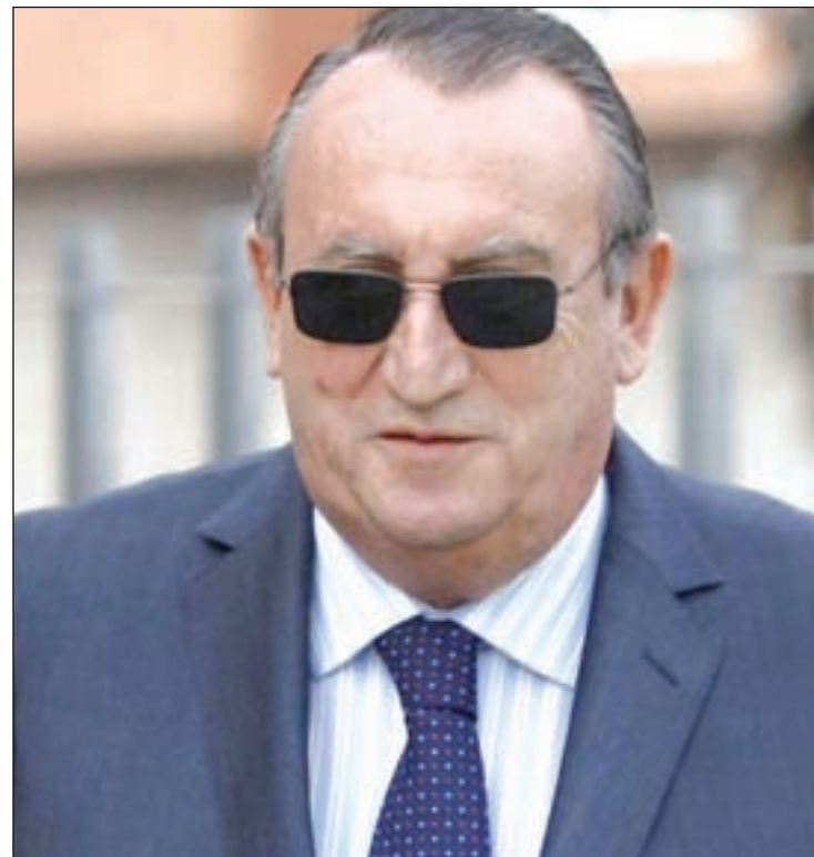
Carlos Fabra, expresidente de la Diputación de Castellón

Esa ocultación dio lugar a que el exdirigente del PP defraudara 693.074,33 euros correspondientes a 1999, 2000, 2002 y 2003; y