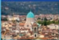
Buque Norwegian Epic

TARJETA REGALO hasta 5% (11) Barcelona - Nápoles - Civitavecchia, Roma* - Livorno, Florencia / Pisa - Cannes - Palma de Mallorca - Barcelona desde 634€