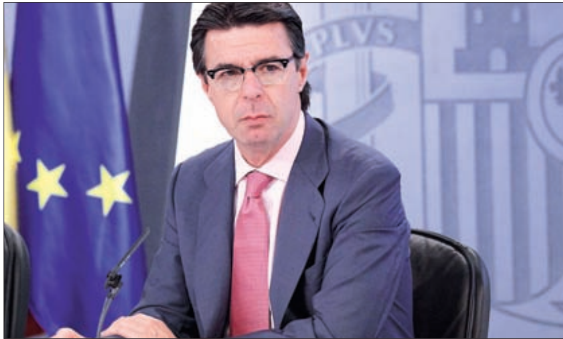
José Manuel Soria, ministro de Industria