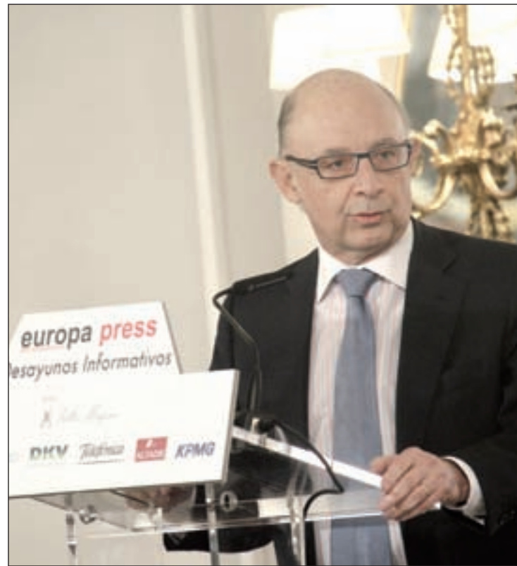
Cristóbal Montoro, ministro de Hacienda, en el desayuno

El ministro no especificó si habrá una disminución en el Impuesto de la Renta las Personas Físicas en concreto, aunque sí descartó que el Gobierno esté planeando un incremento del IVA. "No tenemos intención de volver a subirlo", dijo.