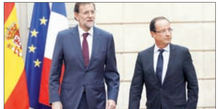
Mariano Rajoy recibió a François Hollande

Durante el encuentro bilateral, además, los mandatarios prepararon el próximo Consejo Europeo de diciembre, donde se seguirá perfilando la unión bancaria y se concretará el plan para conceder créditos baratos a los países de la ‘eurozona’.