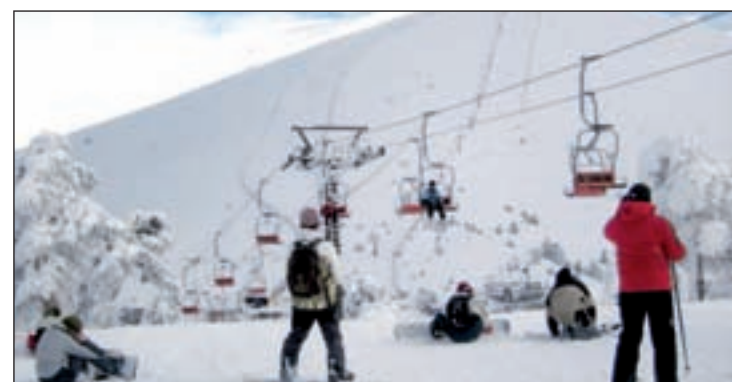
Navacerrada abre sus puertas este fin de semana

las tecnologías y la ampliación de su oferta de ocio convirtiendo a las estaciones en destinos vacacionales. Según la Asociación Turística de Estaciones de Esquí y Montaña (Atudem), las estaciones españolas esperan que la temporada se mantenga en niveles similares a la anterior, que cerró con 4,8 millones de esquiadores y una facturación neta por remontes por encima de 100 millones de euros. En su conjunto, el sector ha invertido 14 millones.