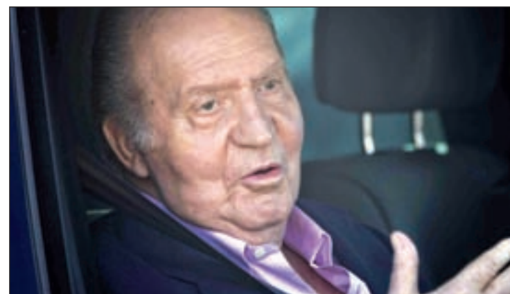
Don Juan Carlos, a la salida del hospital

Antes de esa fecha, los nuevos vocales del Consejo General del Poder Judicial tendrán previsiblemente que prestar juramento ante el jefe de Estado, que deberá