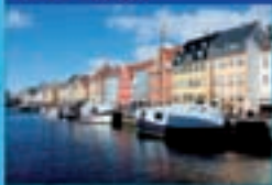
Buque Costa Fortuna

TARJETA REGALO del 10% (7) VUELOS (desde Madrid y Barcelona) Y TRASLADOS INCLUIDOS Copenhague - Gøteborg y Helsingør - Bergen - Warnemünde, Berlín - Copenhague desde 909€