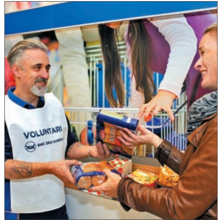
Uno de los voluntarios recoge comida en un supermercado

Además, reconoce que “hubo momentos en los que se me pusieron los pelos de punta”. Uno de ellos, cuando una chica de 12 años utilizó su paga para donar un paquete de pasta. También,