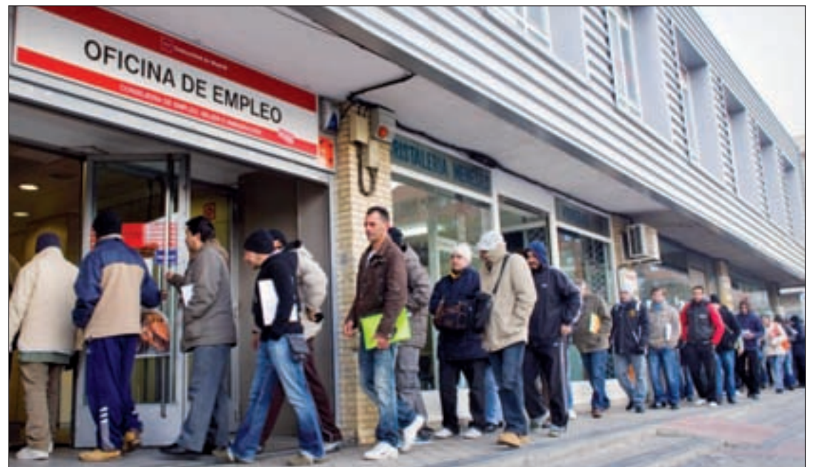
El número de desempleados se sitúa en 4.808.908

Así lo indicó después de que la Tesorería General de la Seguridad Social dispusiera este lunes de 5.000 millones de euros del Fondo de Reserva de la Seguridad Social para pagar las pensiones este mes, en el que debe afrontar el abono de dos mensualidades: la nómina ordinaria y la paga extraordinaria.