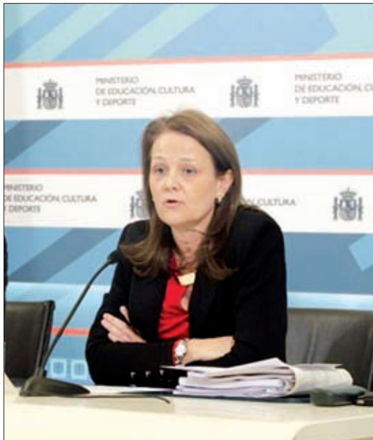
Montserrat Gomendio, secretaria de Estado de Educación

En concreto, en Matemáticas, la puntuación media española se sitúa en los 484 puntos, uno menos que en 2003 y diez menos que la media de la OCDE, lo que coloca a España en el puesto 25 de 34 países; en Lectura, alcanza los 488 puntos, ocho menos que la media (496), por lo que nuestro país alcanza el puesto 23; y en Ciencias llega a los 496 puntos (puesto 21), cinco menos que la OCDE (501).