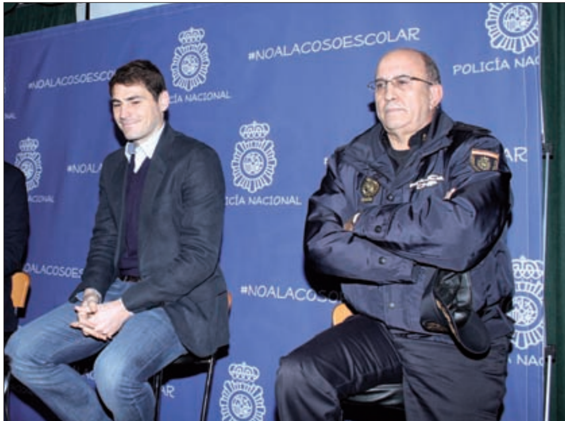
El futbolista Iker Casillas participó en la presentación de la campaña RAFA HERRERO/GENTE

"Cuando éramos pequeños pensábamos que todo era una broma. Recuerdo haber tenido malos gestos con amigos. Todos hemos sido un poco crueles", aunque todo se aprende con los años, reconoció Casillas, al ser preguntado por los escolares del centro, que muy emocionados por su visita, le hicieron un verdadero interrogatorio sobre redes sociales, 'buying' y fútbol.