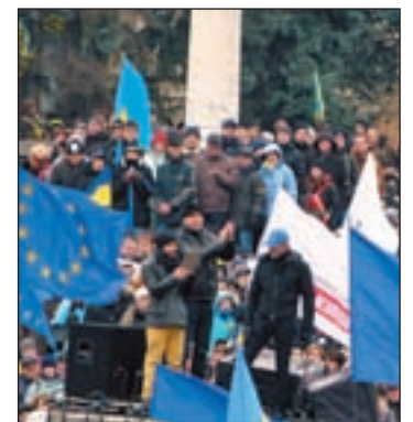
Protesta en Kiev

Los ucranianos centraron su protesta en dicho edificio, después de que la capital del país acogiese el domingo la mayor manifestación en contra del Gobierno desde la época de la denominada 'Revolución Naranja', con unos 350.000 manifestantes y que terminó con enfrentamientos entre manifestantes y agentes anti-disturbios de la Policía.