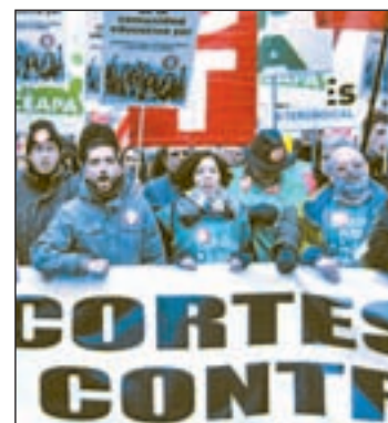
Protesta contra la LOMCE