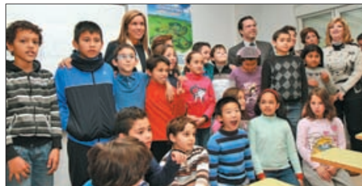
La ministra de Sanidad, Ana Mato, en el acto de presentación

La importancia de esta campaña radica en el hecho de que, según datos del departamento que dirige Mato, el 45% de los niños españoles de 6 a 9 años padece exceso de peso.