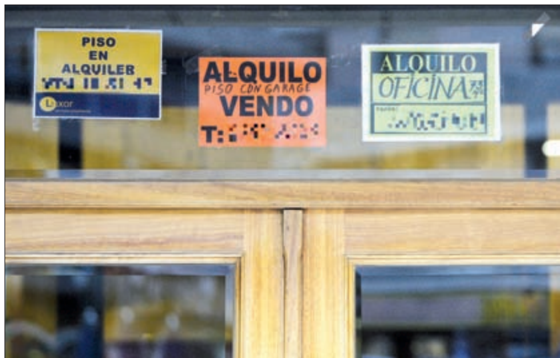
El alquiler supone el 17% del mercado inmobiliario en España, frente al 38% de media de la UE

Podrán beneficiarse de los subsidios al alquiler los mayores de edad con un límite de ingresos inferior a tres veces el Indicador Público de Renta de Efectos Múltiples (IPREM), si bien el importe será "modulable" en función del