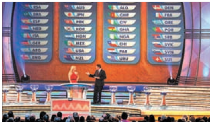
La ciudad de Costa de Sauipe albergará el sorteo

Por su condición de campeona del mundo y de ser líder del ranking FIFA, la selección espa-