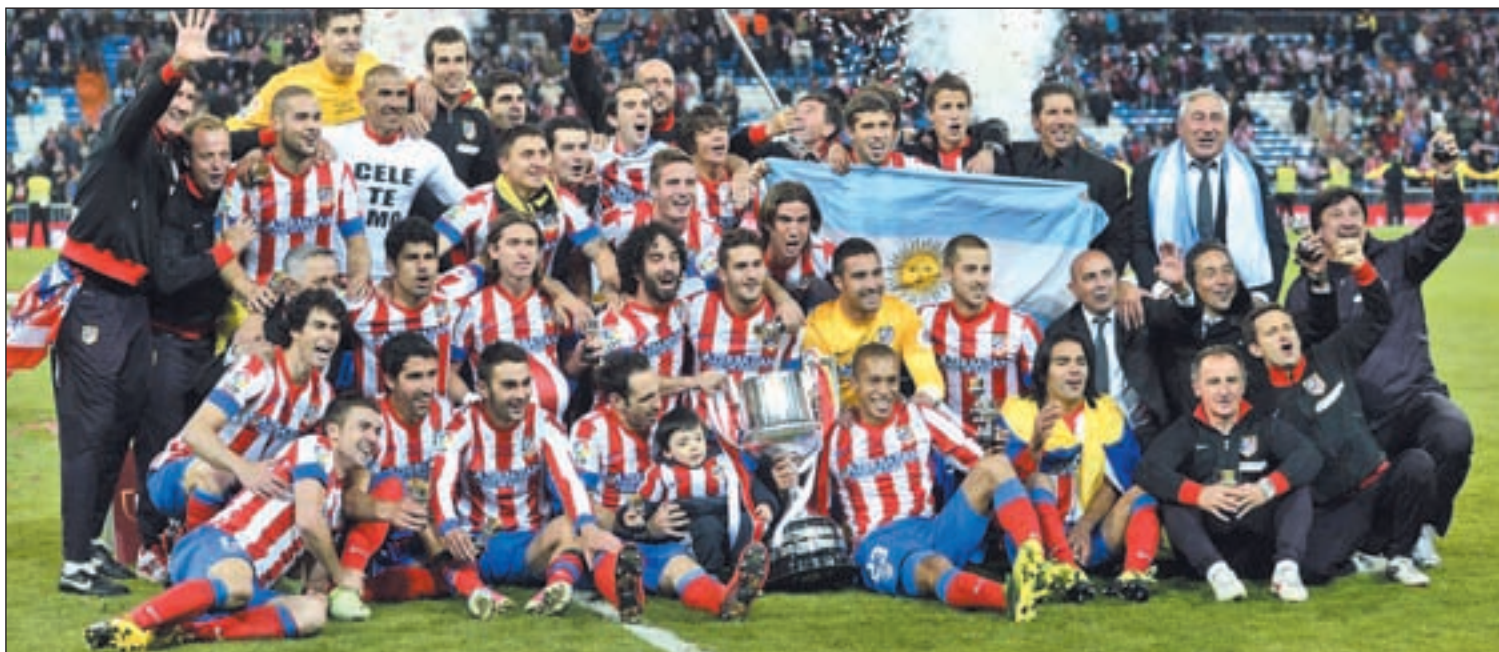
La plantilla del Atlético comienza la defensa de su título en el campo del Sant Andreu