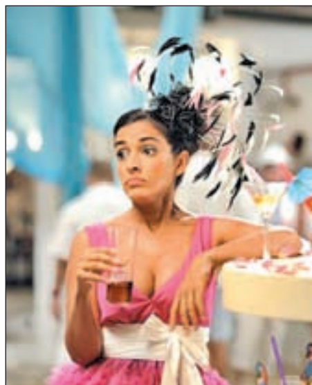
Inma Cuesta en busca del amor

A Cuesta le acompañan en el reparto Quim Gutiérrez ('Azulos-