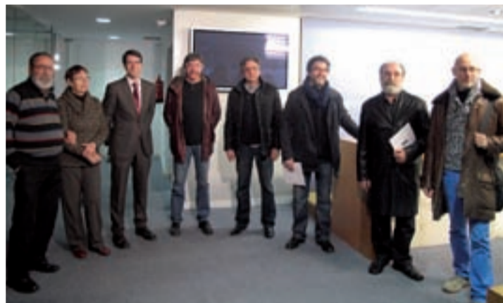
Presentación de la exposición antológica.