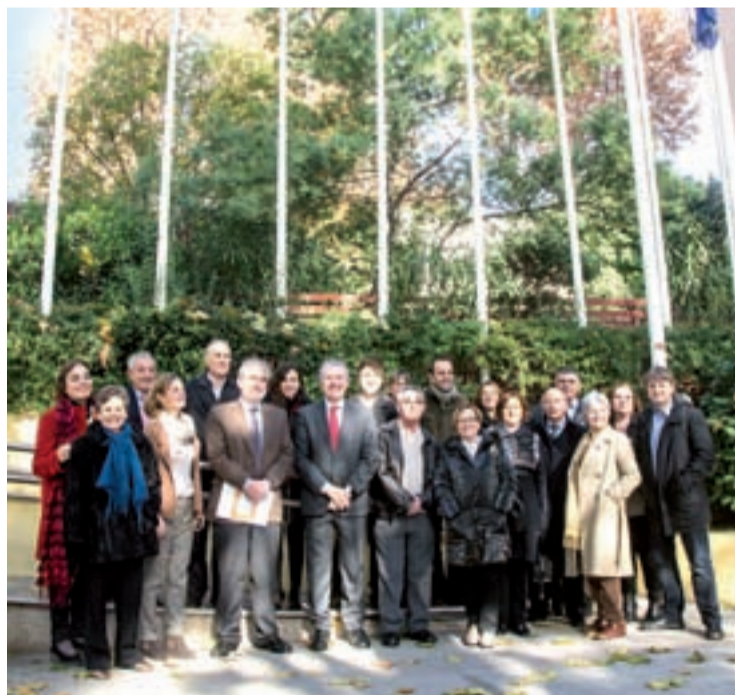
Todos los galardonados en la Sede de la Comisión Europea en España.