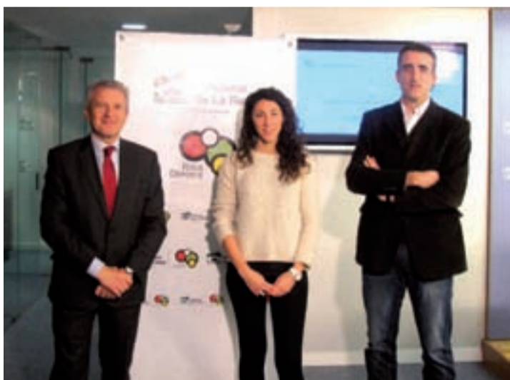
Presentación del Campus en rueda de prensa.

En el segundo caso (con comida), el coste del campus ascenderá a 98 euros, y el precio reducido será de 88 euros. Podrán beneficiarse de los descuentos los abonados del Adarraga, los clientes de Ibercaja, los alumnos inscritos en los cursos de natación en la temporada 2013-