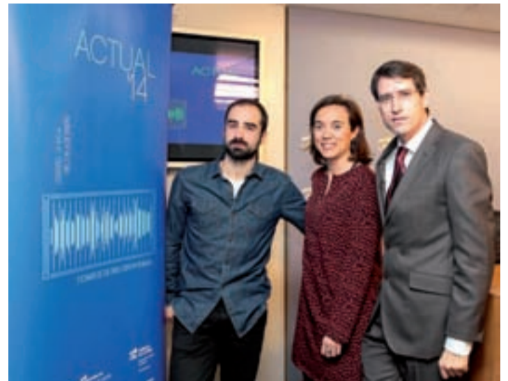
Presentación en rueda de prensa de los 'contenedores de arte'.

Este evento se desarrollará en la plaza del Mercado donde se albergará el montaje de una llamativa estructura cerrada de siete contenedores marítimos en diferentes pases a lo largo de los días 2, 3, 4 y 5 de enero. Se han previsto seis pases diarios, tres