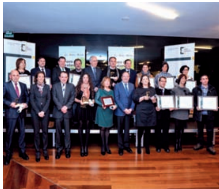
Foto de familia con los premiados.

Reconocimiento Rioja iniciación a la excelencia. Dirigido a organizaciones que inician el proceso de implantación de la excelencia. Este año ha habido ocho reconocimientos: Alvamar Obras y Reformas; Kliux Energies; Geólica Innovations; Vinagreras Riojanas; Tonelería Magreñán; Embutidos Luis Gil; Residencia San Agustín (Inmuebles y Edificios de Cameros) y Perrygatos.