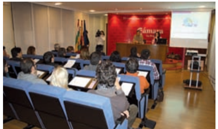
Una treintena de emprendedores participaron en el taller.