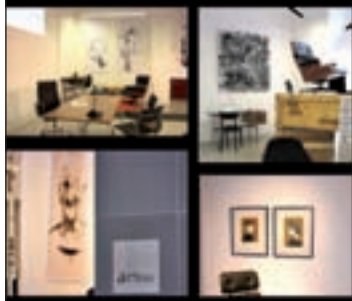
Vista de Galería Artega.