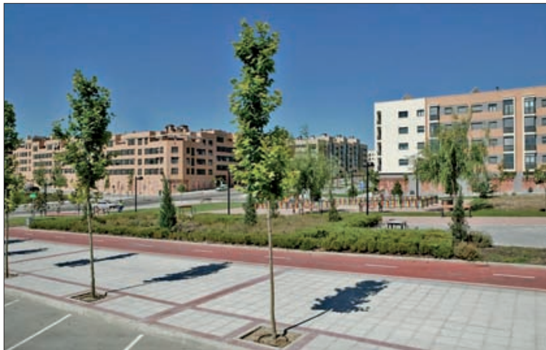
Los vecinos de FuenteLucha son algunos de los afectados

El concejal ha confirmado también que la sentencia dictada sobre seis de las 479 reclamaciones judiciales es "desestimatoria