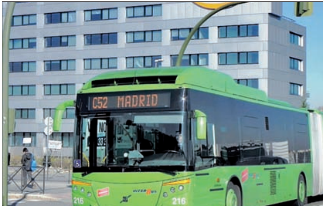
Autobús de la línea interurbana C152 de San Sebastián de los Reyes en dirección a Madrid

Por otro lado, la parada de la calle José Hierro frente a Merce Rodoneda se trasladará también a una nueva marquesina en la calle Rosa Chacel. El resto del trazado de la línea C152 quedará igual, así como el de la L-7, que comparte