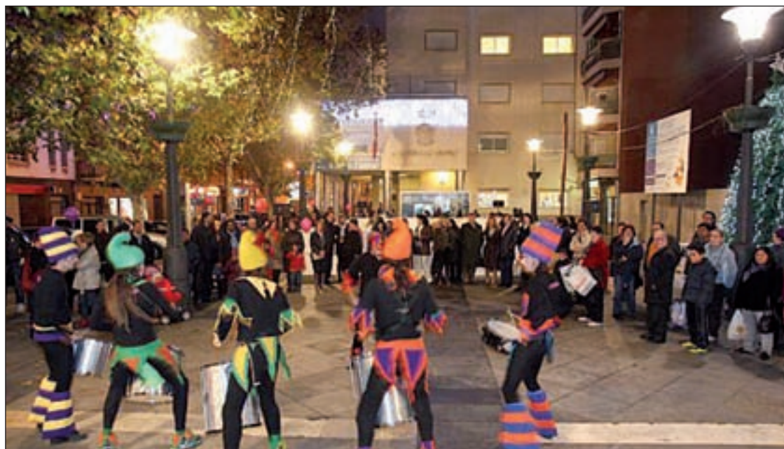
La Plaza del Pueblo de Alcobendas en las fiestas del año pasado

El escultor Stephane Nabti realizará una figura en directo en Alcobendas el día 27 • Actividades para los adolescentes en 'Xmas Sanse'