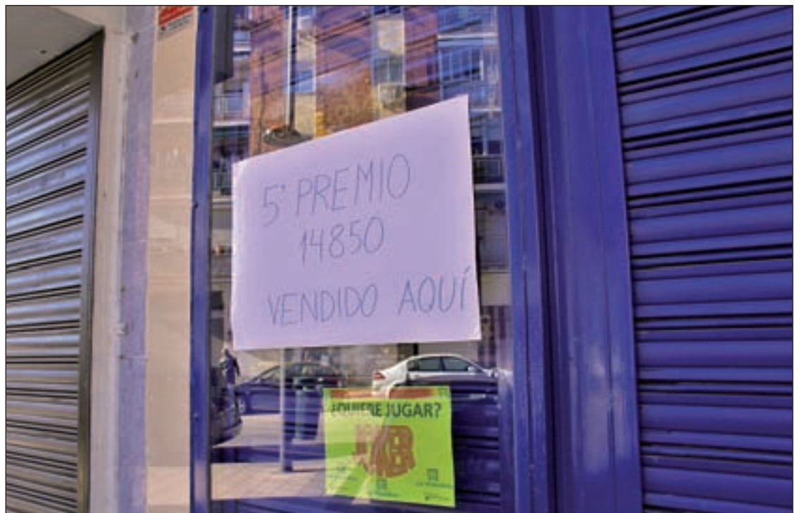
Administración de Lotería de Parla, que ha vendido parte de un quinto premio

pio del Noroeste, y la número 1, situada en la calle Manzanares de Alcobendas, donde se vendió parte del 81.156, que hacía su aparición sobre las 11:30 horas. A pesar de ello, ninguna de estas dos administraciones abrió sus puertas durante la mañana para celebrar el premio.