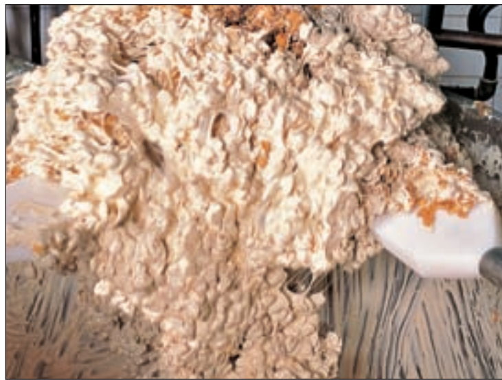
Proceso de elaboración del turrón de Alicante