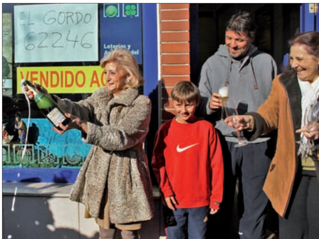
Celebración en la Administración número 8 de Leganés