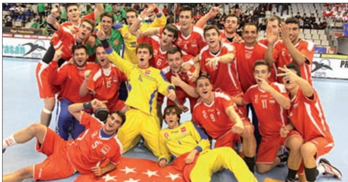
El juvenil masculino celebra su triunfo ante Andalucía en la gran final