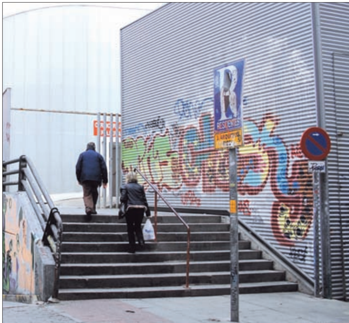
La nueva instalación deportiva de Centro se ubicará en el Mercado de Barceló

Otros asuntos pendientes son el futuro de los Jardines del Arquitecto Ribera y remodelar el Mercado de los Mostenses y de la Cebada PÁGS. 10 - 11