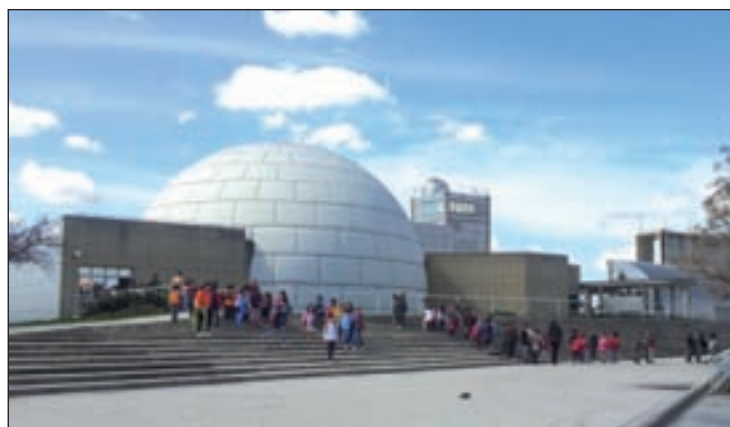
Planetario de Madrid

Este protocolo de colaboración, en el que la Obra Social "la Caixa" se compromete a destinar tres millones de euros en el período 2014-2018, contempla la renovación tecnológica de la Sala de Proyección del Planetario, que será sometida a una profunda modernización y equipada con un sistema híbrido digital-óptico de máxima calidad y con la última