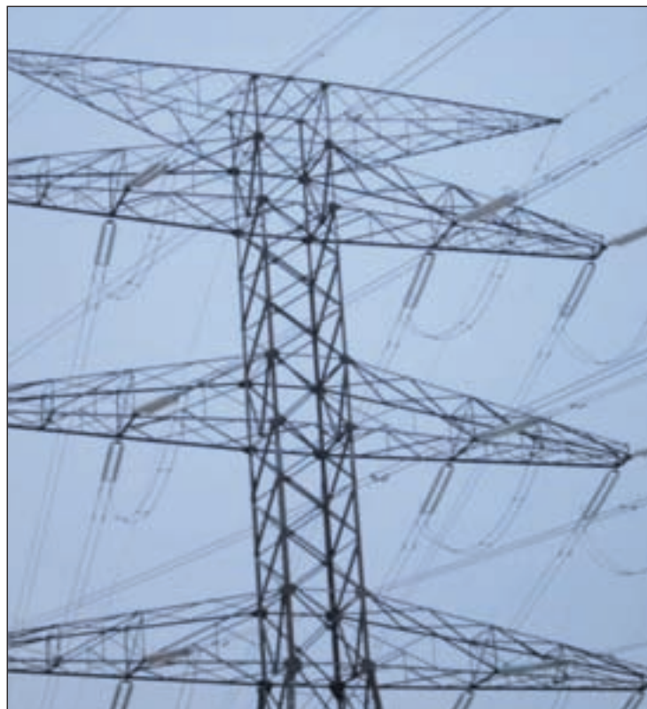
La luz es un 2,3% más cara desde el 1 de enero

De la misma forma, el peaje de las autopistas del Estado subirá una media del 1,85% en todas las