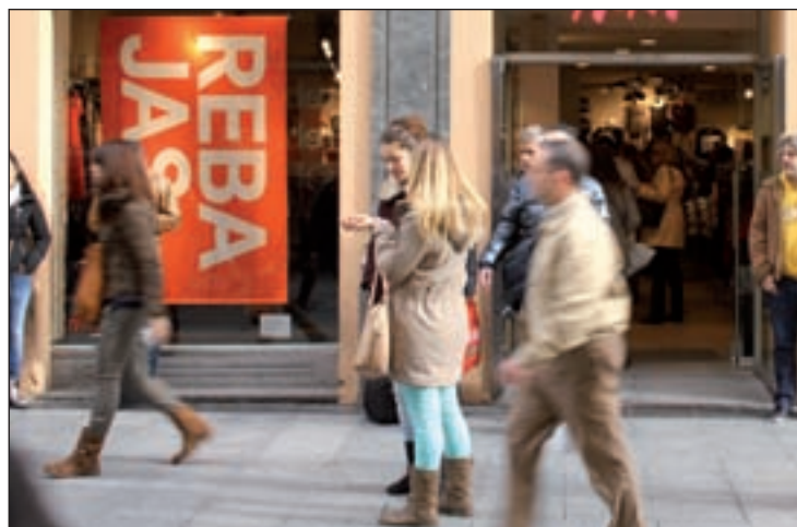
Las mujeres compran más ropa y cosméticos