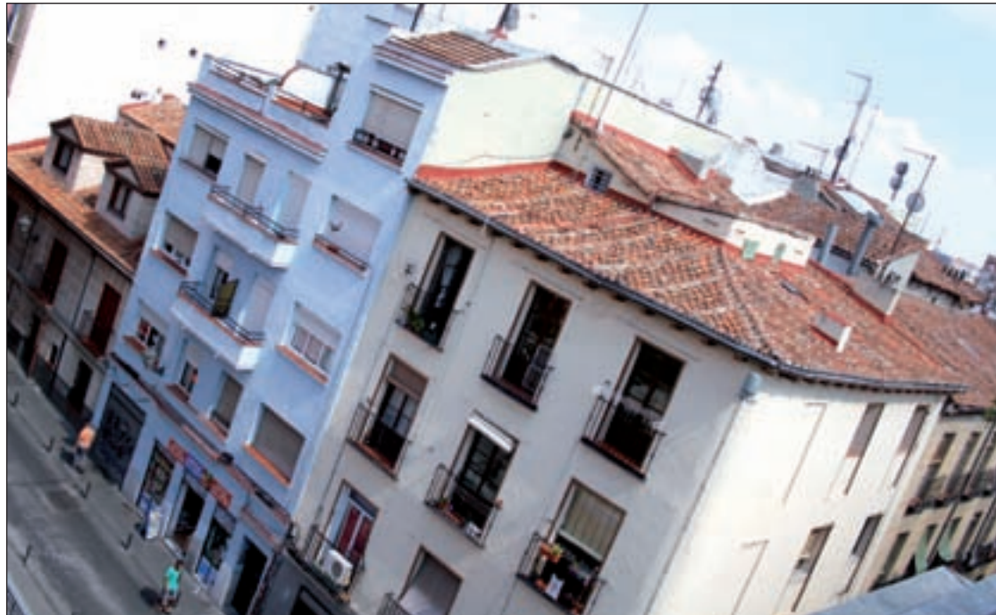
Viviendas en el barrio de Lavapiés

Por distritos, Ciudad Lineal, con una caída del 16,3 por ciento, registró los mayores descensos, seguido de Villaverde, con un decremento del 15,1, Villa de Vallecas, con un -12,2 y Centro, un 9,5