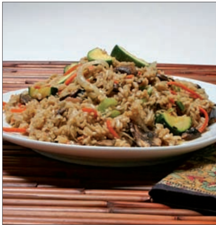
Un plato de arroz integral con verduras es una buena opción

Tomar al día cinco piezas de fruta y verduras como perejil, ce-