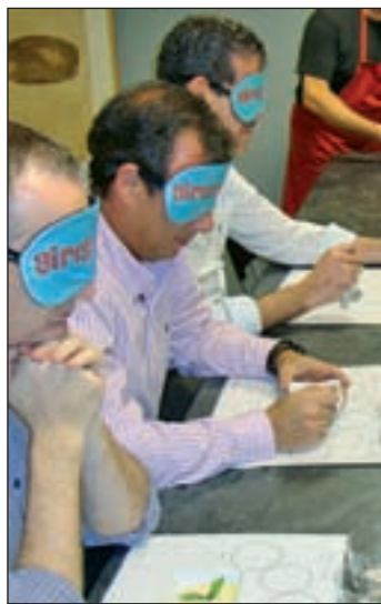
Una de las actividades

La capital acogerá entre el 24 de enero y el 9 de febrero la quinta edición de Gastrofestival Madrid. En el evento, organizado por la empresa municipal Madrid Destino, en colaboración con Madrid Fusión, participan más de 350 empresas e instituciones, como el Museo del Prado o el Thyssen-Bornemisza. Durante dos semanas se desarrollarán más de 300 actividades distribuidas en 5 temáticas: 'Experiencias Sensoriales', 'Gastrocultura', 'Madrid Gastronómico', 'Gastrofashion' y 'GastroSalud'.