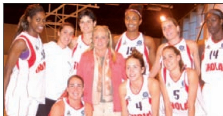
Plantilla del equipo de Chamberí

Ahora, la norteamericana y el resto de compañeras esperan repetir esa actuación este domingo (12:30 horas) con motivo de su visita a la cancha del Tenerife Isla Única. El conjunto insular es noveno en la clasificación.