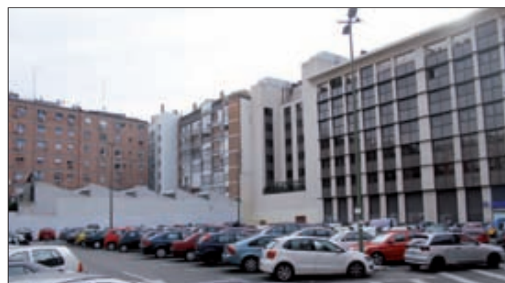
Solar de la calle Alcántara

de los servicios de tele asistencia, ayuda a domicilio, etcétera, que prestan los Servicios Sociales de la Junta Municipal". Por último, Martínez Vidal propone "recordar, mediante placas en los lugares donde fueron asesinadas, a las treinta víctimas del terrorismo asesinadas en las calles de nuestro distrito".