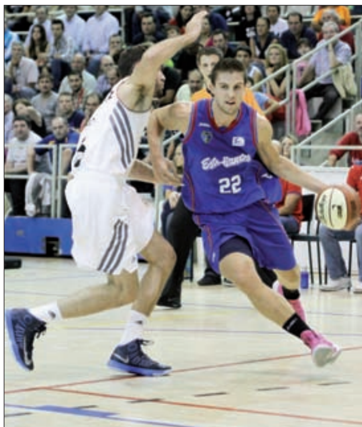
El Estudiantes busca otra victoria ante su afición