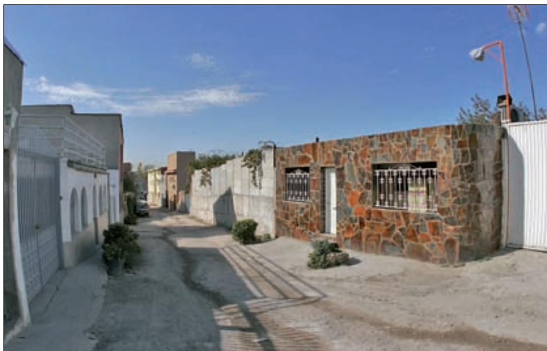
La Cañada Real, en la agenda de la Comunidad de Madrid en 2014

Este asunto ha dado un giro radical en las últimas horas. El pleno