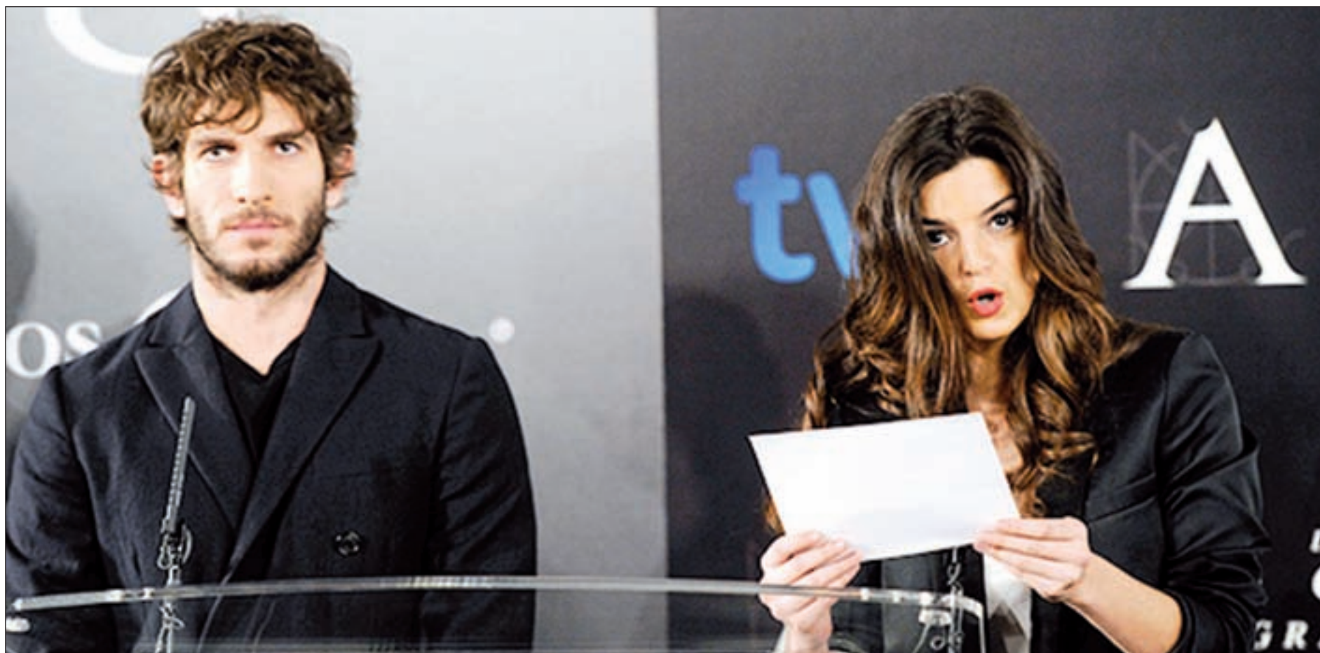
Quim Gutiérrez y Clara Lago en la lectura de los nominados a los Goya 2014