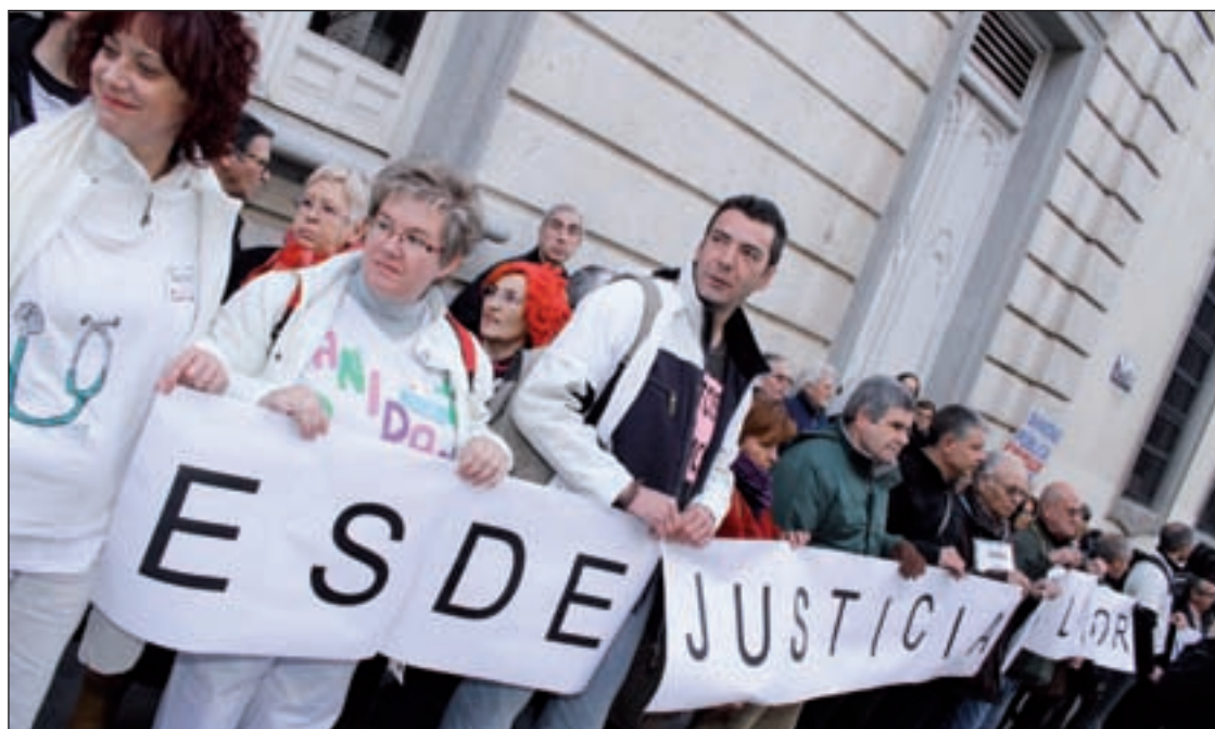
Un centenar de personas se concentraron a las puertas del TSJM el 9 de enero