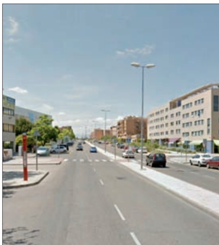
La avenida de Tenerife en San Sebastián de los Reyes

El solar es de titularidad pública y ha sido adjudicado mediante concurso público, es decir, se ha otorgado por título de concesión