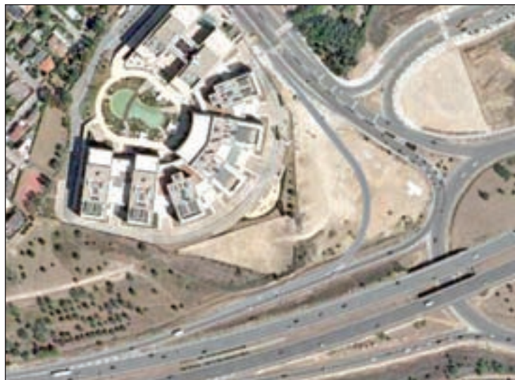
Cauce del Arroyo de la Vega en Alcobendas, junto al Juncal

Hasta 300 puestos de trabajo es lo que el Gobierno espera crear con el nuevo proyecto 'mercaocio' que dotará al municipio de un Mercado local. La propuesta, diseñada por los arquitectos Fer-