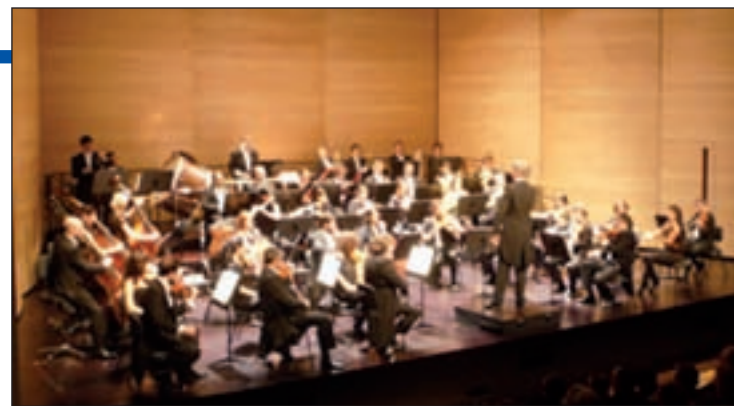
Concierto de música clásica en el Centro de Arte

tural, en la web Entradas.com y en el teléfono 902 488 488. Toda la programación puede consultarse en gentedigital.es/alcobendas .