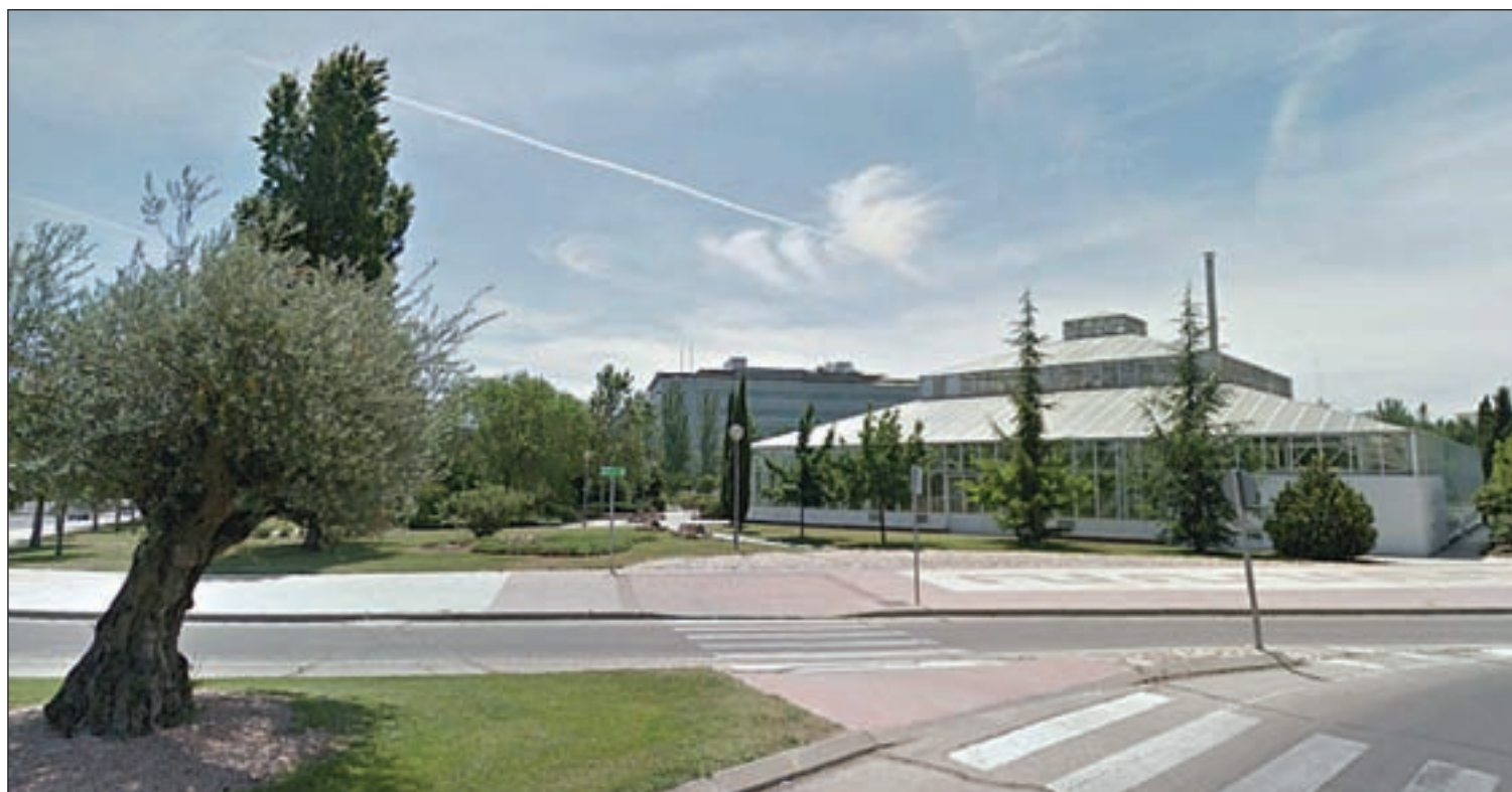
'Mercaocio' es el proyecto ganador que se instalará en el antiguo invernadero de Alcobendas