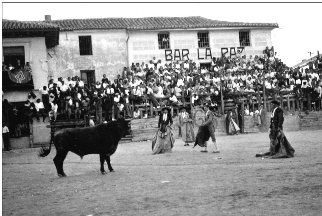
Una fotografía de las que recoge la muestra

La muestra está dividida en dos partes. La primera recorre la historia taurina de Alcobendas mostrando documentos que acreditan la celebración de corridas cuando Alcobendas era un pueblo. Además, recoge carteles de corridas que se celebraron durante la invasión francesa en España. Otros elementos que forman esta selección son diferentes fotogra-