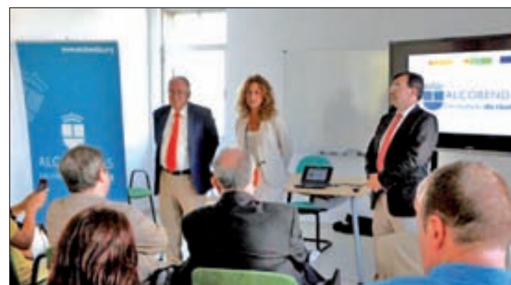
Segunda edición de Ciudad Emprendedora en Alcobendas

apuntado que los proyectos de Alcobendas Ciudad Emprendedora y Alcobendas Ciudad 'Startup' son claves, ya que permite la creación de nuevas empresas y oportunidades. "El reto es además seguir gestionando eficazmente los recursos para plantearnos una bajada de impuestos en 2015", ha concluido.