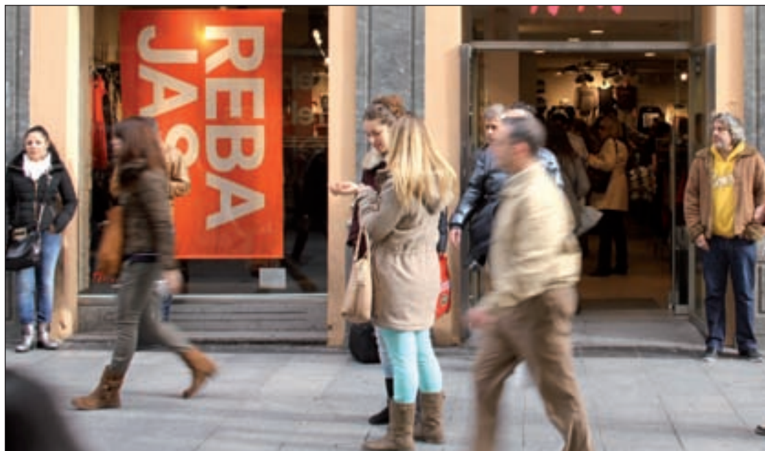
Hay una mayor tolerancia a las compras compulsivas en rebajas

No todos los expertos coinciden en este punto ya que, según el vicepresidente de la Asociación Española de Psiquiatría Privada,