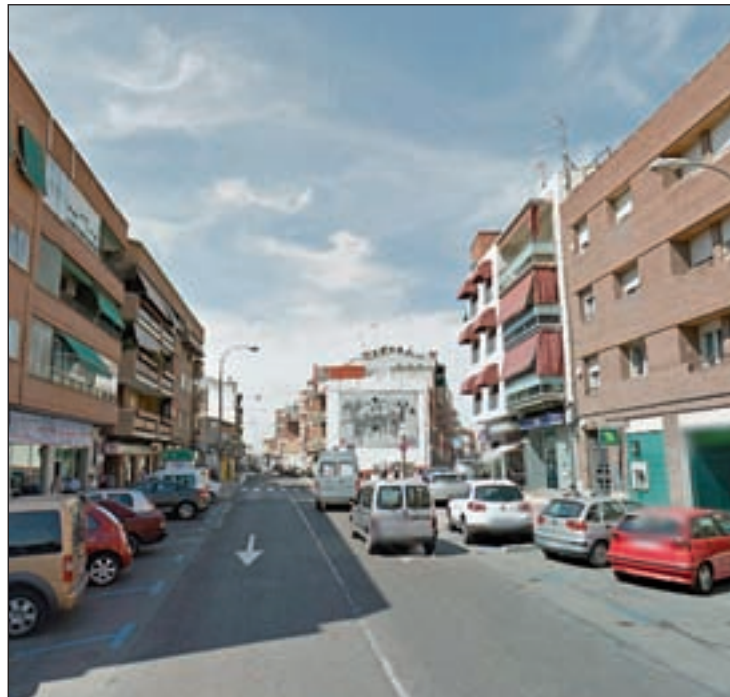
Calle Real de San Sebastián de los Reyes

Asimismo, ha apuntado que sus deseos para el año 2014, que ahora comenzamos, es "un deseo de paz". "Una paz que venga propiciada por una mayor estabilidad y progreso, para que gracias al trabajo e implicación de todos,