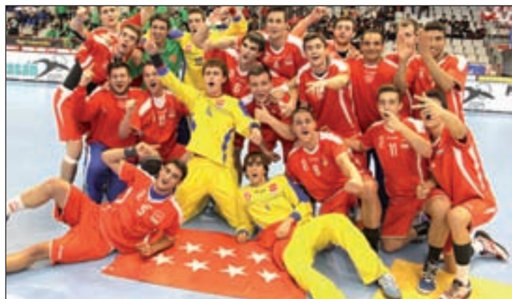
El juvenil masculino celebra su triunfo ante Andalucía

Los Campeonatos de España de Selecciones Territoriales disputados la semana pasada en la localidad de Gijón, dejaron un balance de lo más positivo para los combinados madrileños. En total, fueron dos triunfos y sendos terceros puestos los que plasmaron en medallas las buenas sensaciones que transmitieron los representantes de la Comunidad. Uno