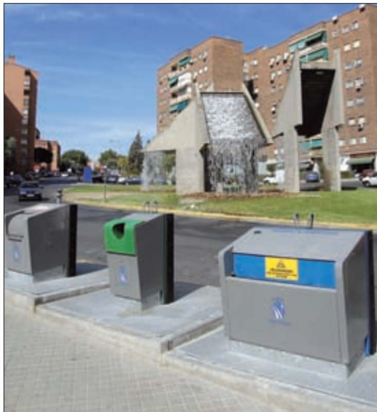
Isla ecológica en el municipio

Además de las nuevas islas ecológicas en el centro de Fuenlabrada, fuentes municipales han