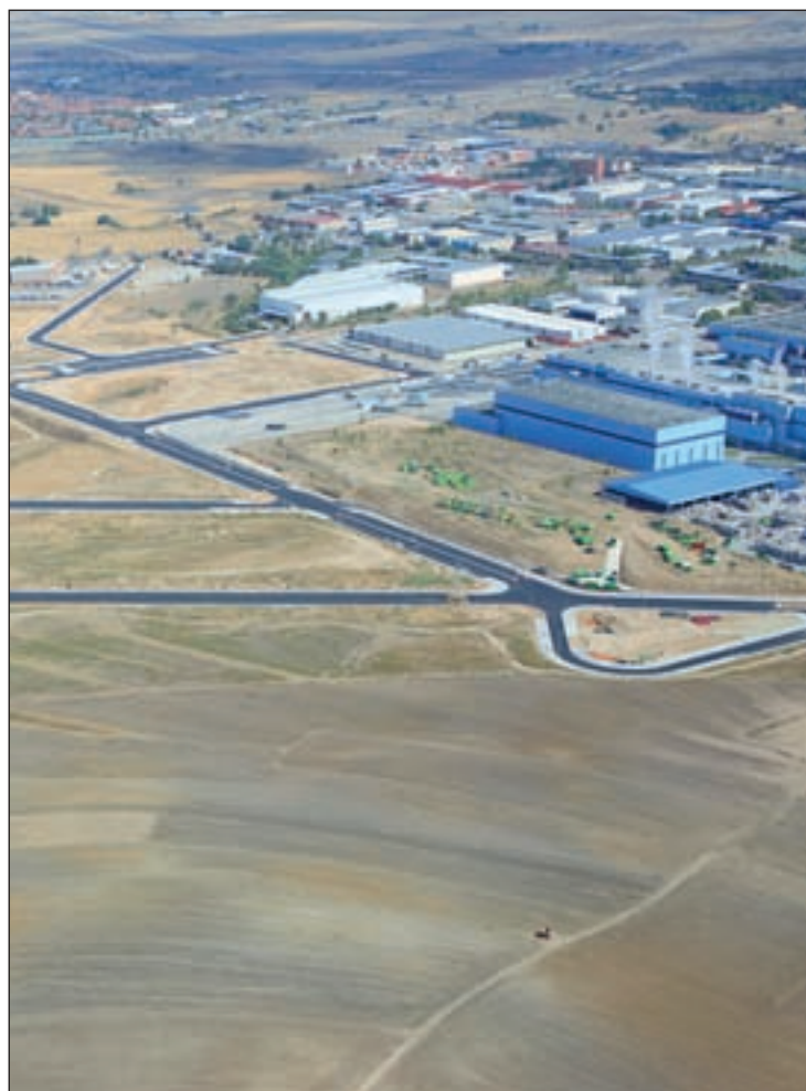
Polígono industrial El Bañuelo, en una imagen de 2010

del Fondo Europeo para invertirlos en su rehabilitación. "La Comunidad de Madrid tendría que hacer un plan industrial para la remodelación de los Fondos Europeos, completando lo que reste para llevarlo a cabo. Parecería lógico que parte del dinero que llega a nuestro país desde la Unión Europea se destine a estas cuestiones en la región, que en el caso de Fuenlabrada resulta importante, dado que es la segunda entidad de la Comunidad de Madrid a nivel industrial", ha especi-