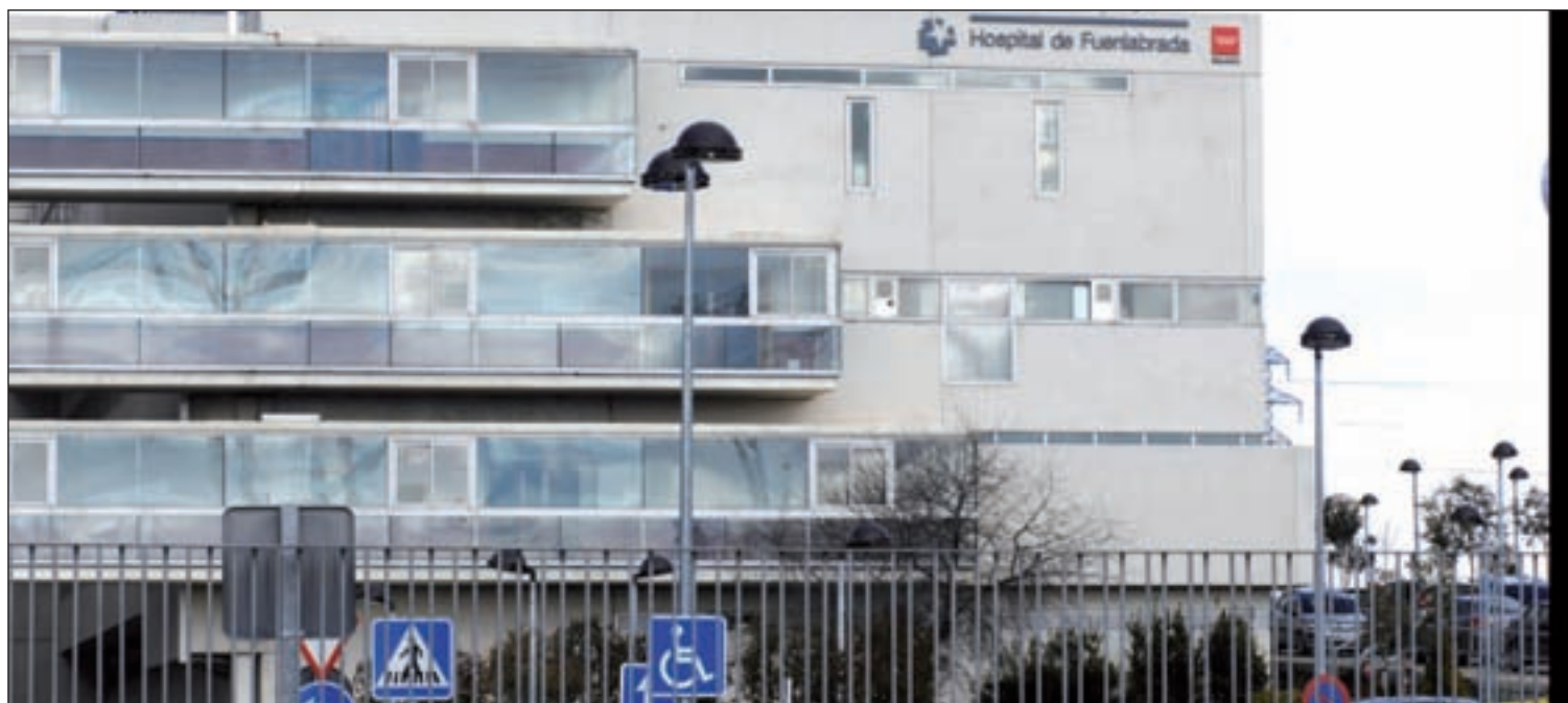
Hospital de Fuenlabrada GENTE