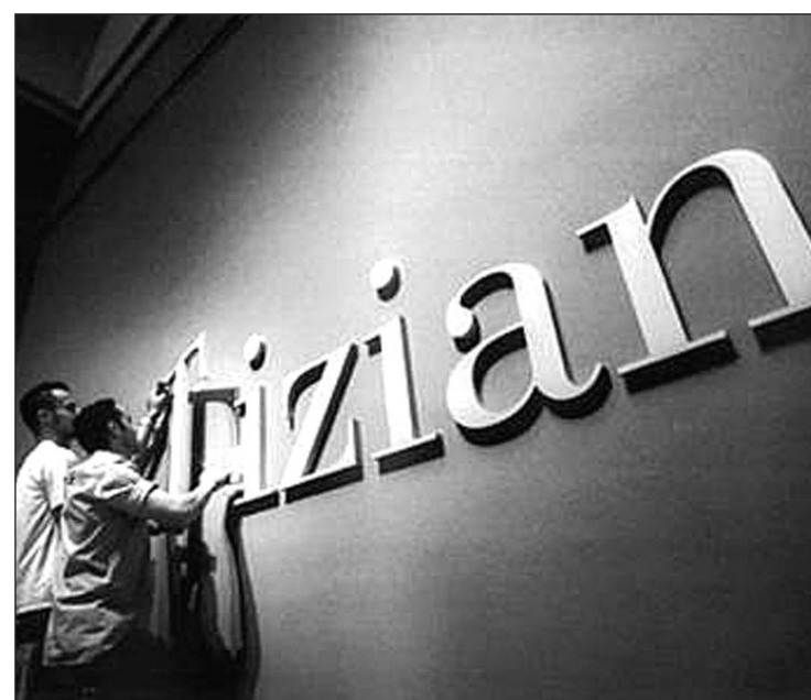
Exposición en el museo del Prado

El Thyssen dedicará su primera exposición a Cézanne, desde el 4 de febrero hasta el 18 de mayo. Además, desde el 10 de junio y hasta el 14 de septiembre la pinoteca acogerá la exposición ‘Mitos del pop’. Por último, CaixaForum traerá, por primera vez en España, una gran muestra sobre Pixar, el estudio americano que ha revolucionado la animación en los últimos 25 años.