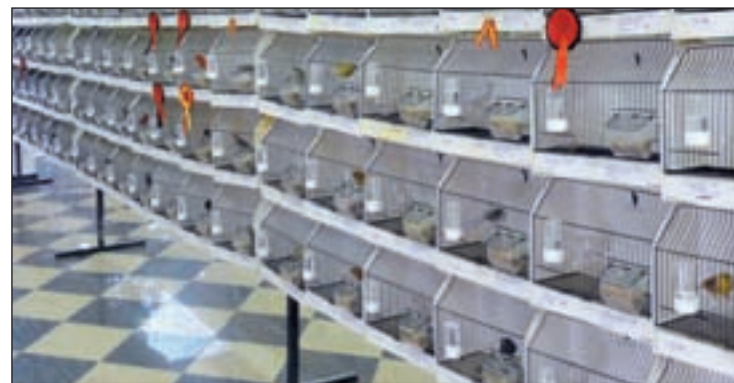
Imagen de aves GENTE

xima edición, tendrá carácter internacional. Han adelantado, desde la organización, que el próximo año este concurso pasará a la categoría internacional porque ya "está muy consolidado". "Queremos avanzar para que Fuenlabrada se convierta en un referente en la ornitología", ha señalado.