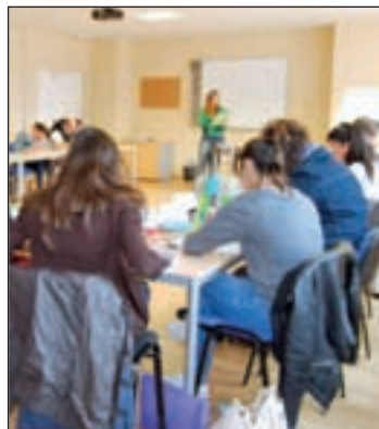
Alumnos en una clase

La Concejalía de Juventud e Infancia, ofrece por segunda vez un taller destinado a la iniciación del Alemán para jóvenes. "En esta ocasión, se trata de la lengua europea de reconocida potencia cultural y cuyo conocimiento ofrece oportunidades para acceder ventajosamente al mercado laboral", según explican desde el Consistorio. Para impartir las cla-