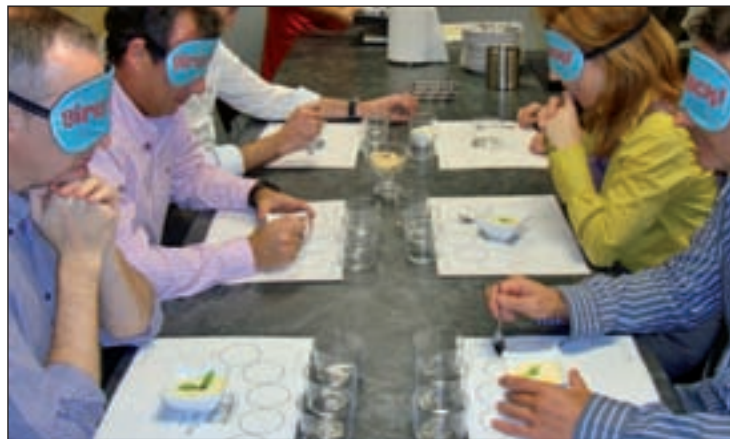
Una de las actividades de la edición pasada

La sección 'Experiencias Sensoriales' propone catas y rutas culinarias para degustar y descubrir nuevas materias primas y texturas,