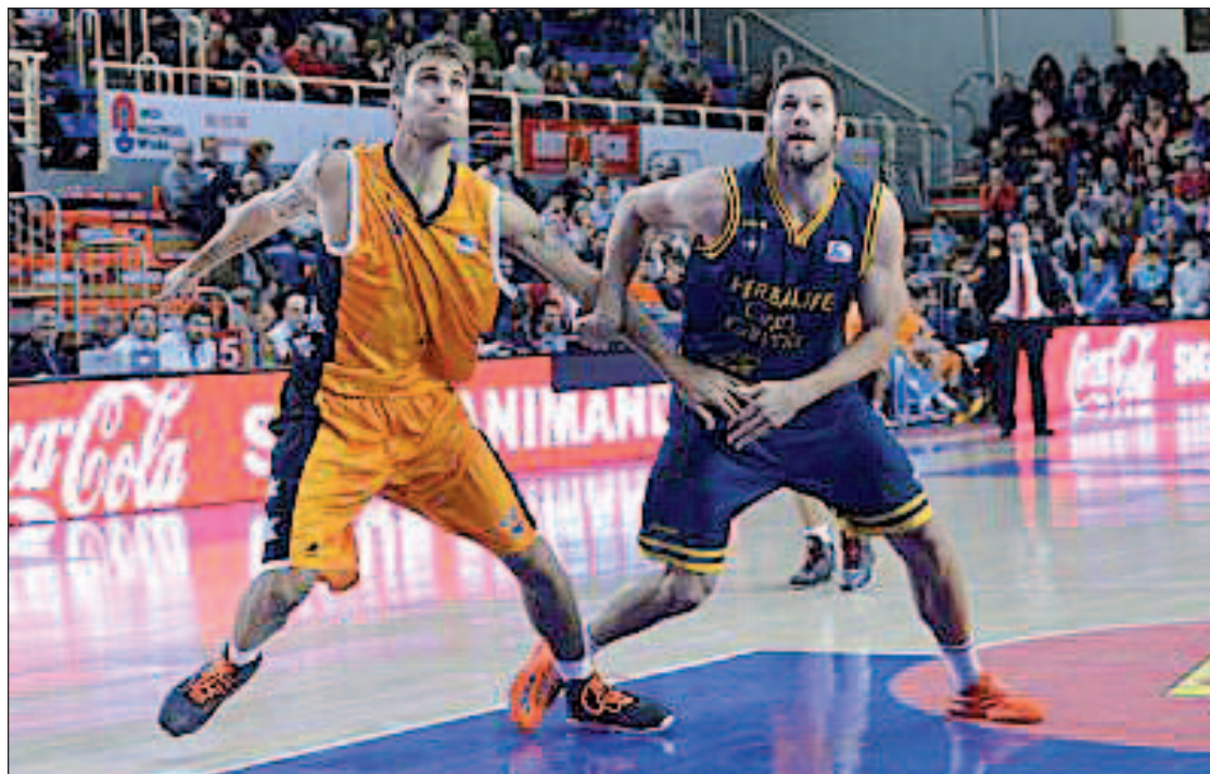
El Fuenlabrada contra el Herbalife Gran Canaria

“Se nos han escapado tres partidos que hemos tenido cerca contra rivales de la parte alta de la tabla. Se nos fue contra el Barcelona, contra el Unicaja y contra el Gran Canaria. No podemos caer en el derrotismo a pesar de llevar cuatro derrotas. Es obvio que tenemos que aprender a acabar en el minuto cuarenta por delante”, aseguró el entrenador fuenlabreño Chus Mateo. “Pero no podemos dejarnos llevar por las emociones, tenemos que seguir trabajando y levantándonos si nos sale mal, porque la única manera de hacer algo bueno es levantarte cuando pierdes y no dejarte influir demasiado por la victoria. Ni la euforia ni el derrotismo son po-