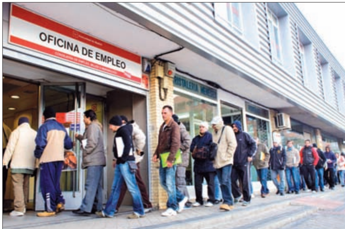
Oficina del INEM GENTE

Por su parte, Leganés lidera la creación de empleo con la generación de 545 puestos de trabajo, logrando una reducción de paro de un 2,90% respecto al mes de noviembre y un 2,64% de interanual. Para el alcalde de Leganés, Jesús Gómez, supone una magnífica noticia. "Los políticos podemos contribuir a través de medidas para la activación de la economía que, a la vista de las cifras,