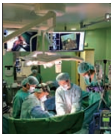
En 2013 hubo 1.655 donantes

Los incidentes se trasladaron a otras ciudades, como Madrid, donde el pasado miércoles 14 personas, tres de ellas menores, fueron detenidas en enfrentamientos con la policía en la calle Génova y la Plaza Colón