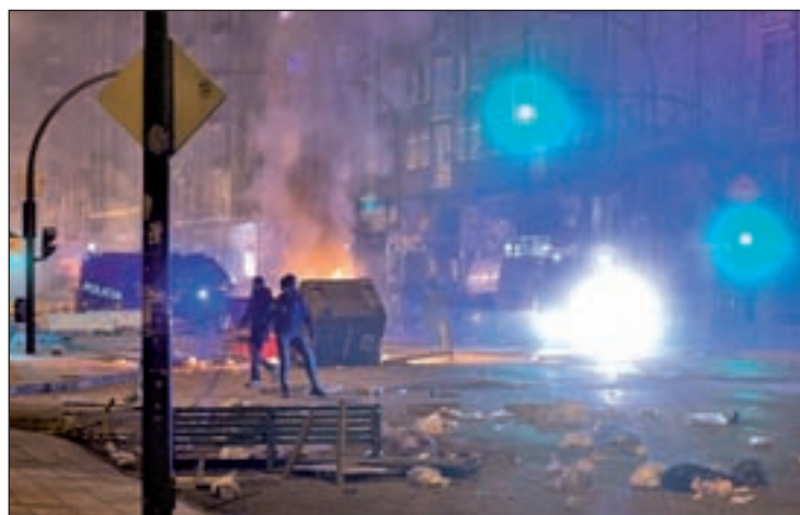
Disturbios en el barrio Gamonal de Burgos

Lacalle afirmó que el "clima de tensión y violencia" que se ha generado "no beneficia a nadie y no puede continuar", por eso apeló a la responsabilidad conjunta "para que entre todos seamos capaces de devolver la normalidad".