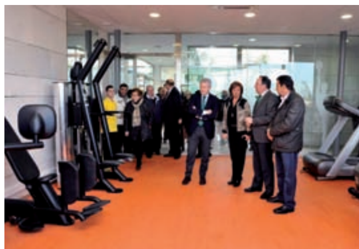
Visita al nuevo gimnasio de Albelda de Iregua.

Las nuevas instalaciones, ubicadas en el mismo edificio que aloja la piscina climatizada y colin-