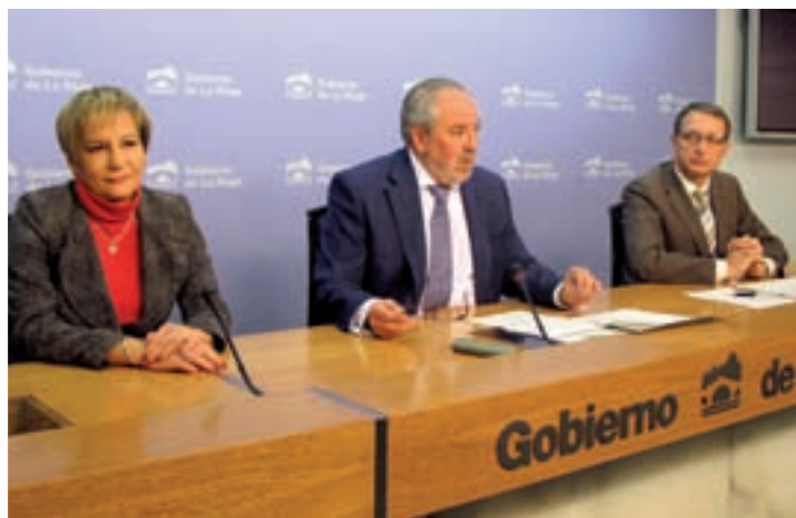
Rueda de prensa de los resultados obtenidos en 2013.

Las buenas cifras de demora quirúrgica (que indican el tiempo medio de acceso de un paciente a una intervención quirúrgica) se han reducido tanto en el Hospital San Pedro (45