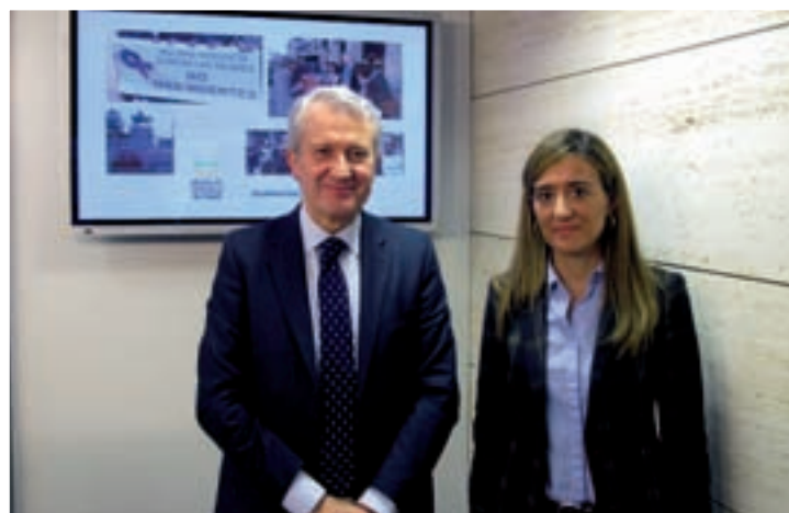
Presentación de los datos en rueda de prensa.

De las 937 personas atendidas, la mayor parte, 759 (81%), corresponde a mujeres, frente al porcen-