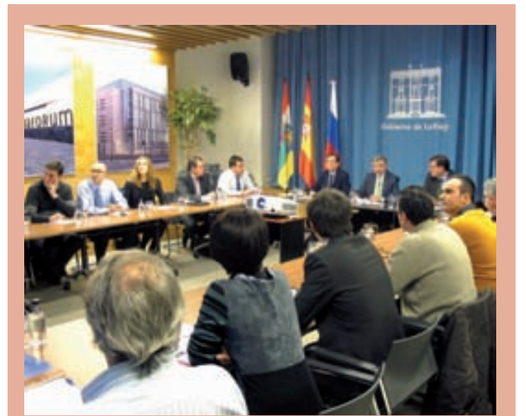
Reunión con empresarios riojanos.