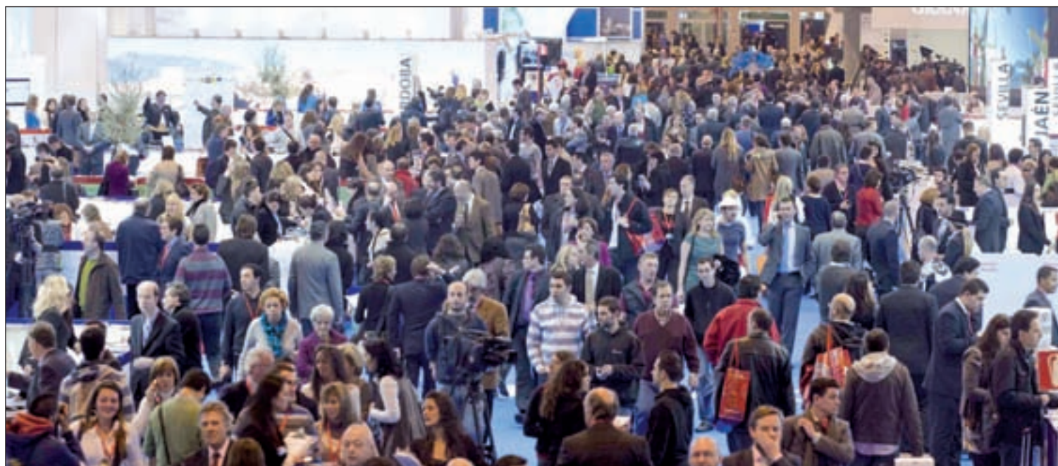
La Feria Internacional de Turismo Fitur 2014 estará abierta hasta el próximo domingo 26 de enero