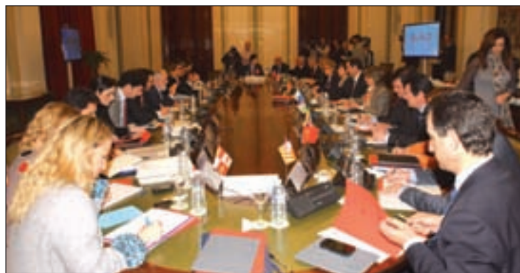
Reunión de la conferencia sectorial de Agricultura

En la conferencia sectorial, que se celebró los pasados lunes y martes, se definió la nueva fórmula en base a la aplicada por la Comisión Europea, pero con un estabilizador que impedirá que ninguna comunidad pierda o gane más del 10% respecto al anterior modelo. De esta forma, Andalu-