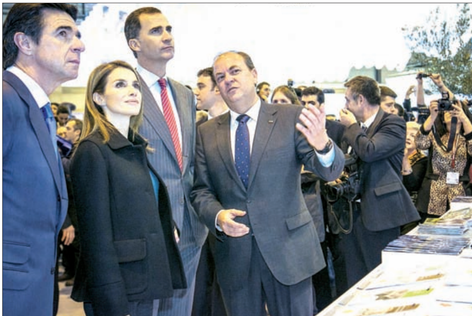
Los Príncipes de Asturias inauguraron Fitur el pasado miércoles

el día antes de que los Príncipes de Asturias inauguraran Fitur. Se prevé que 200.000 personas acudan a esta feria, que reúne la oferta de 165 países. PÁG. 2