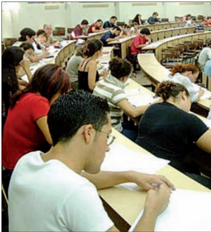
Estudiantes universitarios en un aula