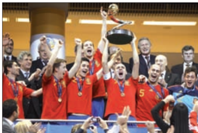
España ha ganado el torneo en las cuatro últimas ediciones