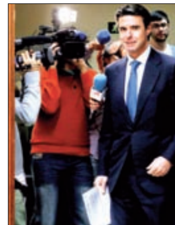
El ministro José Manuel Soria

Partido Socialista, Izquierda Plural, UPyD y las formaciones de izquierdas del Grupo Mixto reprocharon al departamento de José Manuel Soria que legisle a favor de las grandes eléctricas y en contra del interés general, reclamando