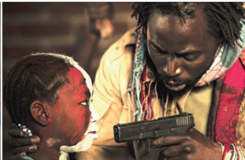
El corto nominado, 'Aquel no era yo', se adentra en la temática de los niños soldado en el continente africano