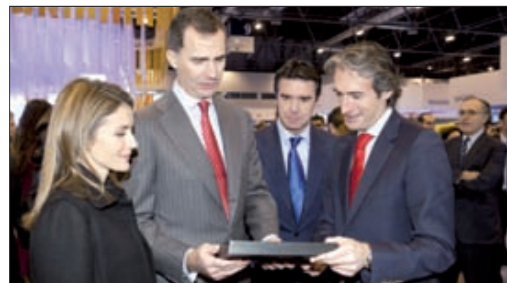
El Príncipe Felipe, durante la inauguración de Fitur

A nivel internacional, la feria contará con una amplia presencia de destacados mercados del planeta, especialmente Iberoamérica, entre los que destacan los expositores de Argentina, Méjico y Perú, y los destinos emergentes.