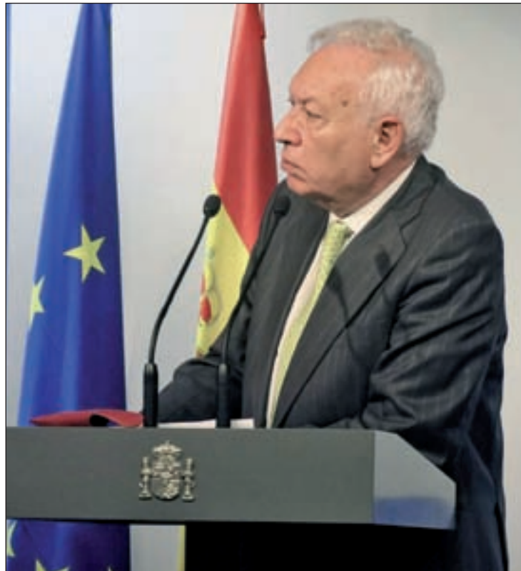
José Manuel García-Margallo, ministro de Asuntos Exteriores

Por el momento, el Gobierno no ha tomado una decisión al