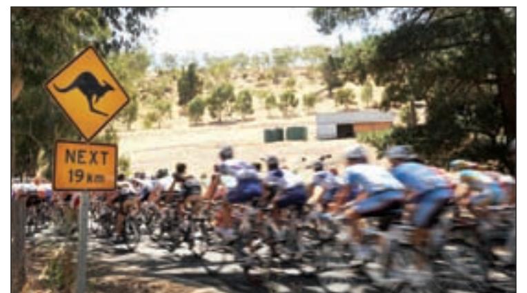
El domingo acaba el Tour Down Under

Contador ha preferido seguir con los entrenamientos pensando en el gran objetivo que se fija para esta temporada: reconquistar el maillot amarillo del Tour de Francia. Por el momento, el ma-