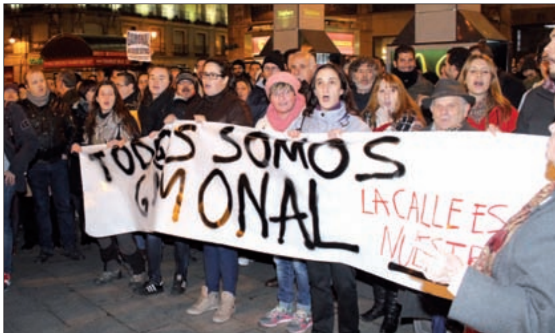
Manifestación de apoyo en la Puerta del Sol de Madrid

Esta medida, según explicó la vicepresidenta regional, Cristina Teniente, se contempla dentro de la nueva Ley de Función Pública en la que el Gobierno autonómico lleva "meses" trabajando, y que busca convertirse en una norma a la "vanguardia" de la materia en España que permita "reforzar" los derechos constitucionales de "mérito, igualdad y capacidad" de las personas que concurren a un proceso opositor.