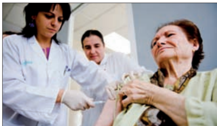
Personal sanitario vacuna a una persona mayor

"La gripe A (H1N1), a diferencia de la gripe común, afecta a individuos más jóvenes y es potencialmente peligrosa en pacientes