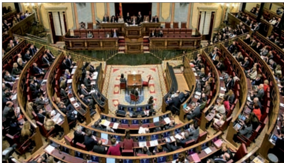
CiU, ERC e ICV presentarán la proposición para acelerar el debate parlamentario

gún tipo de estructura estable en Portugal y les arroja un entorno de plataformas y organizaciones integrado por cerca de medio millar de personas. Según estos expertos en la lucha antiterrorista, este reducido grupo de personas a las órdenes de la banda hacen vida normal como 'galegos'.