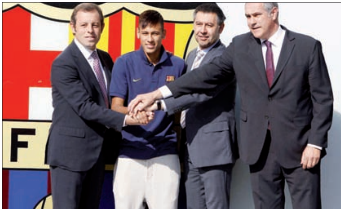
Neymar, durante su presentación como jugador del Barcelona

Sin embargo, estas dudas pueden quedar prácticamente en mera anécdota si se prolonga el asunto sobre el que ha puesto el foco la Audiencia Nacional. Según ha adelantado el diario El Mundo, los contratos suscritos entre el Fútbol Club Barcelona y Neymar, que obran ya en poder del Juzgado de Instrucción número 5 de la Audiencia Nacional, revelan que el coste total del traspaso de la estrella brasileña llegaría a los 95