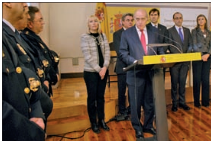
Jorge Fernández Díez, ministro del Interior

La reacción de los partidos vascos y navarros a este comunicado fueron variados. UPN, PSN, PPN, Izquierda-Ezkerra y Geroa Bai volvieron a pedir a ETA su disolución, mientras que otros como Bildu y Aralar-NaBai consideraron "positiva" dicha "reflexión interna".