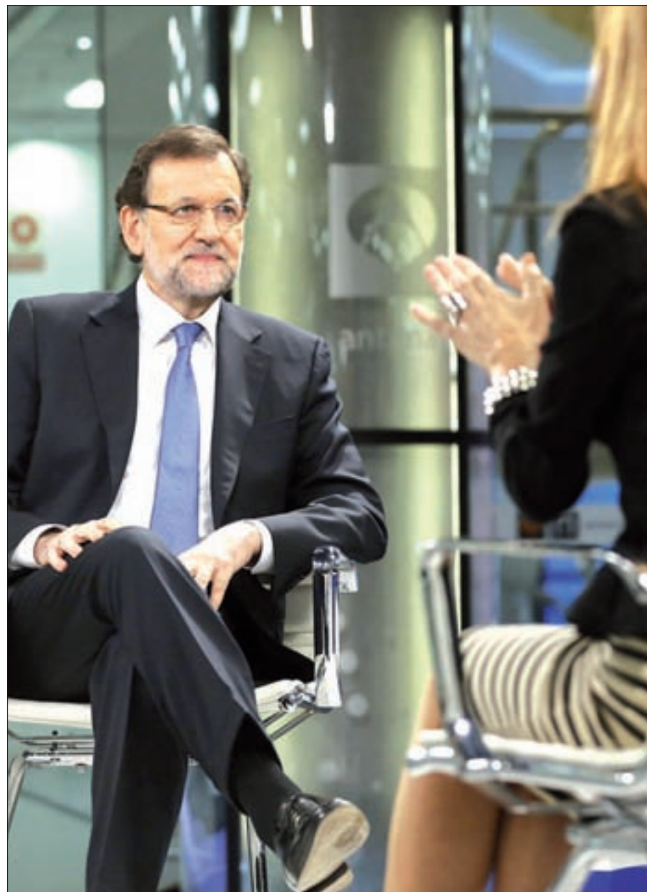
El presidente del Gobierno, Mariano Rajoy, durante la entrevista

Además, Rajoy anunció que las reformas más importantes que tiene el Gobierno este ejercicio