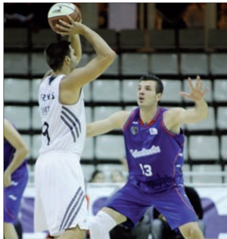
El Madrid sigue en lo más alto de la tabla

Más allá de esta apretada carrera por estar en el torneo del KO, la