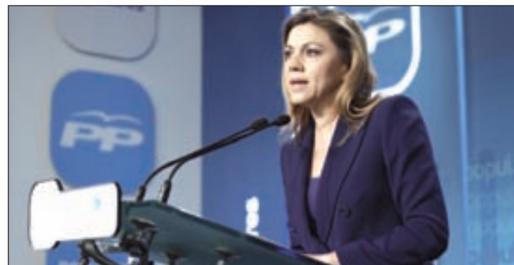
María Dolores de Cospedal, en rueda de prensa

La secretaria general del partido explicó que el cónclave de Valladolid tiene como objetivo servir de punto de partida para las próximas elecciones europeas, hacer balance de los dos años de Gobierno y “demostrar el compromiso del PP con la España actual y la del futuro”.