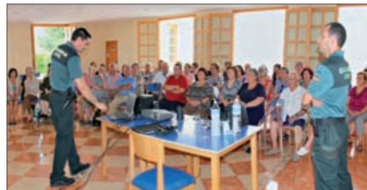
Charlas en un centro de mayores dentro del Plan Mayor Seguridad

El Ministerio explica que, aunque la posibilidad de ser víctima de un delito no es diferente a la de otros grupos de edad, su vulnerabilidad, el mayor grado de aislamiento y dependencia y una acentuada percepción de las situaciones de riesgo, hacen aconsejables programas específicos.