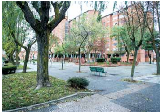
La remodelación de San Juan de los Lagos durará unos 9 meses.

El proyecto también contempla intervenciones en el cruce de la calle Canales y Eloy García de Quevedo, junto al colegio María Madre. Allí, según detalló Ibáñez, se eliminará un carril en el puente sobre el río Vena para aumentar el ancho de la acera más próxima al centro educativo, que pasará de 1,33 metros a 3,25 metros. Además, se proce-