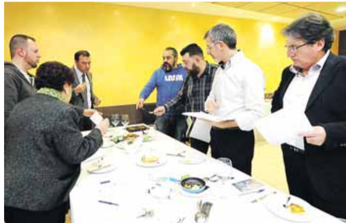
Las tapas participantes en el VIII Concurso de Tapas San Lesmes 2014 fueron degustadas por el jurado el día 22.