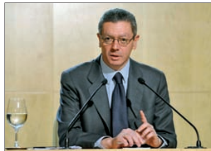
Alberto Ruiz-Gallardón, ministro de Justicia

No es la primera vez que se recorta la jurisdicción universal en nuestro país. En 2009, PSOE y PP pactaron una reforma, aun en vigor, que mantenía la posibilidad de actuar en casos en que hubiese “algún vínculo de conexión relevante con España”, lo que permitió, en la práctica, actuar como hasta el momento.