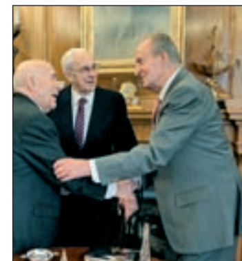
Don Juan Carlos