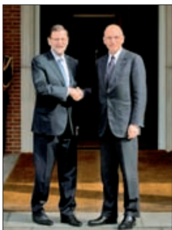
Letta recibió a Rajoy en Roma