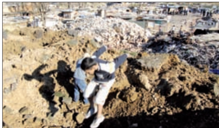
La tasa de pobreza infantil ha aumentado en los últimos años