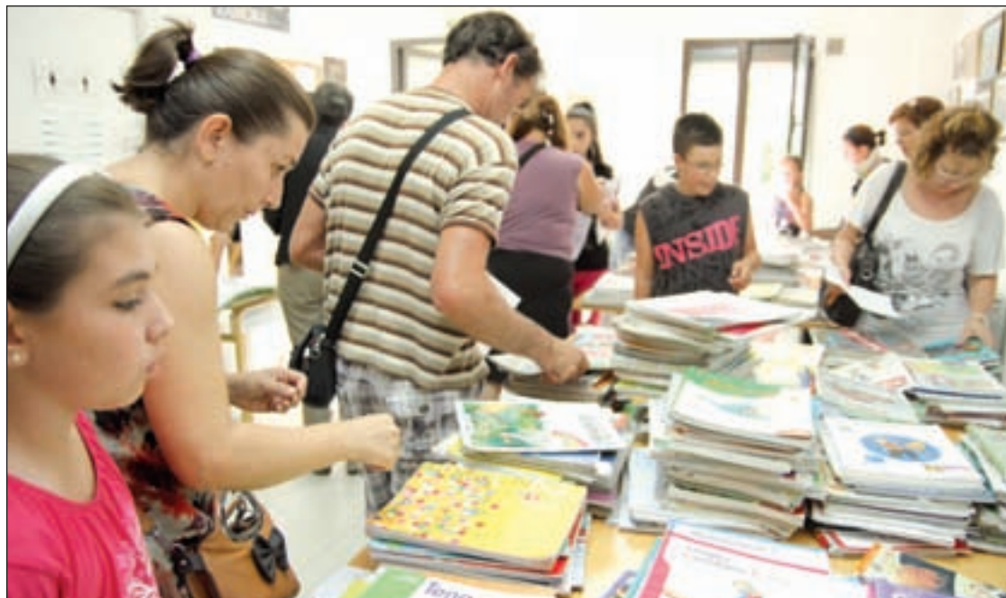
Muchos centros han comenzado a organizar bancos de libros de texto

La campaña de protesta comenzará con la presentación de resoluciones en los Consejos Escolares de cada centro educativo del país negándose a la compra de los textos. Además, recordarán a los profesores su autonomía en la