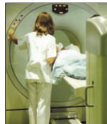
Un paciente en quimioterapia

El tumor con más muertes sigue siendo el de pulmón (20% de todas las muertes), seguido del colorrectal (14,3%) y el de mama (5,9%). Sin embargo, “la implantación adecuada de programas de cribado, acceso a avances terapéuticos y a la prevención” ha reducido la mortalidad en nuestro país, según Garrido, que calcula que viven en España 581.688 personas con cáncer.