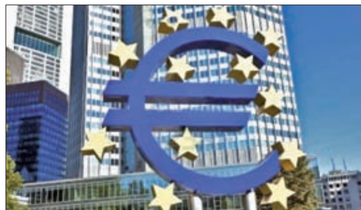
El BCE pide vigilancia sobre las entidades financieras

Además, "pese a los brotes verdes, los altos niveles de paro y la debilidad del mercado inmobiliario siguen suponiendo fuertes dificultades para la rentabilidad de los bancos y los esfuerzos de recapitalización", señala el texto, que añade que "la rentabilidad