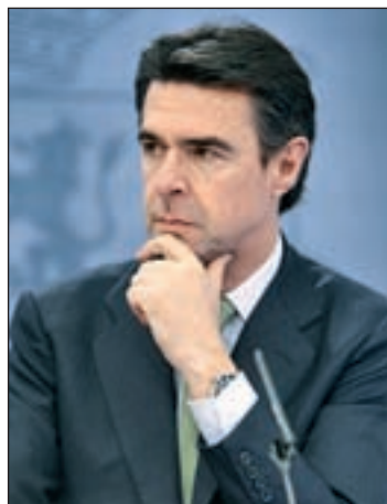
El ministro, José Manuel Soria

Los visitantes procedían principalmente de Reino Unido, Alemania, Francia y Países Nórdicos.