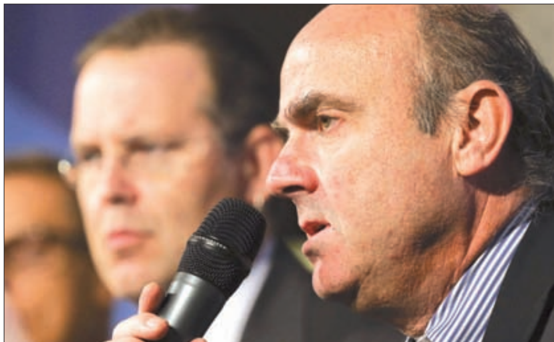
Luis de Guindos, ministro de Economía y Competitividad, cree que la reforma ya da resultados

El informe del FMI vino un día después de reforzar esta opinión al recomendar al Ejecutivo popular que armonice la protección de contratos temporales (con un