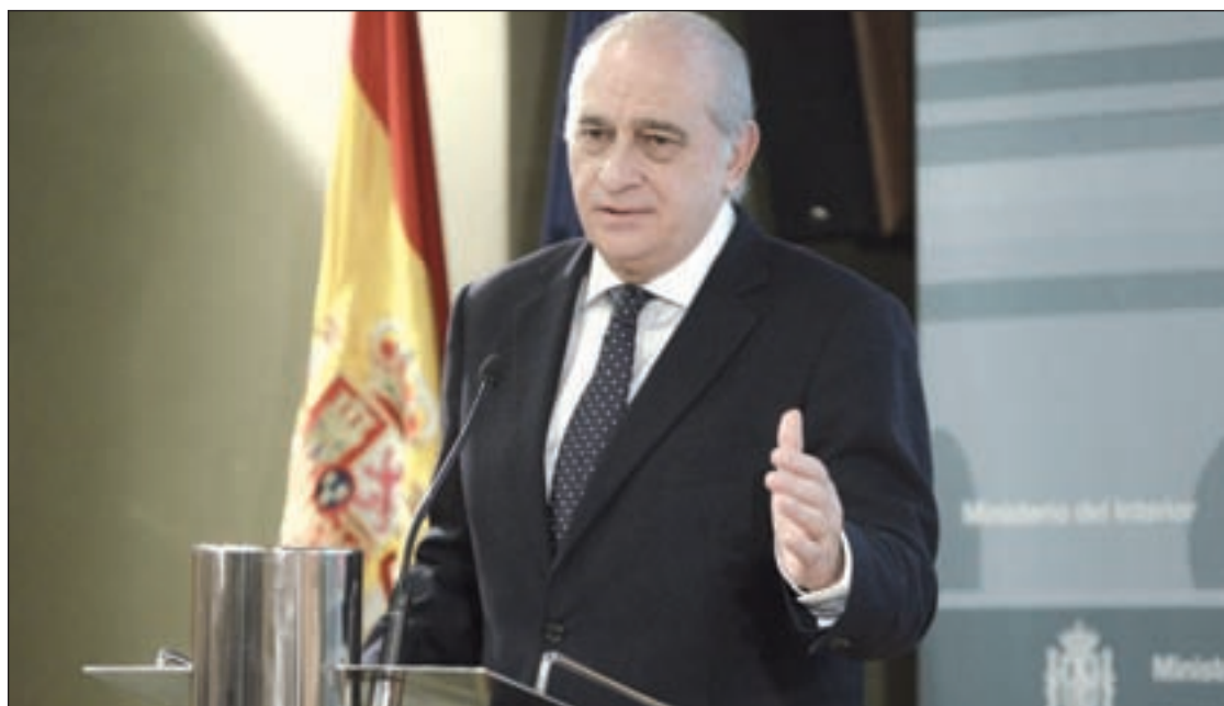
Jorge Fernández Díaz, ministro de Interior, presentó los datos el pasado miércoles

Las subidas de impuestos, que no fueron acompañadas, según Gestha, por un eficiente control tributario, los casos de corrupción, y la justificación social son algunos motivos que explican el incremento del dinero negro.