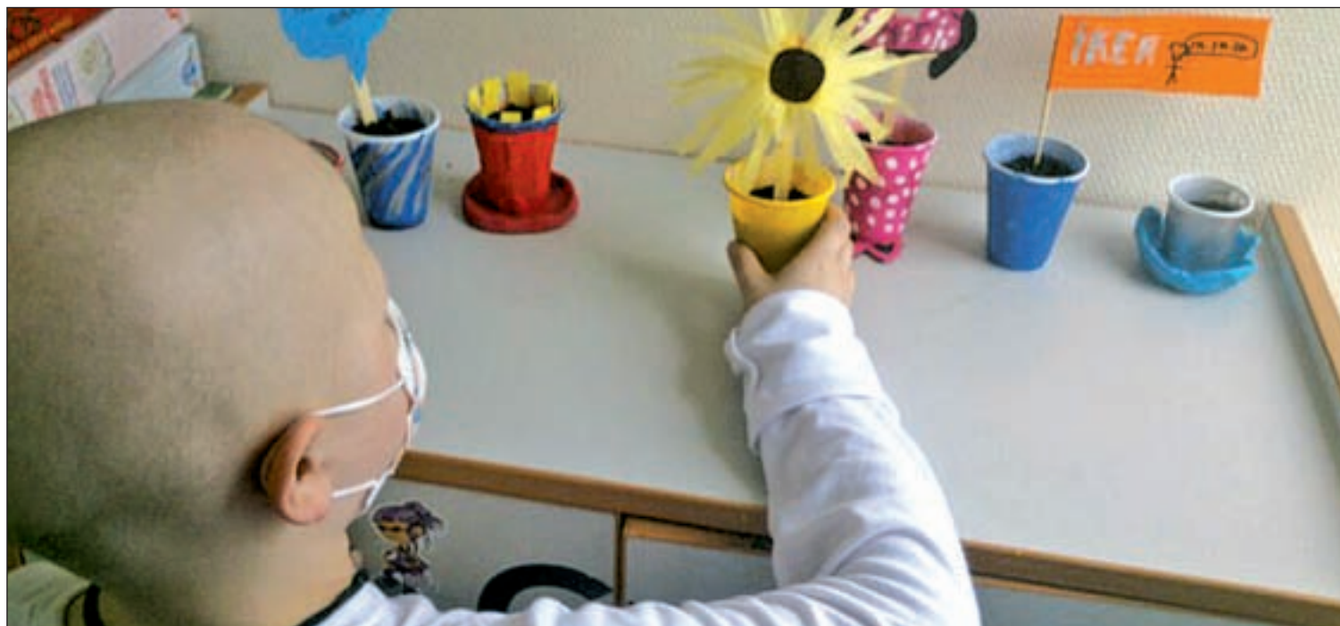
Los familiares se vuelcan en los niños durante el proceso de la enfermedad