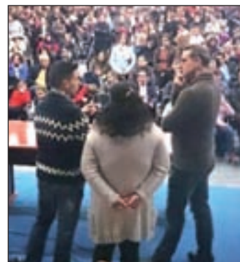
Protesta en Pedrera

El Consistorio explicó que el menor, "en lo que va de curso, aún no ha podido ser escolarizado", ya que el Instituto de Educación Secundaria (IES) Carlos Cano, donde debería estar recibiendo clase junto a sus compañeros, "no tiene recursos adaptados a su discapacidad".