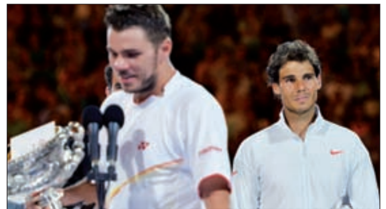
Wawrinka y Nadal, tras la disputa de la final

ya que ha ampliado su ventaja al frente del ranking de la ATP respecto a un Djokovic que no pasó de los cuartos de final. Ahora, el número uno del mundo se recupera de esos problemas musculares con la vista puesta en los primeros torneos de Masters 1000, los de Indian Wells y Miami, que se jugarán en el mes de marzo.