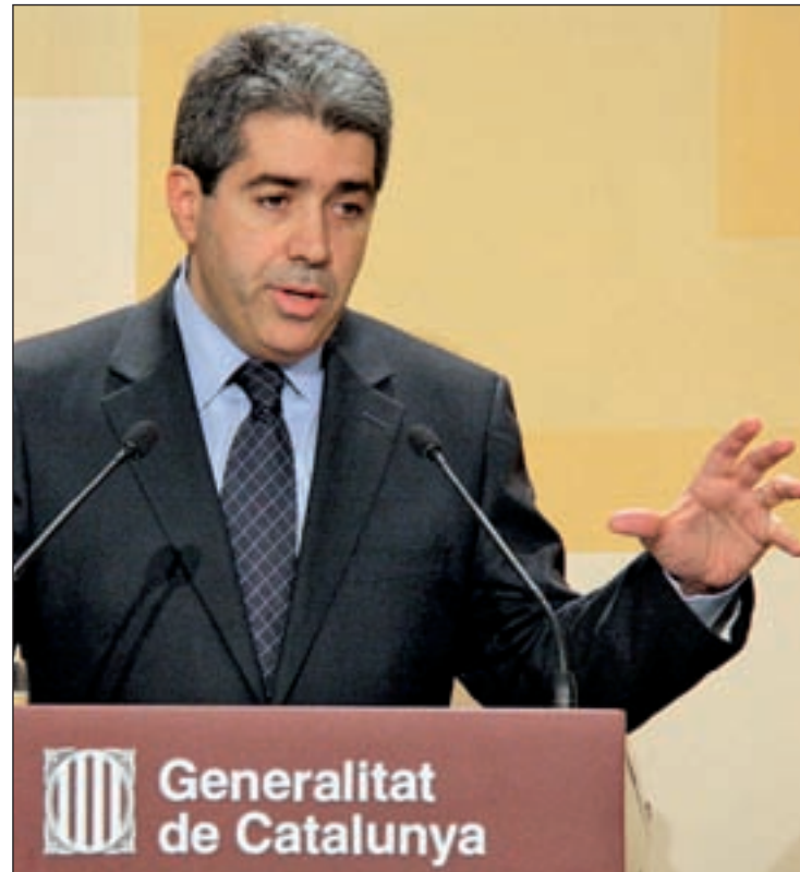
Francesc Homs, portavoz del Gobierno de la Generalitat

El Supremo afirma que la medida cautelar "intenta salvaguar-