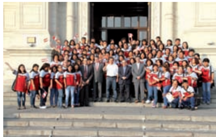
Becados por el Ministerio de Educación de Perú