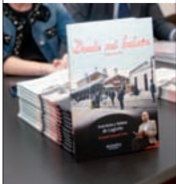
Desde mi balcón. Segunda parte.