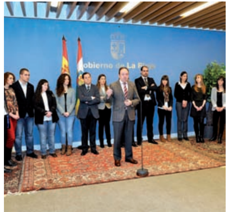
Reunión con los ocho investigadores.

Los nuevos investigadores van a trabajar en siete proyectos de I+D. Así, los profesionales que se han incorporado al CIBIR se