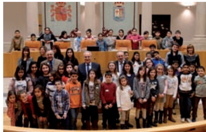
Los escolares en el hemiciclo del parlamento.