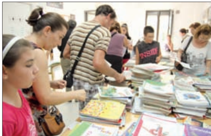
Intercambio de libros en un colegio

La campaña de protesta comenzará con la presentación de