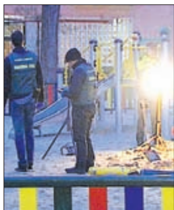
Ambulancia en el parque