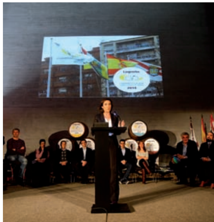
Gala celebrada en el Centro de la Cultura del Rioja.

Como señaló la alcaldesa, también tendrán cabida las actividades que aúnan deporte y solidaridad, en la línea de la iniciativa “Deporte por un kilo” que se