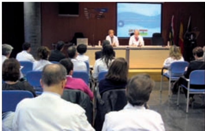
Reunión de profesionales sanitarios.