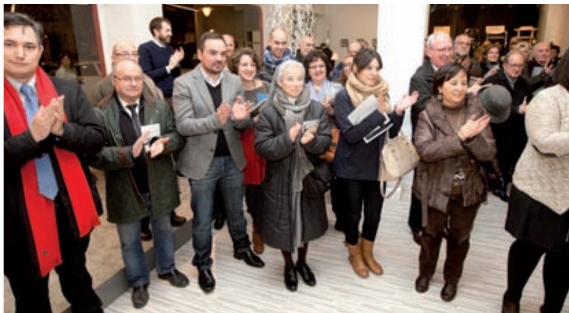
Numerosa afluencia de público en la presentación del libro.

El libro, 'Desde mi balcón. Anécdotas y relatos de Logroño', ya a la venta, puede adquirirse en las librerías de Logroño.