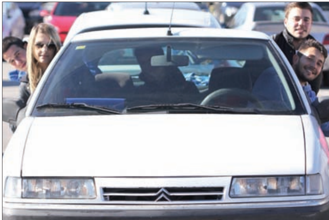
Los cinco estudiantes dentro del coche en el que viajan todos los días

presas buscar acompañantes para sus trayectos y, de esta forma, reducir las emisiones contaminantes a la atmósfera y el peso económico que supone ‘pasear’ el coche todos los días.