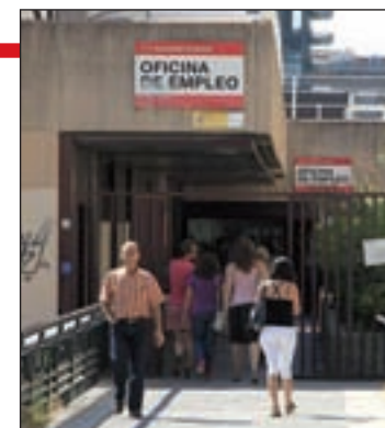
Oficina de Empleo

que es del 16%, lo que significa que “las políticas que lleva a cabo el Ejecutivo autonómico en materia de empleabilidad son las correctas”.