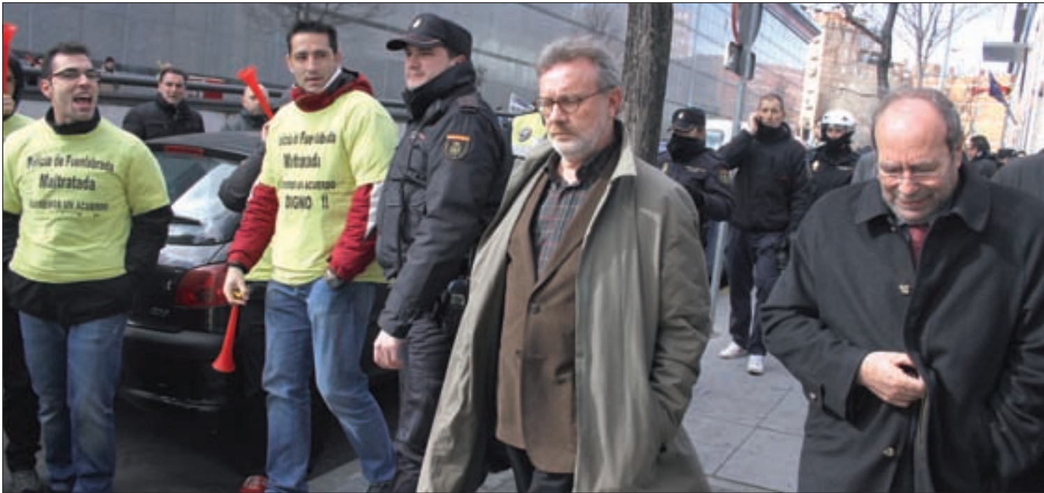
El alcalde Manuel Robles saliendo de los Juzgados de Fuenlabrada