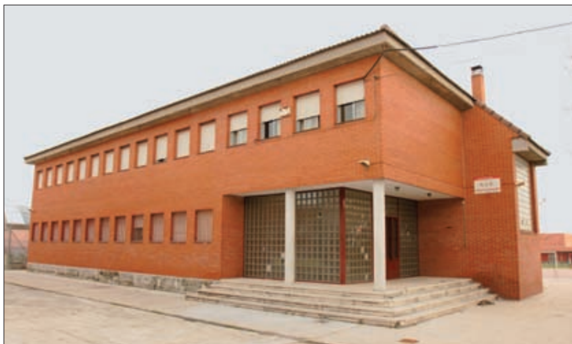
IES Carpe Diem de Fuenlabrada