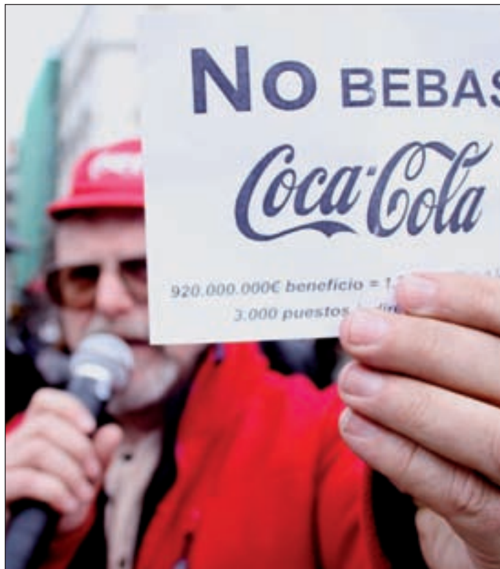
Trabajadores manifestando en la Puerta del Sol

Razones que mueven a estos trabajadores a “llevar a la marca