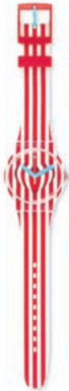
Reloj SWATCH Edición San Valentín, 60c