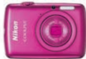
Cámara NIKON Coolpix S01, ultracompacta, con memoria interna de 7,3 Gb, 3 horas de vídeo, 79c