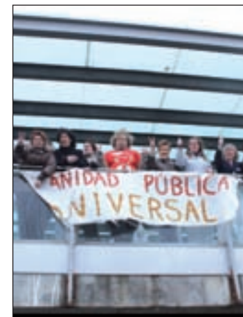
Celebración de la Marea Blanca