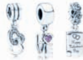
Charms de Pandora, 39c