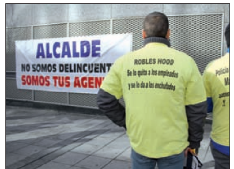
UN GRUPO DE POLICÍAS a las puertas de los Juzgados de Fuenlabrada donde Manuel Robles acudió por la querrela interpuesta por un exfuncionario. Los agentes han pitado al alcalde y han portado camisetas donde se podía leer "Robles Hood, se lo quita a los empleados y se lo da a los enchufados".

De no conseguir llegar a un acuerdo, la Policía y los sindicatos han afirmado que volverán a los Juzgados, aunque reconocen que están ya muy desgastados. "Lo mejor es llegar a un acuerdo favorable para las dos partes y sobre todo para los ciudadanos", finalizaron.