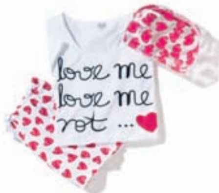
Pijama de ÉNFASIS en neceser de corazones, 29,90c