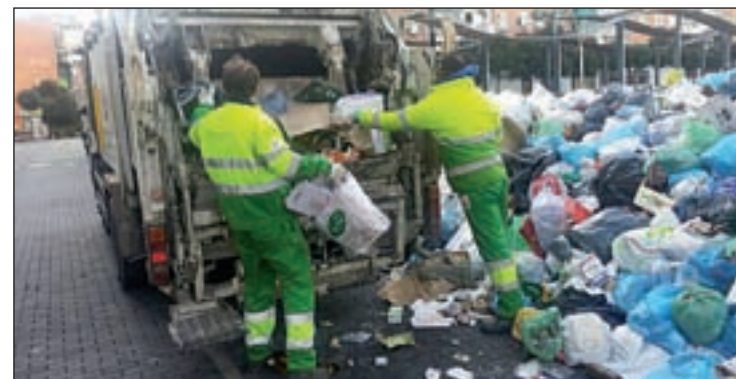
Operarios de ESMASA recogiendo la ciudad