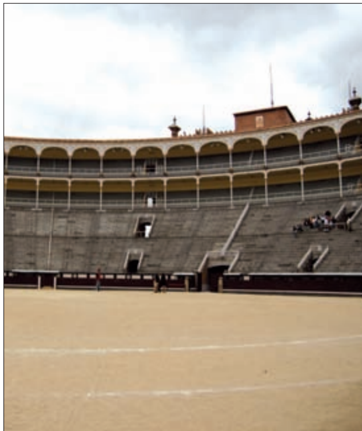
La madrileña plaza de toros de Las Ventas

Entre las novedades, el 19 de junio, coincidiendo con el Corpus, habrá una festividad de promoción, a la que los aficionados taurinos podrán acudir de manera gratuita para disfrutar del arte de los alumnos de las cuatro escuelas de tauromaquia de la región. El objetivo es que el gran público pueda conocer de cerca el trabajo que realizan estos aspirantes a grandes toreros, que se forman en los centros de Madrid, Morzarzal, Arganda del Rey y Colmenar Viejo.