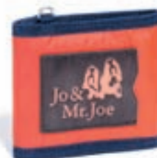
Cartera para hombre JO & MR. JOE, 14,90c

HAZ TU REGALO DESDE CUALQUIER PARTE Y HAZLO LLEGAR ¡A TODAS PARTES!