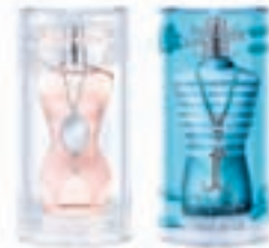
JEAN PAUL GAULTIER: -20% de descuento en su fragancia Classique "San Valentín" -25% de descuento en Le Male "San Valentín".