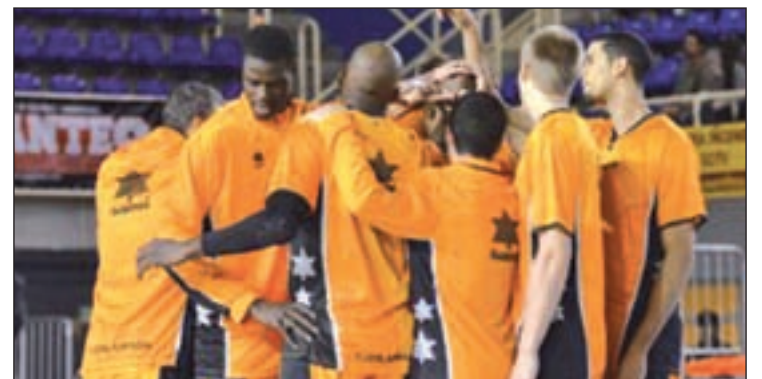
El Fuenlabrada en el partido contra el Murcia

A pesar de los esfuerzos y de un buen partido, el Murcia no logró quitarse el mal sabor de boca de sus dos últimos enfrentamientos, donde fue derrotado frente al Río Natura Monbus y el CAI Zaragoza.