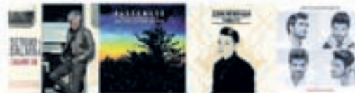
Más de 30 novedades de música con un -15%