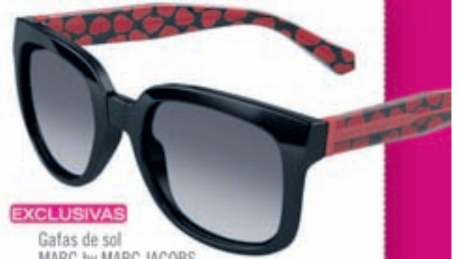
EXCLUSIVAS Gafas de sol MARC by MARC JACOBS, exclusivas para El Corte Inglés, 100c