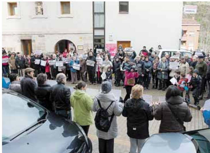
Los vecinos de Oña se manifestaron contra el cierre de las urgencias.

Asimismo, la secretaria de Organización del PSOE mostró su temor a que se produzcan nuevos recortes en el transporte de acceso a los consultorios y hospitales, y afirmó no entender cómo la Junta "se ha empeñado" en restar per-