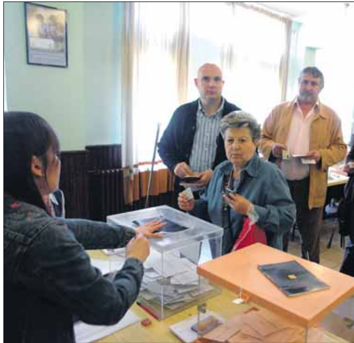
El PP tiene una estimación de voto del 32,1%.

Los populares registraron en enero su peor dato en una encuesta del CIS, con una estimación de voto del 32,1%, lo que supone 1,9 puntos menos que tres meses antes y doce puntos por debajo de su resultado en las generales de 2011. A pesar de esta caída, el partido del Gobierno mantiene 5,5 puntos de ventaja con su inmediato perseguidor, el PSOE, que marca su cota mínima con un apoyo del 26,6%.