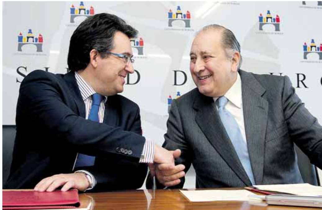
El rector de la UBU y el presidente de la Junta provincial de la AECC rubricaron el convenio el lunes 3.