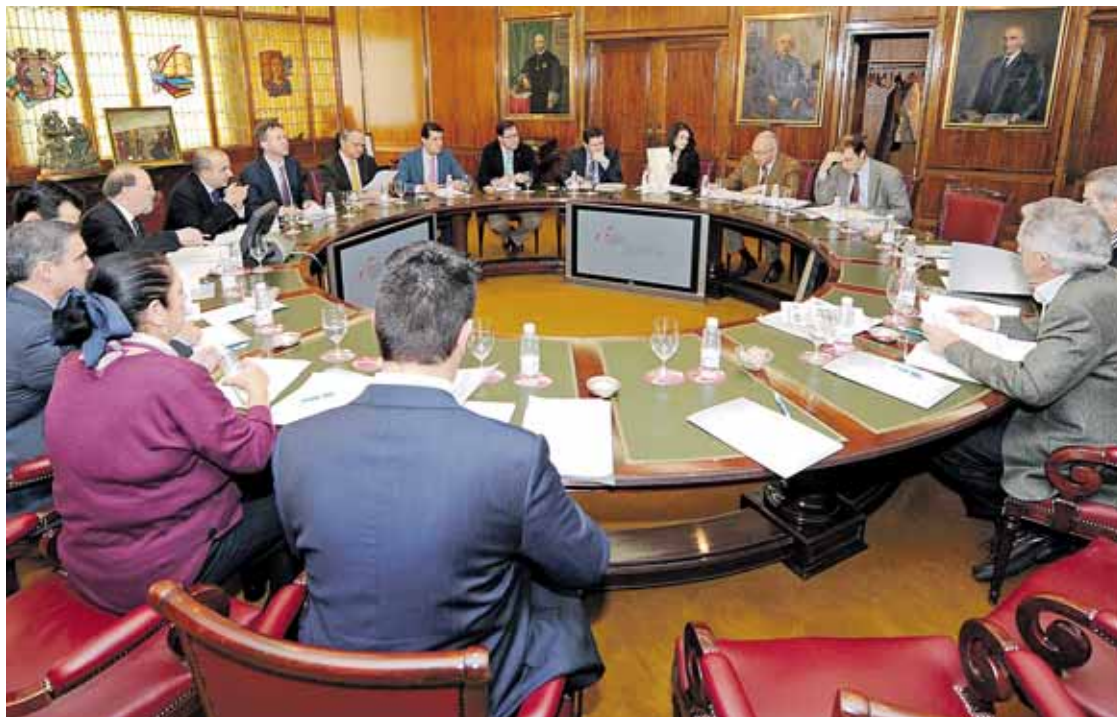
La reunión del Consorcio para la Gestión de la Variante Ferroviaria de Burgos se celebró el día 5 en la sede central de CajaCírculo, en Plaza España.