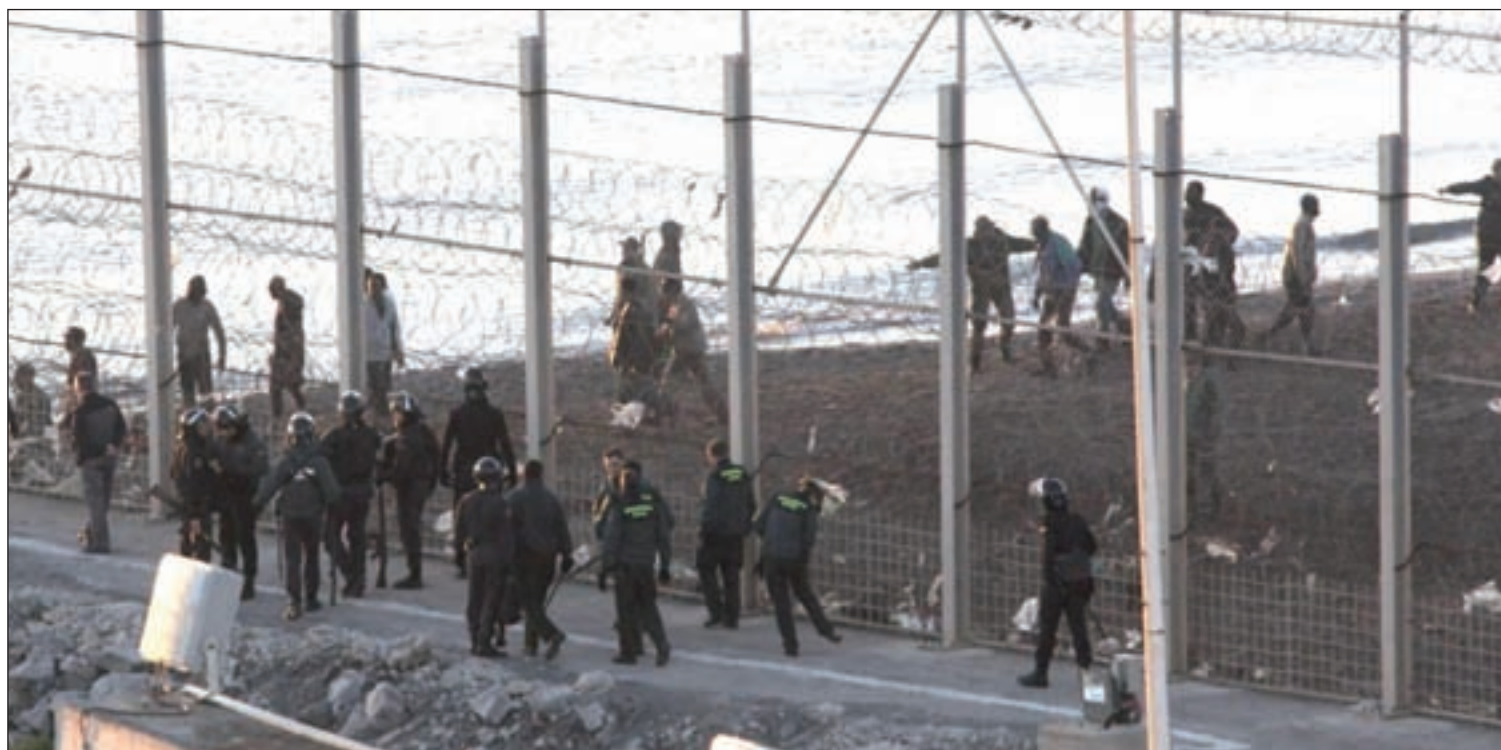
Los inmigrantes tratan de entrar en el país en oleadas por tierra o por mar