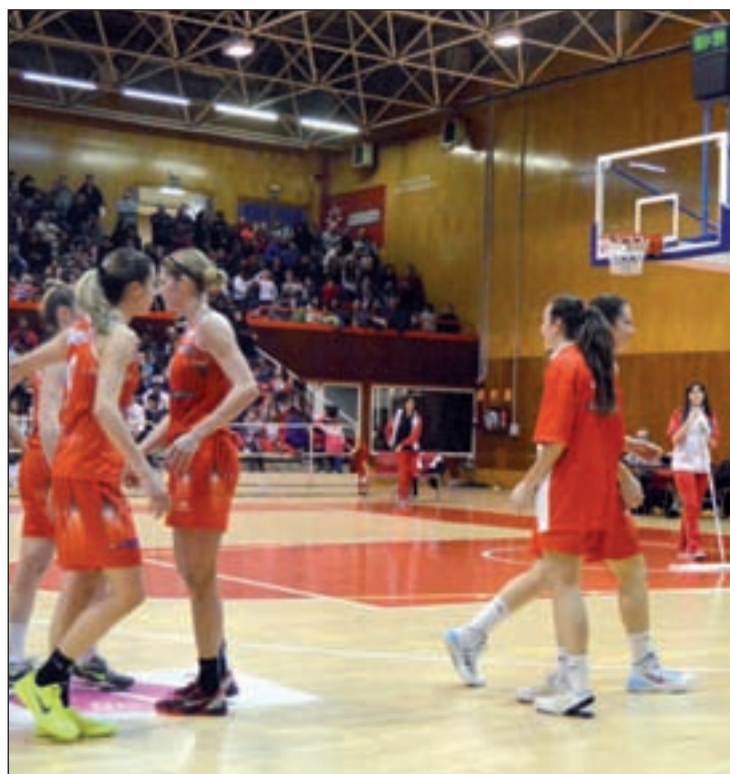
Las chicas del Rivas defienden su corona del año pasado

La culpa de que el Perfumerías Avenida no completase el 'doble' la pasada campaña la tiene el Rivas Ecópolis. El conjunto madrileño se ha convertido en los últimos años en uno de los grandes animadores del torneo copero y ha evitado que el Perfumerías