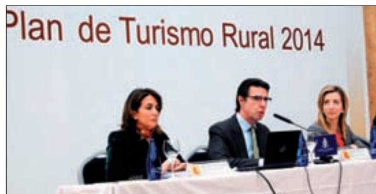
José Manuel Soria, ministro de Industria, presentó el plan

En este sentido, Soria hizo hincapié en que el objetivo es "la me-