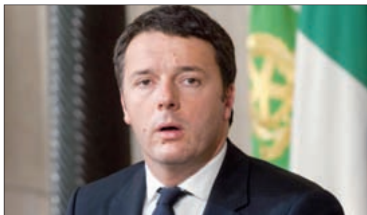
El nuevo primer ministro, Matteo Renzi

Renzi, que se convertirá en el primer ministro más joven de Europa, declaró que el Gobierno