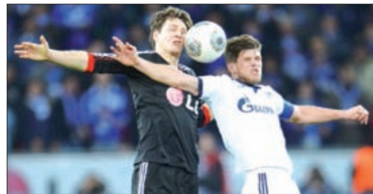
Huntelaar se medirá a sus excompañeros

Los que tampoco pueden permitirse fallos son los representantes españoles en la Europa League, ya que se enfrentan a los choques decisivos de las eliminatorias de dieciseisavos de final. El Betis visita al Rubin Kazan (18 horas), mientras que el Sevilla y el Valencia jugarán en casa.