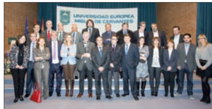
Un momento de la entrega del premio

su actividad comunicativa. El jurado estuvo formado por directores de medios de la región, entre los que se encontraba el Grupo de Información Gente, los presidentes de las asociaciones de prensa de la Comunidad, y la presidenta de la Asociación de Directivos de Comunicación de Castilla y León.