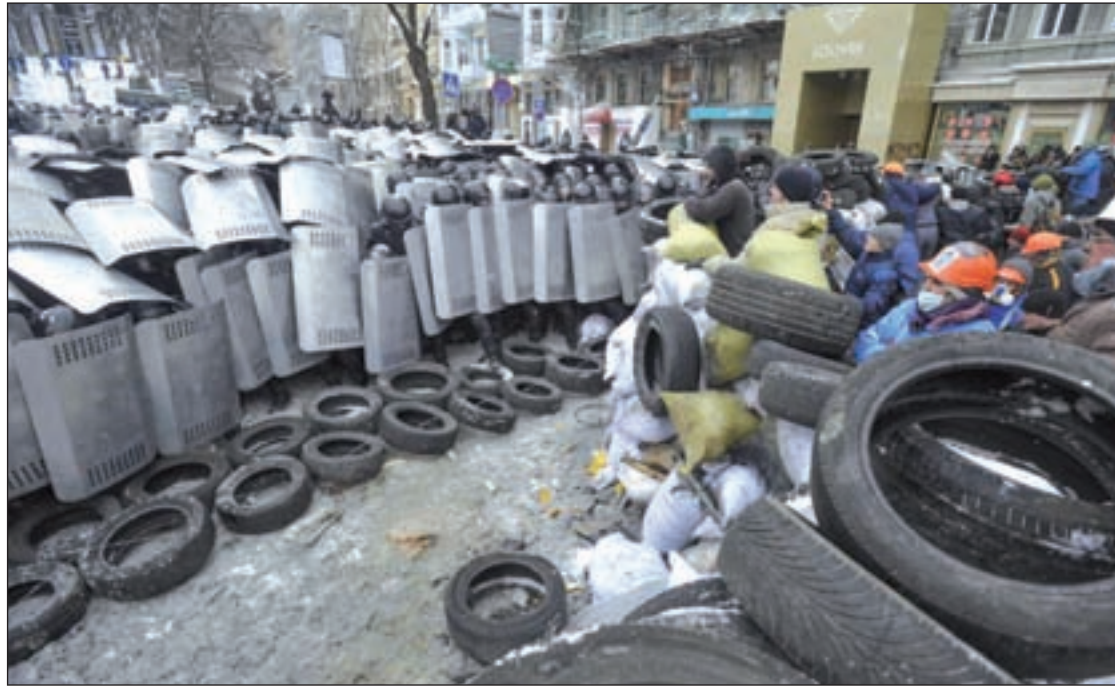
La oposición y las fuerzas de seguridad ucranianas se enfrentan en las calles de Kiev

Otra de las medidas que se contemplaron el jueves en la reunión extraordinaria del Consejo de Asuntos Exteriores es la elabora-