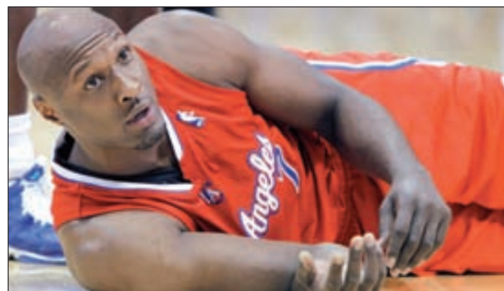
Lamar Odom, durante su estancia en los Clippers

A falta de ver cómo ha llegado desde el punto de vista físico, Odom podría realizar su debut como jugador del Laboral Kutxa