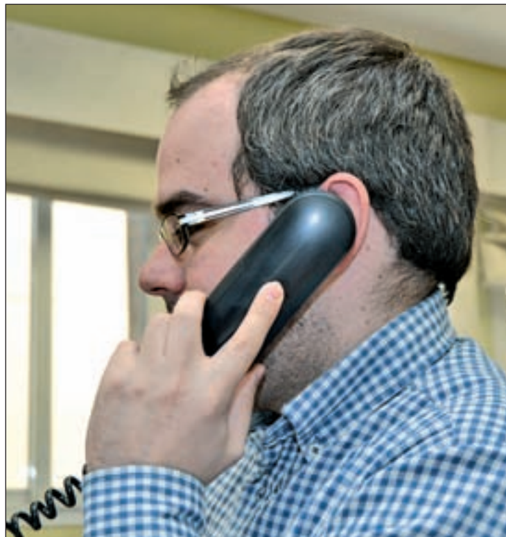
La ley también obliga a las telefónicas a informar

Igualmente, se han incorporado al texto presentado por el Gobierno dos enmiendas de la Iz-