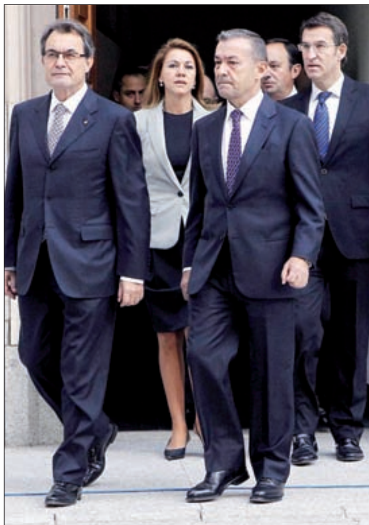
La pobreza material creció en 12 de las 17 comunidades autónomas