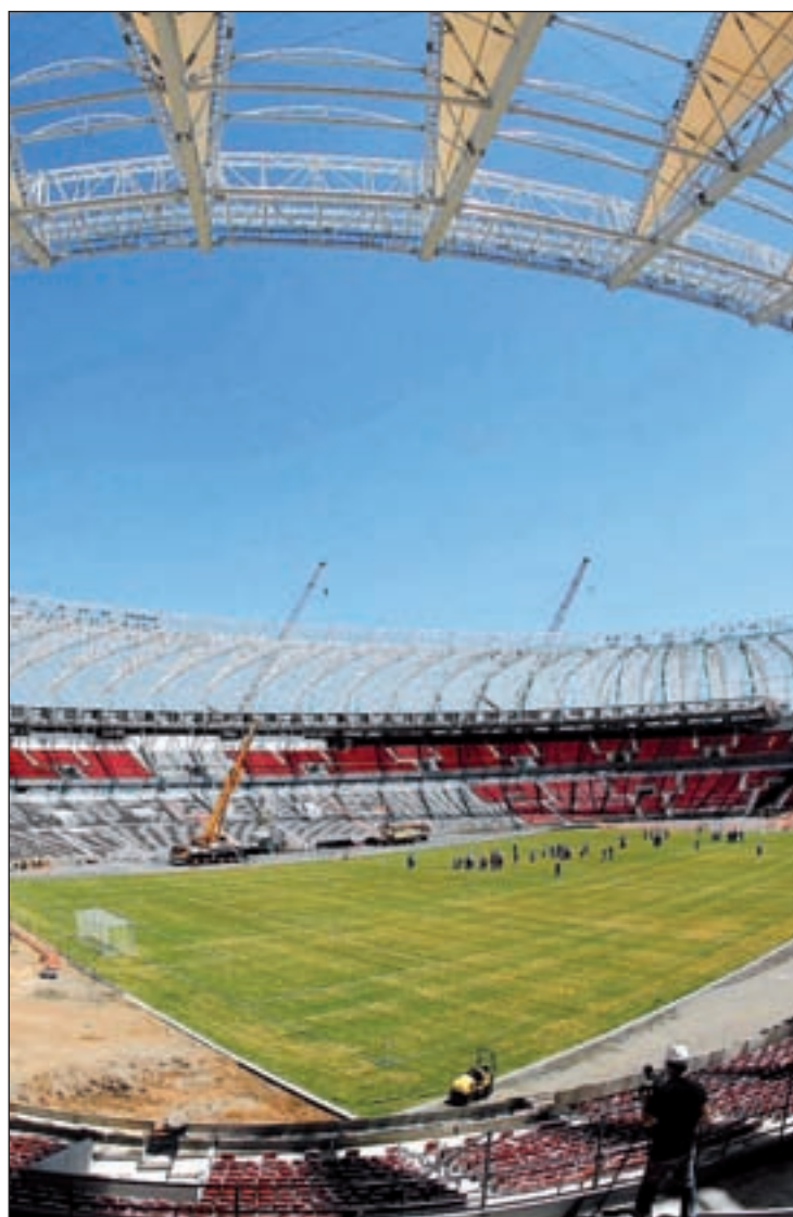
Los obreros siguen trabajando contrarreloj

Para que la ciudad brasileña viera confirmado su estatus de sede mundialista ha sido clave el papel del consultor de estadios de la FIFA, Charles Botta. El arquitecto visitó las obras unas semanas después del ultimátum dictado por el organismo que preside Joseph Blatter y pudo comprobar de primera mano que los trabajos han avanzado considerablemente. De hecho, se ha llegado a asegurar que en apenas 15 días se han completado las labores pro-