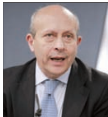
José Ignacio Wert

“Pedimos estabilidad para que no haya incertidumbres y que todo el mundo se sienta cómodo”, expuso, al tiempo que repasó reivindicaciones empresariales para Catalunya como proyectos pendientes en infraestructuras y una fiscalidad más adecuada para el crecimiento económico y la lucha contra la economía sumergida.