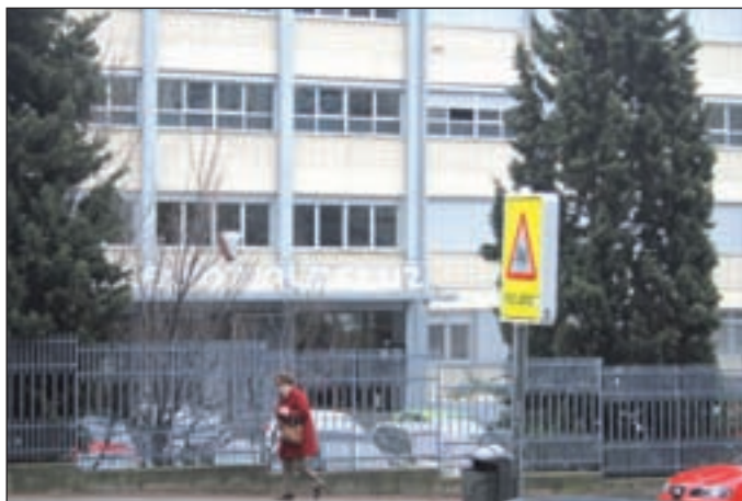
Fachada del colegio madrileño