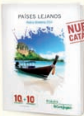
ASIA Y OCEANÍA

DESCUENTO NO APLICADO EN PRECIOS PUBLICADOS