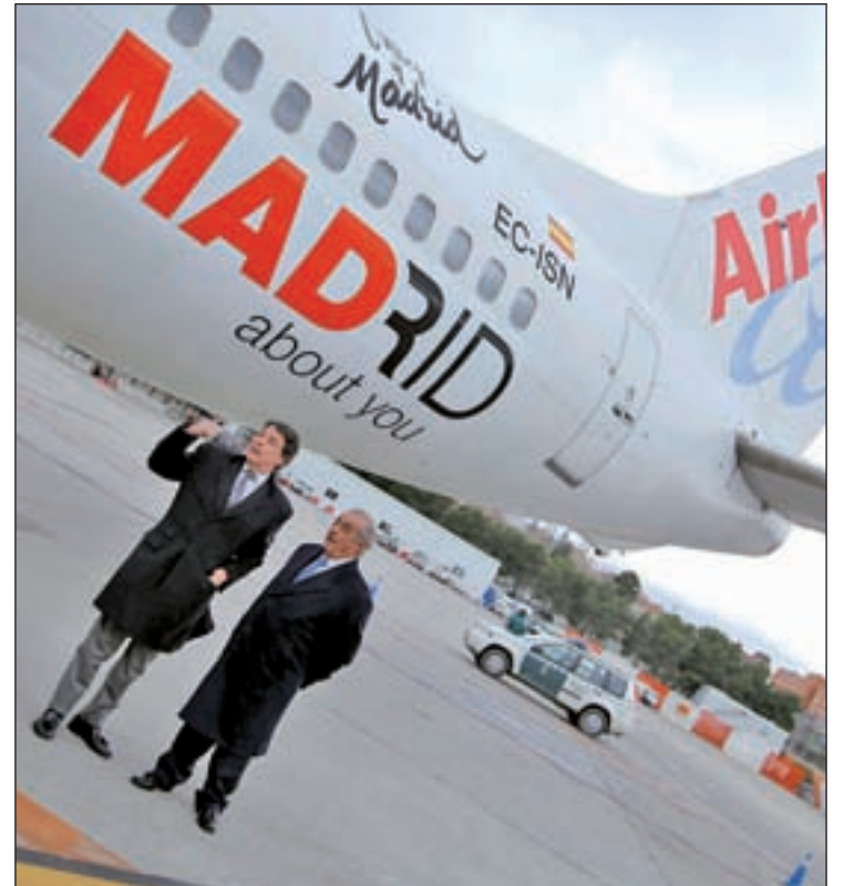
Ignacio González y Juan José Hidalgo junto a la aeronave

Así, el presidente del Ejecutivo regional, Ignacio González, acompañado de la consejera de Turismo, Ana Isabel Mariño, de la presidenta del Aeropuerto Madrid-Barajas, Elena Mayoral, y del presidente de Air Europa, Juan José Hidalgo, visitó el pasado lunes, en las pistas de la Terminal 3 de dicho aeropuerto, el primer avión que llevará impreso este reclamo turístico: un Boeing 737-800 con capacidad para 175 pasajeros que operará vuelos internacionales.