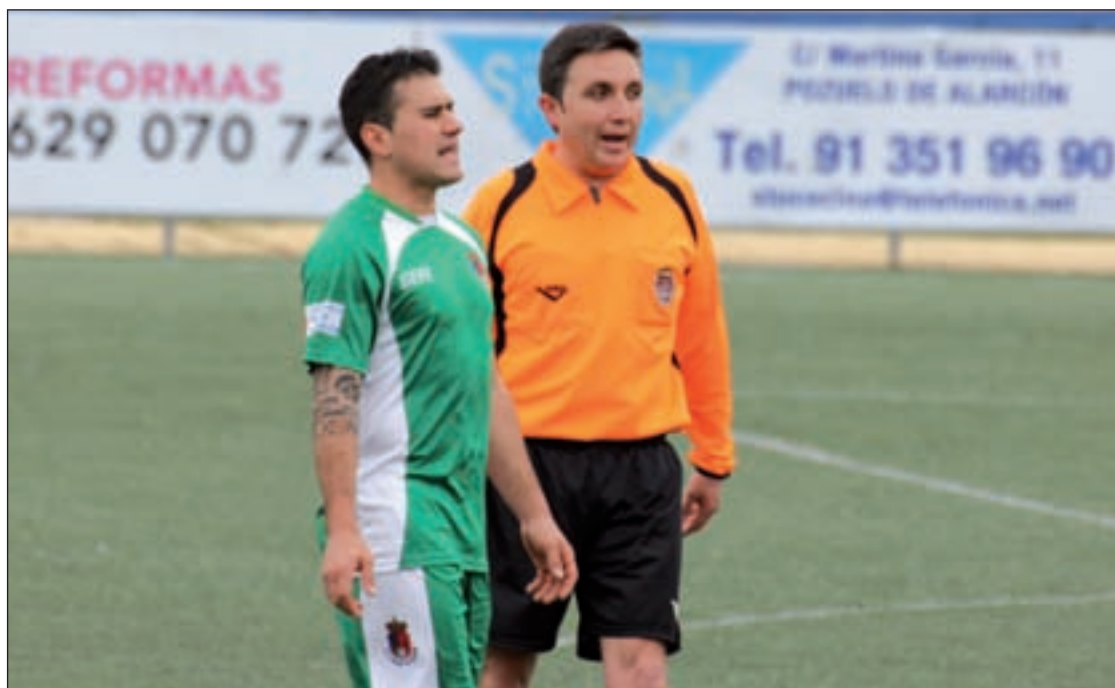
Un jugador del Pozuelo conversa con el árbitro

La derrota del Pozuelo supuso la victoria para otro club del Noroeste, el Collado Villalba, que cada vez ve más cerca la permanencia. Los tres puntos conseguidos le sitúan ya en la decimocuarta posición de la tabla y empata con sus dos predecesores, el Atlético de Pinto y la AD Parla. Su próximo encuentro lo disputará ante el séptimo clasificado, el CD San