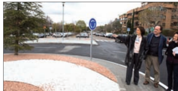
Nueva rotonda en Pozuelo

Además de la nueva rotonda se han instalado nuevas señales de tráfico, se ha asfaltado la calzada y se han repintado los pasos de cebra.