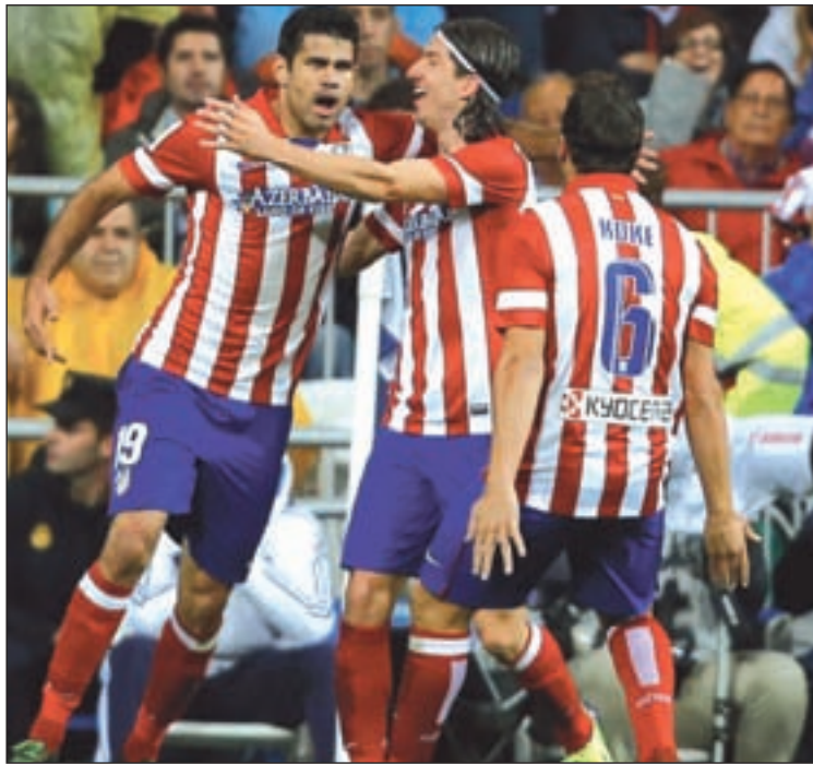
El Vicente Calderón acoge el partido más importante de la jornada