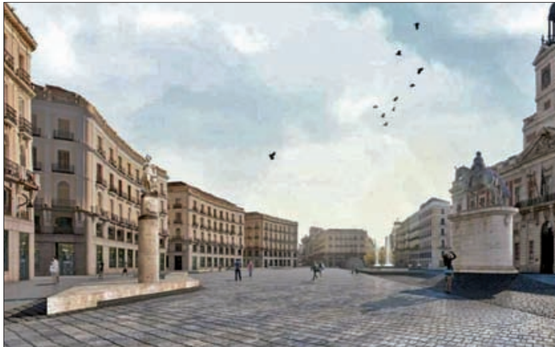
El proyecto ganador, 'El sol del membrillo'