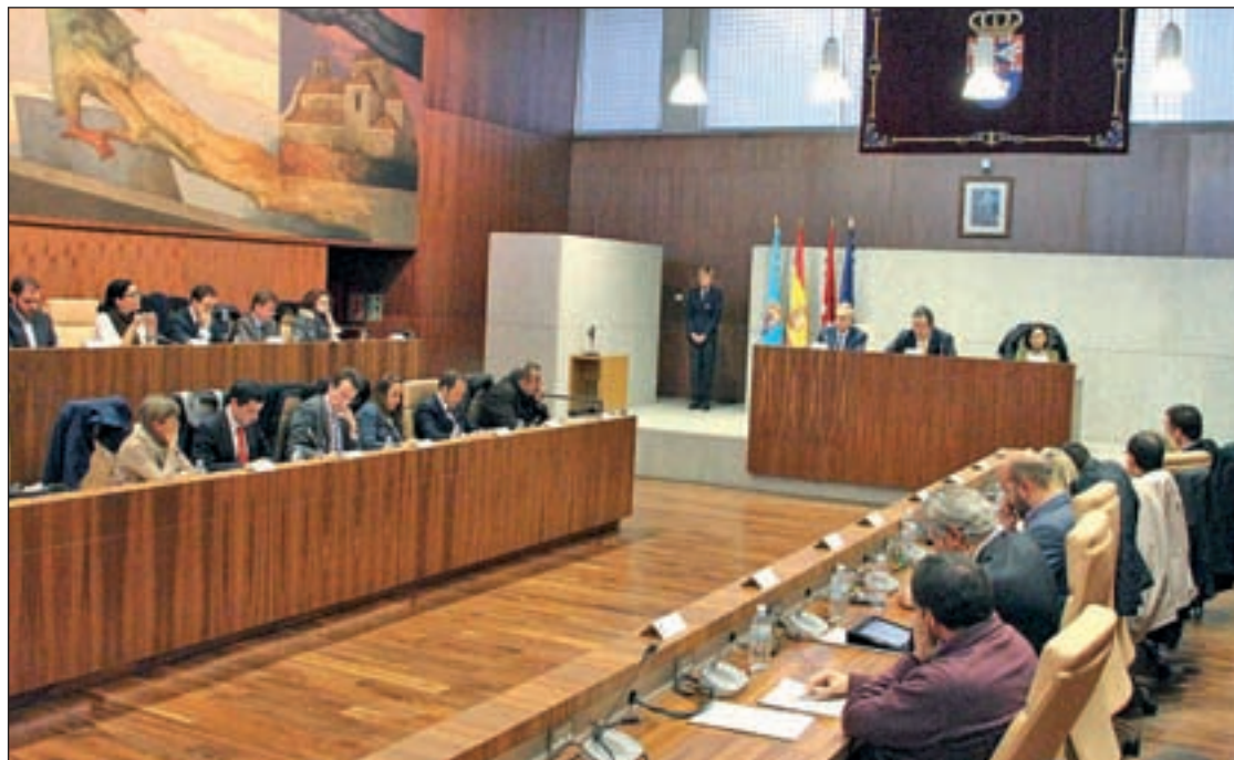
Pleno del Ayuntamiento de Leganés

“Excepcionalmente, cuando el Pleno de la Corporación Local no alcanzara, en una primera votación, la mayoría necesaria para la adopción de acuerdos, la Junta de Gobierno local tendrá competencia para aprobar el presupuesto del ejercicio inmediato siguiente, siempre que previamente exista un presupuesto prorrogado”. También, entre otras cosas, los planes