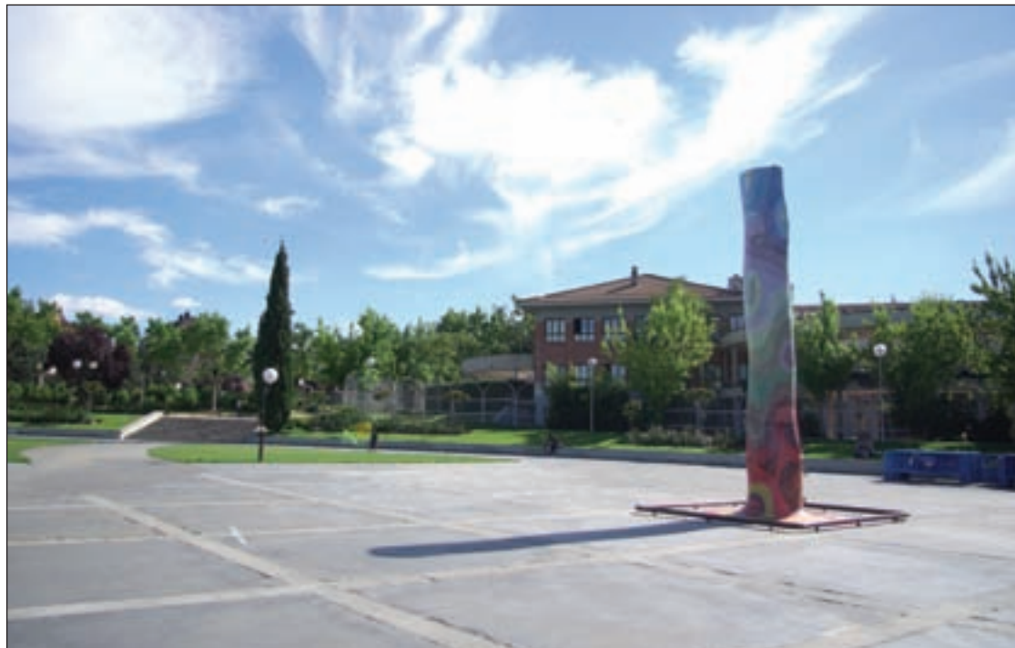
Parque Colón

El plazo de ejecución es de cinco meses y tendrá un coste de