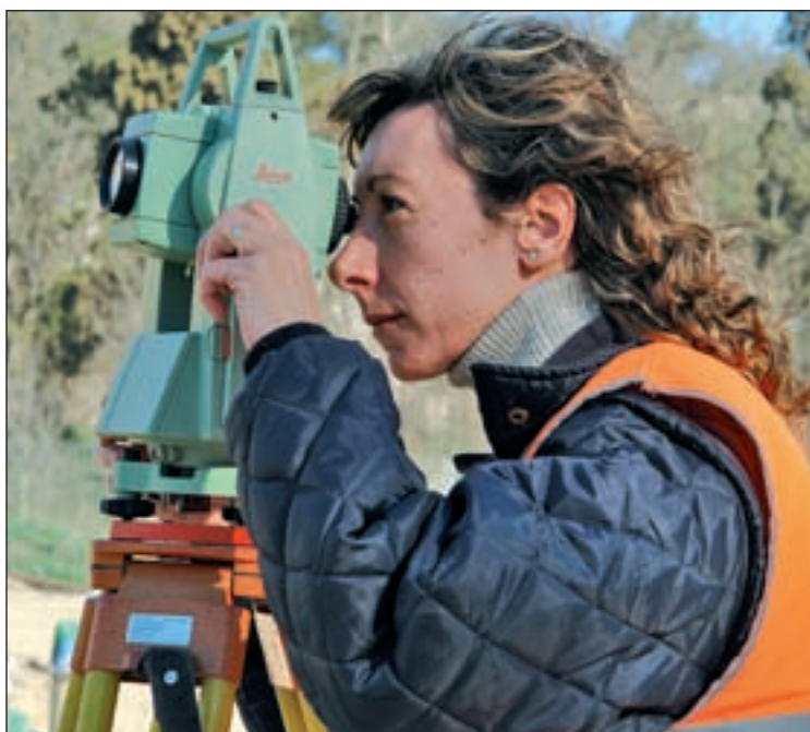
La 'feminización' de los puestos de trabajo es uno de los puntos pendientes. A la izquierda, una secretaria y a la derecha, una técnico GENTE