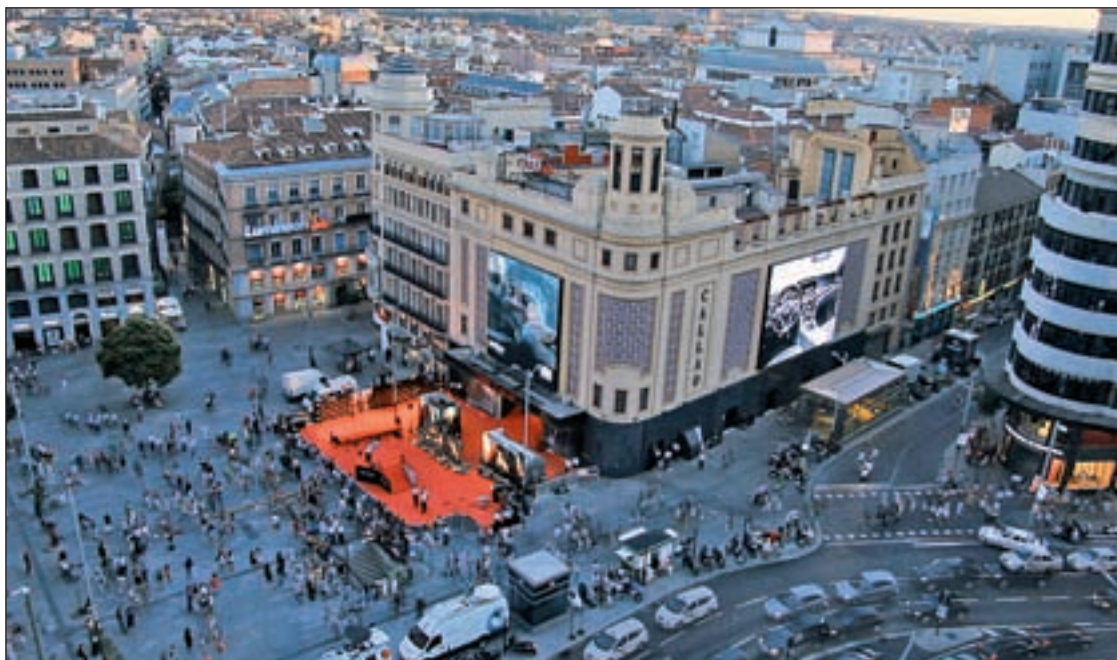
Alfombra roja en los cines Callao