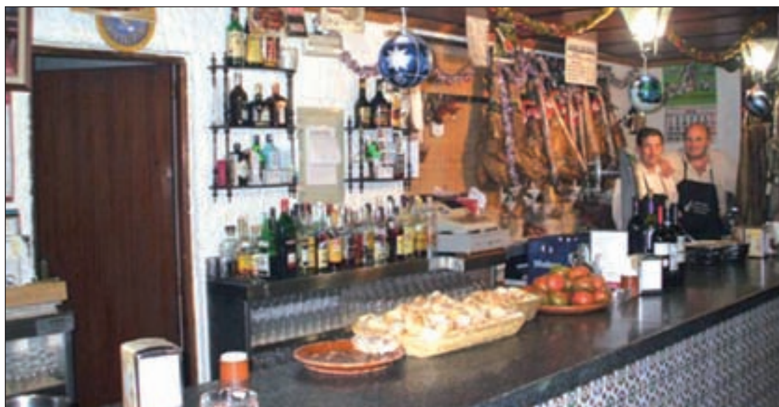
Mesón Jamonero Canete, establecimiento que participa en las jornadas gastronómicas

Tanto el montaje como la interpretación también correrán a cargo de todos los alumnos del Bachillerato de Artes Escénicas del Instituto Carlos Bousoño y los profesores del departamento que han ideado la obra titulada 'Aventuras en Sonidolandia', en la que narrarán las peripecias de personajes como Tina Cantarina, Sebastián Tantán y un joven extraterrestre que procede de un lugar donde no existe el sonido ni la música.