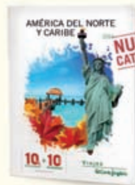
AMÉRICA DEL NORTE Y CARIBE

RESERVA POR SOLO 100€ POR PERSONA (1) SIN GASTOS DE ANULACIÓN HASTA 28 DÍAS ANTES DE LA SALIDA (1)