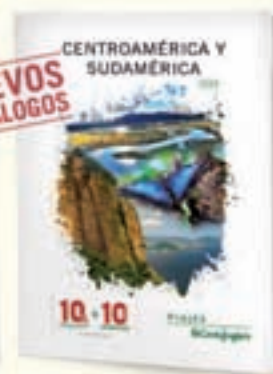
CENTROAMÉRICA Y SUDAMÉRICA