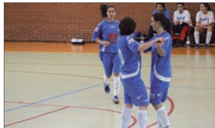
Jugadoras del Afar4 Majadahonda celebran un gol

Al final del partido, las majariegas se mostraban satisfechas con el trabajo. Un partido complicado en el que la efectividad y el excelente trabajo defensivo de-