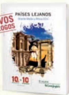
ORIENTE MEDIO Y ÁFRICA

RESERVA POR SOLO 100€ POR PERSONA (1) SIN GASTOS DE ANULACIÓN HASTA 28 DÍAS ANTES DE LA SALIDA (1)