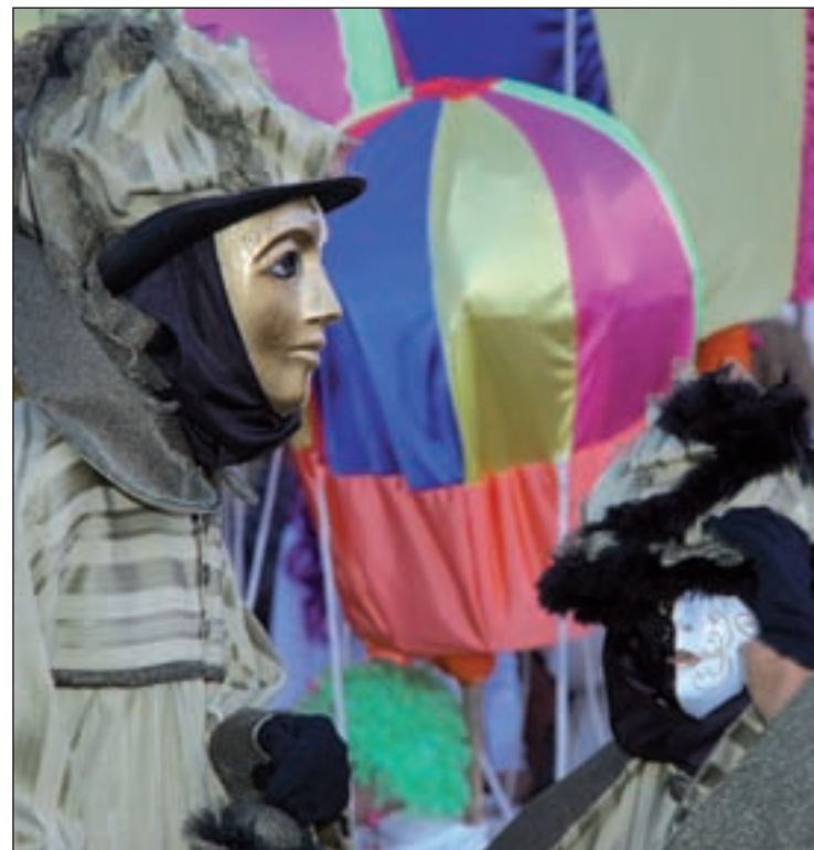
Las máscaras como protagonistas de los carnavales GENTE

Las carrozas y las comparsas animarán, a partir del 1 de marzo, unas actividades que ya se han convertido en todo un atractivo en la Sierra. Comenzarán a las 16:30 horas en la Plaza de la Estación, y a partir de las 18:30 horas