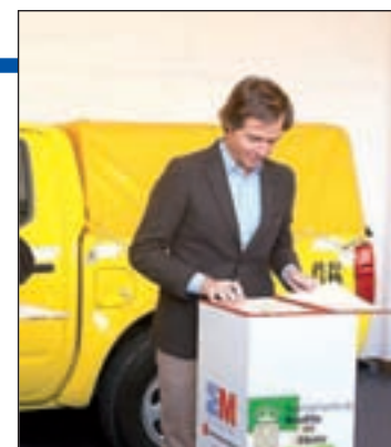
Firma del convenio

Un convenio entre el Consistorio y la Comunidad incorpora un nuevo operativo en La Milagrosa