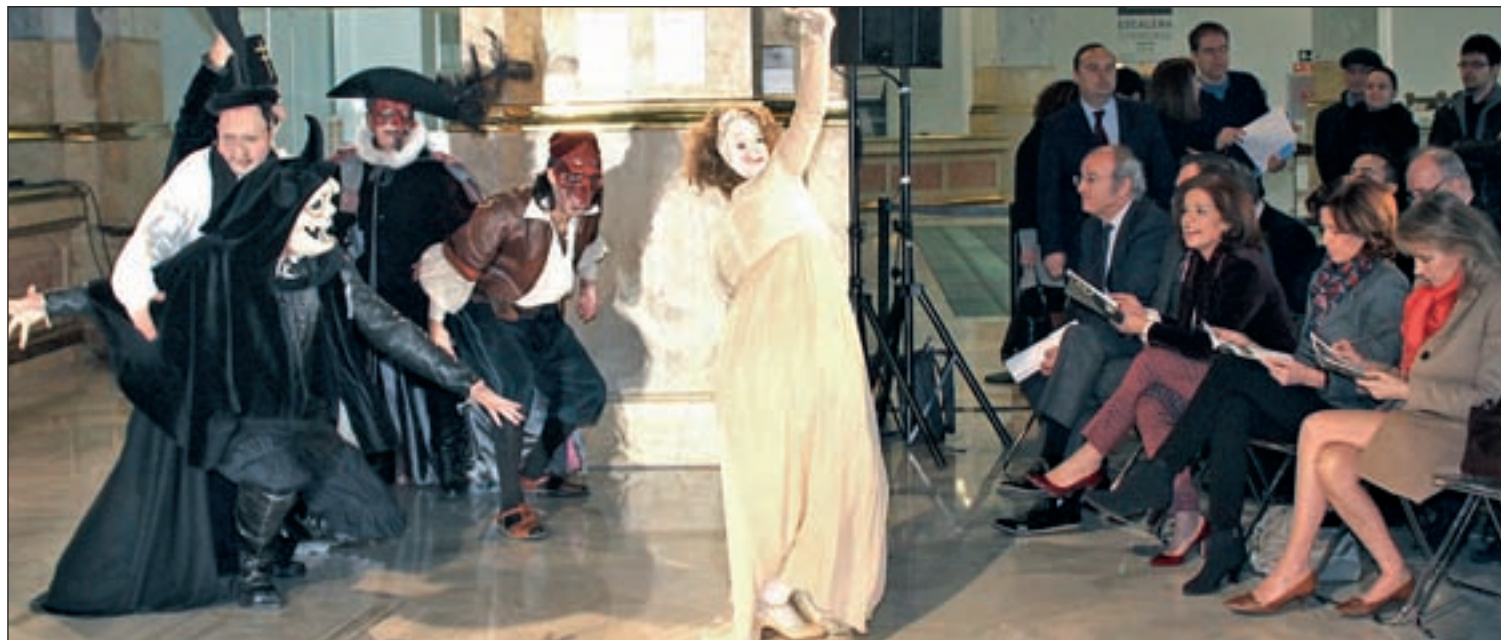
La alcaldesa de Madrid, Ana Botella, en la presentación de los carnavales de la capital