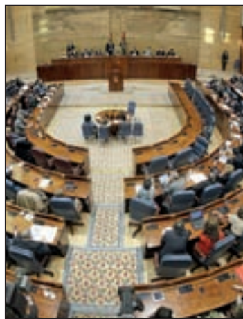
Asamblea de Madrid GENTE

Las nóminas de los 129 diputados de los cuatro grupos parlamentarios de la Asamblea de Madrid están en la web del Parlamento regional desde el pasado viernes día 21. Conforme al acuerdo alcanzado hace unos meses por la mesa, las remuneraciones de los miembros del PP, PSOE, IU y UPyD son públicas, y desvelan un sueldo base de 3.503 euros brutos al que hay que aplicar los pluses que reciben.