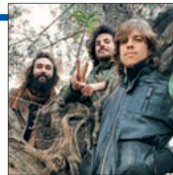
El grupo 84

J. Nacimos los tres en el año 84. Cuando nos juntamos vimos que era un poco lo que nos unía, con ese tinte generacional.