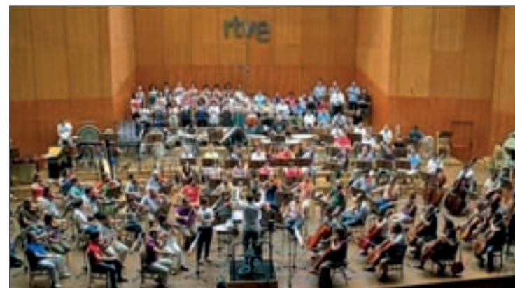
La Orquesta de RTVE inauguró el festival

de marzo, son otros de los encuentros imprescindibles para los apasionados de este tipo de arte. Será, concretamente, en la Iglesia Parroquial de San Vicente Mártir, de Paracuellos de Jarama y el domingo 2 en la Catedral Magistral de los Santos Niños, de Alcalá de Henares.