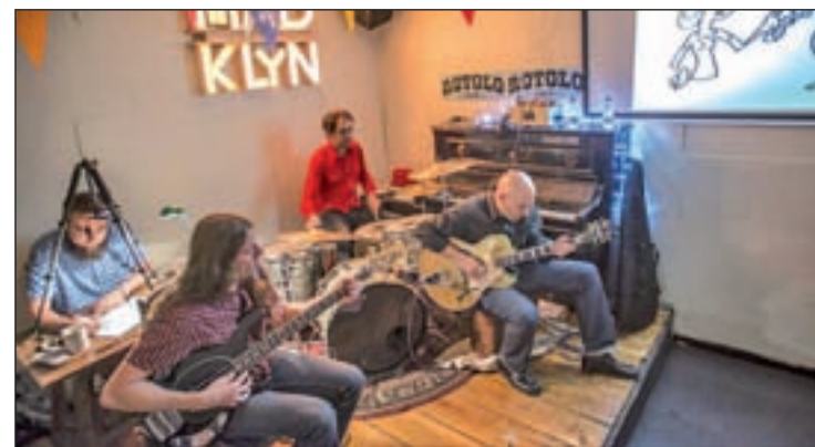
Los Tiki Twangers en uno de sus espectáculos

Toda la programación del carnaval madrileño puede consultarse en la web Carnavalmadrid.com .