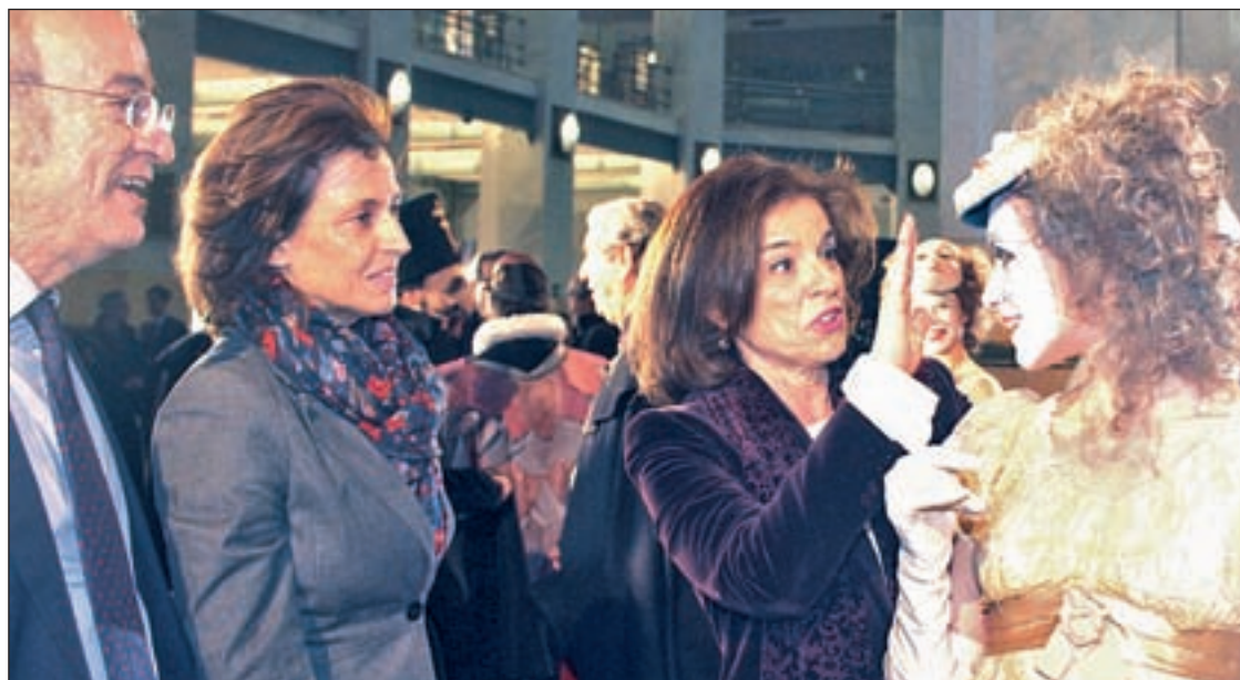
RAFA HERRERO / GENTE

Son las opciones que ofrece la Ordenanza de Dinamización Comercial aprobada en Junta • COCAM y comerciantes de Barceló la apoyan PÁG. 10