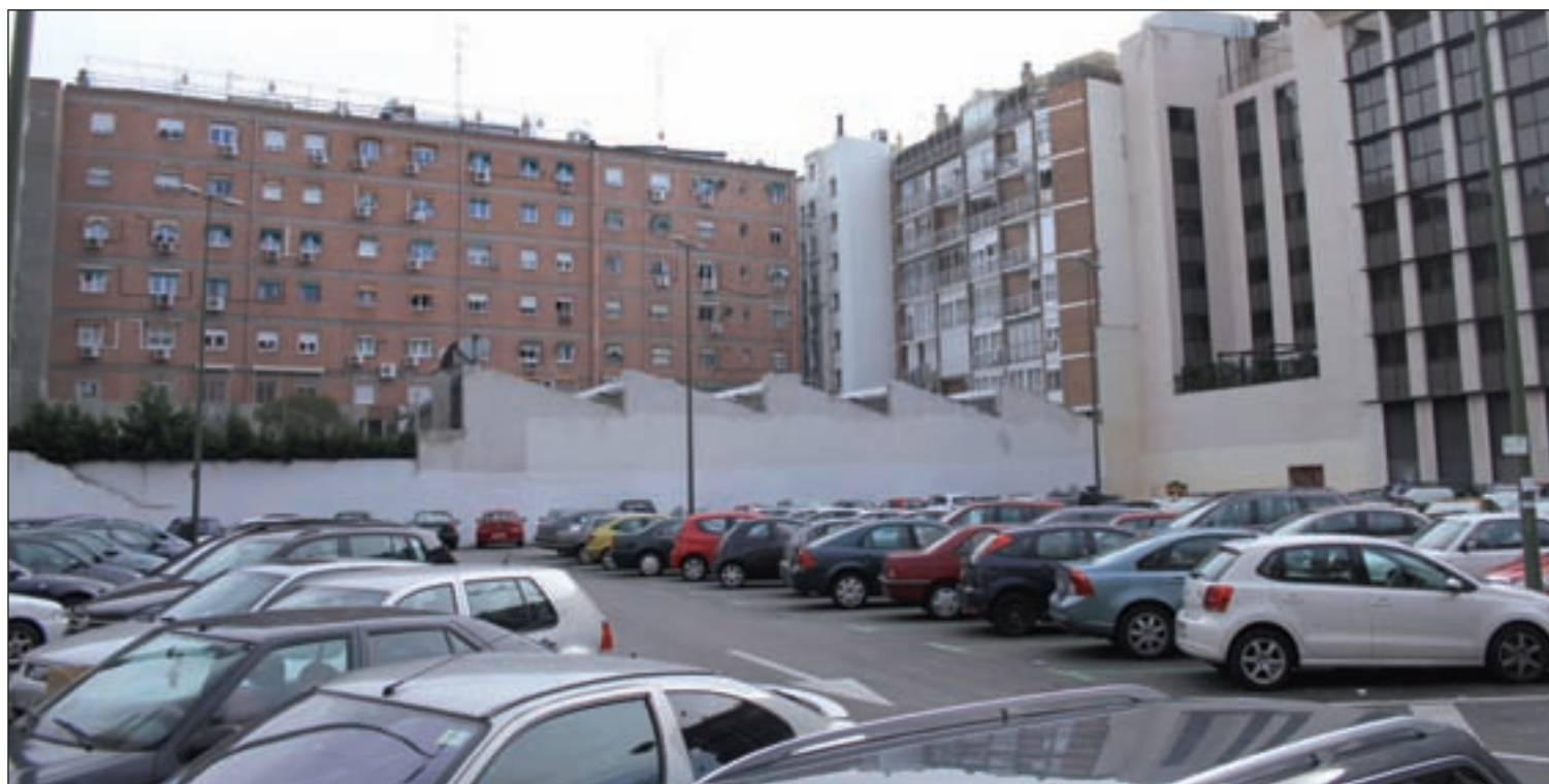
Aparcamiento en superficie en la calle Alcántara, uso actual de la zona