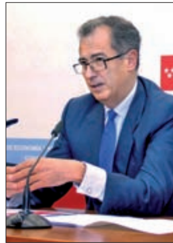
El consejero de Economía

Los inspectores y funcionarios de la Dirección General de Tributos gestionaron 64.603 deudas el año pasado, un 4,5% más que en 2012, y revisaron el 100% de los documentos presentados. Para Ossorio, el objetivo es “lograr una gestión tributaria eficaz y asegurar el principio de justicia tributaria”.