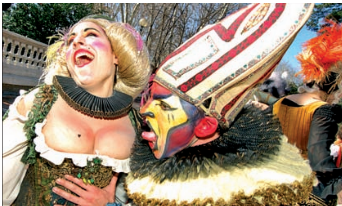
Los mejores disfraces competirán en la Casa del Reloj

"La integración de los modelos del transporte, entre autobuses y Metro, como es este intercambiador de Avenida de América, es uno de los ejemplos y mejores prácticas, que las grandes regiones europeas, asiáticas o americanas, tratan de importar a sus países", dijo, en referencia a la visita que una delegación de Singapur ha realizado "para aprender de las mejores prácticas del transporte madrileño". Estas declaraciones tuvieron lugar en su visita al Despacho de Cargas de Metro, donde presentó un balance sobre su ahorro energético.