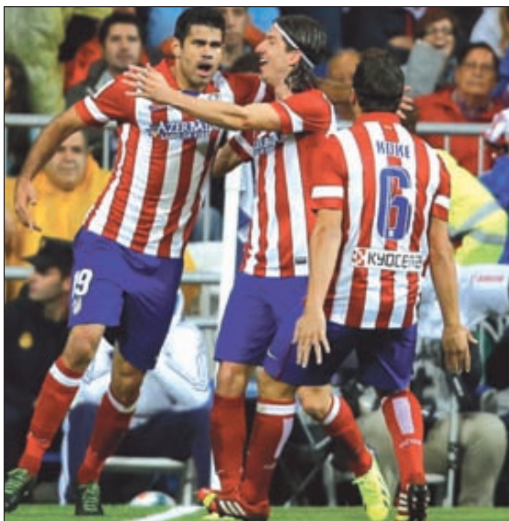
El Vicente Calderón acoge el partido más importante de la jornada