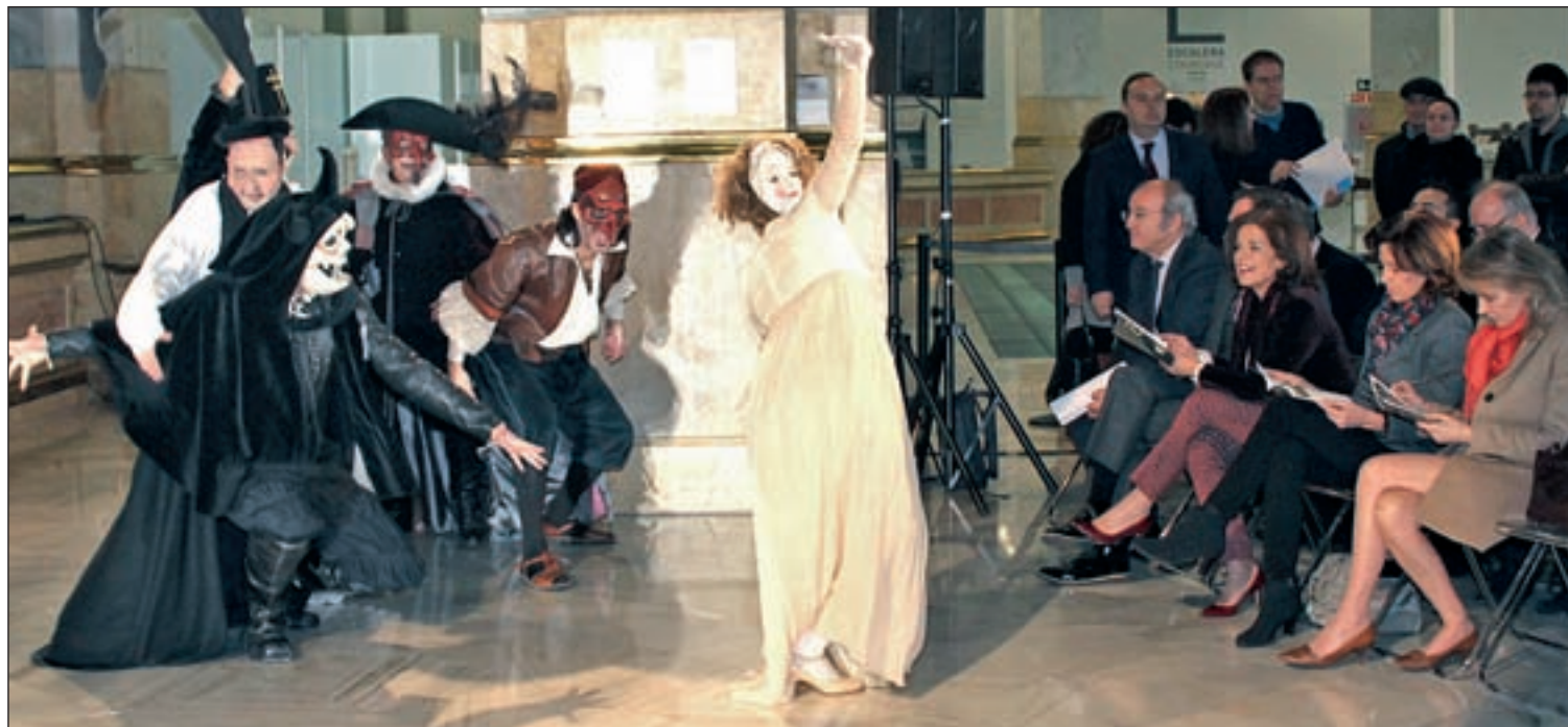
La alcaldesa de Madrid, Ana Botella, en la presentación de los carnavales de la capital