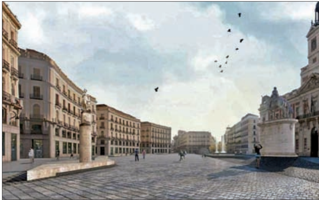
El proyecto ganador, 'El sol del membrillo'