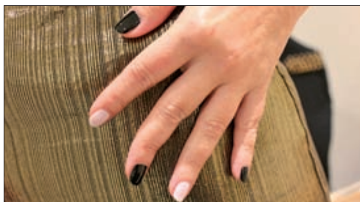
Colores de uñas propuestos por la firma

son el 'Blue Orchid', tono de azul que recuerda al cielo de las tardes de verano; o el 'Build Me Up Buttercut', amarillo crema, como la primera flor que florece en primavera. También están el 'Flowers In Her Hair', que aportará frescor a los 'looks' estivales; y 'La Vie en Rose', para usarlo solo o como