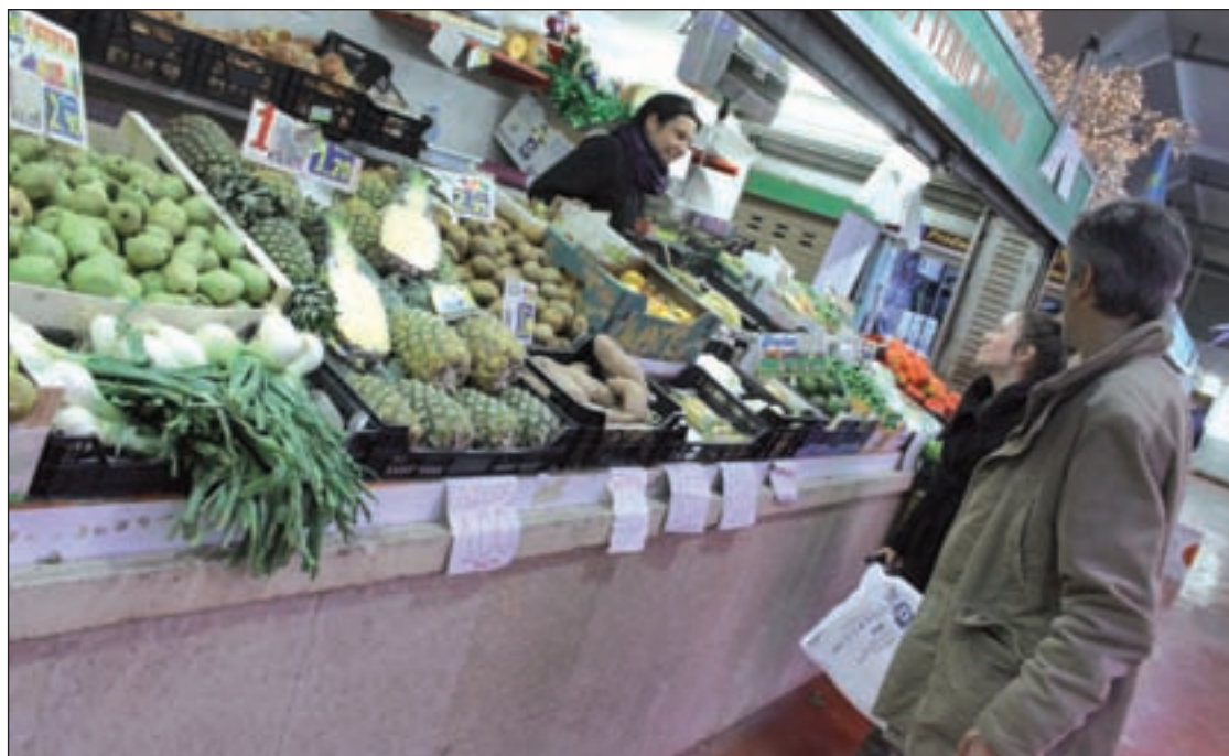
Los comerciantes podrán crear estas áreas en sus locales o en una zona común