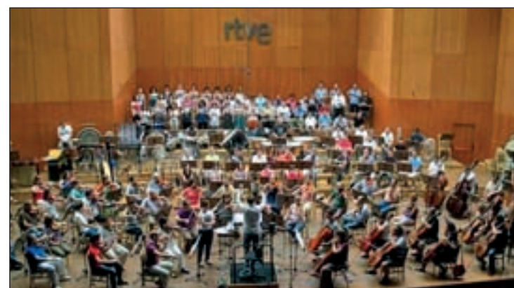
La Orquesta de RTVE inauguró el festival

de marzo, son otros de los encuentros imprescindibles para los apasionados de este tipo de arte. Será, concretamente, en la Iglesia Parroquial de San Vicente Mártir, de Paracuellos de Jarama y el domingo 2 en la Catedral Magistral de los Santos Niños, de Alcalá de Henares.