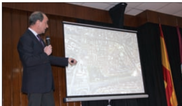
Un momento del encuentro