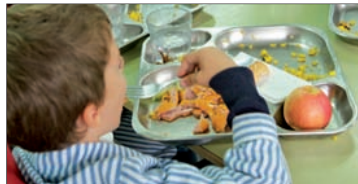
El informe recomienda la elección de alimentos saludables GENTE

de los Países Bajos (13%). Finalmente, la OMS ha aconsejado a los gobiernos nacionales que cumplan con la legislación sobre el etiquetado de los alimentos, y ha solicitado a los ejecutivos locales la puesta en marcha de programas que fomenten hábitos de vida saludables.