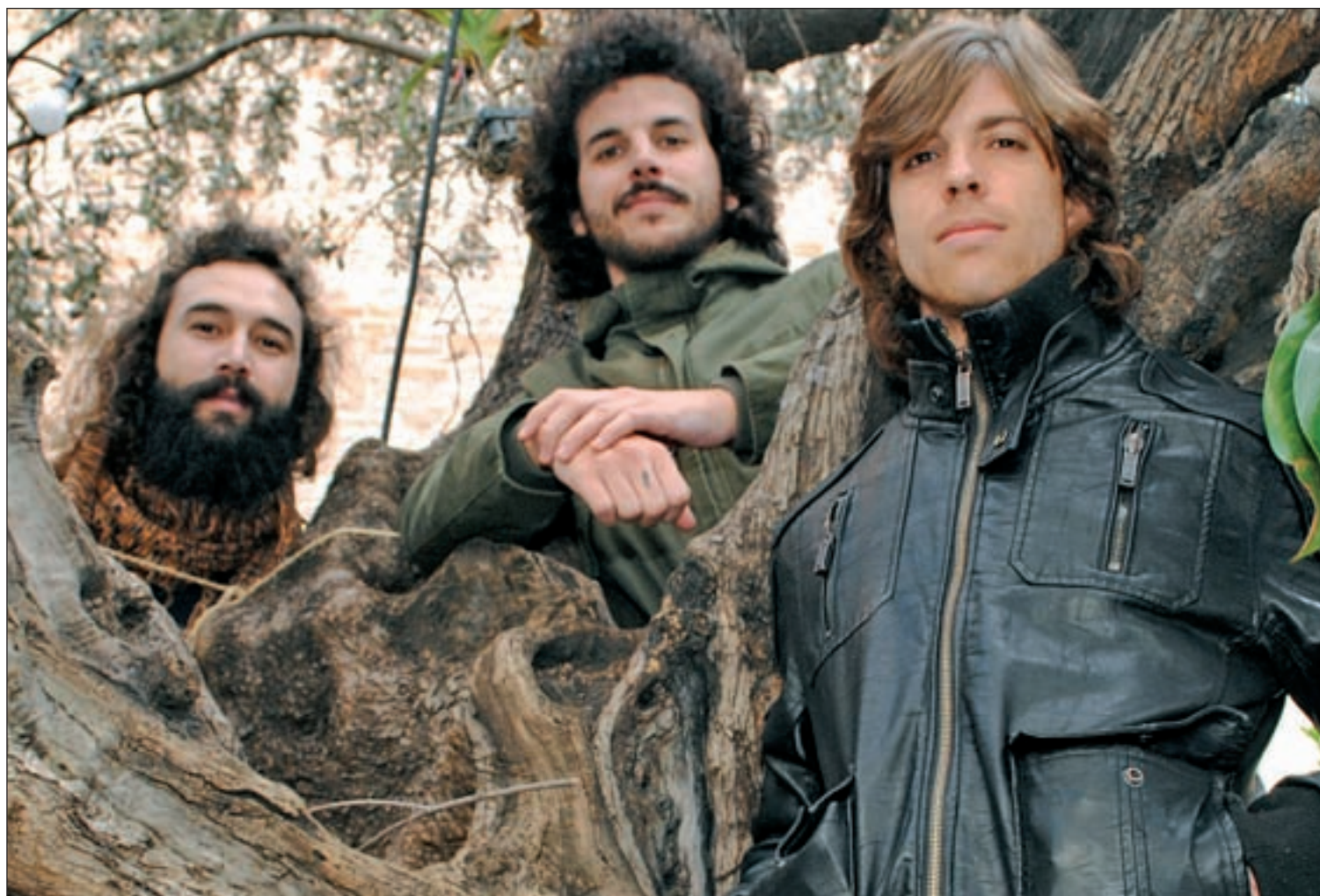
La banda madrileña se sincera en su tercer trabajo, 'Varcelona', más personal y cercano