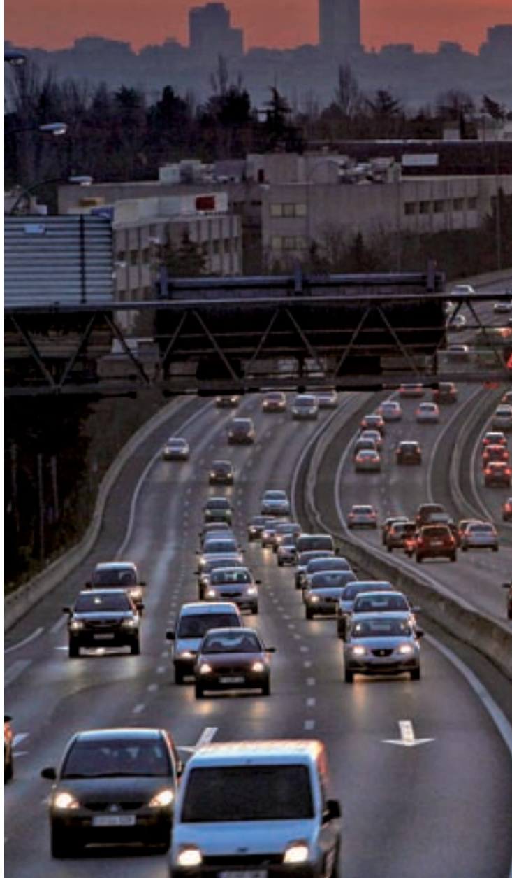
El 25% de las carreteras madrileñas, menos iluminadas desde 2010

Automovilistas Europeos Asociados denuncia que el 17% de los accidentes con víctimas ocurre en vías sin iluminar