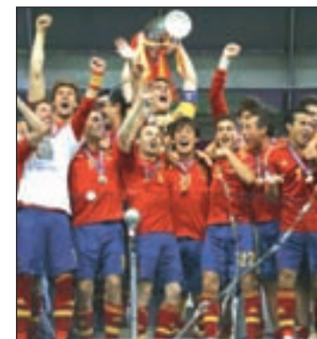
En busca del cuarto título

fase de clasificación, que se extenderá desde el 7 de septiembre de este año al 13 de octubre de 2015, es que habrá 23 plazas para el torneo, más la de la anfitriona, Francia, y no las 16 que venían siendo habituales en las últimas ediciones. Otra situación nueva en esta fase de clasificación es la presencia de la selección de Gibraltar, que ha quedado encuadrada en el grupo D junto a los combinados de Alemania, Irlanda, Polonia, Escocia y Georgia.