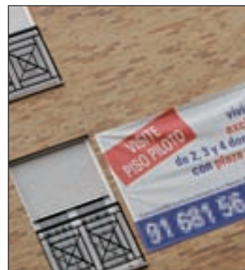
Suman siete años de caídas

el fin de los beneficios fiscales para la adquisición de vivienda, lo que se ha notado en la cifra total de hipotecas (197.641), la menor de todo el periodo de crisis. Por otro lado, el importe medio de las hipotecas constituidas sobre viviendas bajó un 3,5% en 2013, hasta los 99.838 euros, su valor