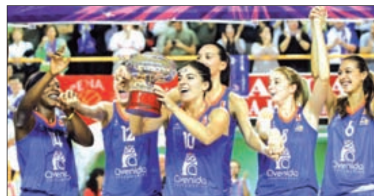
Las salmantinas posan con el trofeo de Copa

conjunto catalán ocupa la quinta plaza y amenaza con poner en entredicho el liderato de un equipo salmantino que opta a conquistar el 'doblete' en la presente temporada. Para evitarlo, el equipo que cuenta con más posibilidades, el Rivas Ecópolis, intentará acabar la fase regular en primera posición y así contar con el factor cancha a favor en las eliminatorias por el título. Las madrileñas visitan este sábado a otro aspirante, el Gran Canaria 2014.