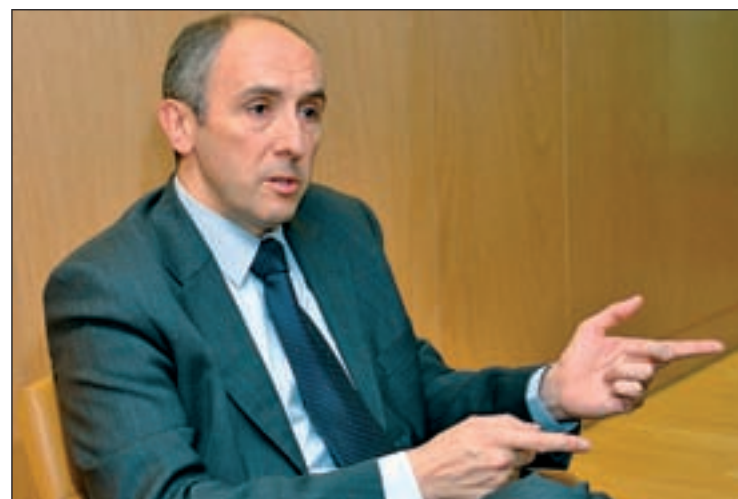
Josu Erkoreka, portavoz del Gobierno vasco

pueden disparar al agua pero no tiran a dar, ni mucho menos a matar como se ha dicho; eso son calumnias y se les ha intentado criminalizar”. En su opinión, las acusaciones tras lo ocurrido el pasado 6 de febrero “no son justas porque la Guardia Civil es profesional, comprometida y solidaria”.