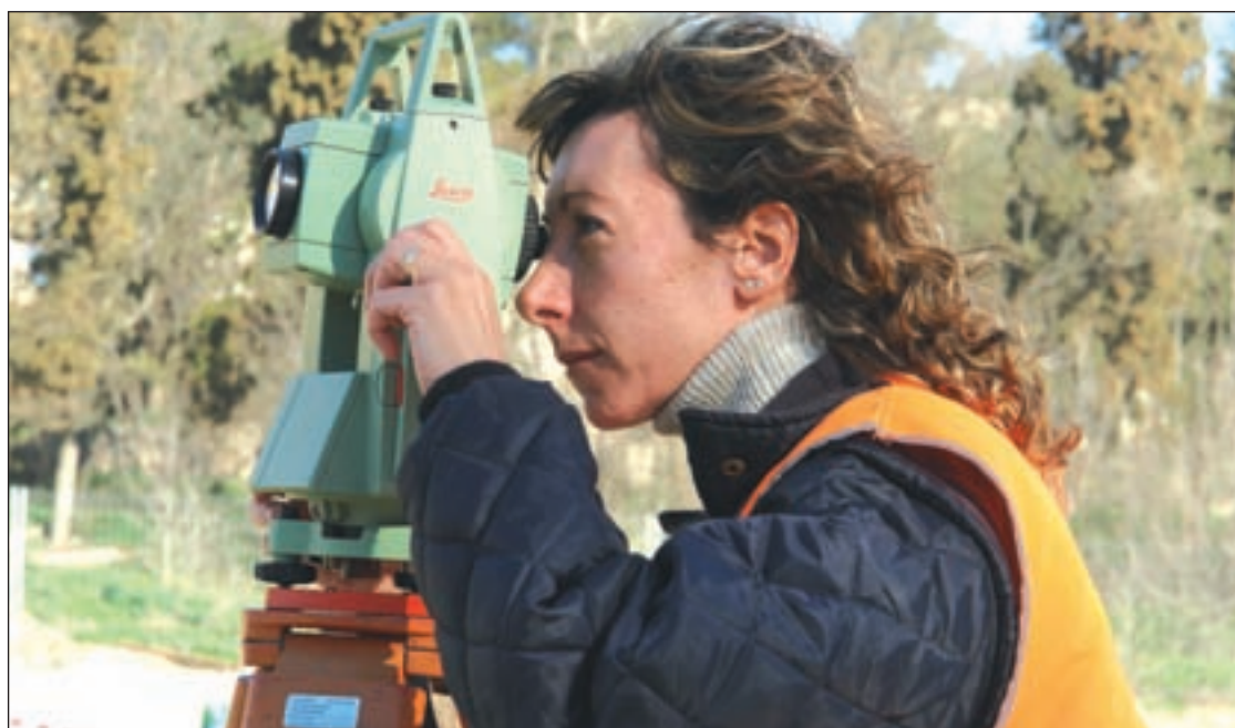
Una técnico revisa unas obras GENTE

Los datos han sido alentadores durante los últimos quince años (se ha pasado de una diferencia salarial el 32,88% en 1995 al 22,55% en 2010), pero el tempo ha cambiado desde la crisis. Entre 2008 y 2011, la brecha salarial ha aumentado de 5.292 a 5.900 € al año y ha subido dos puntos porcentuales, según los últimos datos publicados por el INE.