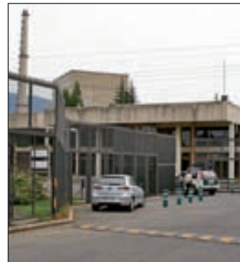
La central burgalesa

aún los planes de inversión necesarios para adaptar la central nuclear a las exigencias de seguridad, planes que se establecieron tras los test de resistencia propiciados por Fukushima. “Esta central no resiste terremotos de la intensidad que exige el regulador, presenta riesgo de inundación