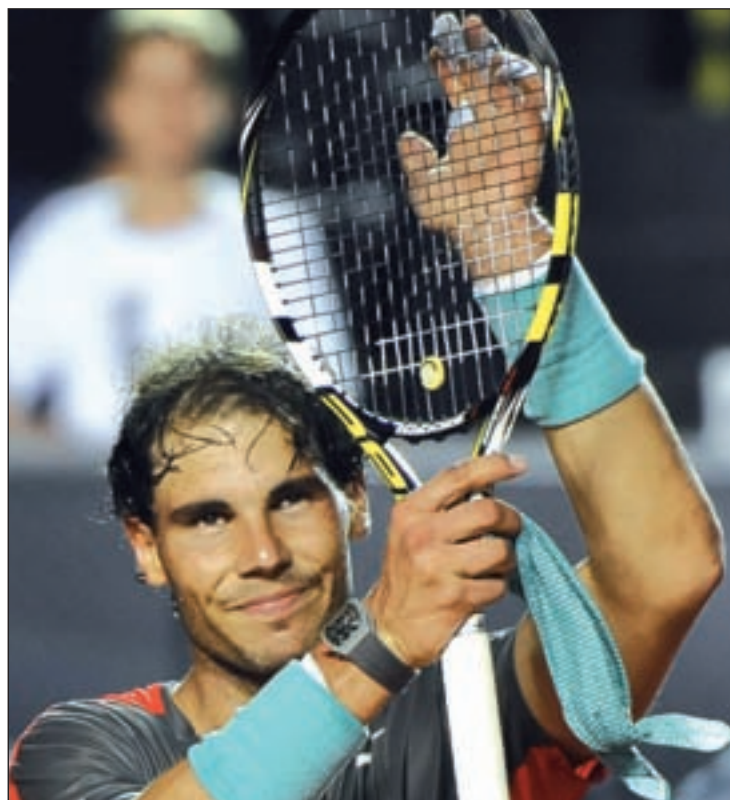
Rafa Nadal, celebrando su victoria en Brasil

Todos esos factores esperan ser aprovechados por Novak Djokovic. El serbio, campeón de este torneo en 2008 y 2011, fijó su tope la pasada temporada en semifinales, una ronda en la que acabó cayendo ante el argentino Juan Martín Del Potro. Ese resultado hará que defienda en este torneo 360 puntos, 640 menos que Nadal, una diferencia que le abre la puerta a reducir su desventaja de cara al liderato de la ATP. Pero, dejando a un lado la carrera de fondo por el primer puesto del