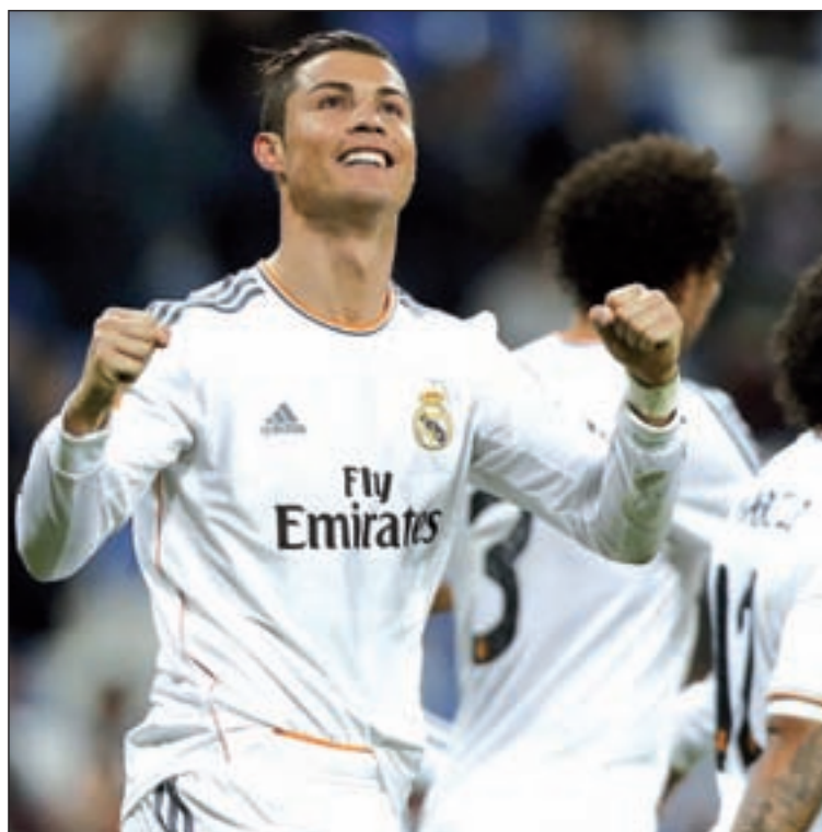
El Vicente Calderón acoge el partido más importante de la jornada