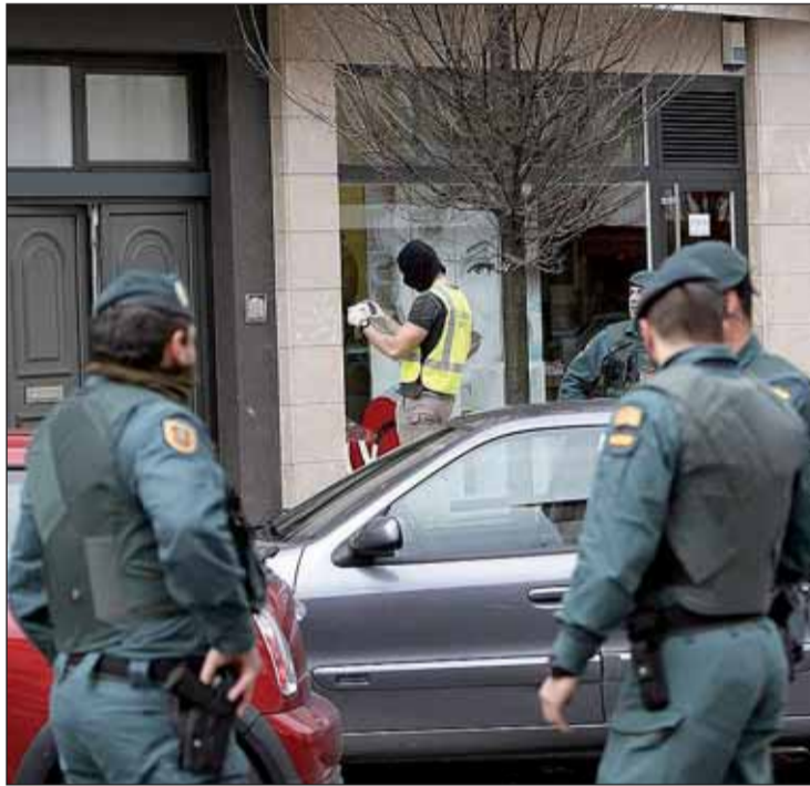
La operación se desarrolló en País Vasco y Navarra.

"Es un paso más en la batalla que el Estado de Derecho está