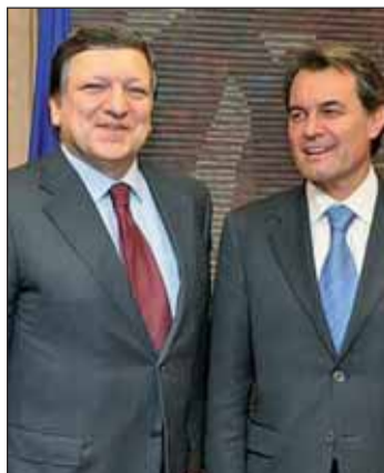
Durao Barroso con Artur Mas.

Por su parte, el presidente del Gobierno, Mariano Rajoy, afirmó que Mas "tiene la batalla internacional perdida".