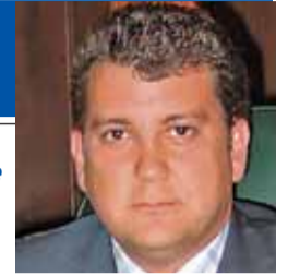
Carlos López Riesco

Portavoz del PP en el Ayuntamiento de Ponferrada. Ex alcalde.