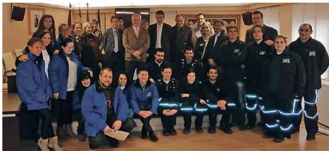
Foto de familia de políticos e integrantes del Coyanza Integral III que acaba y del Coyanza Integral IV que comienza.

Estos programas están gestionados por el Servicio Público de Empleo de la Junta de Castilla y León -EcyL- y promovidos por el Ayuntamiento de Valencia de Don Juan con el objeto de favorecer la inserción laboral de personas trabajadoras desem-