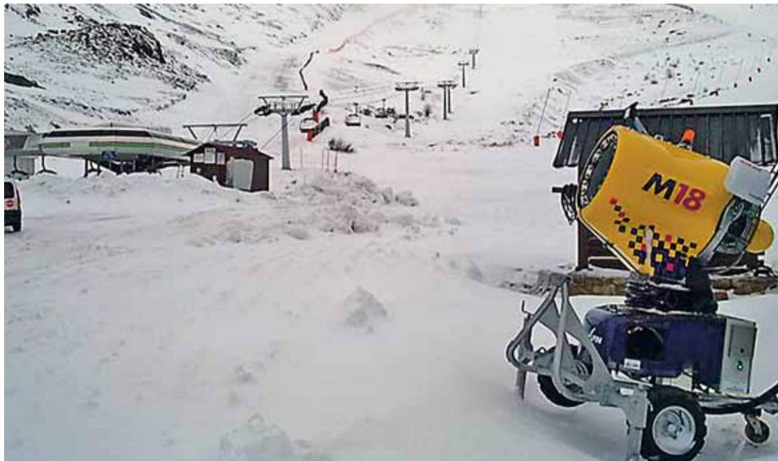
El aporte de nieve natural se suma a las bajas temperaturas que facilitan la innivación artificial.

Por lo que se refiere a Leitariegos, durante estas navidades ha sido visitado por un total de 4.350 personas. El domingo, 29 de diciembre fue también el día en el que se registraron un mayor