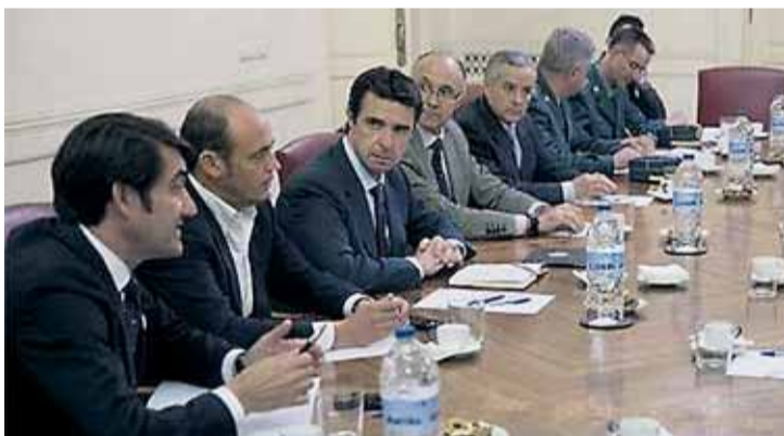
El ministro Soria 'jugó' al despiste con la prensa en la tarde del mismo lunes 28; en la foto, en la Subdelegación del Gobierno en León.