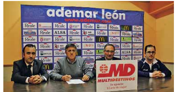
Presentación del acuerdo entre Reale Ademar y Viajes Multidestinos.