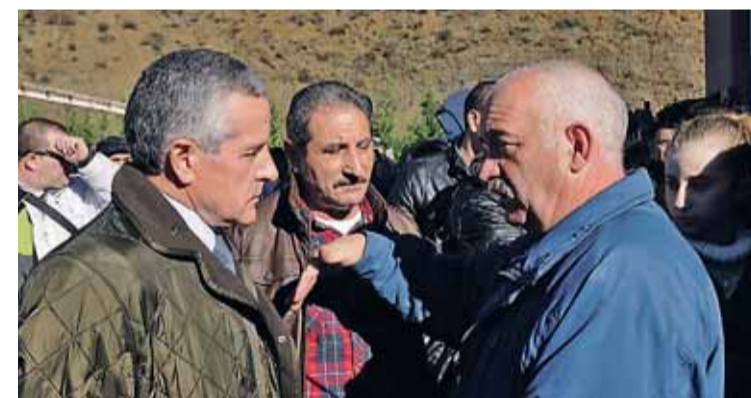
Arriba, entrada uno de los féretros al polideportivo de Santa Lucía de Gordón para dar el adiós a los mineros fallecidos. Abajo, el alcalde de León, Emilio Gutiérrez, y otros políticos y sindicalistas frente al pabellón.