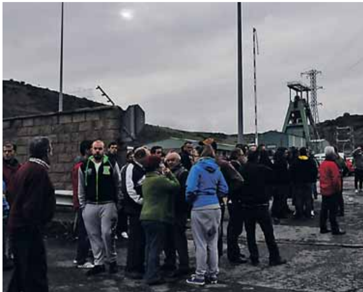
Expectación y espera en la bocamina de la Mina Emilio del Valle antes de que se pudieran sacar al exterior los cadáveres de los 6 fallecidos.