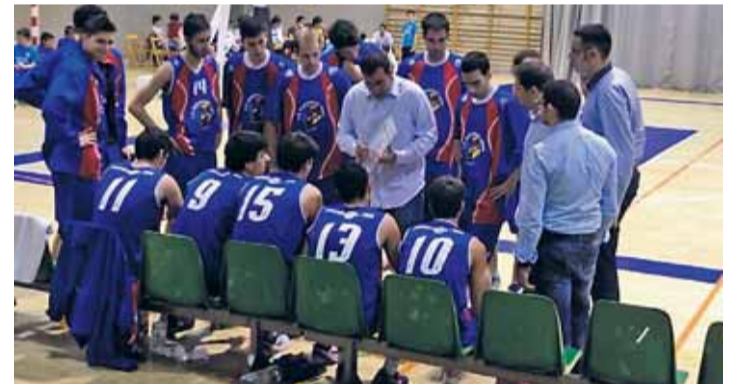
Agustinos Eras E. Leclerc comenzó su andadura en la EBA con victoria.