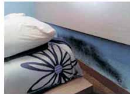
Problemas de humedades por capilaridad