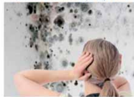
Problemas de humedades por condensación

MÁS INFORMACIÓN EN EL TLF. GRATUITO 900 809 939 www.acuasec.com