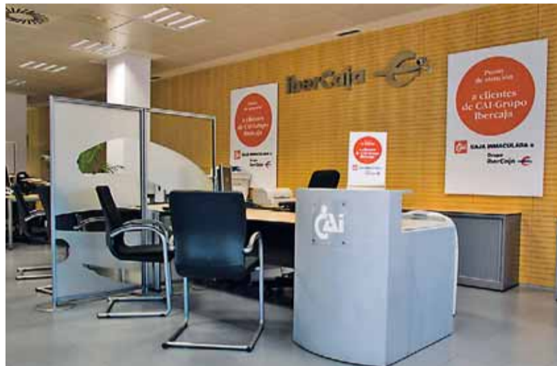
Ibercaja ha puesto en marcha puestos de atención para clientes de Caja3.

Ibercaja ha abierto en 63 de sus oficinas de toda España puestos de atención para clientes de Caja3. El objetivo es facilitar el servicio a todos aquellos clientes de esta entidad que se hayan podido ver afectados por el cierre de las oficinas previsto en el Plan de Reestructuración. Así, se evitarán desplazamientos y recibirán la misma atención que en sus oficinas iniciales. Igualmente, en dos oficinas de Caja3 se han instalado puestos de atención para clientes de Ibercaja.