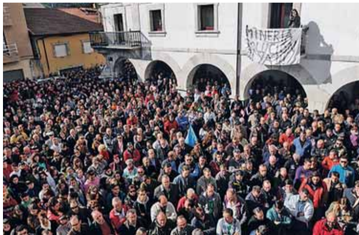
Las concentraciones del martes 29 se sucedieron en plazas y colegios de la provincia, pero numerosa y especial fue la de La Pola de Gordón.