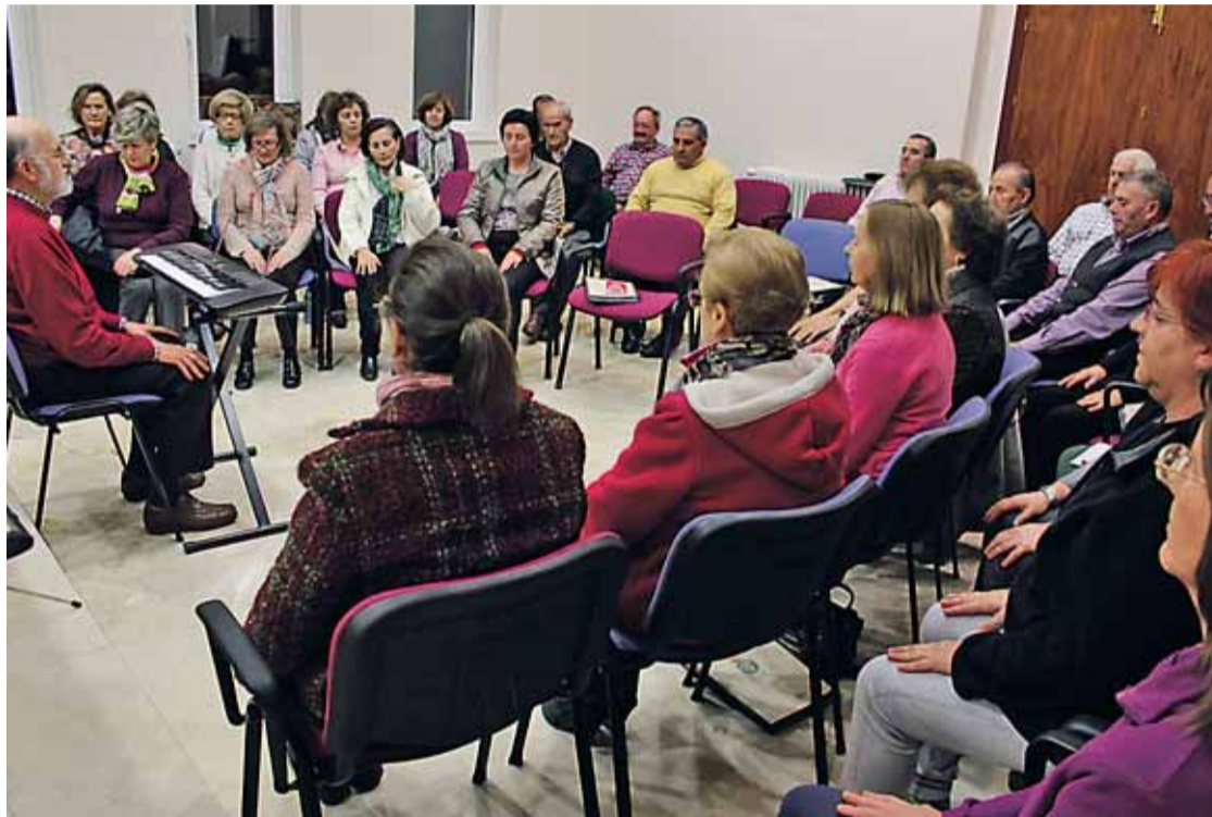
Los participantes del 'Coro de la Sobarriba', 43 voces, ensayan todos los viernes en el Salón de Plenos de Valdefresno.

La lucha leonesa tiene mucho peso. Cuenta con Escuela de Lucha y celebra corros coincidiendo con la fiesta comarcal. La "Transcandamia", el Rally Clásica de León, la Marcha Cicloturista a la Sobarriba y Torneo de Bolo Leonés completan la programación deportiva. El Ayuntamiento también patrocina a varios deportistas.