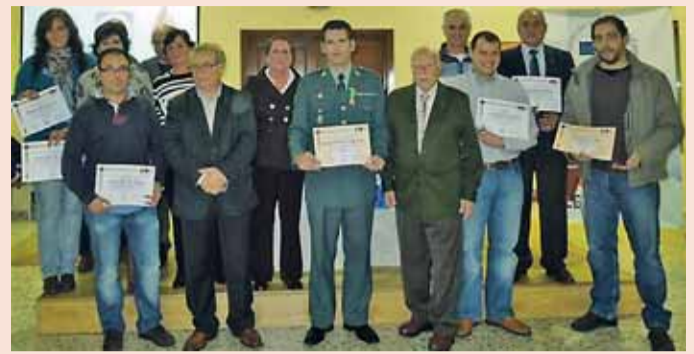
Foto de familia con los donantes distinguidos en Valdefuentes.