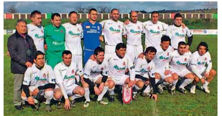
Equipo de los Veteranos de la Cultural y Deportiva Leonesa.