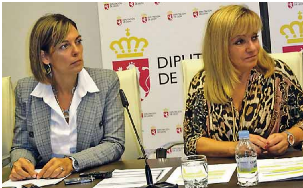
El acuerdo lo firmaron la consejera de Familia, Milagros Marcos y la presidenta de la Diputación, Isabel Carrasco.

Otro capítulo son las Actuaciones para la Inclusión Social, donde están las Prestaciones Económicas en Situación de Emergencia Social y el Programa de Inclusión Social (177.024 euros) o las Ayudas de Emergencia (400.000 euros).