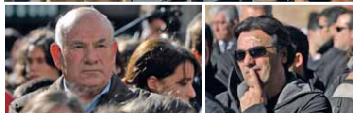
Recogida de firmas de apoyo a las familias y dos imágenes del funeral.