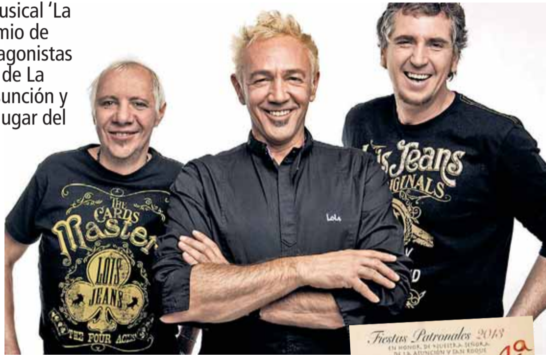
El grupo 'La Unión' sigue muy activo en el panorama musical nacional.

El viernes 16 se abrirá de nuevo el Mercado Medieval en la Plaza Mayor y de nuevo habrá misa, pero en esta ocasión será