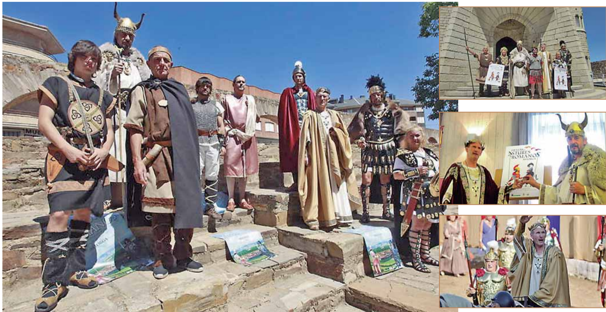
La ambientación y el vestuario de los cientos de participantes en la fiesta de Astures y Romanos de Astorga es exquisito y cuidado hasta el más mínimo detalle.