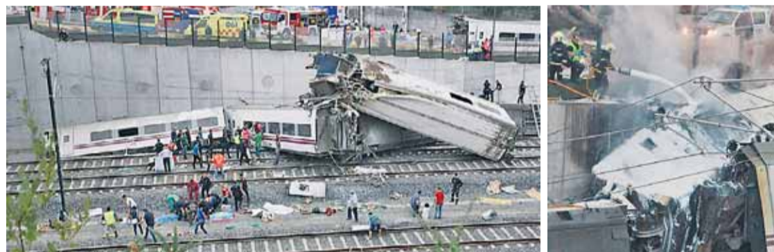
Arriba, el alcalde de León y trabajadores del Ayuntamiento, guardan silencio; abajo, dos imágenes del accidente.