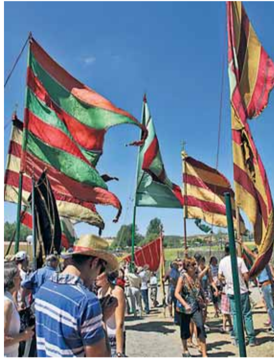
Los veinte pueblos de la Sobarrriba harán desfilar los pendones acompañando a las imágenes de sus patronos.