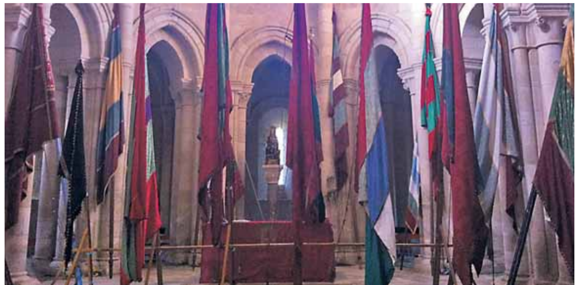
Las varas y pendones de los 19 pueblos de Gradefes quedarán expuestos en el convento de Santa María de Gradefes.