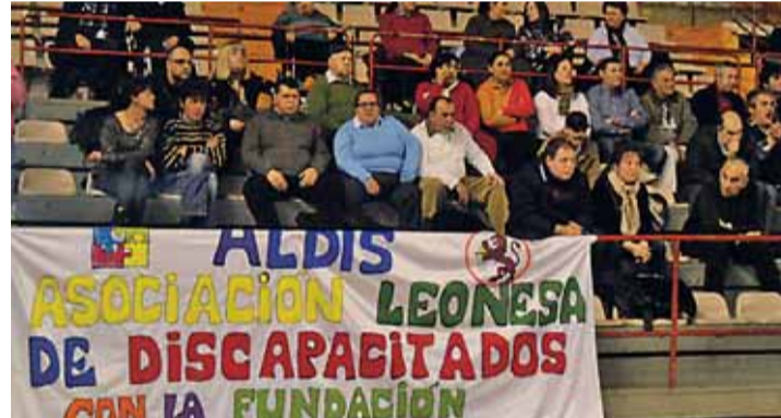
Los miembros de ALDIS se dejaron sentir en la grada.