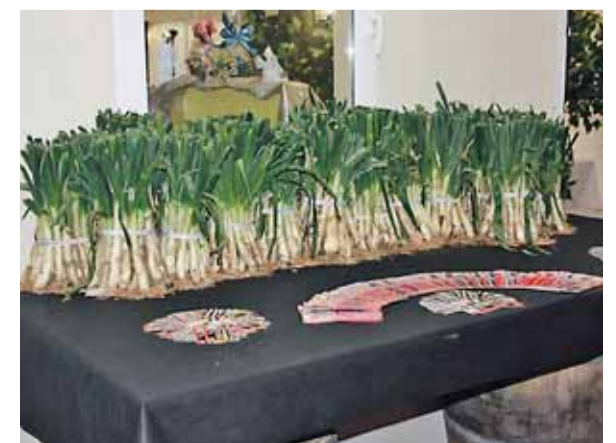
Los calçots están preparados para pasar por la brasa.

Pero, además, este restaurante durante el mes de febrero servirá menú diario de lunes a viernes al precio de 6 euros, con regalo de un detallito por cada tres menús; hasta el mes de abril ofrece el menú de calçot en unas jornadas únicas en la provincia de León al precio de 25 euros; para la noche de carnaval (sábado 9) se organiza una fiesta con un premio al disfraz más votado; para San Valentín (sábado 16) hay un menú especial, barra libre y regalos para todos los comensales al precio de 45 euros; y la cita estrella sigue siendo el 'todo-todo' de la cena de los sábados con aperitivo de bienvenida, cena, discoteca y barra libre al precio de 30 euros. "Como somos conscientes de que estamos en las afueras de León y estamos preocupados porque se pueda beber de forma relajada hemos decidido pagar los taxis para los sábados desde ya mismo, pero el taxi de vuelta, es decir, que la gente suba en taxi y nosotros les pagamos el taxi de regreso hasta Santo Domingo, aunque para un mínimo de cuatro personas", informa José Luis de Paz, gerente de La Pineda, un leonés de La Vid de Gordón que regresó de Cataluña después de 'aprender' durante 18 años todo lo hay que saber sobre hostelería.