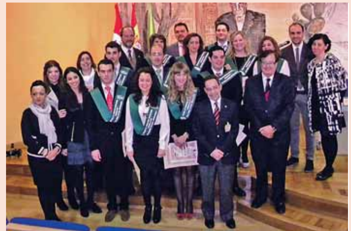
El IV Curso de Protocolo y Comunicación generó 18 nuevos titulados.

IV CURSO DE PROTOCOLO, COMUNICACIÓN Y RELACIONES SOCIALES