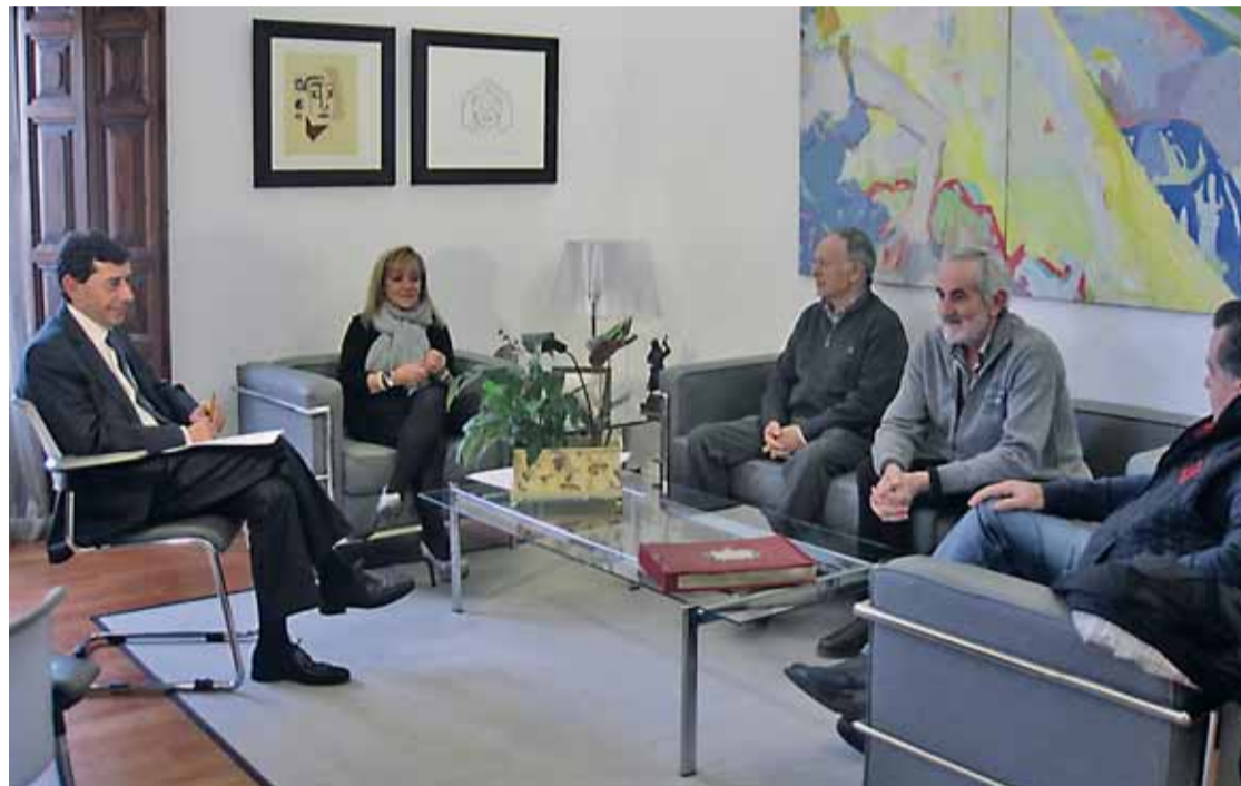
El acuerdo de poner en marcha este plan de emprendedores fue adoptado en Junta de Portavoces de la Diputación.

a. Idea e iniciativa: Sin haber constituido aún la empresa, las personas que opten a ella tendrán un proyecto en la fase inicial y contarán con un plan de empresa. Dentro de esta ayuda se subvencionará el 80% del importe del recibo mensual por la afiliación a Autónomos durante 12 meses.