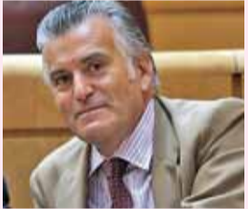
Luis Bárcenas Ex tesorero del Partido Popular

No ha tenido un papel brillante en el triunfo de la Selección Española de Balonmano pues ha disfrutado de pocos minutos, pero el polivalente jugador del Reale Ademar marcó 8 goles y presume con orgullo de la medalla de oro tras un triunfo tan histórico como el cosechado el domingo ante la Selección de Dinamarca. Ni más ni menos que España 'dobla' a Dinamarca (35-19) con un equipo con el 'sello' leonés de la Escuela del Ademar. Además de Ruesga, otros campeones del mundo como Alberto Entreríos, Viran Morros, Aguinagalde, Antonio García, Dani Sarmiento y Montoro comenzaron a hacerse grandes en León y en el Ademar. Enhorabuena.