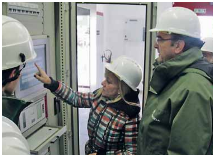
Puesta en servicio de la nueva subestación eléctrica a finales de noviembre.

Y el lunes 17 de diciembre se producía un encuentro también muy esperanzador cuando la