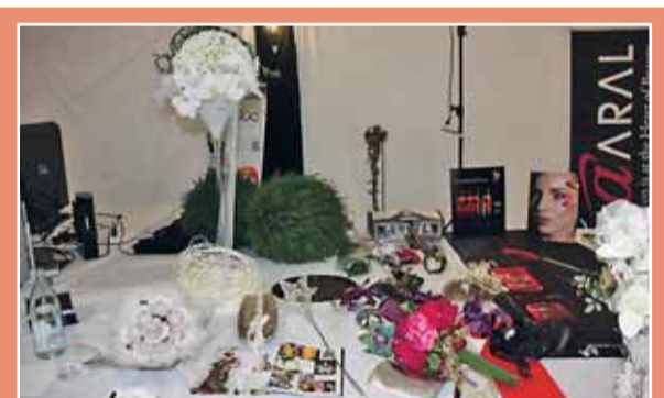
Los complementos de bodas y comuniones se expusieron para que el público pudiera verlos de cerca.