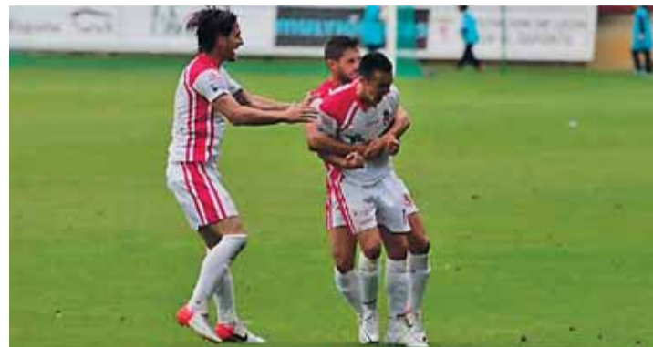
Los jugadores quieren ver animación en las gradas del Reino de León.