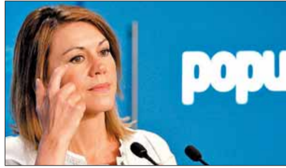
La secretaria general del PP, María Dolores de Cospedal, durante su comparecencia en rueda de prensa.

La secretaria general del PP, María Dolores de Cospedal, asegura que el único objetivo de estas noticias es "dañar al partido y a Mariano Rajoy"