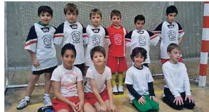
Jugadores del Colegio Carmelitas Landázuri.