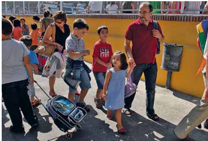
Las aulas leonesas volverán a llenarse el lunes 10 de septiembre.

Los escolares de segundo ciclo de Infantil, Primaria y Educación Especial, así como los estudiantes de Educación Secundaria Obligatoria matriculados en centros de Primaria comenzarán el día 10 de septiembre sus clases. Por su parte, los Institutos de Secundaria empezarán el curso el 13 de sep-