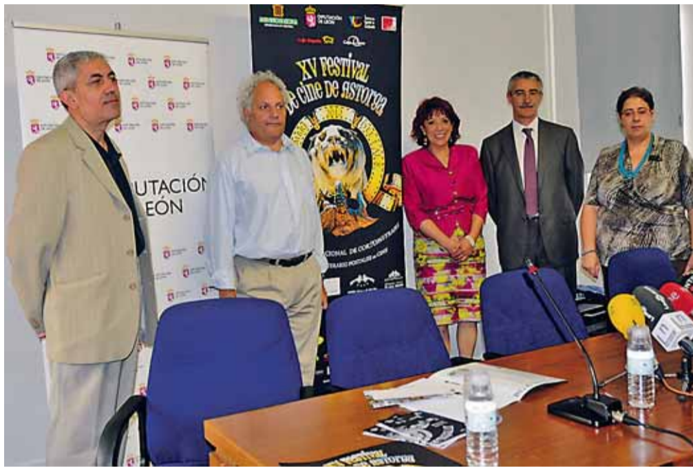
La presentación del XV Festival de Cine de Astorga tuvo lugar en la sede 'cultural' del ILC en León.