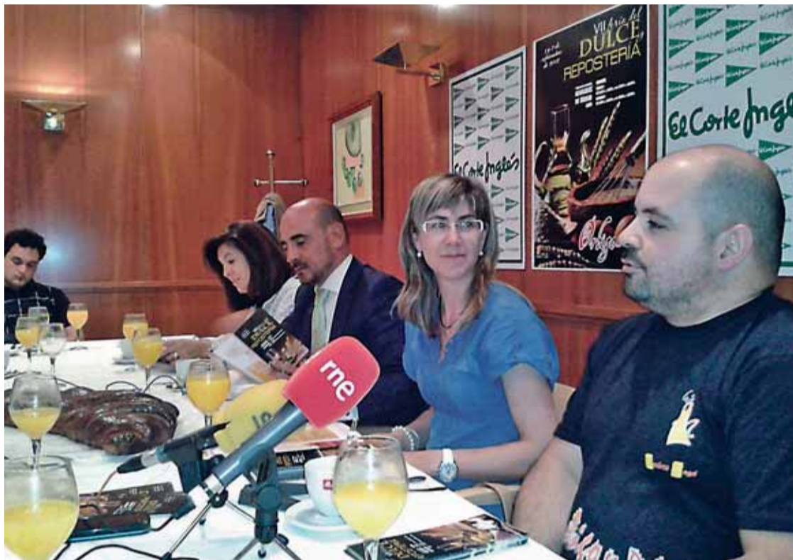
La presentación de la Feria del Dulce de Benavides por sus organizadores tuvo lugar en El Corte Inglés de León.

Y para animar la noche, el sábado día 1 se celebrará una verbena que tendrá lugar en la plaza aledaña a las instalaciones deportivas. Benavides de Órbigo se convierte así, en la capital del dulce durante el próximo fin de semana, que se espera una acogida igual o mejor que las anteriores, en las que se ha rondado los 15.000 visitantes entre los dos días. Los organizadores invitan a todos los 'golosos' a que se acerquen a Benavides estos días para degustar los dulces de los expositores, entre los que se encuentran algunos de Berlín, Italia, París o Estados Unidos.