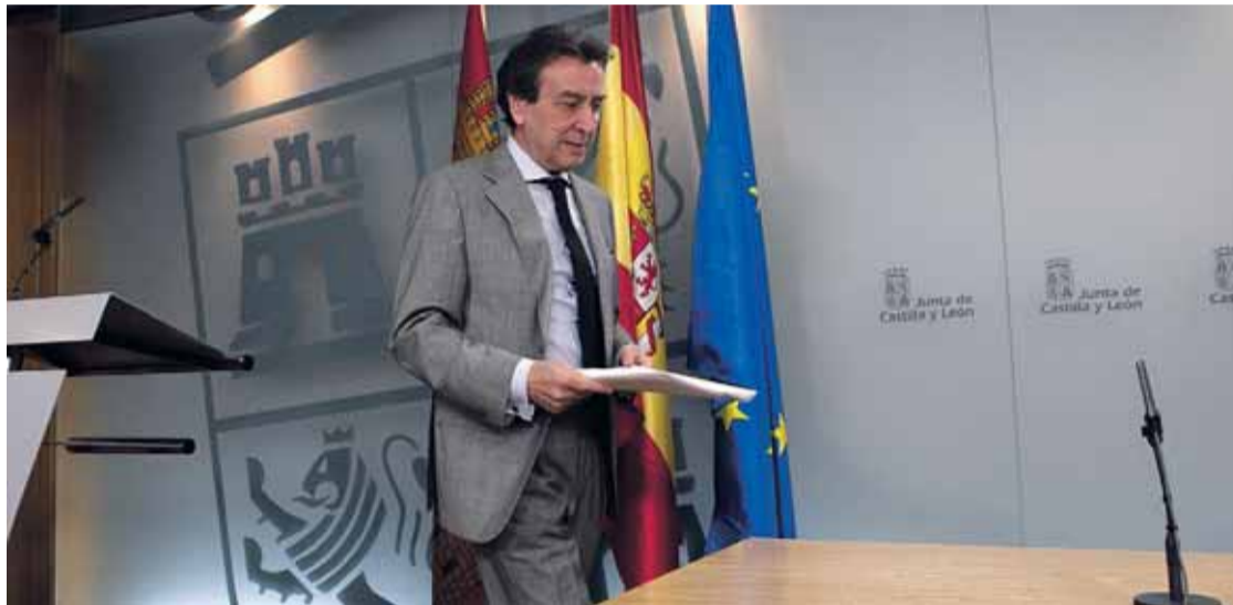
José Antonio de Santiago-Juárez a su llegada a la rueda de prensa tras el Consejo de Gobierno.

Otro de los objetivos es mejorar las perspectivas de los trabajadores y del tejido económico local y regional como consecuencia del impacto directo e indirecto de las reestructuraciones empresariales y deslocalizaciones de empresas extranjeras.