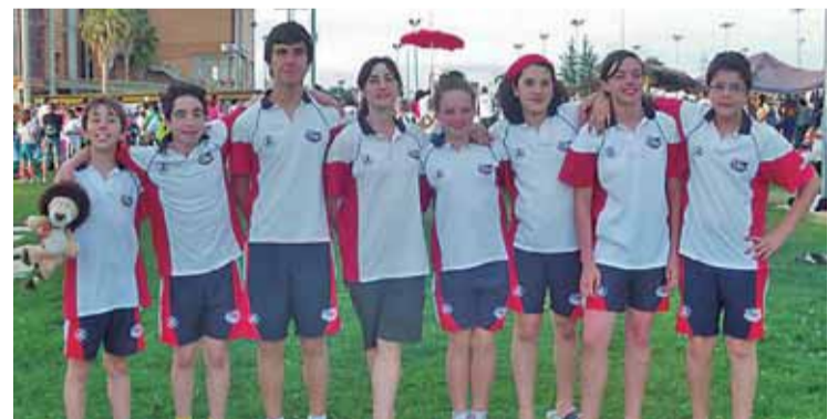
Los integrantes del Club Natación León, en Badajoz.