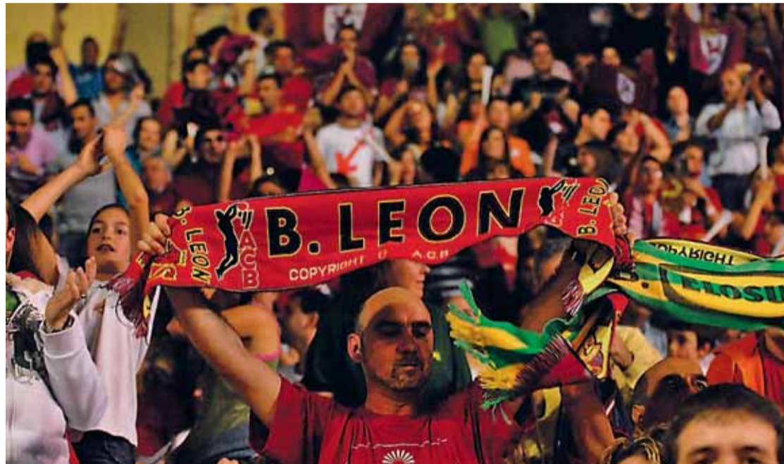
La afición de Baloncesto León hace un llamamiento a la unión de todo el deporte leonés.

Por otro lado, el miércoles 13 de Junio, los 16 equipos que componen la Liga LEB Oro (entre los que se encuentra Baloncesto León) se reunieron en la sede de la Federa-