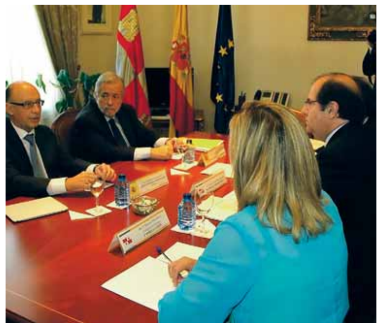
Juan Vicente Herrera y Cristóbal Montoro durante el encuentro en Madrid.

damental del modelo impulsado por la Junta es el fortalecimiento de los municipios para que puedan prestar, de manera eficiente, las competencias y las funciones que la ley les encomienda". En el planteamiento del Ejecutivo castellano y leonés, se pretende fortalecer los municipios a través de su asociación voluntaria incentivada para crear mancomunidades de interés comunitario, denominadas provisionalmente como distritos.