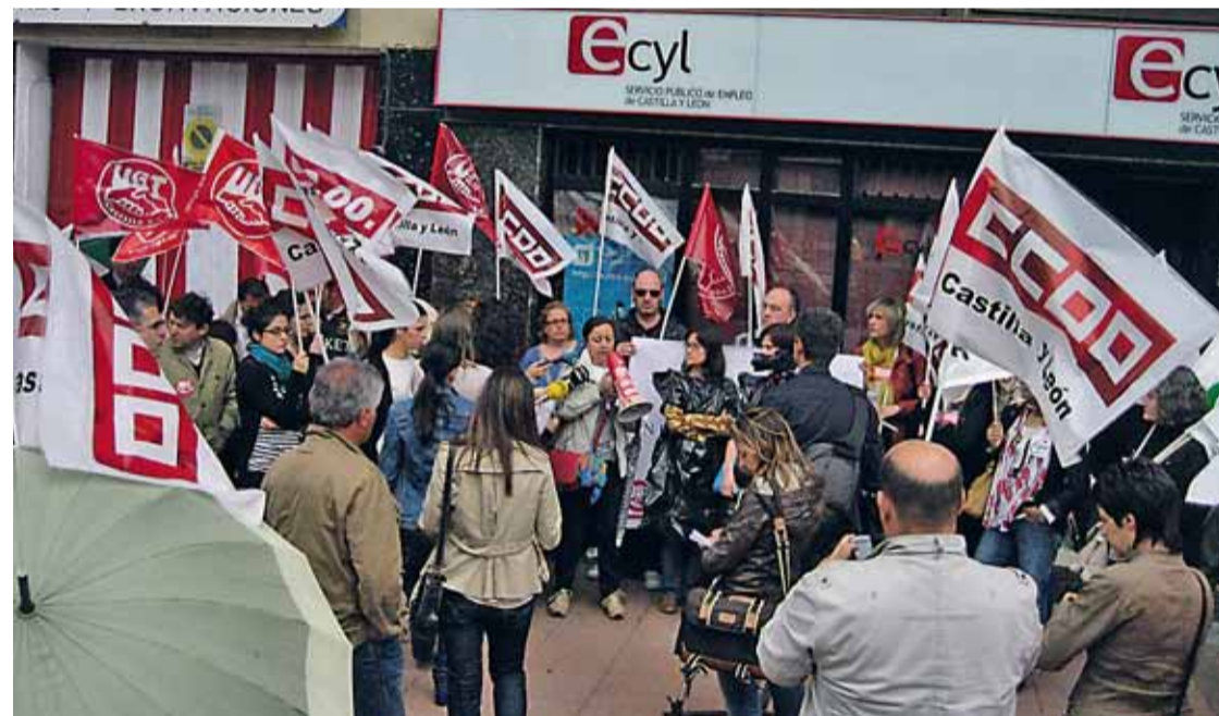
Concentración de trabajadores del EcyL para protestar por los despidos en la oficina de Ponferrada el lunes 11.

cuenta no solo de los perjuicios que, según se ha demostrado, ya se han causado a los sectores empresariales más directamente afectados sino también la dudosa eficiencia recaudatoria del impuesto, la Federación Leonesa de Empresarios pide que la Junta reconsidere este impuesto equivocado, procediendo "cuanto antes a su supresión, ya que si lo mantiene durante más tiempo los daños que hoy ya son cuantiosos pueden convertirse en irreparables, no sólo en términos económicos, sino, en términos de pérdida de puestos de trabajo, cuestión especialmente preocupante ante el imparable crecimiento del desempleo en la región".