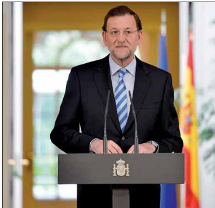
Mariano Rajoy explicó el rescate a los medios.

Este empeoramiento de la situación se producía horas después de que la agencia de califi-