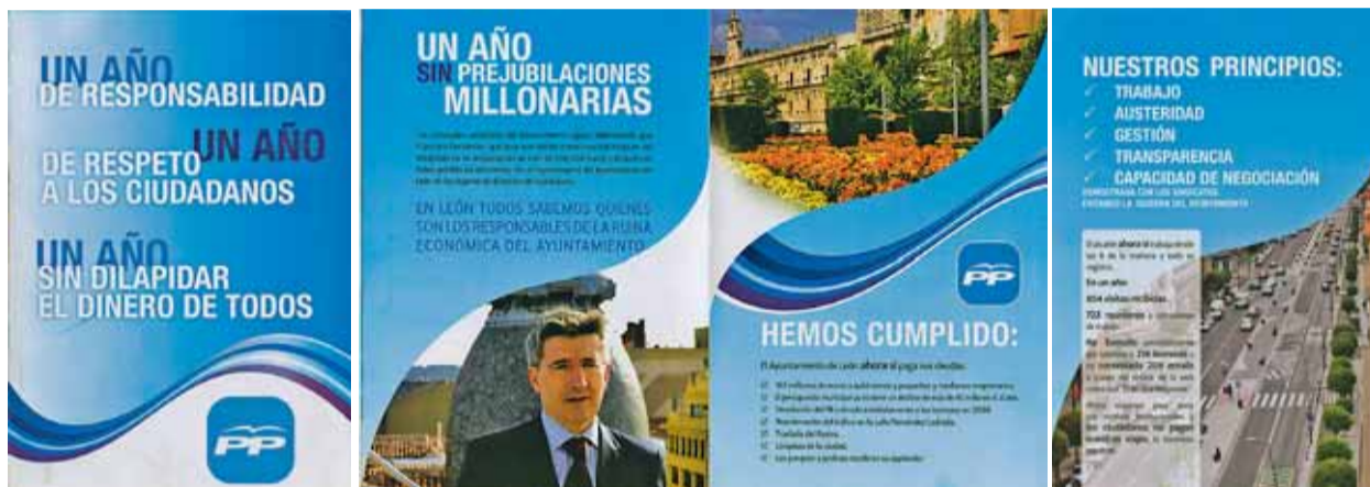
Díptico elaborado del PP en defensa de su gestión.

En la contraportada del díptico se ponen de manifiesto "nuestros principios: trabajo, austeri-