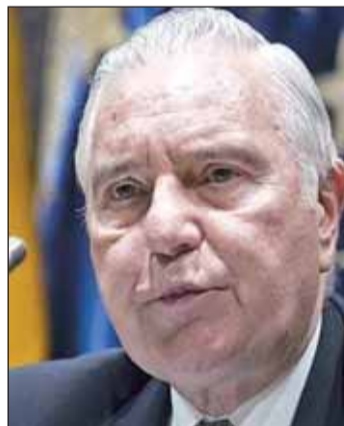
Carlos Dívar, presidente del CGPJ.

La convocatoria se conoce después de que el TS concluyera no admitir a trámite la querrela por malversación de fondos públicos.