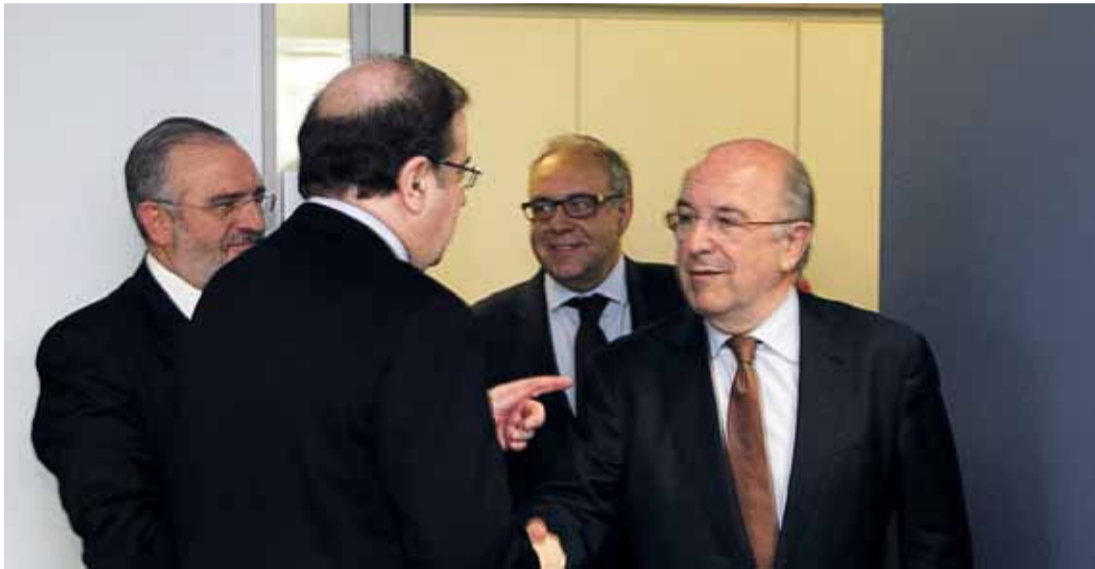
Juan Vicente Herrera y Joaquín Almunia saludándose al inicio de la reunión del pasado jueves en Bruselas.

La creación del Colegio Profesional de Periodistas de Castilla y León se sumará a la existencia de otros órganos semejantes en comunidades como Cataluña, Galicia, Murcia y Andalucía.