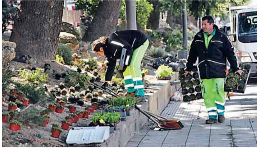
El talud de Papalaguinda se está 'recuperando' con 29.000 plantas del vivero municipal.

El actual equipo de gobierno del Ayuntamiento de León, desde su toma de posesión, ha apostado por la recuperación de las zonas verdes como una de las medidas imprescindibles para dar un 'lavado de cara' a los parques y jardines de la ciudad. La última obra de este tipo ha comenzado esta semana con la puesta de 29.000 plantas en el talud del Paseo de Papalaguinda. Las plantas aromáticas y de flor -del tipo vivaz, ya que aguantan en los parterres