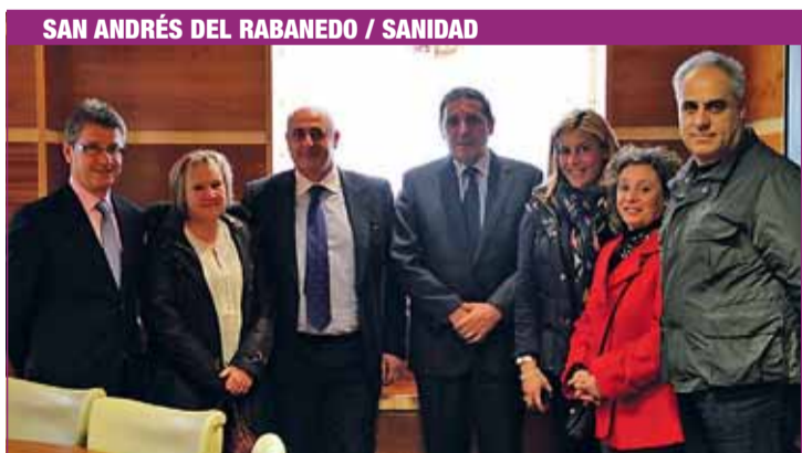
SAN ANDRÉS DEL RABANEDO / SANIDAD

Hay que agarrarse bien, fijar buen contrapeso y soplar fuerte para que el viento cambie el rumbo y estas medidas no afecten tanto al pueblo. Recortes donde sobra, aunque les afecte a ellos