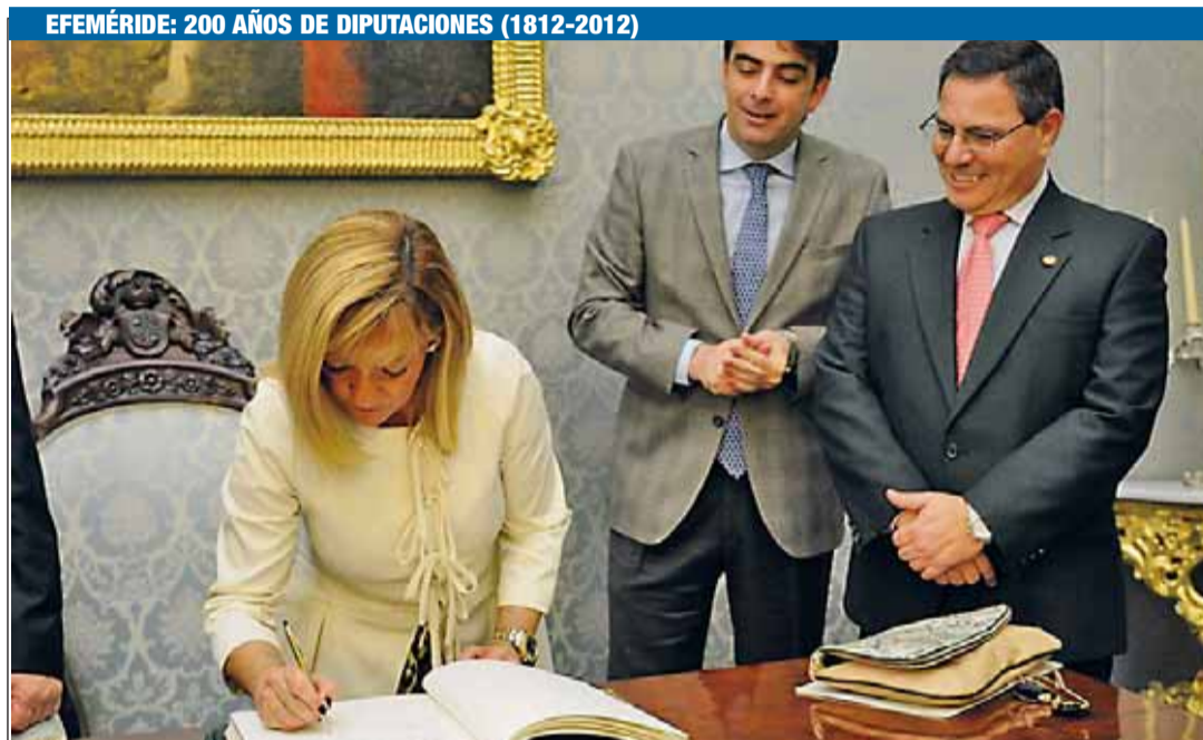
EFEMÉRIDE: 200 AÑOS DE DIPUTACIONES (1812-2012)