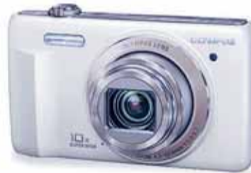
Cámara OLYMPUS VR 350. 16 megapíxeles, zoom óptico 10x, pantalla de 3", con estuche y tarjeta de 4 Gb, exclusiva en El Corte Inglés, 139 €