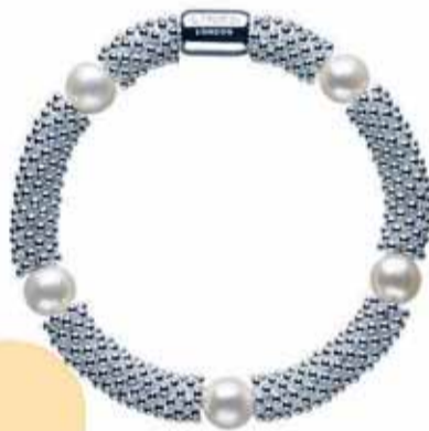
Pulsiera LINKS OF LONDON, 285 €