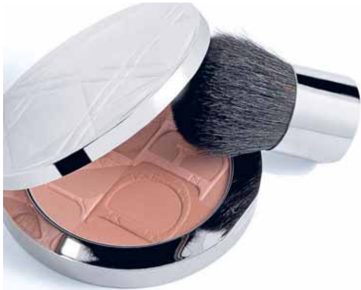
Polvera DIOR NUDE TAN BRONZE, 48,10 €