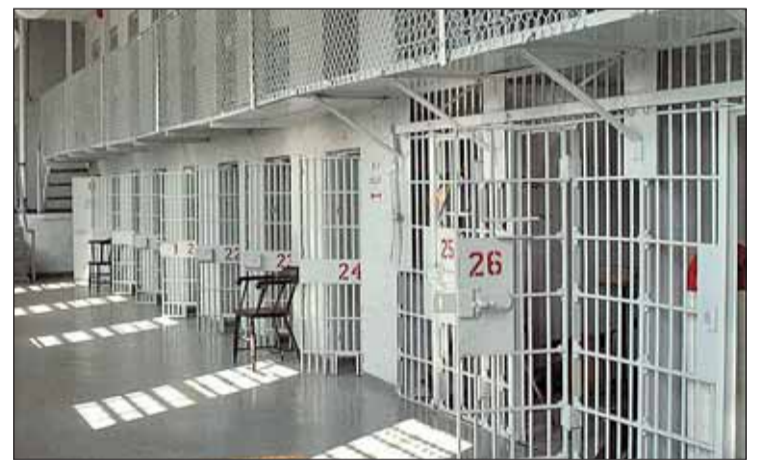
Interior de un centro penitenciario.

Los objetivos del nuevo plan de reinserción son "la asunción de la responsabilidad del penado, superar los elementos de la convicción que le llevaron a cometer la violencia, una progresiva asunción de valores cívicos y de respeto a la vida y la libertad de los ciudadanos, así como las exigencias legales de perdón expreso a las víctimas, la reparación del daño y colabora-