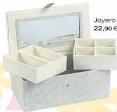
Joyero con espejo, 22,90 €