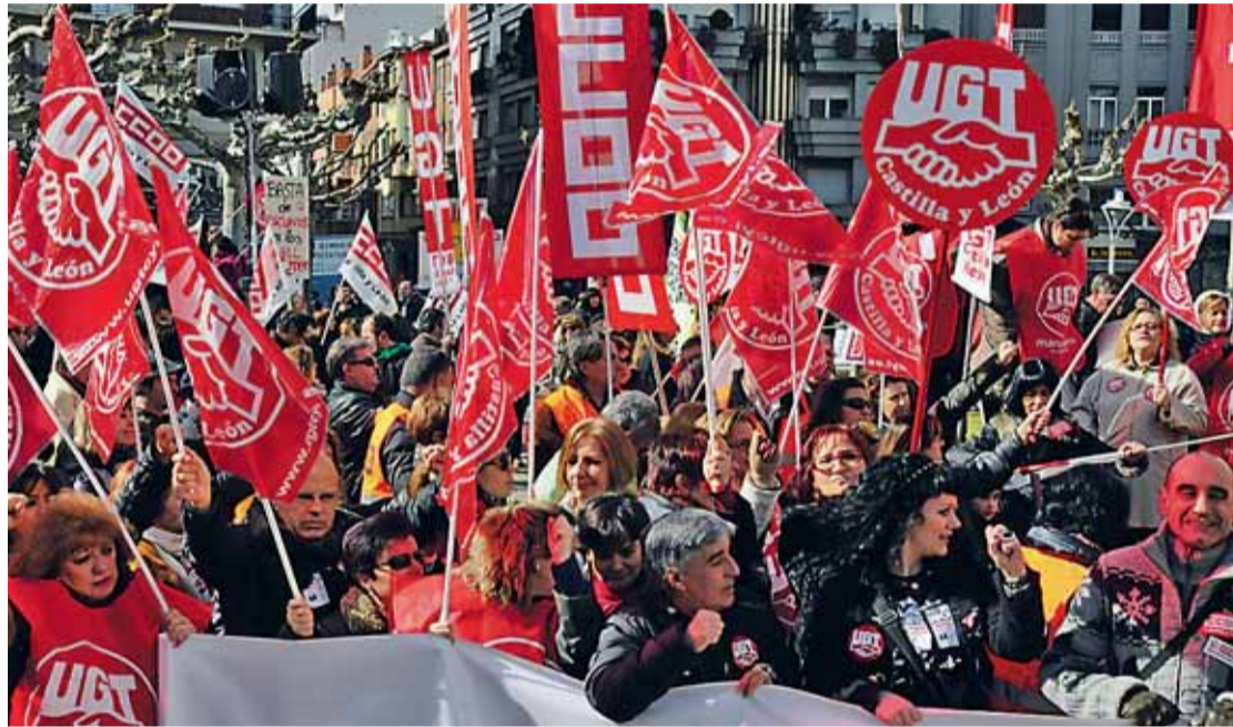
La primera 'protesta dominical' (en la imagen) tuvo lugar el 19 de febrero; el 11 de marzo, fue la segunda.

La manifestación busca convertirse en un clamor popular de rechazo a las últimas medidas plan-