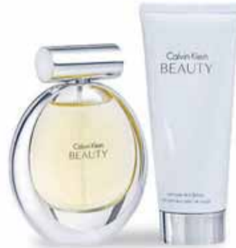
Cofre CALVIN KLEIN BEAUTY Eau de Parfum 50 ml + Luminous skin lotion 100 ml, 55 €