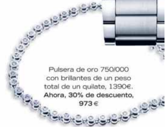
Pulsiera de oro 750/000 con brillantes de un peso total de un quilate, 1390€. Ahora, 30% de descuento, 973 €