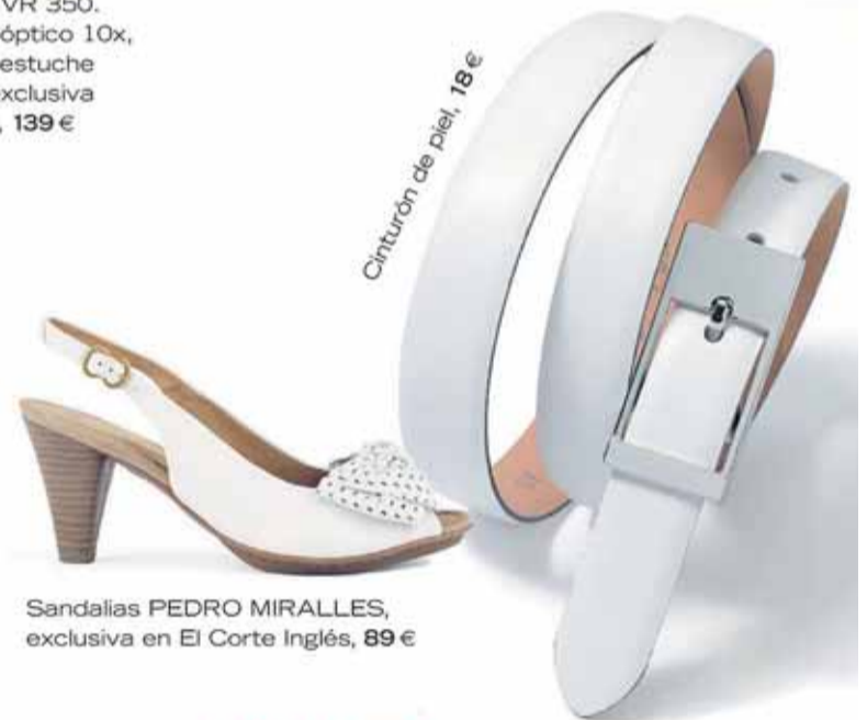
Cinturón de piel, 18 €