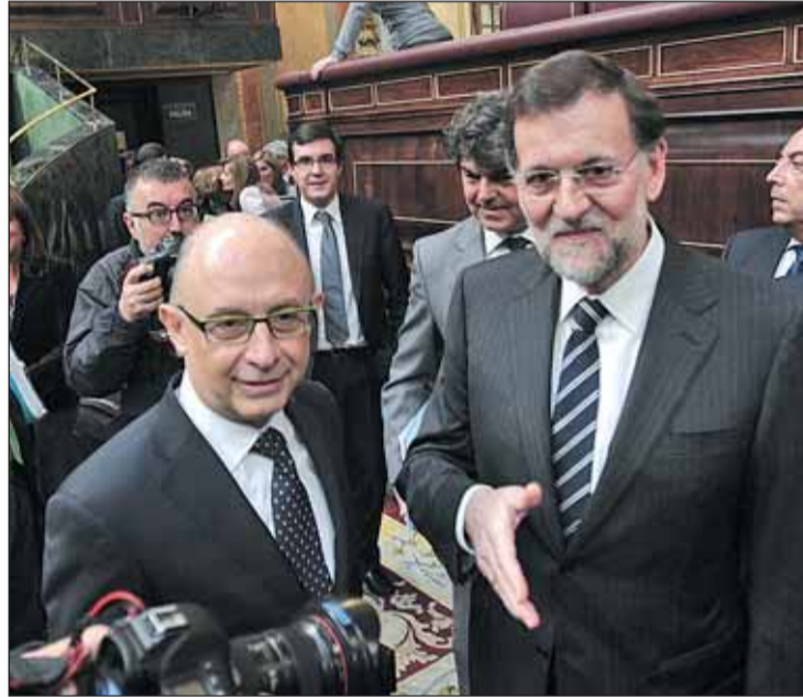
Mariano Rajoy y Cristóbal Montoro tras el Pleno.

De este modo, los presupuestos han visto la luz de forma casi definitiva (aún queda el recién