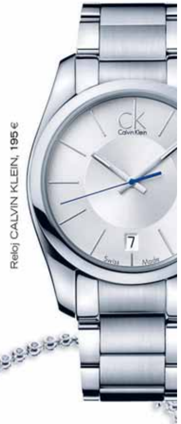
Reloj CALVIN KLEIN, 195 €