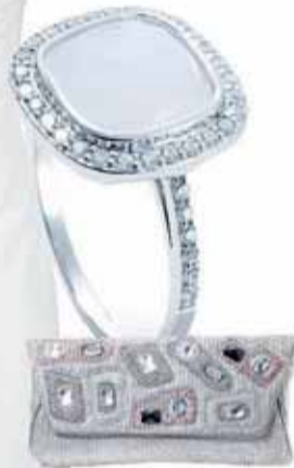
Cartera de pedrería, 45 €