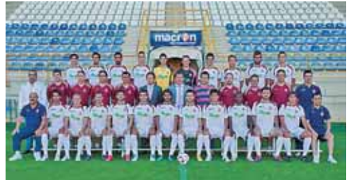
La Cultural continúa con paso firme en la Liga 2011-2012.