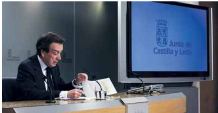
José Antonio de Santiago-Juárez durante la rueda de prensa celebrada tras el Consejo de Gobierno.

En Castilla y León prestan sus servicios 12.006 enfermeros mientras que en el Sistema Nacional de Salud son 158.262. "Castilla y León es la primera Comunidad en profesionales de Atención Primaria por cada cien mil habitantes".