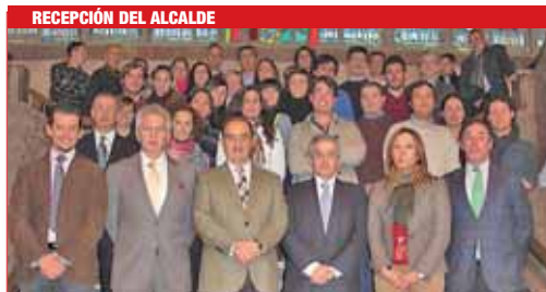
RECEPCIÓN DEL ALCALDE