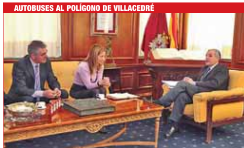
AUTOBUSES AL POLÍGONO DE VILLACEDRÉ

El Centro Comercial y de Ocio Espacio León entregó a Unicef 15.000 euros de la campaña 'Echa una mano, dona un día'. Esta cantidad se amplía hasta los 45.000 euros, ya que también se desarrolló en Espacio Coruña y Espai Gironés, los tres gestionados por Multi Mall Management Spain. El destino del dinero es Angola. En la foto, el director de Espacio León y la presidenta de Unicef-León.