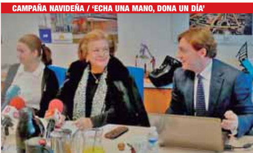
CAMPAÑA NAVIDEÑA / 'ECHA UNA MANO, DONA UN DÍA'

A Garzón, el juez, le falta vencerse a sí mismo para ser poderoso, porque de tanto regocijarse ante el espejo vestido de justiciero ha acabado creyéndose la justicia misma. Hasta es posible que sea declarado inocente por lo de Franco y eso, es probablemente lo que más le pese.