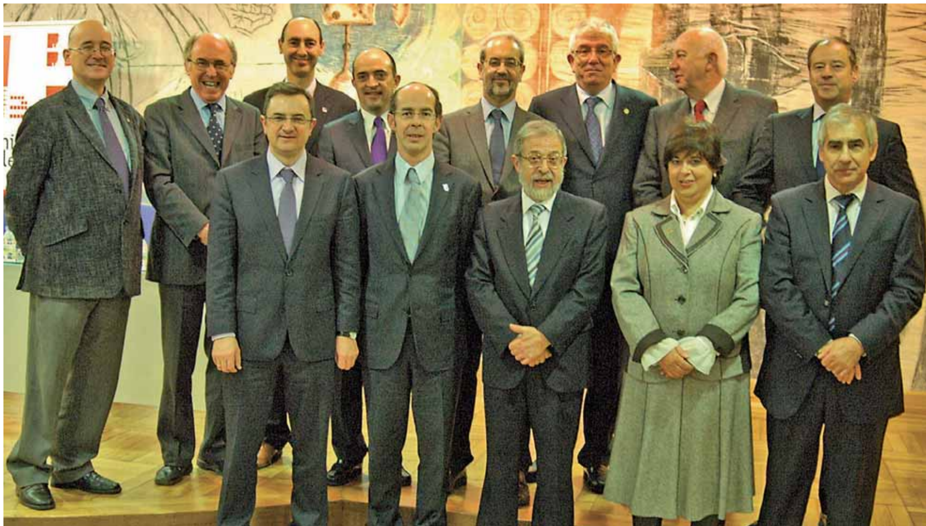
Foto de familia de los representantes de las universidades e instituciones del noroeste de España (Galicia, Portugal y Castilla y León) y que conforman el Consejo de rectores del Suroeste de Europa.

LA ULE ACOGE EL NACIMIENTO DE UN ORGANISMO QUE PRETENDE CREAR MASA CRÍTICA