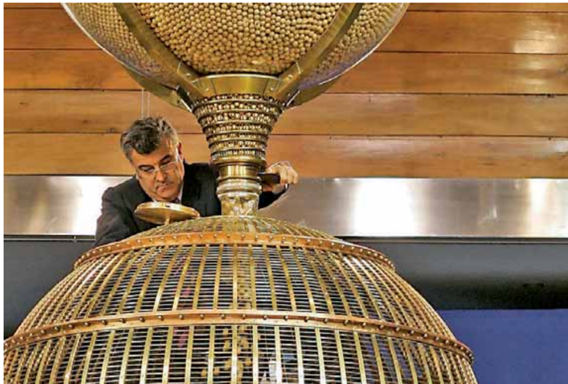
Será el 22 de diciembre cuando España entera esté pendiente del gran bombo del sorteo de Navidad.