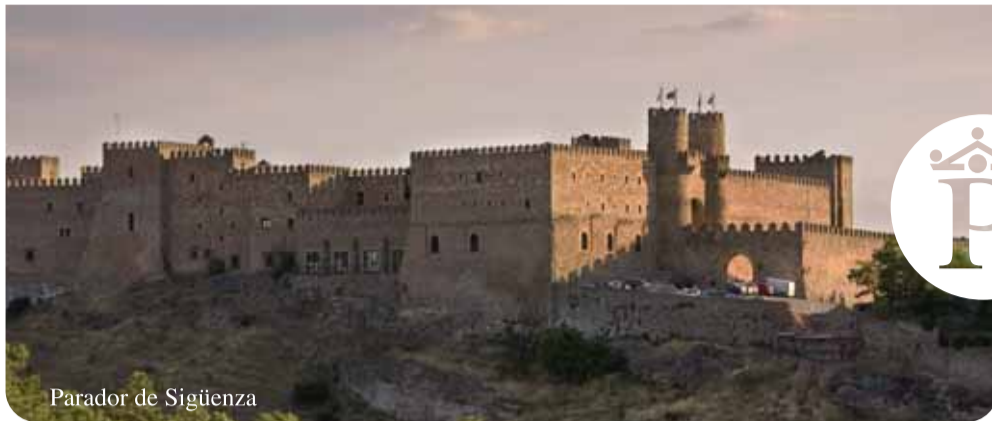
Parador de Sigüenza