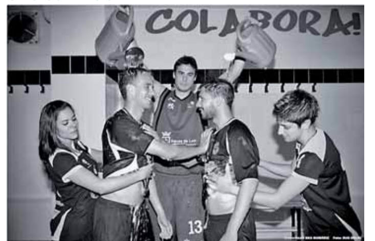
La Cultural presentó el 13 de diciembre su original Calendario 2012.