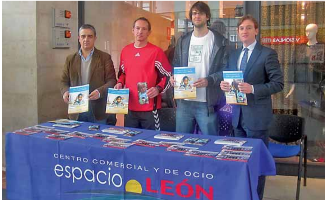
El Reale Ademar colabora en la campaña 'Echa una mano', promovida por Espacio León en favor de Unicef.

BALONMANO / EL ATLÉTICO DE MADRID, ÚLTIMO RIVAL DE LA PRIMERA VUELTA