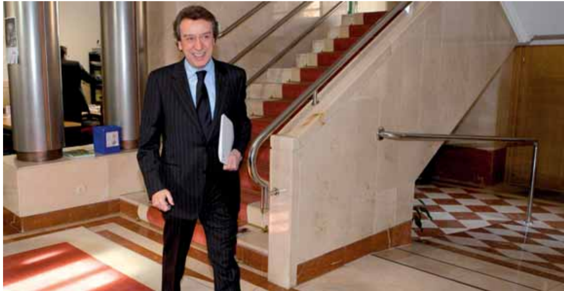
José Antonio de Santiago-Juárez a su llegada a la rueda de prensa tras el Consejo de Gobierno.

El reglamento establece de manera preferente una serie de acciones para promover la actividad económica en el medio rural, vinculadas especialmente al aprovechamiento sostenible de los recursos endógenos, al sector agrario y a su industria de transformación. Estas tareas las realizará de manera coordinada con la Consejería de Economía y Empleo