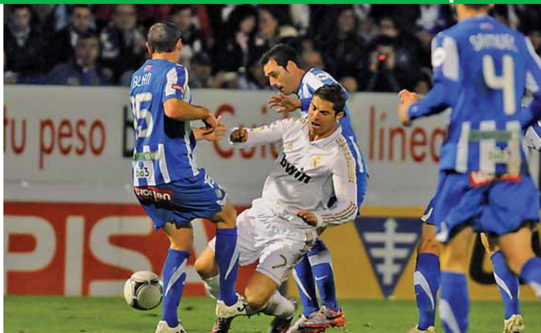
Cristiano Ronaldo estuvo muy activo todo el partido. Kaká dejó destellos de su clase y Callejón volvió a aprovechar su oportunidad con un nuevo gol. Al final, aplausos en el palco de autoridades para los dos equipos.

Al filo de la media hora de partido, Callejón abría el marcador para el conjunto madridista. En el minuto 67, Cristiano Ronaldo hacía el 0-2 y sentenciaba un partido que dejará una huella imborrable en la capital de El Bierzo.