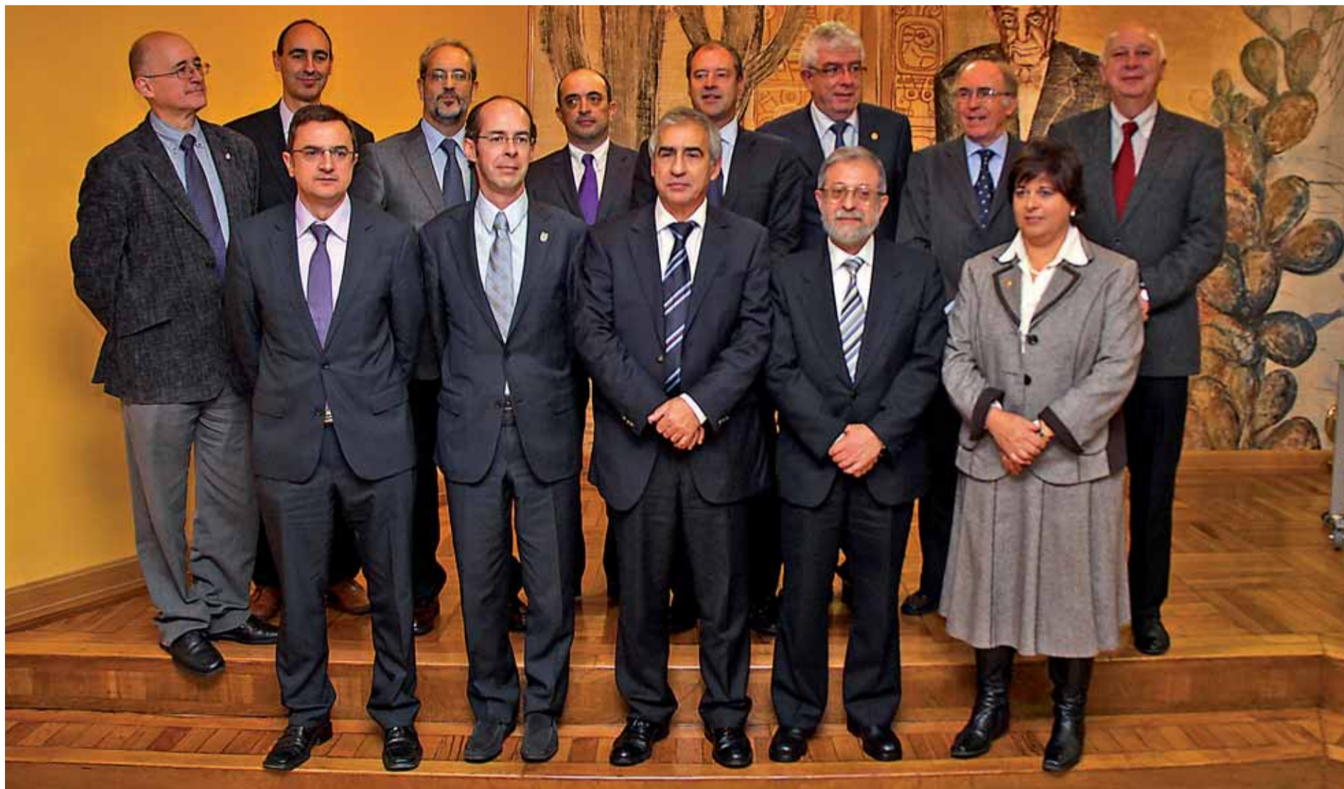
Universidades de Santiago, A Coruña, Vigo, Burgos, León, Salamanca, Valladolid, Minho, do Porto, Tras os Montes e Alto Douro, Politécnico de Bragança, Pontificia de Salamanca, Católica de Ávila, Miguel de Cervantes y IE University.

JORNADA HISTÓRICA: CONFERENCIA DE RECTORES DE LAS UNIVERSIDADES DEL SUROESTE DE EUROPA