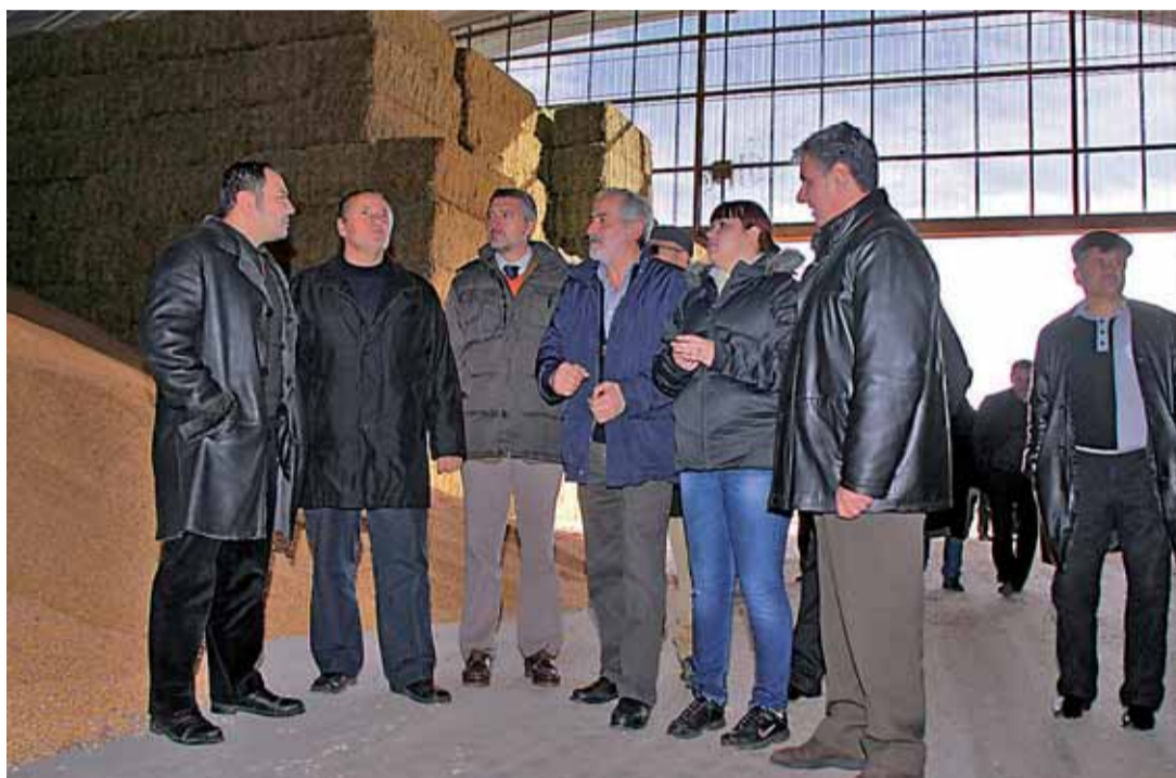
La delegación del Gobierno de Tayikistán recorrió la provincia leonesa para conocer su sistema de regadíos.

Una delegación de este Gobierno tayiko visitó la provincia leonesa para comprobar de primera mano el funcionamiento de la estación de bombeo del sector II de la Comunidad de Regantes del Páramo Bajo en Pobladura de Pelayo García y el del centro de telecontrol de la Comunidad de Regantes de la Margen Izquierda del Porma, ubicado en Cabrerros del Río. Del mismo modo, pudieron conocer la actividad agrícola que se desarrolla en esta época del año y el funcionamiento de la cooperativa agraria.