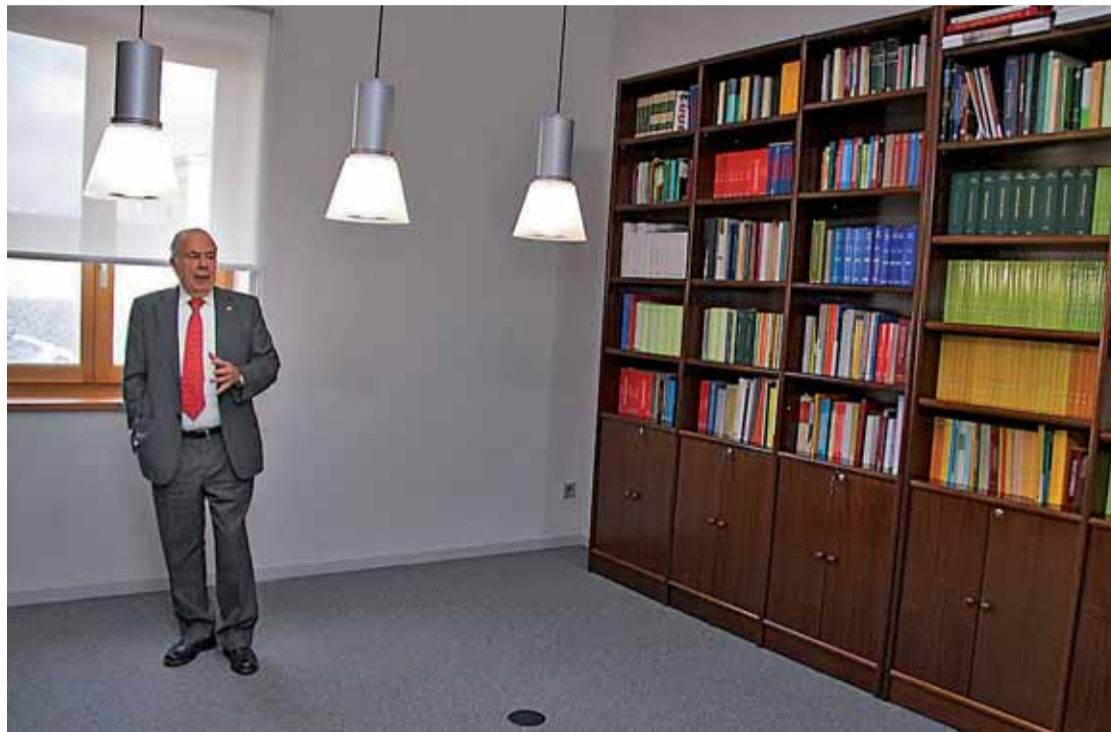
Javier Amoedo durante una visita en la que mostró a la prensa la nueva sede del Procurador del Común en León.

Entre estas reclamaciones, apuntó que "los ciudadanos de la Comunidad se siguen quejando de la actuación de la administración" y, aunque "muchas de las quejas se refieren a situaciones relacionadas con la crisis económica", otras "siguen en la misma línea de siempre". Entre ellas, des-