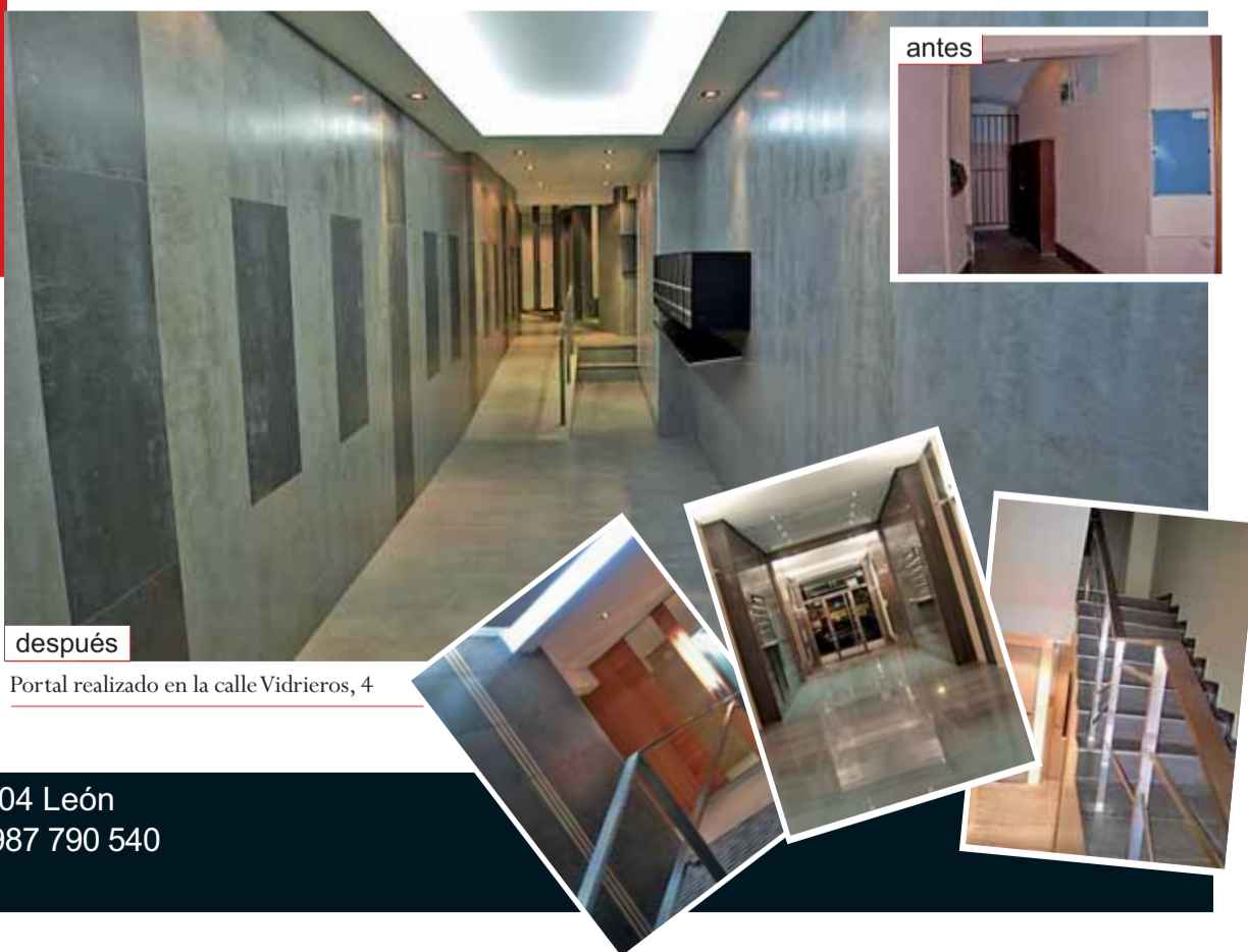
Portal realizado en la calle Vidrieros, 4