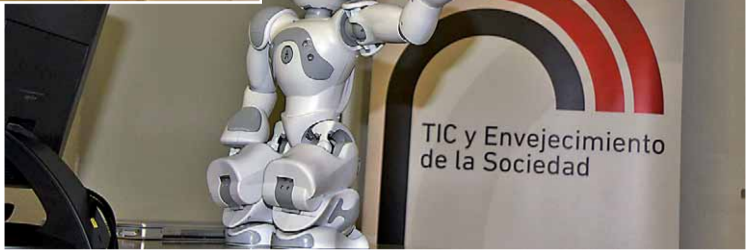
Dos doctorandos de la Universidad Rey Juan Carlos presentaron al humanoide que les "ayuda" en su investigación sobre la robótica en el tratamiento del Alzheimer.