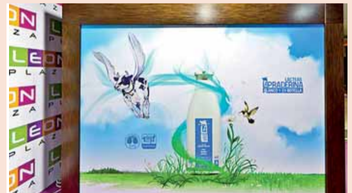
Máquina expendedora de leche instalada en 'León Plaza'.