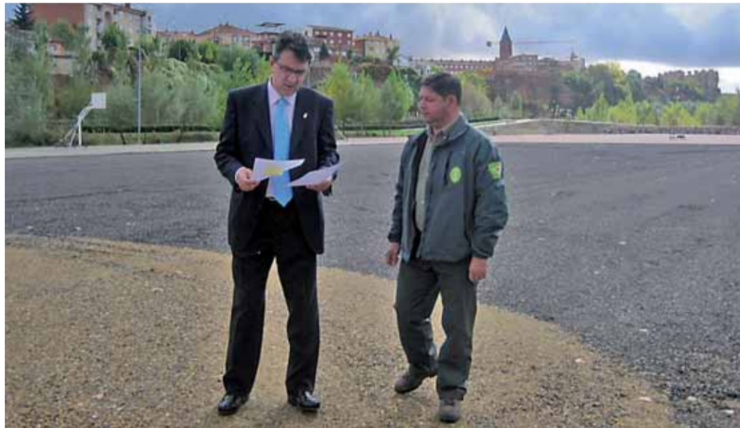
El alcalde y el teniente de alcalde supervisan las obras del ambicioso proyecto en el Complejo La Isla.

De esta forma, con los 4.500 m 2 de superficie asfaltada se da respuesta a una de las necesida-