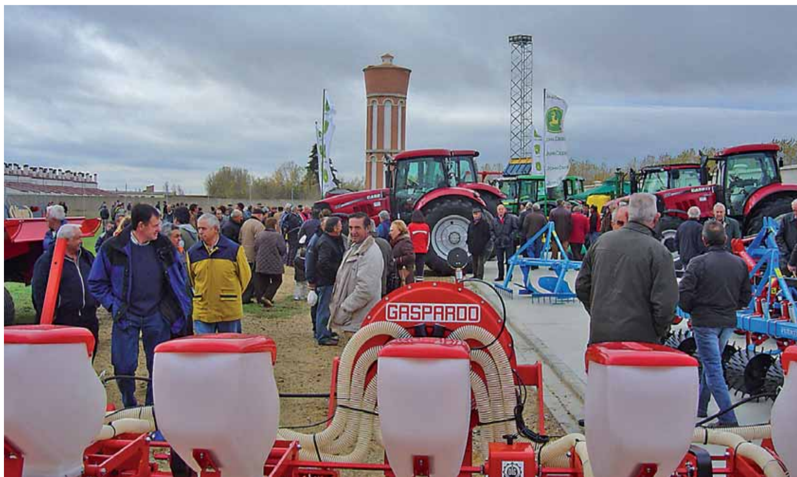
La exposición de las más modernas piezas de maquinaria agrícola y ganadera podrán contemplarse a lo largo de cientos de metros en la Feria de Mansilla.

Y para los que gustan de realizar las obligadas compras caseras tendrán la opción de hacerlo en los múltiples puestos de feriantes donde, por ejemplo, adquirir los primeros turrone navideños. Y sin comer nadie se puede marchar de Mansilla, por eso bares y restaurantes ofrecen este día suculentos menús donde no puede faltar el rico bacalao al estilo mansillés.