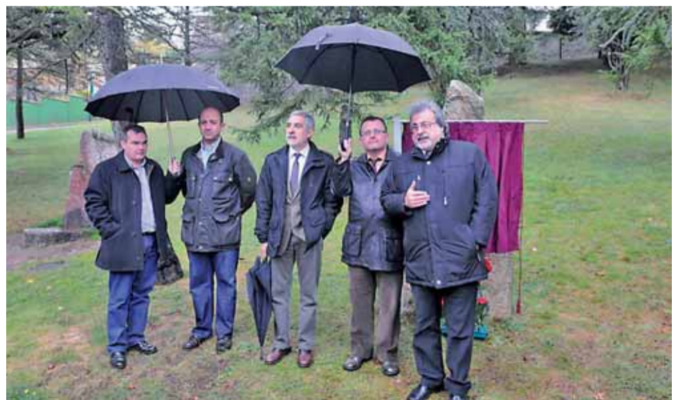
Gaspar Llamazares durante su visita al municipio leonés de La Pola de Gordón.

En cuanto a la minería del carbón, Llamazares subrayó la apuesta del partido por la “consolidación” de la minería, el “cumplimiento” con las inversiones previstas en este sentido y, en definitiva, con el “papel” del carbón dentro del mix energético nacional. Además, criticó la postura del PP en esta materia, cuyas propuestas consideró “lo más absurdo” que ha leído en su vida.