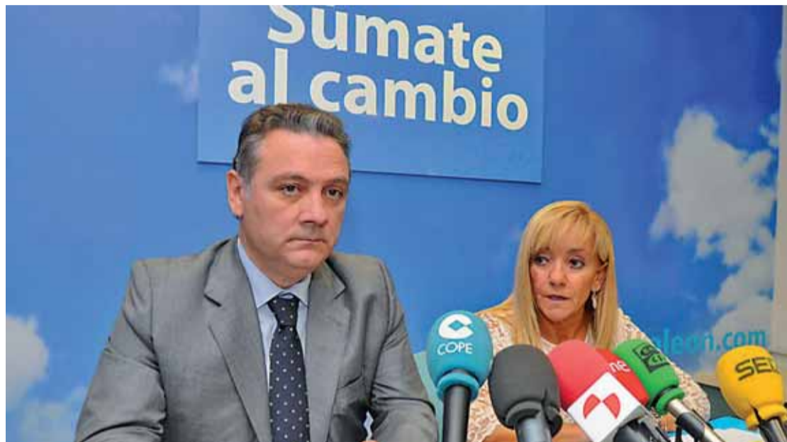
El número uno del PP al Congreso, Alfredo Prada y la presidenta provincial del partido, Isabel Carrasco.

Con estos datos, desde el Partido Popular piden la confianza de los ciudadanos para que no “se dé por bueno lo que se ha hecho” hasta ahora desde el Gobierno central. Así, el número uno a la Cámara Baja señaló que desde el PP prometen ser “reivindicativos y a asumir compromisos” bajo la premisa de cumplirlos y salir así de “la frustración” que supone “el cúmulo de incumplimientos” del Gobierno “a lo largo de los últimos siete años”. Un período en el