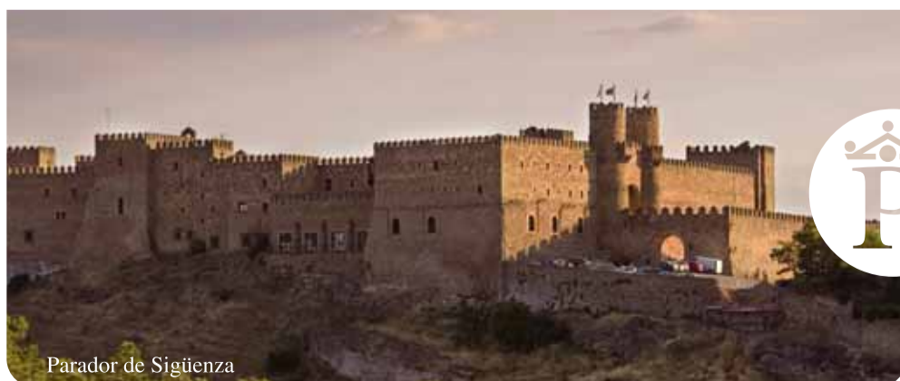
Parador de Sigüenza

La entrega del premio Enise al mejor servicio Cloud fue una de las actividades paralelas a este encuentro