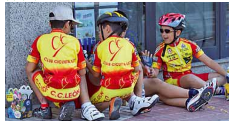
La situación económica pone en peligro la subsistencia del CC León.