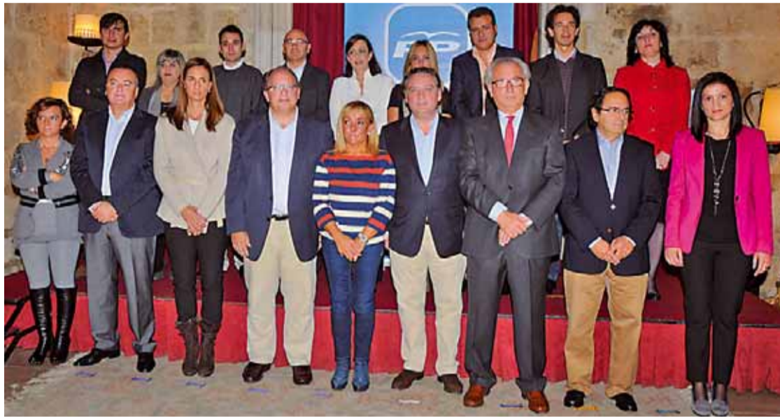
Foto de familia de los candidatos al Congreso y al Senado y la presidenta provincial del Partido Popular.