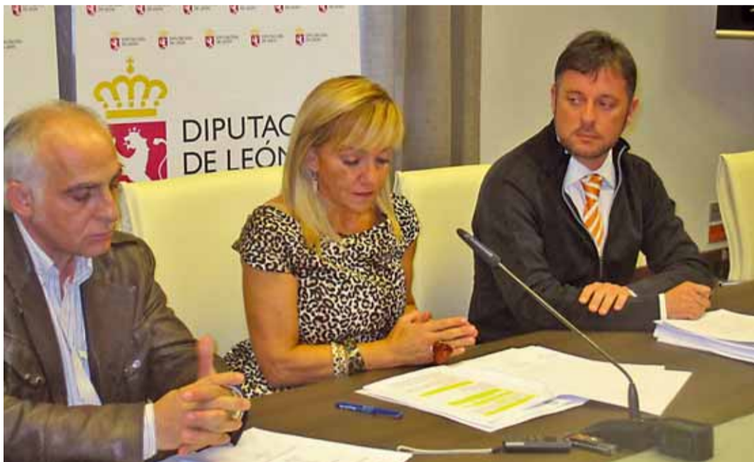
La presidenta de la Diputación durante la presentación de la oferta turística de la provincia en Intur.

La tarjeta se obtendrá a través de la página web oficial del Consorcio Patronato Provincial