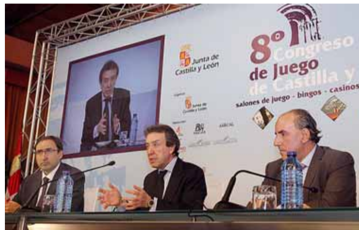
De Santiago-Juárez junto al alcalde y el presidente de la Diputación.

El consejero concretó que entre las medidas previstas destacan la ampliación temporal de las bajas fiscales de máquinas recreativas en general, deducciones fiscales por tramos de máquinas para los salones de juego, un tratamiento más beneficioso de la base imponible que tienen los casinos, y la rebaja del tipo impositivo para el denominado bingo electrónico.