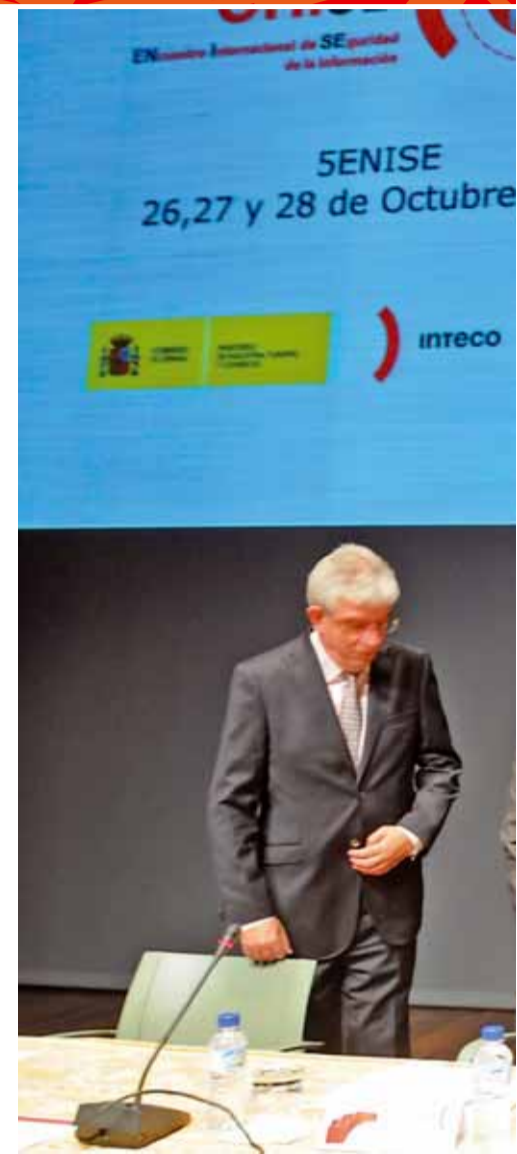
La presentación de la quinta edición de este encuentro

‘Hacia una sociedad conectada más confiable’ fue el lema de este encuentro