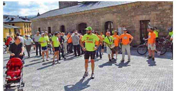
Basurko correrá de Villafranca del Bierzo a O Cebreiro.