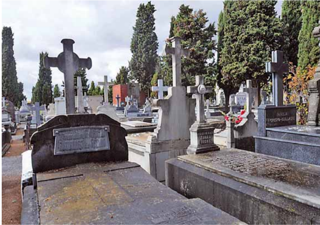
Miles de leoneses acudirán estos días al Camposanto de León para recordar y honrar a sus seres más queridos.

Y como colofón a estos días intensos de recuerdos y de ajetreos en el cementerio, Serfunle ha organizado para el miércoles 2 de noviembre, Día de los Difuntos, una misa en la Catedral de León en memoria de todas aquellas personas fallecidas a lo largo de este año. Esta misa será cantada por la Coral Gregoriana del Císter de Sandoval y se espera la asistencia de las principales autoridades de la ciudad y la provincia. Será un bonito y emocionado homenaje final a varios días marcados por innumerables recuerdos y vivencias con personas queridas. Descansen en paz.