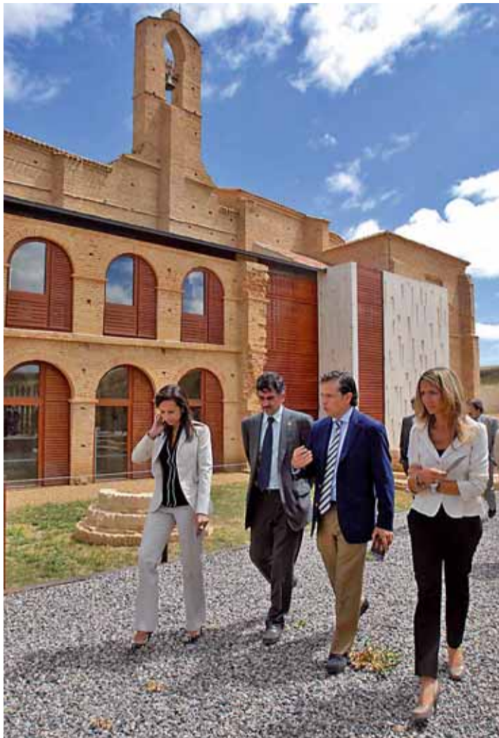
Las instituciones que han restaurado la Peregrina recibirán el Puerro de Oro.

El galardón Puerro de Oro 2011 ha recaído este año en dos de los organismos públicos que han