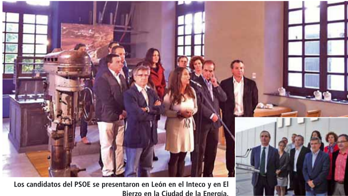
Los candidatos del PSOE se presentaron en León en el Inteco y en El Bierzo en la Ciudad de la Energía.

El actual portavoz socialista en el Congreso de los Diputados, José Antonio Alonso, avanzó que “nos proponemos seguir luchando con todas nuestras fuerzas” gracias a una “muy buena candidatura” que peleará por mantener y concluir las “inversiones inteligentes” realizadas, el mismo nivel de “infraestructuras en un grado desconocido en la historia de