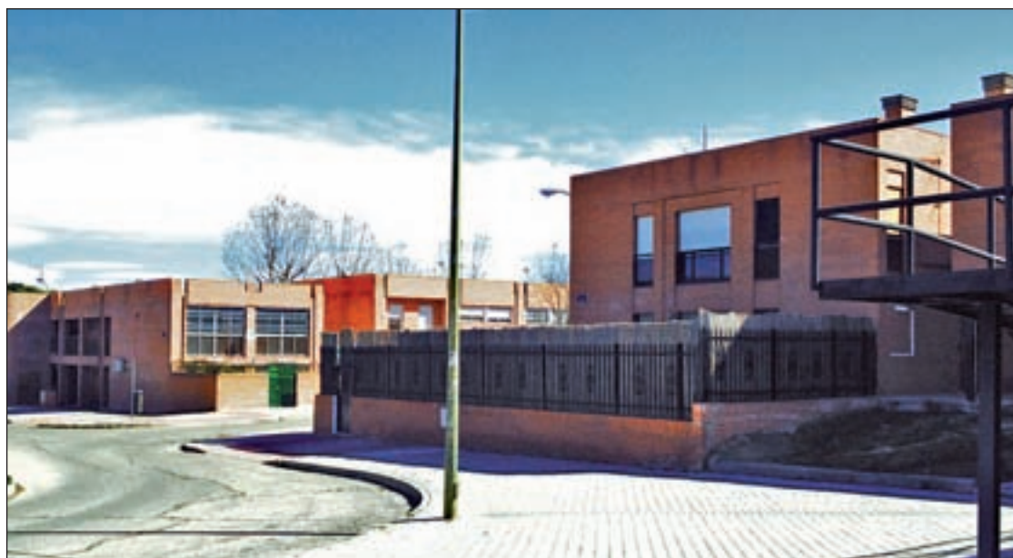
Las viviendas situadas en la plaza de Ceres

El nuevo estadio de La Peineta contará, entre otras novedades, con 72.000 plazas, además de aparcamiento en superficie y subterráneo para facilitar el acceso de los espectadores sin generar problemas de circulación. Está previsto que el Atlético de Madrid comience a utilizar las instalaciones en la temporada 2016-17.