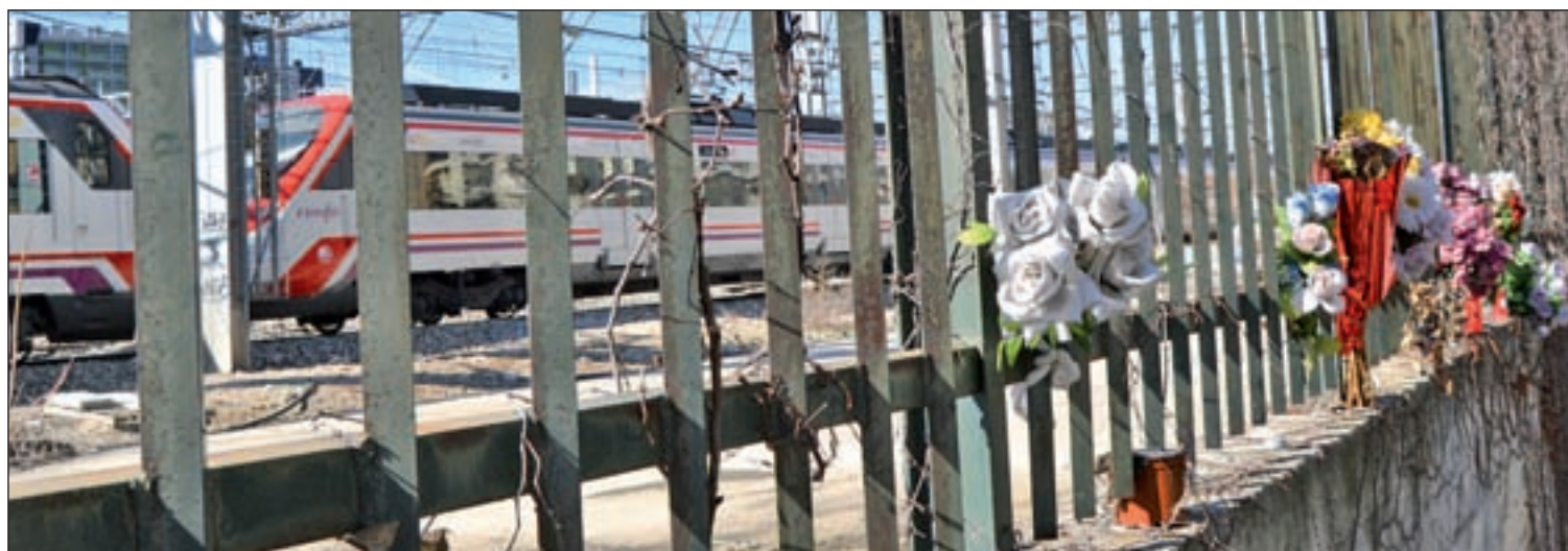
En el lugar de la explosión nunca faltan las flores en recuerdo de las víctimas