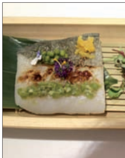
Bacalao confitado de La Sopa Boba

Por su parte, el restaurantente 'Trattoria', especializado en comi-