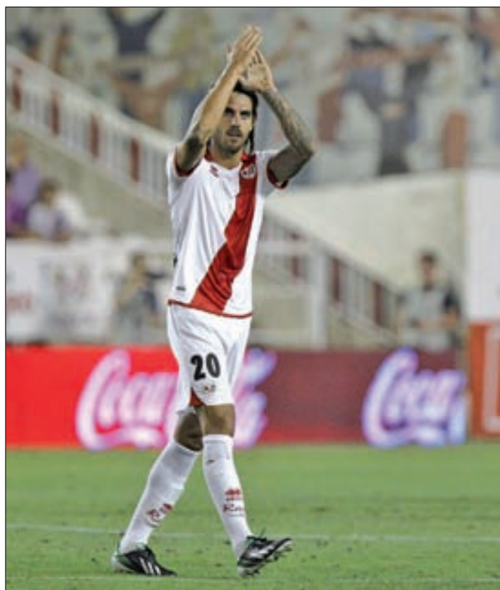
Larrivey anotó el único tanto ante el Valencia

De cara a este partido, el técnico rayista cuenta con la baja segura de Tito, que estará varias semanas en el dique seco por un esguince de tobillo. Por contra, Jonathan Viera regresa a la lista tras su ausencia ante el Valencia.