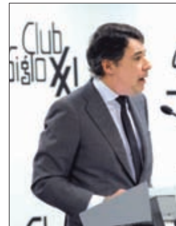
González, en el Club Siglo XXI

Si en algo coinciden todas las Comunidades Autónomas es en que el actual sistema de financiación es inaceptable. De hecho, el lunes día 3 el presidente de la Comunidad, Ignacio González, en el marco de la conferencia del Club Siglo XXI, insistió de nuevo en que el sistema es "injusto y discriminatorio con Madrid", y arremetió contra los "privilegios históricos de Navarra y País Vasco, que, de tener los mismos criterios, aportarían 3.200 millones".