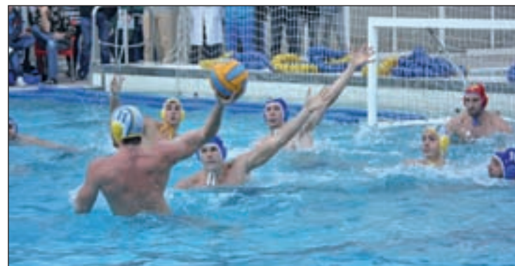
Imagen del partido de Liga que disputaron Canoe y Barceloneta

En caso de lograr su pase a semifinales, el Canoe se mediría al ganador del Mataró-Catalunya.