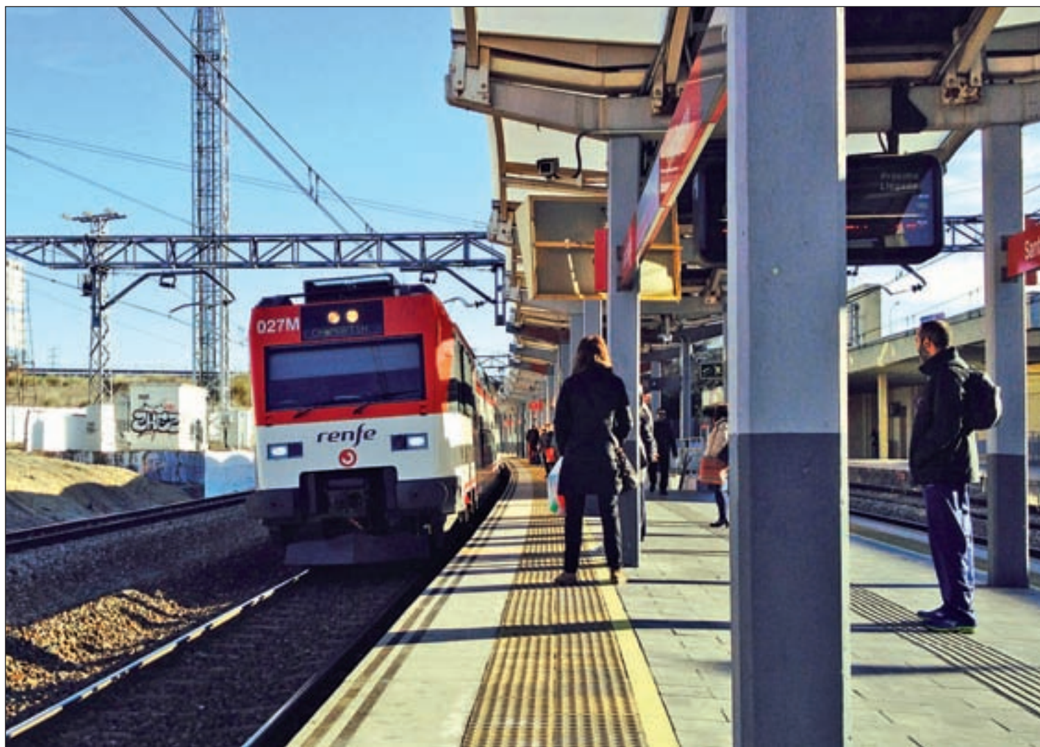
Un tren llega a la estación de Santa Eugenia, donde fallecieron 16 personas en el atentado LUCA JIMÉNEZ

Los barrios de Santa Eugenia y El Pozo del Tío Raimundo serán el escenario de varios actos de homenaje • Una víctima y un trabajador del Polideportivo Daoíz y Velarde recuerdan sus propias experiencias PÁGS. 6 Y 8