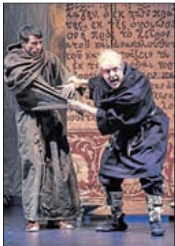
'El nombre de la Rosa'

Entre los espectáculos con descuentos del 50% se encuentran 'Monty Phytton', 'Pasen y Beban', 'Pinocho' y 'Gin & Toni', todos ellos en el Teatro Caser Calderón, así como Anthony Blake, en el Teatro Quevedo, y 'El Nombre de la Rosa', en el Teatro Nue-