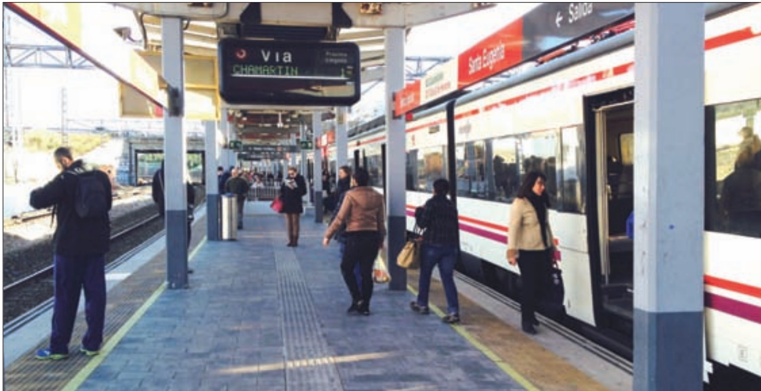
Varios pasajeros suben y bajan de uno de los trenes de la línea C-2 en la estación de Santa Eugenia