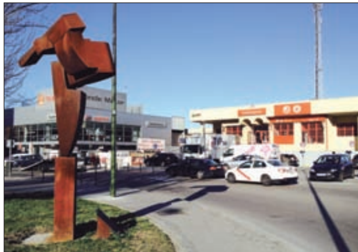
ACTOS DE RECUERDO Los monumentos levantados junto a la estación de Santa Eugenia y El Pozo serán el escenario de varios actos de homenaje el 11 de marzo. En el primero, tendrá lugar una ofrenda floral a las 18 horas, y en el segundo la actuación de la coral Vallekanta a las 19:30.

GENTE su propia experiencia con motivo del décimo aniversario del suceso. En aquel entonces, tenía 28 años, estuvo en coma tres meses, perdió un oído y la mitad del otro, y después de un sinfín de operaciones su cuerpo quedó marcado de cicatrices. Como resultado, una minusvalía sensorial del 63 por ciento que le supuso la jubilación a tan corta edad. Ahora vive en Tenerife, una ciudad que no tiene tren, algo que le ha ayudado a llevar mejor su situación. En la actualidad, es miembro de la Asociación 11-M Víctimas del Terrorismo. “Como todas las mañanas, iba de pie y esperaba sentarme en Atocha. Noté que el tren se balanceaba, un pitido en los oídos, vi todo gris y que saltaba por los aires la parte derecha del va-