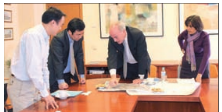
Un momento de la reunión la Junta Municipal

sarrollo económico que presenta este distrito”. El concejal, además, les ofreció la posibilidad de utilizar los espacios culturales para realizar acciones “que contribuyan a lograr una mayor integración de los ciudadanos chinos y difundir la cultura china entre los españoles”, dijo.