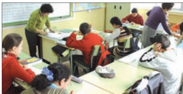
Un millón de alumnos solicitarán plaza

Recep Tayyip Erdogan, primer ministro de Turquía, no pasa por buenos momentos. Acosado por la corrupción, se dedica a cercenar las libertades para garantizar su supervivencia política. Sin quererlo, el mandatario turco fue puesto como ejemplo, malo, por supuesto, para comparar sus nada democráticas artes de mando con el comportamiento del PP al frente de la Comunidad de Madrid. Era una mañana tranquila, los periodistas esperaban la comparecencia de los portavoces del PP, PSM, IU y UPyD de la Asamblea de Madrid. No se esperaba nada importante. Ya se sabía que la oposición pediría una comisión de investigación sobre el presunto fraude en los cursos de formación y que el PP se lo sigue pensando. Se sabía que el tranvía de Parla y los informes de la Cámara de Cuentas provocarían cruces de declaraciones nada amigables. El socialista José Quintana dijo, al poco de llegar, que la Cámara de Cuentas es una máquina de triturar alcaldes de su partido y que sólo fiscaliza las cuentas de los gobernados por los suyos, y puso Parla como ejemplo. Destacó que pueblos del PP como Pozuelo o Boadilla son invisibles a los vigilantes de los dineros públicos. Ni Erdogan haría en Turquía lo que el PP en Madrid para acabar con el adversario político. Eso dijo Quintana, quien olvidó anunciar, en consecuencia, que los elegidos por el PSM para estar en esas máquinas de acabar con la oposición abandonan sus poltronas a favor de la transparencia. Es la amnesia que anestesia.