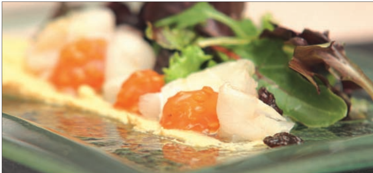
Ensalada de bacalao marinado salteado del restaurante Treze