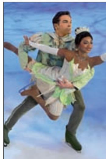
'Tiana y el sapo'

Los más pequeños podrán reírse con la divertida aventura de Disney Enredados, donde Rapunzel, y sus compañeros Flynn y Máximo se embarcan en un viaje a nuevos mundos; recorrer New Orleans para descubrir a Tiana, un príncipe convertido en sapo y un beso que les llevará a una emocionante aventura o viajar al bosque encantado de Blancanie-