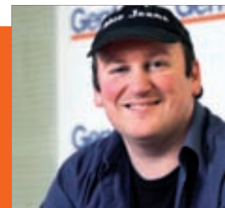
iGente TIEMPO LIBRE Pág. 16

Conservar los árboles que se encuentran en buen estado, crear un carril bici o aumentar el talud que le separa de la M-40 son algunas de las propuestas de los ciudadanos para la remodelación de la zona verde, un proyecto que está en fase de ejecución.