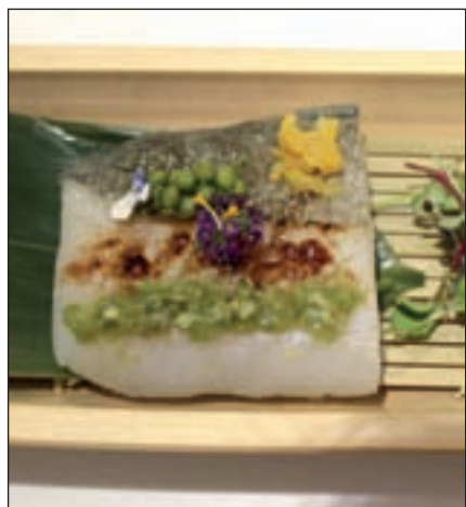
Bacalao confitado de La Sopa Boba

Ante la llegada inminente de la 'Semana Santa' y sus tradiciones gastronómicas, desde el 5 de marzo y hasta el próximo 13 de abril los restaurantes de la región 'Treze' (Madrid), 'La Sopa Boba' (Alpedrete), 'El Mirador de la CEA' (Arturo Soria), 'El Cielo de Urrechú' (Pozuelo de Alarcón), 'Pinch-Arte Velázquez' (Madrid) y 'Trattoria SantArcangelo' (Ma-