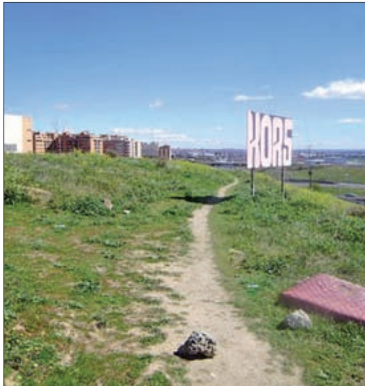
Uno de los espacios de la zona verde

Los residentes consideran necesaria la conservación de los árboles que ellos mismos han plantado y que se encuentran en buenas condiciones y la creación de un carril bici. Además, piden que se aumente el talud existente para mitigar los efectos del tráfico rodado de la cercana M-40 y la instalación de zonas de juegos infantiles y de aparatos de ejercicio