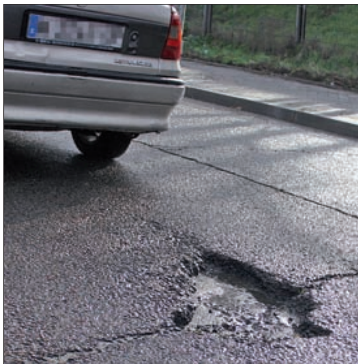
El mal estado de las vías es un peligro para la seguridad GENTE

La remodelada travesía de Villanueva de Perales cuenta con nuevas aceras y con la ampliación de las existentes, además de ba-