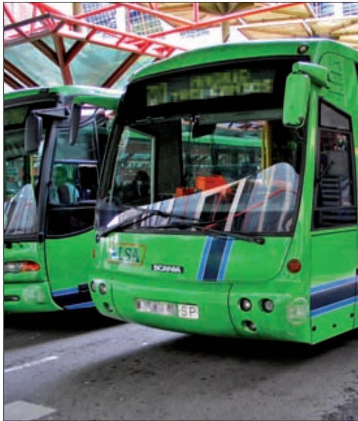
Hay municipios que no tienen otra alternativa

En el caso de los 40 municipios afectados en el entorno de la A-1, a excepción de Alcobendas y San Sebastián de los Reyes, no existen otras alternativas de transporte como Cercanías, Metro y Metro Ligero. Son localidades, además, con una gran dispersión geográfica, alejadas del núcleo de la capital, ya que 34 de ellas pertenecen a la zona tarifaria C2, y con una importante complejidad en