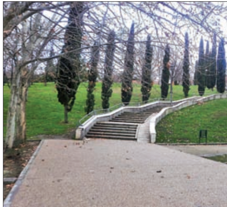
La zona verde situada en el distrito de Usera

El Defensor formuló una recomendación al Ayuntamiento para que aumentara los equipamientos destinados a contenedores para residuos y aseos, de tal forma que se mejore la imagen y