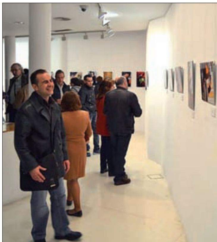
Sala de exposiciones del Centro de Arte Tomás y Valiente

La biblioteca municipal José Manuel Caballero Bonald, situada a la altura del número 9 de la calle Sevilla, albergará 'Los secretos de Cocolito'. Un cuentacuentos sobre