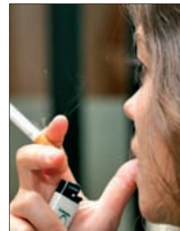
El IPC del tabaco sube un 2,5%

A nivel nacional, la tasa de variación anual del IPC en febrero es del 0,0%, dos décimas por debajo