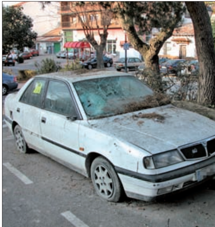
Vehículo abandonado en la vía pública

De hecho, desde la Policía Local de Fuenlabrada se hace un llamamiento a la ciudadanía para que utilicen este método de retirada de vehículos en vez de dejarlos sin más en las calles, ya que esta decisión acarrea diferentes problemas. "Es muy difícil encontrar sitio para aparcar y, si se ocupan las plazas de aparcamiento existentes con vehículos abandonados, la búsqueda de aparcamiento se convierte en una misión imposible", aseguraron fuentes municipales. Además, se crea un riesgo para los peatones y un