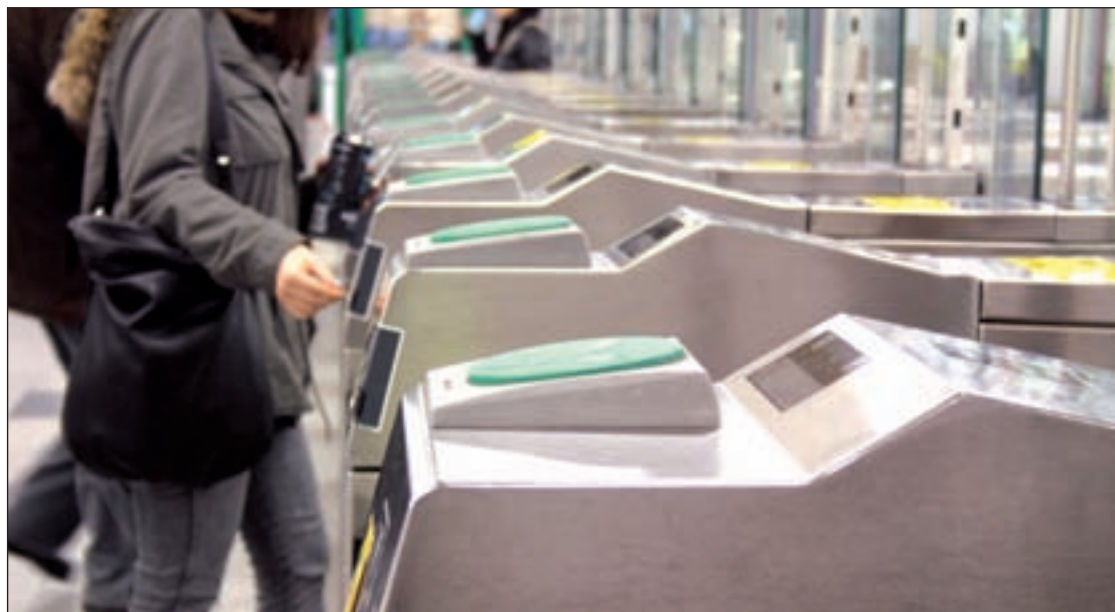
La tecnología sin contacto se extiende a las zonas B y C

La Comunidad de Madrid es líder en la e-Administración con el mayor grado de servicios on line.