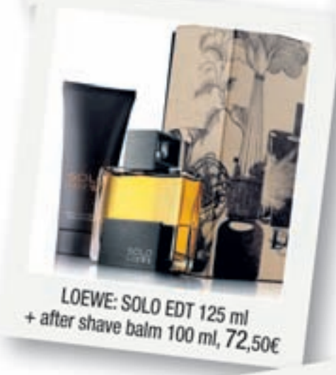
LOEWE: SOLO EDT 125 ml + after shave balm 100 ml, 72,50€