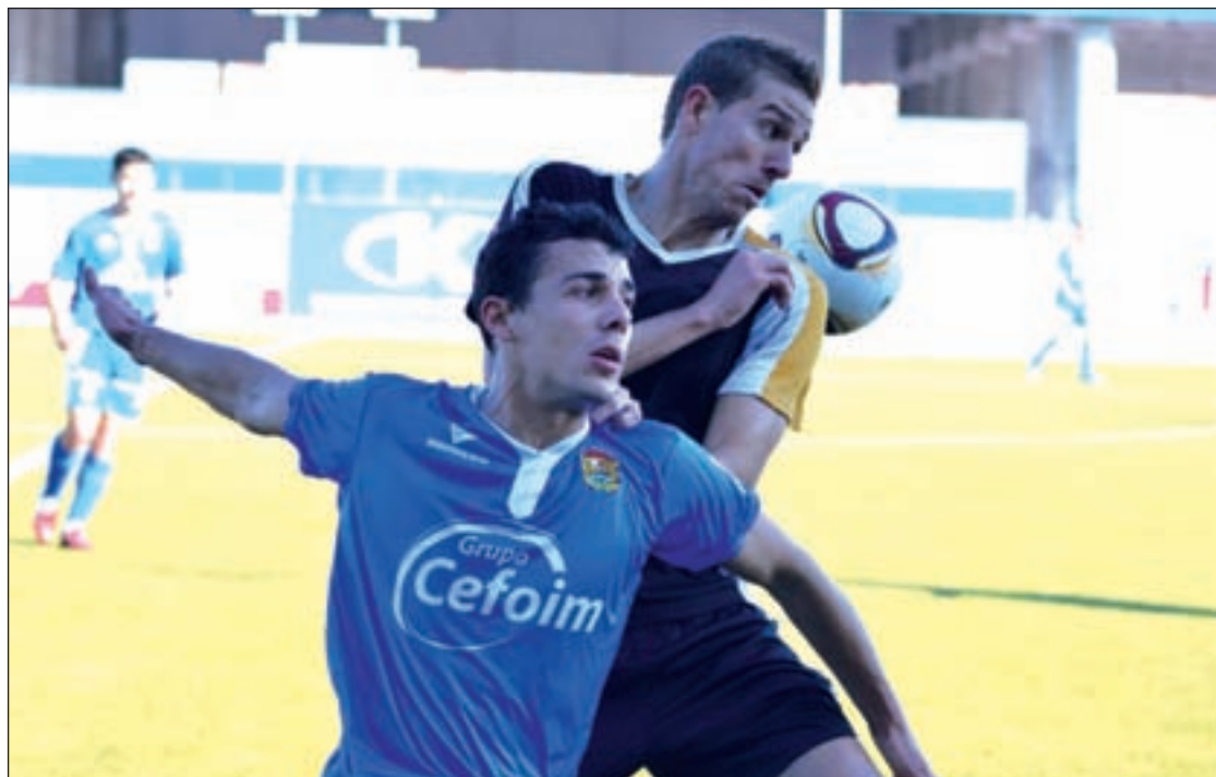
Jugadores del Fuenlabrada

Con este nuevo empate y tras 29 jornadas, el Fuenla acumula 11 victorias, 11 tablas y 7 derrotas. Es posible que este último resultado sea el final de la mala racha. Lejos quedan esos buenos tiempos de las primeras jornadas de competición, cuando el Fuenlabrada logró mantenerse durante varios encuentros en cuarta posición. Por su parte, el Real Madrid C, a pesar de ganar al