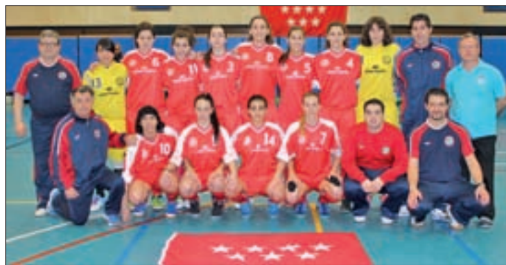
Las integrantes de la selección campeona FEMAFUSA

to, aunque las últimas competiciones de selecciones regionales auguran un futuro muy prometedor. Si a finales de enero fue la selección sub-17 la que estuvo a punto de hacerse con el título de campeona de España, el pasado fin de semana fue el combinado sub-21 el que dio una alegría al