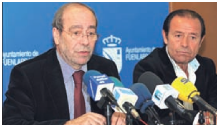
Presentación del Foro de las Ciudades

los ponentes, con los eurodiputados López Aguilar y Willy Meyer, la periodista Soledad Gallego o el enviado especial de la Unión Europea para el Sur del Mediterráneo, Bernardino León. En este sentido, Robles ha destacado la importancia de este foro de "debate sobre el futuro de la Unión Europea, para discutir aspectos políticos, económicos, sociales y culturales, con un nutrido grupo de profesionales que ayudarán a reflexionar sobre el modo de construir un modelo más justo y solidario", según ha manifestado.