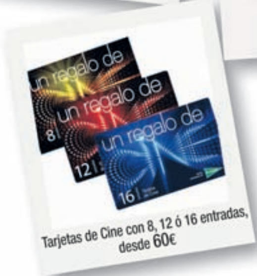
Tarjetas de Cine con 8, 12 ó 16 entradas, desde 60€