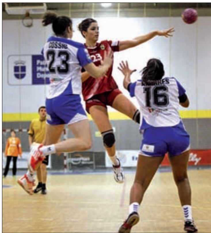
Las anfitrionas aspiran a ganar la Copa FUNDAL

Echando un vistazo a la clasificación de la División de Honor, tanto el Bera Bera como el Helvetia Alcobendas parten como dos de los conjuntos a tener en cuenta, aunque su camino hacia la final no será ni mucho menos fácil. Las