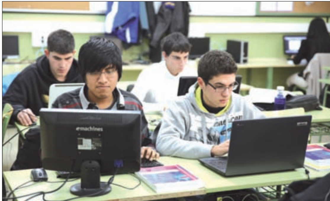
Alumnos fuenlabreños durante las clases