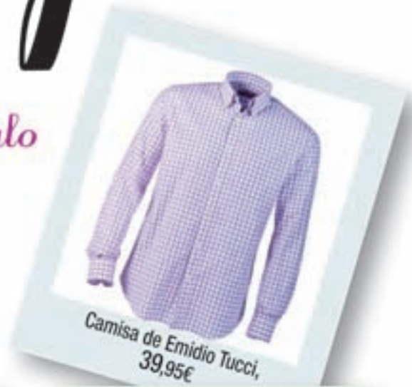
Camisa de Emidio Tucci, 39,95€