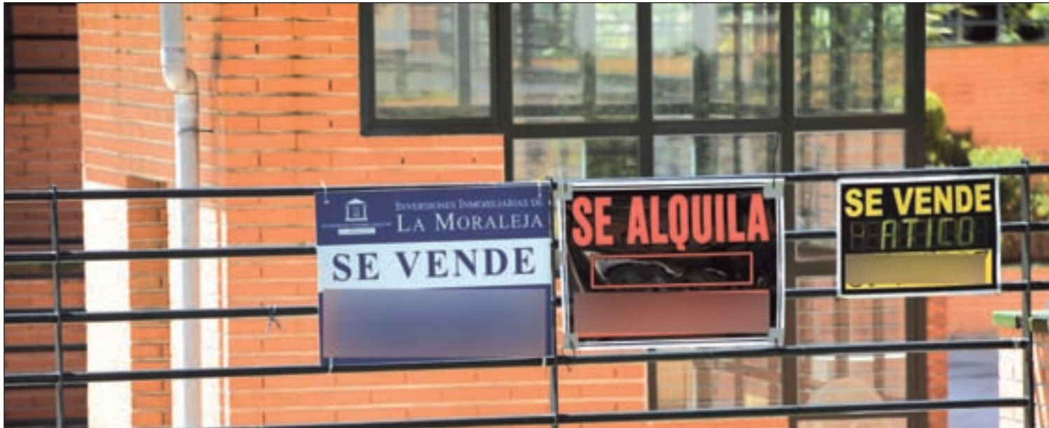
El precio de los inmuebles seguirá cayendo, pero de forma más suave GENTE