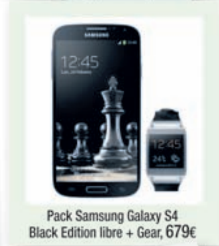
Pack Samsung Galaxy S4 Black Edition libre + Gear, 679€