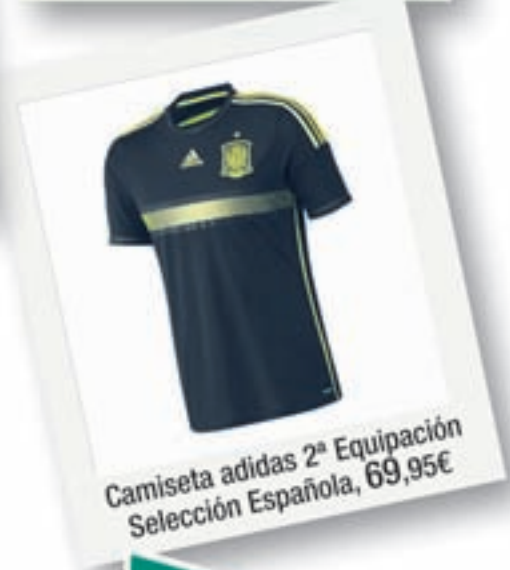
Camiseta adidas 2ª Equipación Selección Española, 69,95€