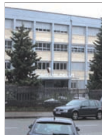
Fachada del centro