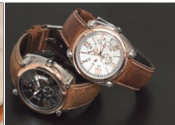
Modelo Toro Watch de la firma Grupo Ayserco