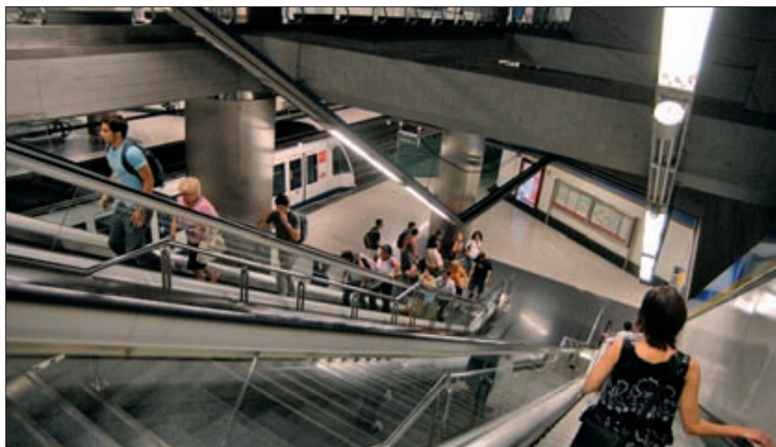
Estación de MetroSur GENTE

Cola. La concentración coincidió con una reunión del presidente del Gobierno, Mariano Rajoy, con presidentes provinciales del PP con motivo de las elecciones europeas. Las pancartas llaman al "boicot a Coca-Cola", reclamando que no se cierre la planta madrileña de Fuenlabrada.