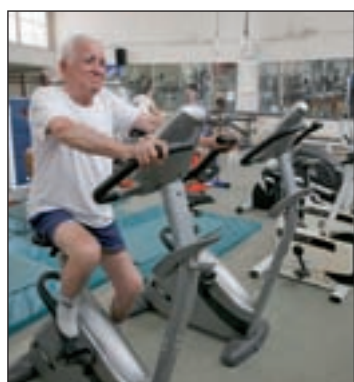
Instalación deportiva