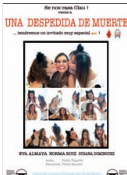
Cartel de la obra

Y una despedida de soltera distinta es la que celebran ellas estos días en 'Microteatro por di-