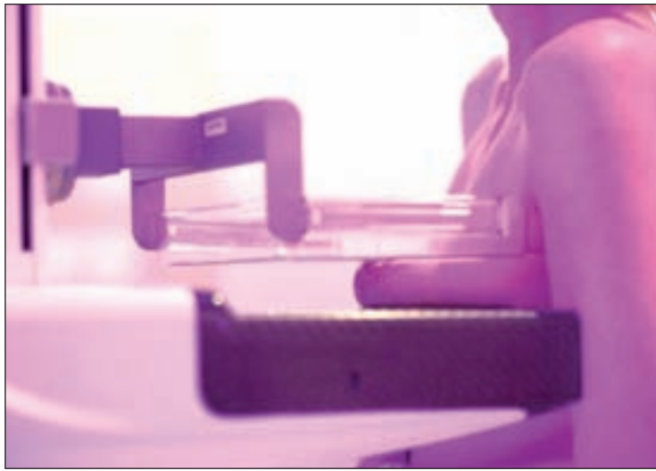
Las pruebas se realizarán con la tecnología digital