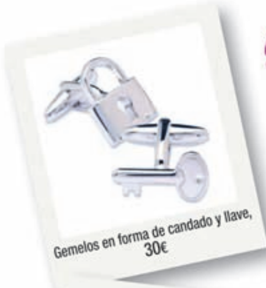
Gemelos en forma de candado y llave, 30€

Ya puedes elegir su regalo Adelántate... Encuentra mil ideas nuevas para regalarle