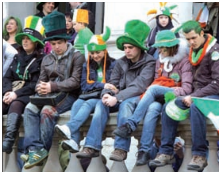
Gorros verdes y banderas para celebrar el día de San Patricio

ESTE FIN DE SEMANA Música y mucha cerveza negra