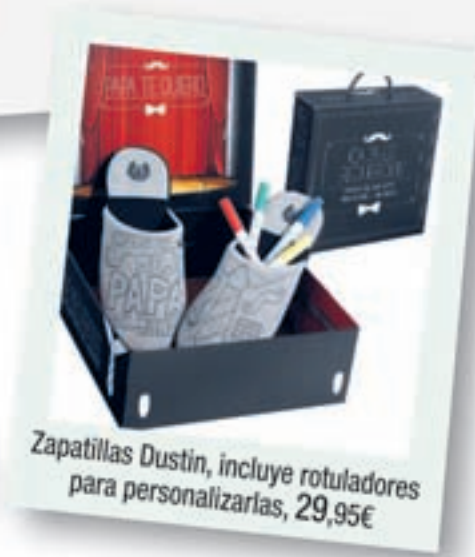
Zapatillas Dustin, incluye rotuladores para personalizarlas, 29,95€