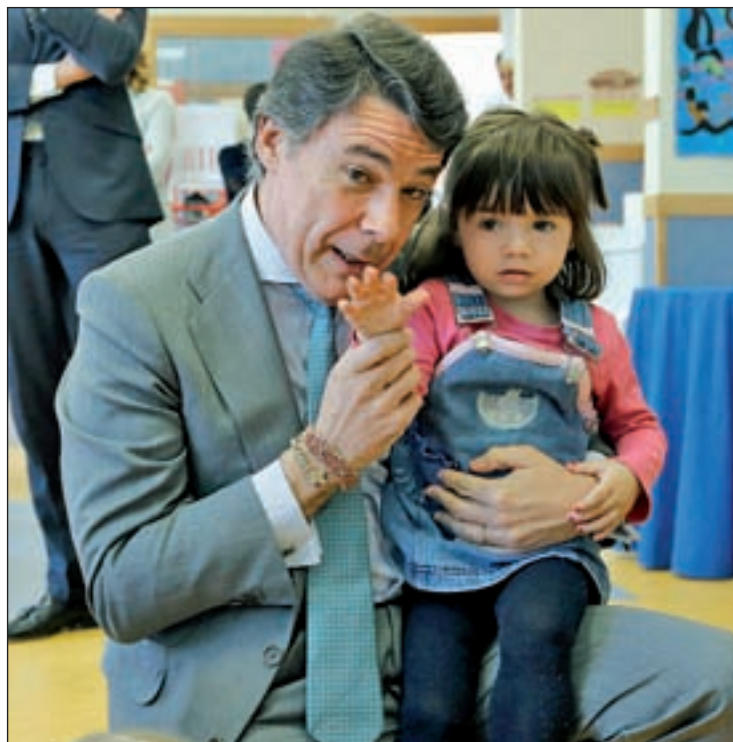
González durante su visita a la escuela de Montecarmelo

En total serán 34 millones los que destine la Administración para reforzar una etapa educativa que "no es obligatoria ni gratuita", como recordó el presidente de la Comunidad de Madrid, asegurando que esta apuesta se basa en el objetivo de "facilitar la conciliación de la vida laboral y familiar de los madrileños". El Gobier-