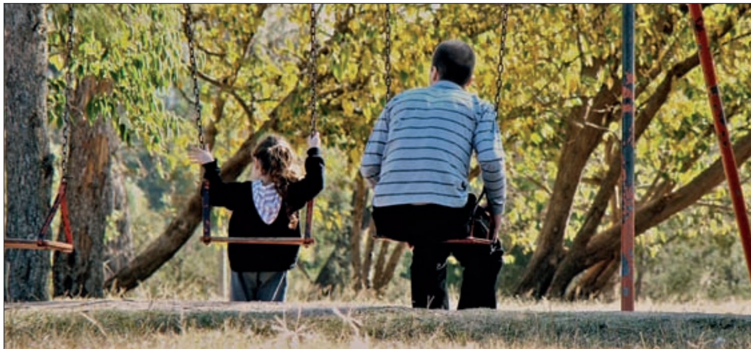
El día 19 de Marzo se celebra el Día del Padre